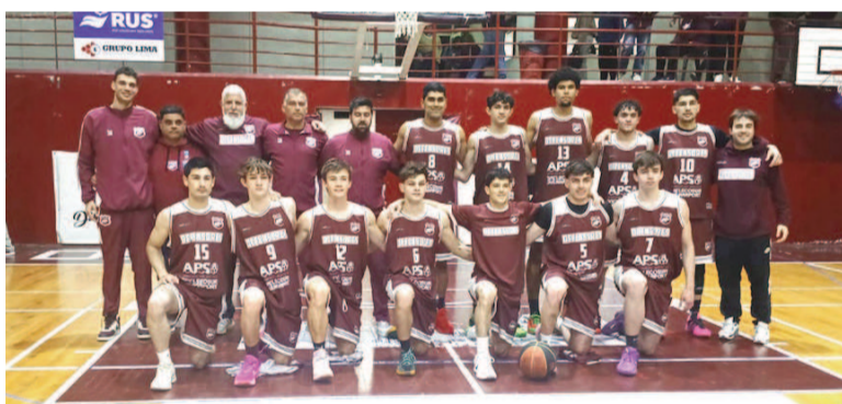
Defensores consiguió una notable victoria de local y es líder de su zona.