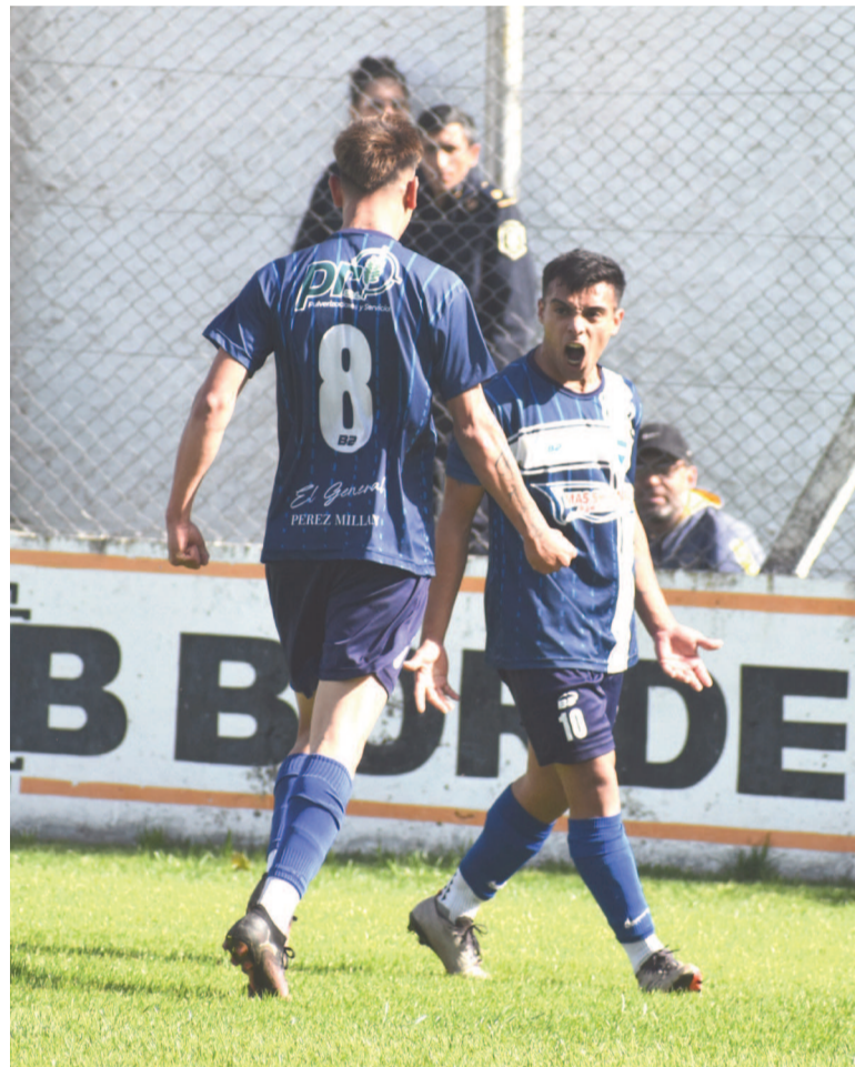
El General se desquitó del equipo de La Ribera.