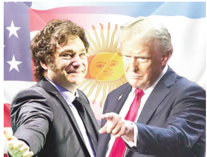
Javier Milei viaja a Estados Unidos y se reunirá con Donald Trump.

Reunión con la directora del FMI, Kristalina Georgieva.