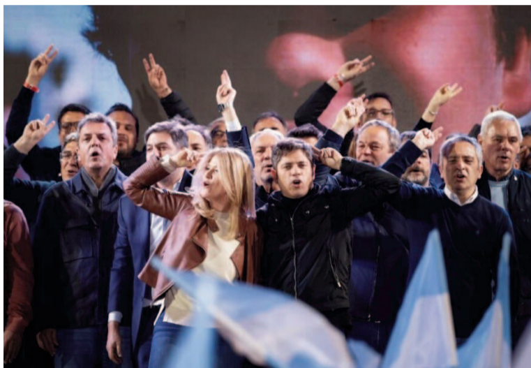
Axel Kicillof tras el triunfo del 7 de septiembre. Este lunes encabezará un nuevo acto en La Plata en el marco de la campaña electoral.