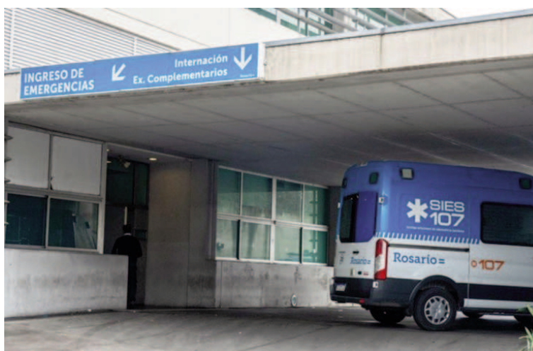
El ingreso a la guardia del HECA.

Al momento de ingresar al HECA se le realizaron maniobras de RCP y, en un primer momento, logró salir del paro cardiorrespiratorio, pero su estado era crítico. En la misma madrugada, se le efectuó una segunda reanimación, aunque no pudieron evitar el desenlace fatal. En el hecho intervino la Comisaría 19ª por razones de jurisdicción.