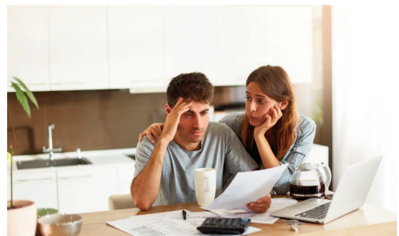
Preocupante morosidad en las familias.

● Créditos prendarios: Ascendieron de 1,92% en diciembre de 2024 a 2,75% en julio de 2025.