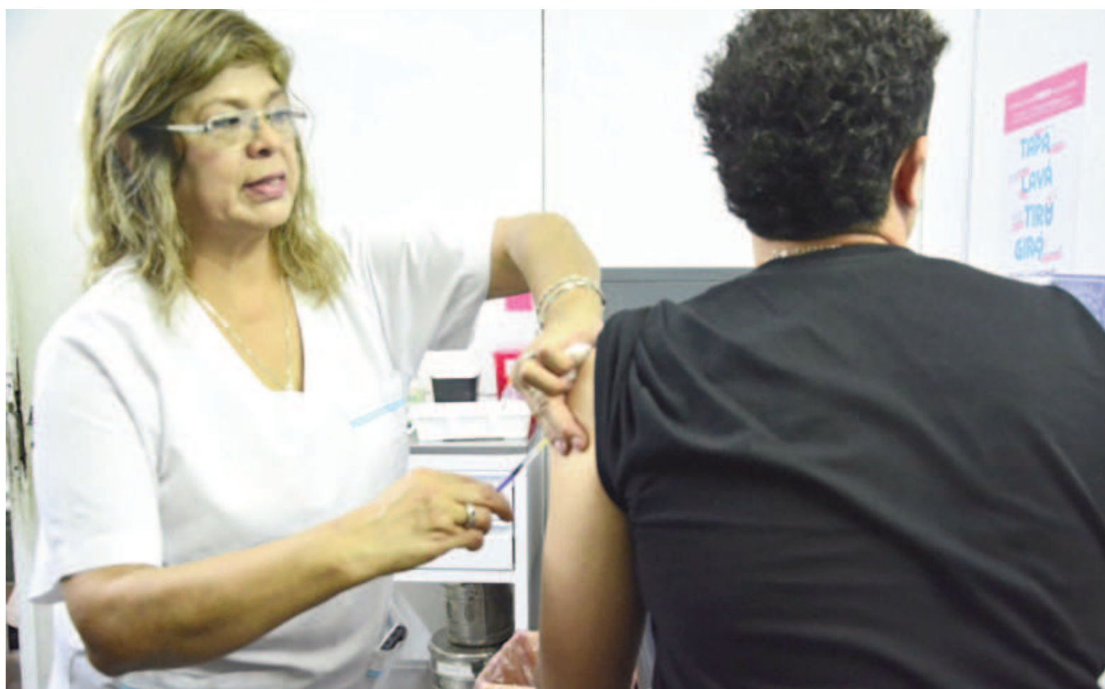
Para vacunarse, los interesados deben registrarse en la página oficial Mi Salud Digital bonaerense.

La vacuna se implementa en los hospitales y centros sanitarios de la