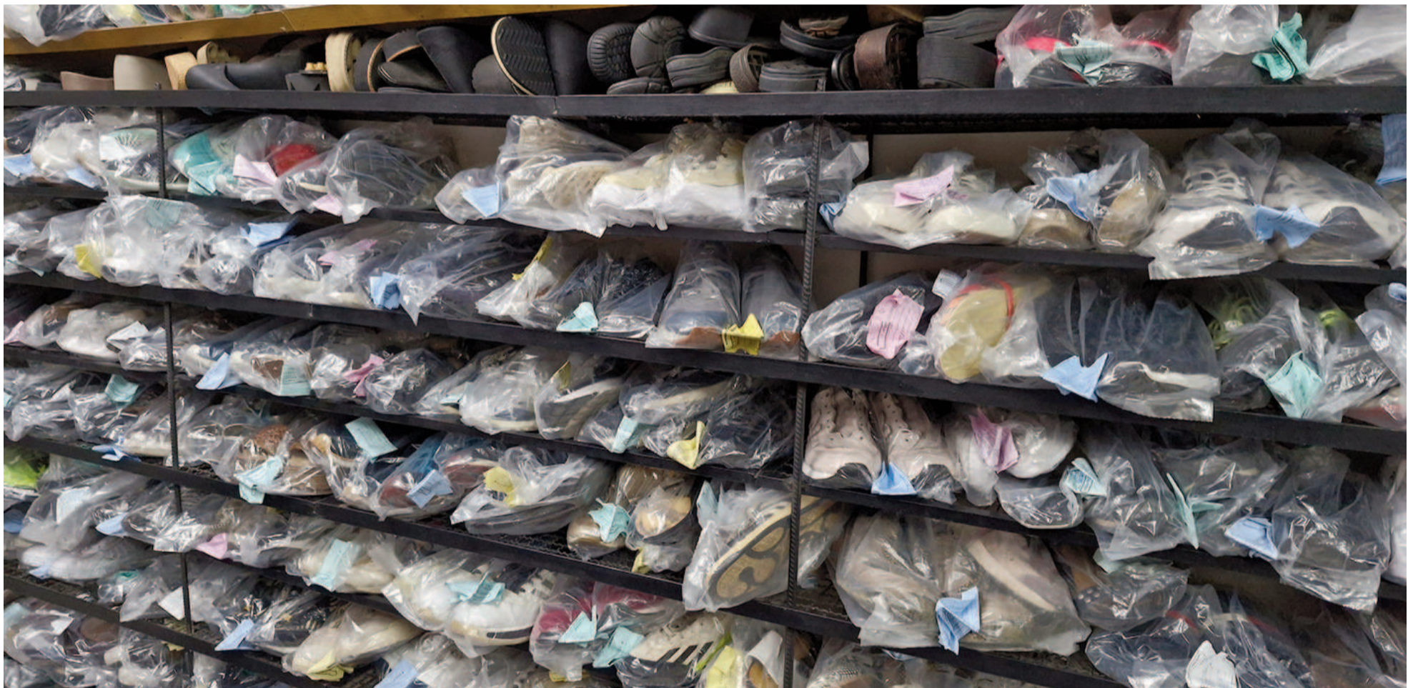
La reparación se utiliza mayormente cuando el valor del calzado es elevado, mientras que cuando es económico, se opta por comprar uno nuevo directamente. EL NORTE

El calzado siempre ha sido motivo de una difícil decisión en materia de precios. Unas zapatillas de marca –por ejemplo– rondan entre $120.000 y $150.000. Mientras que, por unos $60.000, se puede conseguir algo de menor calidad o lo que se conoce como ‘réplica’. Las alternativas online se presentan con infinidad de ofertas que seducen a los compradores. Las reparaciones, en promedio, cuestan $20.000.