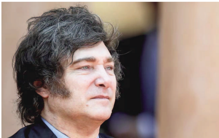
Javier Milei visitará 12 provincias en el último mes de campaña electoral.

Tras su viaje, el Presidente prepara actos en 12 provincias para el último mes de campaña electoral