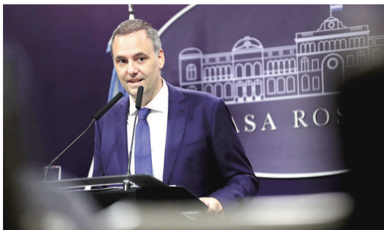
Manuel Adorni cargó contra la expresidenta.

El Gobierno salió al cruce de la expresidenta Cristina Kirchner por sus duras críticas tras la suba del dólar: «La oposición deseándole el mal al país». La exmandataria les hizo duras críticas a las intervenciones para tratar de contener el alza de la divisa, al plantear en X: «¡Che Milei! ¡Que olor a default!... Te fumaste más de mil millones de dólares en apenas dos días... 'economista experto en crecimiento con o sin dinero'».