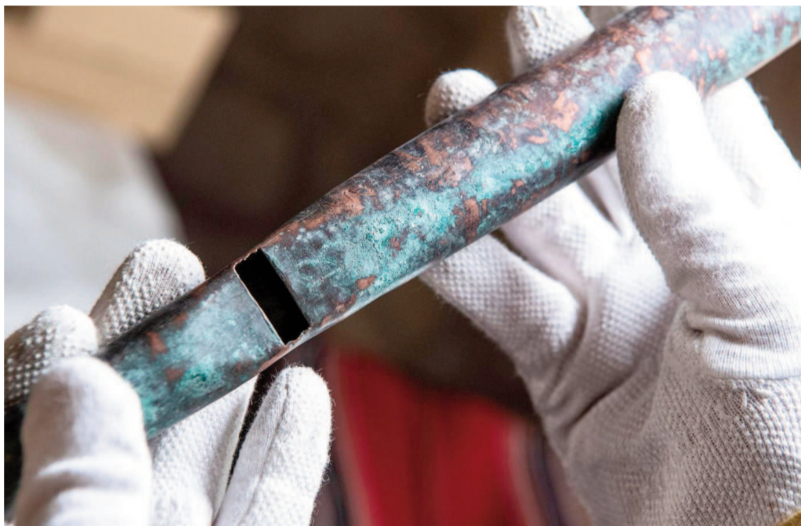
Ocho de los tubos originales conservaban su sonoridad intacta.

Según explicó, el hallazgo fue casi accidental: durante las pruebas con réplicas fabricadas en los Países Bajos por el organero Winold van der Puten, decidieron insertar algunos de los tubos medievales en la caja de órgano portátil utili-