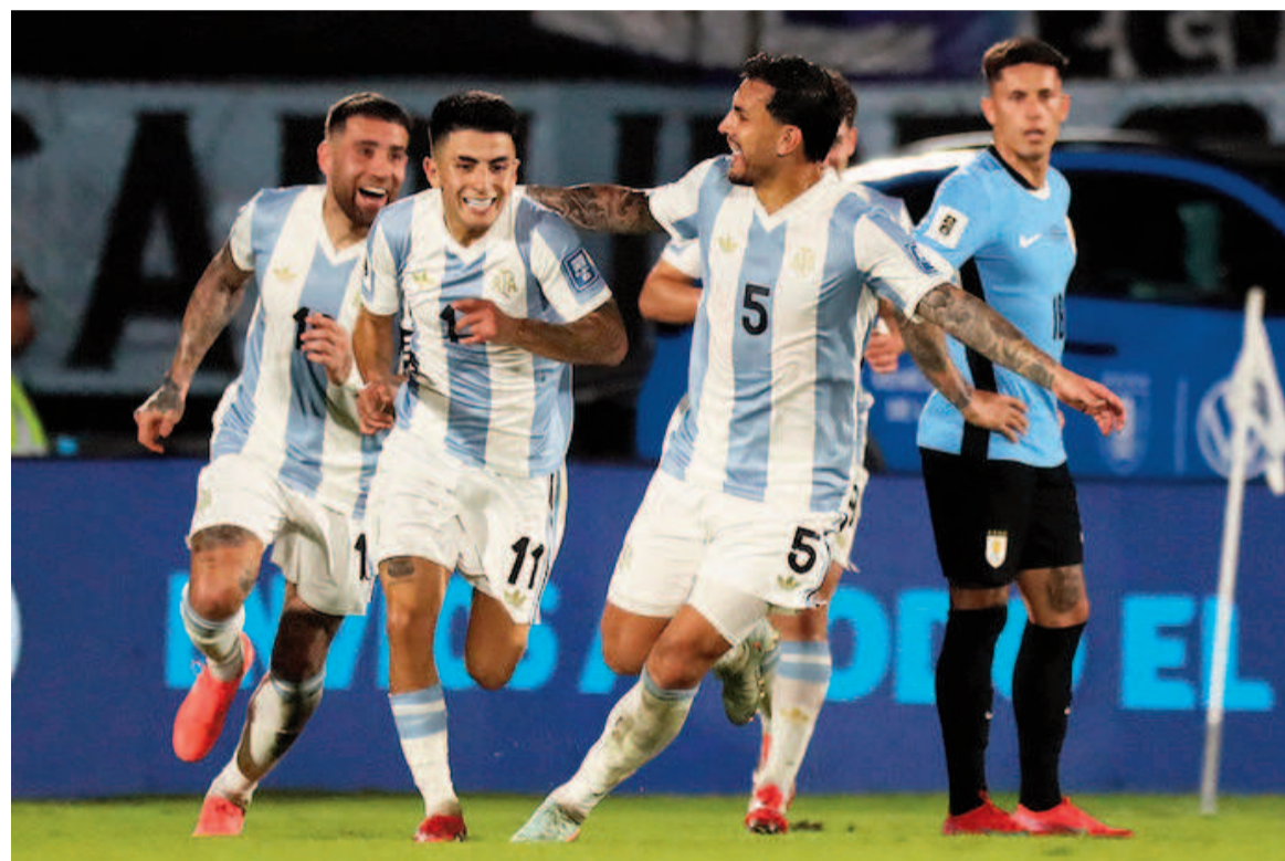
La escuadra albiceleste quiere despedirse de su público con una victoria.

La Selección que dirige Scaloni, ya clasificada, se medirá ante la Vinotinto en el Monumental hoy desde las 20.30 por la penúltima fecha. El conjunto que conduce Fernando Batista sueña con clasificar para el Mundial.