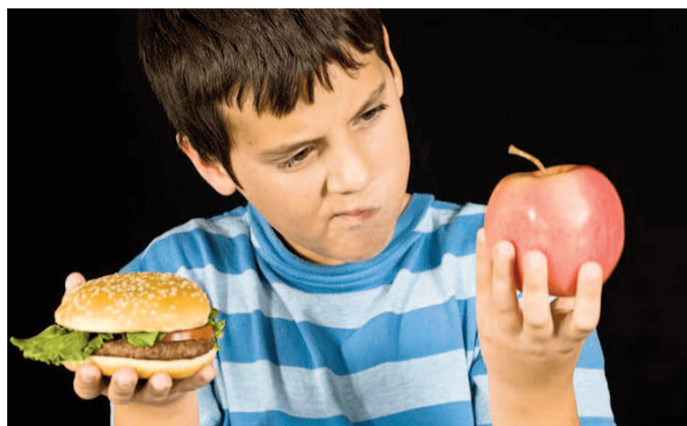
El informe destaca que el 35,5% de los niños y adolescentes presentaron inseguridad alimentaria en 2024.