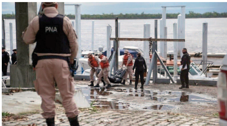
La zona del amarre donde llegó la patrulla de Prefectura con el cuerpo.

Saldutti pidió "esperar estudios complementarios", pero en principio ese golpe detectado en la cabeza "sería el causante de la muerte y, por lo tanto, la investigación pasó