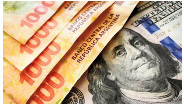
El Gobierno anunció la intervención en el mercado de cambios.