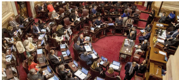
Los senadores hoy vuelven a sus bancas.