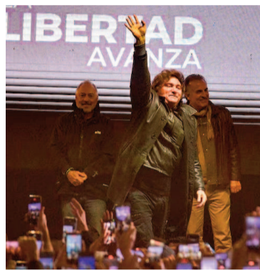
Javier Milei cerró la campaña de LLA.

Más adelante retomó sus críticas al gobernador: “El ‘soviético’ sabe que tiene que desmoralizar a los bo-