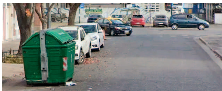
El cadáver fue encontrado en Ocampo al 1900.

en el límite del barrio Abasto se topó con los restos del fallecido y alertó a los vecinos, que sin pensarlo llamaron al 911. Según el relato del hombre, el cuerpo tenía signos de