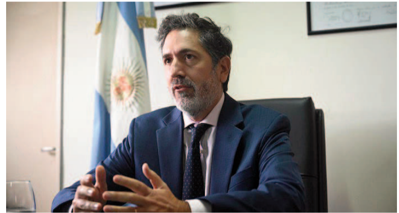
El juez federal Sebastián Casanello.

Concretamente, el Ejecutivo señaló, en datos a los que tuvo acceso El Destape, que por un medicamento para un tipo de leucemia comprado a Suizo Argentina, denominado PEG Asparaginasa, la ANDIS pagó un 27% más que lo que el mismo Ministerio de Salud pagó por ese mismo remedio. El dato surge de comparar el precio que pagaron por este medicamento la ANDIS y el Ministerio de Salud. En agosto de 2024, Salud lo compró a 8.274.027 pesos de ese momento, mientras que en agosto de 2025 la ANDIS, a través de la plataforma INCLUIR, lo adquirió a 13.500.176 pesos corrientes. El cálculo del sobrepago del 27% surge de restar la inflación acumulada en el período de julio de 2024 a julio de 2025.