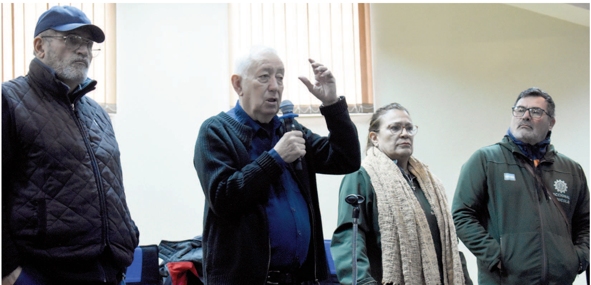
La dirigencia de UOM San Nicolás iniciará ahora una ronda de negociación en busca de la reincorporación de los operarios despedidos.