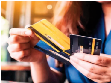
Crece la morosidad bancaria.

La retracción del consumo es palpable. Según el Informe del IAE, el flujo de crédito en consumo masivo se ha deteriorado, con adiciones re-