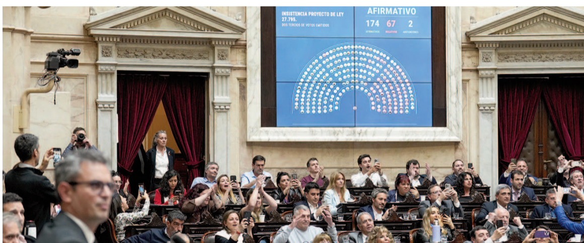
Con 174 votos afirmativos, 67 negativos y 2 abstenciones, queda aprobada la Ley de Financiamiento de la Educación Universitaria y Recomposición del Salario Docente.