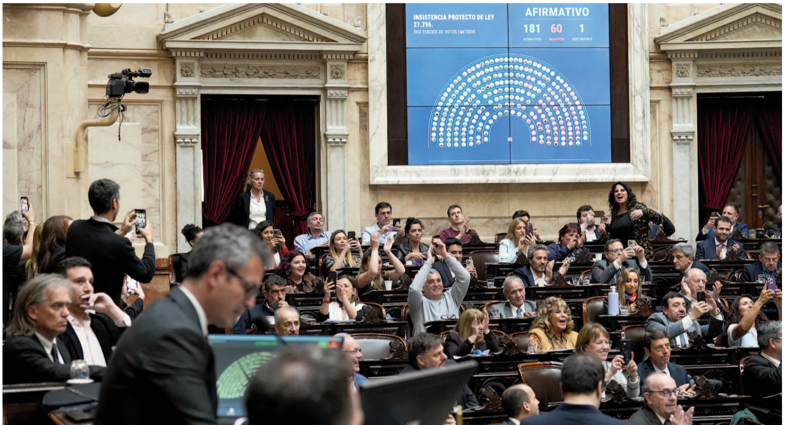
Con 181 votos afirmativos, 60 negativos y 1 abstención, queda aprobada la Ley de Emergencia Sanitaria de la Salud Pediátrica y de las Residencias Nacionales en Salud.

Desde el mediodía, una multitud acompañó la sesión especial de la Cámara baja, que congregó a organizaciones estudiantiles, docentes universitarios, médicos, sindicatos, partidos políticos, diputados y gente de a pie que se sumó a la movilización contra el ajuste y la motosierra del pre-