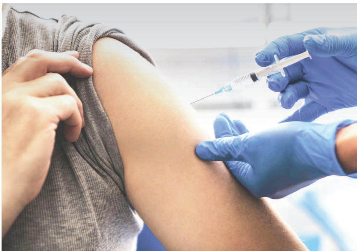
Para recibir la vacuna contra el dengue, la persona deberá registrarse en Mi Salud Digital y acudir al vacunatorio con el mail del turno otorgado y el DNI del interesado.

“Para acceder, se tienen que registrar en la página Mi Salud Digital del ministerio de la provincia de Buenos Aires. Cuando les llega el mail con la confirmación de que ya está registrado y que tendrá disponible su vacuna, podrán acudir a los vacunatorios asignados, presentando el mail de confirmación del turno que le envió el ministerio y el DNI, lo que habilita al centro de salud a aplicar la dosis correspondiente”, explicaron a EL NORTE referentes del vacunatorio del Hospital San Felipe, que atiende de 7:00 a 15:30, de lunes a viernes.