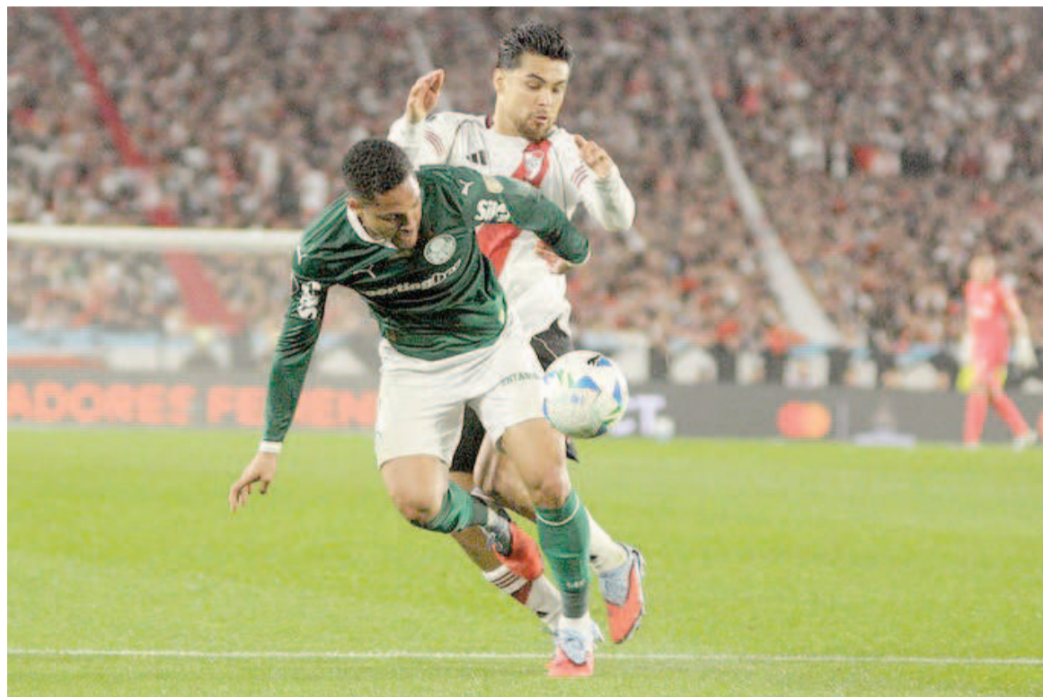
El Verdão rescató una victoria y definirá en San Pablo.

El equipo brasileño se impuso por 2 a 1 en el Monumental en el partido de ida por cuartos de final. Gustavo Gómez y Vitor Roque anotaron para el visitante en el primer tiempo; descontó Martínez Quarta cerca del final.