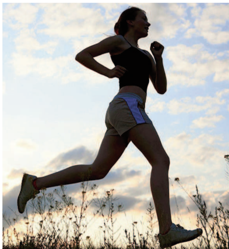
La investigación revela que la actividad física equilibrada potencia la memoria y la neurogénesis en el cerebro.

"Esto demuestra de forma causal que los efectos cognitivos de la actividad física pueden ser mediados, en gran parte, por la microbiota