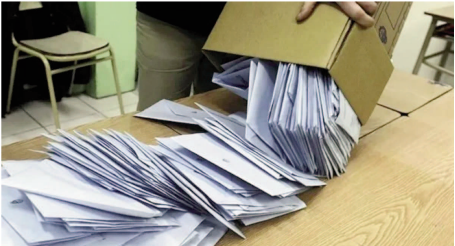
El conteo final no trajo ninguna novedad provincial.