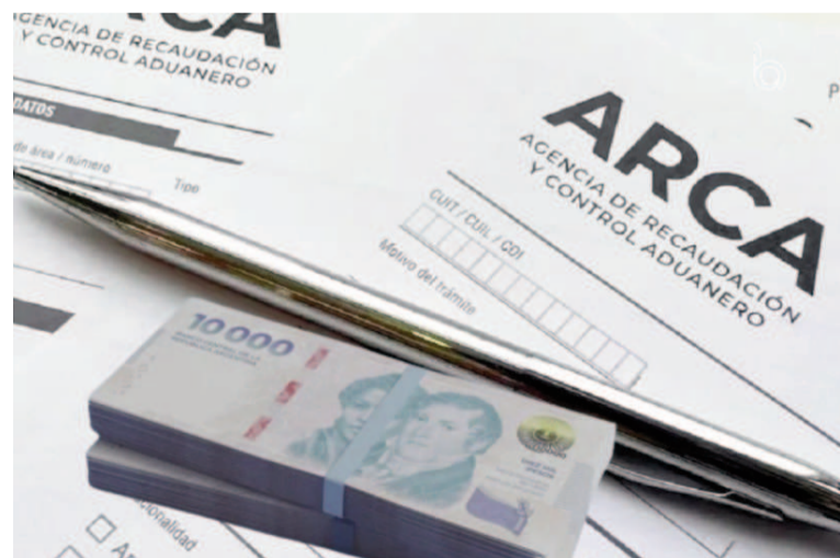
Al Gobierno le preocupa la baja en la recaudación.

Mientras que en la Casa Rosada le atribuyen la iniciativa de los cambios al ministro de Desregulación y Transformación del Estado, Federico Sturzenegger, en su entorno sostienen que está abocado en primera instancia a desregulaciones sobre el