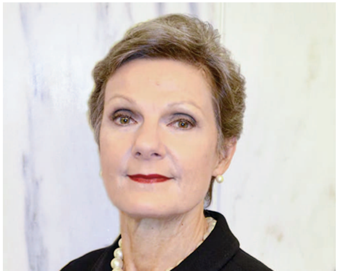
La jueza Loretta Preska falló contra la Argentina por la expropiación de YPF.

Sin embargo, la magistrada ratificó a mediados de septiembre esa directiva y emplazó a cumplirla