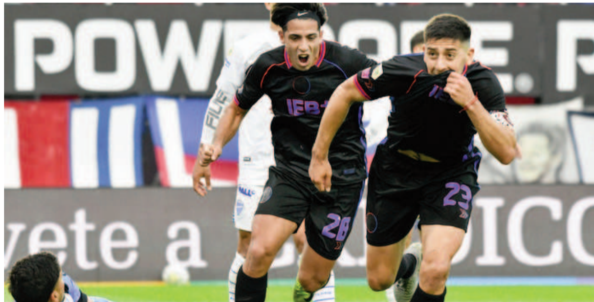
El Ciclón fue superior al Tomba y sumó tres puntos para escalar en la tabla.