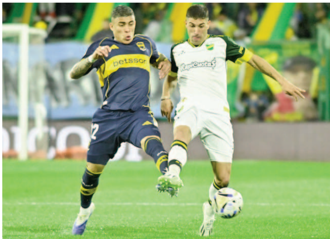
El Halcón se hizo fuerte en casa y sumó un valioso triunfo. WEB

El equipo de Florencio Varela se impuso por 2 a 1 como local y se metió en zona de clasificación. El nicoleño Abiel Osorio marcó un doblete, uno de penal, y Paredes anotó el empate transitorio para el Xeneize.