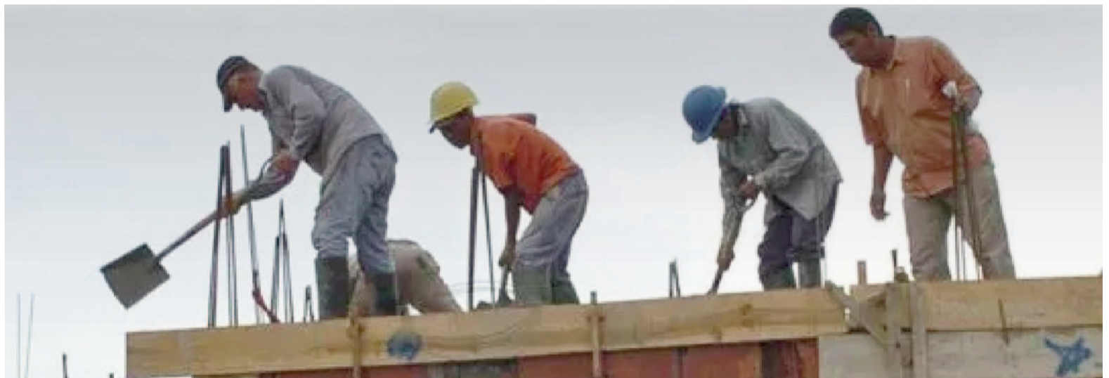
El 40% de los ocupados informales percibe un salario mensual por debajo de la canasta básica individual.