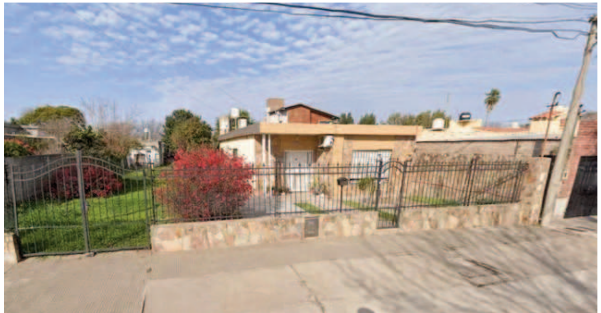
Una jubilada fue hallada sin vida en J. V. González al 200 en Capitán Bermúdez.

El cuerpo de la víctima fue encontrado este sábado al mediodía en una vivienda de calle J. V. González al 200. Está en curso la investigación sobre la mecánica del crimen y los presuntos autores.