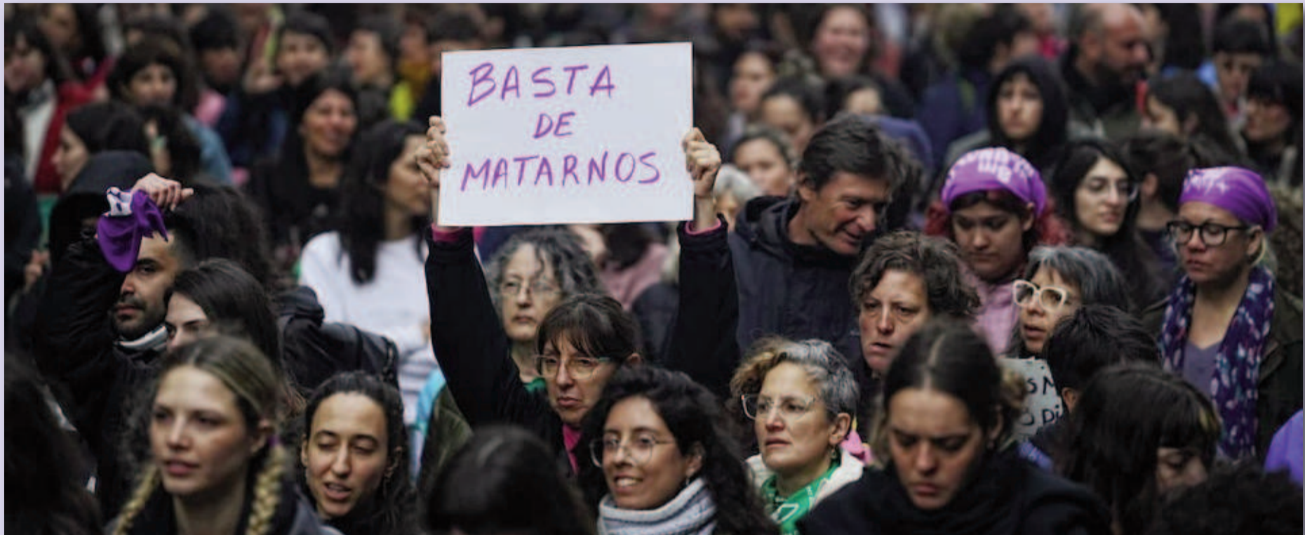
El colectivo 'Ni Una Menos' impulsó la movilización masiva de ayer a la tarde de Plaza de Mayo al Congreso, el punto neurálgico donde nació el movimiento en 2015.