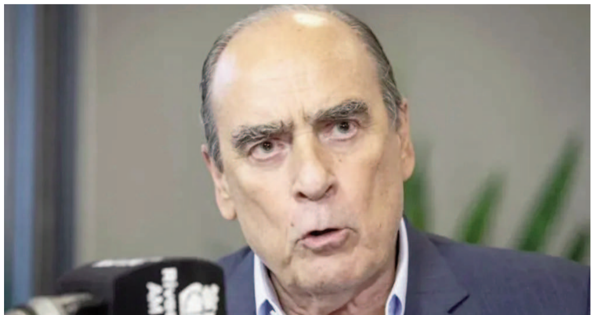
El jefe de Gabinete Guillermo Francos.

“Ellos tienen una relación y esa puerta nunca se cerró, siempre va a estar abierta, porque se tienen un afecto y respeto mutuo”. Por último, dio detalles sobre la reunión del Consejo de