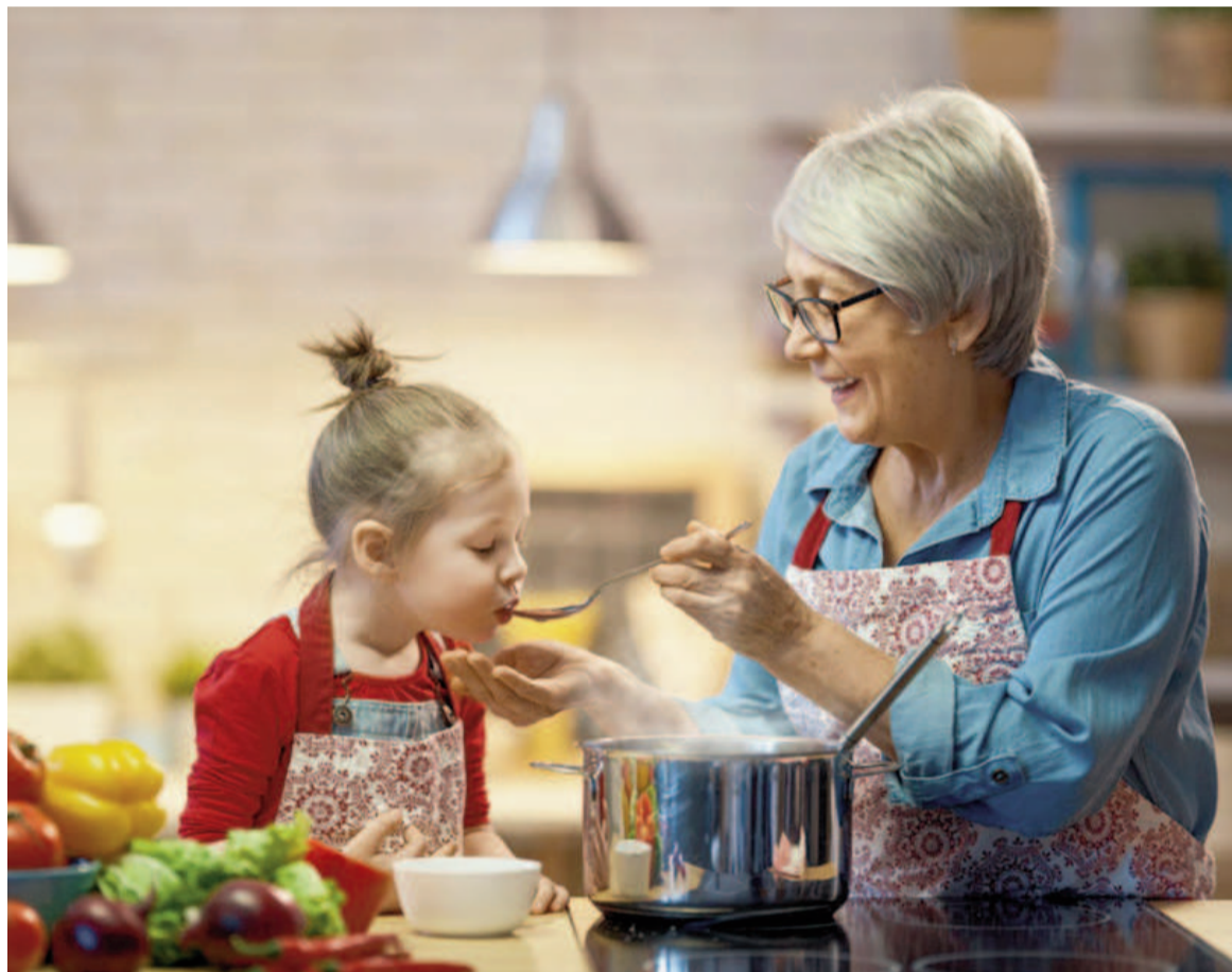
El lema elegido para este año es “Sabores con historia” con el propósito de recuperar preparaciones tradicionales, familiares o significativas vinculadas a la identidad alimentaria de cada comunidad. ILUSTRACIÓN

Cabe recordar que el año pasado, en el marco de la 3ra. edición