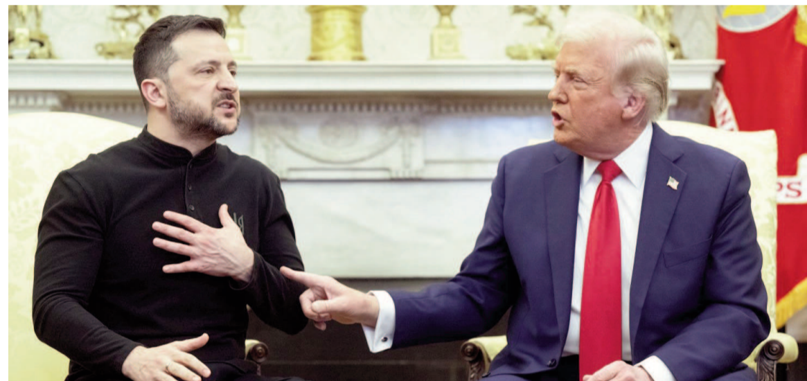
El presidente Volodimir Zelenski y su homólogo Donald Trump se encontraron tiempo atrás.

Discutirán, dijo Zelenski, "todos los detalles relativos al fin de la matanza y la guerra". Será su primera visita a Estados Unidos desde que Trump lo reprendió públicamente por ser "irrespetuoso", durante un encuentro en la Oficina Oval, el 28 de febrero. Desde Alemania no descartan una reunión entre todas las partes involucradas.