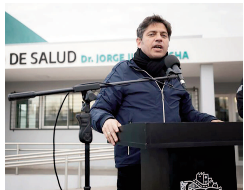
Gobernador Axel Kicillof.

Y, por último, Kicillof subrayó: "Estoy convencido de que los bonaerenses no van a permitir que Milei siga ajustando a la educación, a la ciencia y a los jubilados". "El 7 de septiembre hay que ponerle un freno en las urnas: la boleta de Fuerza Patria es la herramienta indicada para eso y también para defender todas las transformaciones que estamos llevando adelante en la Provincia", concluyó.