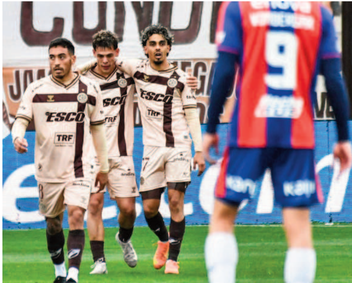
El Calamar festejó su primer triunfo en el certamen.