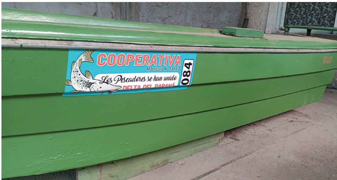
La Cooperativa de Pescadores Ramallo reclama registros.

La Cooperativa de Pescadores Ramallo informó que, con carácter urgente, solicita a todos los pescadores o embarcaciones que utilicen el logo de la institución —ya sea de San Nicolás, San Pedro o Ramallo— que se comuniquen para registrarse.