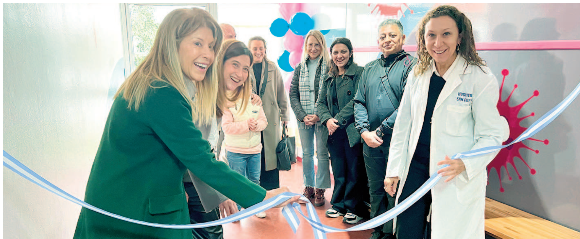
Directivos del Hospital San Felipe junto a referentes de la cooperativa inauguraron la remodelación de la Guardia Pediátrica.

También fueron remodeladas la sala de espera de la Unidad de Terapia Intensiva (UTI) Pediátrica y UTI Adultos. El proyecto demandó una inversión aproximada de cuarenta millones de pesos, destinados a mejoras integrales para optimizar la calidad de atención y el confort de pacientes y familias.