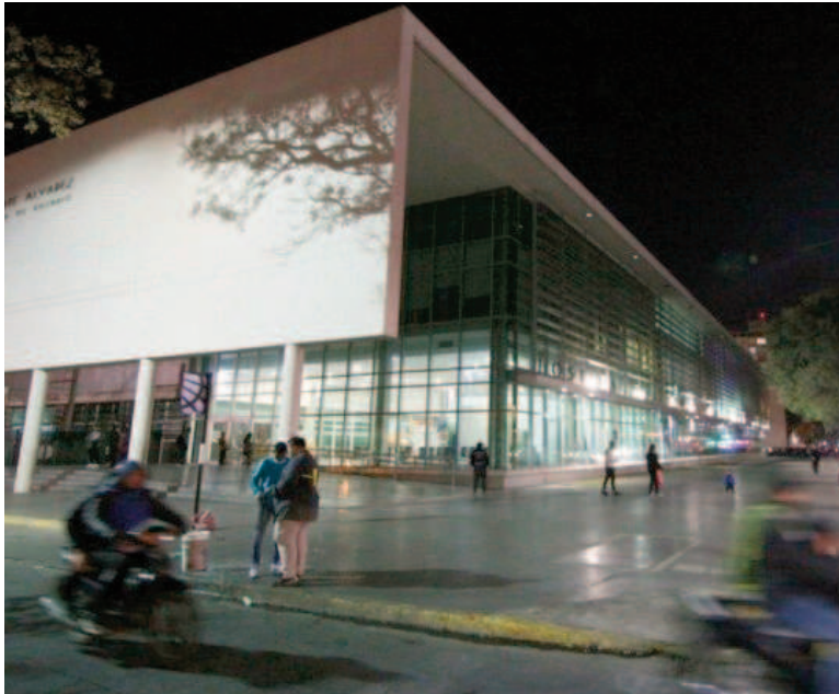
Una de las víctimas fue asistida en el HECA.

En Ocampo y Valparaíso, un joven sufrió el robo de su bicicleta y recibió un tiro en una pierna. También hubo heridos en Santa Lucía y en la vecina localidad.