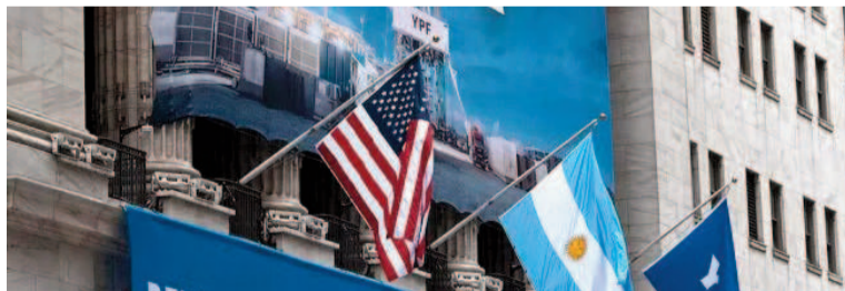
Nuevo respiro en la causa YPF.

Una apelación es contra la sentencia a favor de los ganadores y otra por la exigencia de entrega de