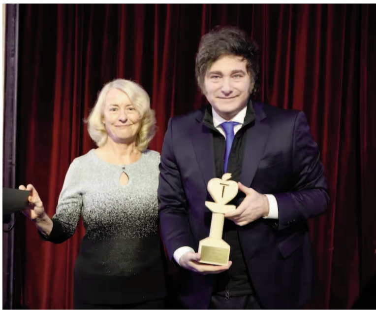
Milei fue reconocido en el marco de la Liberty International World Conference.

También volvió a atacar con dureza al periodismo, al que acusó de difundir pronósticos negativos sobre recesión e inflación y de exagerar los riesgos de su gestión: "Después de la forma en la que saludo a alguien, algún perisobre va a decir que le pedí la renuncia. Nada, son los chistes con nuestro periodismo tan sucio", sostuvo. También dijo que "hacen todo para sembrar miedo, pero la realidad demuestra que estamos