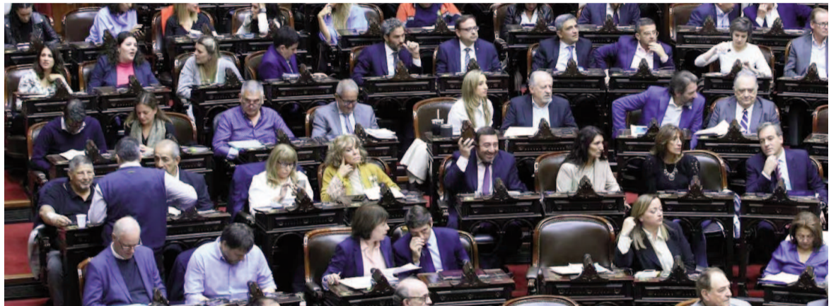
El miércoles 20 de agosto vuelven a sesionar.

En el caso de la exgobernadora bonaerense, durante la semana visitó los estudios de TN y aseguró que quiere "un país donde podamos discutir las jubilaciones de verdad y no tener que elegir entre déficit fiscal o bono de 70 mil pesos". "Podemos discutir una reforma previsional en serio. Donde yo, por ejemplo, creo que hay que eliminar los 200 regímenes de excepción jubilatoria. O cortar las 42 empresas públicas sobre las que el presidente hasta ahora no avanzó. Ahí hay plata para los jubilados, pero demos las discusiones de fondo", remarcó.