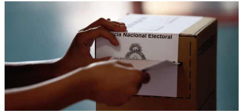
Hoy vence el plazo de cierre de listas nacionales.

En la provincia de Tucumán también quedaron definidos los candidatos que