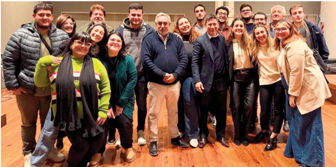
La Unión Cívica Radical (UCR) bonaerense no integrará la alianza Provincias Unidas.

Tras el vencimiento del plazo judicial, la UCR de Buenos Aires queda fuera de Provincias Unidas para las elecciones legislativas nacionales del 26 de octubre.