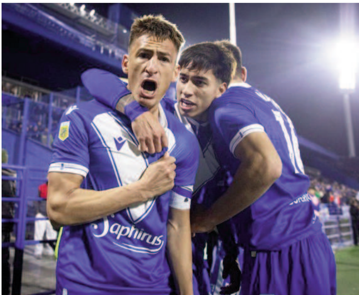
El equipo de Liniers sumó una valiosa victoria.

El equipo de Guillermo Barros Schelotto derrotó al Rojo 2 a 1 en el Estadio José Amalfitani en un partido donde hubo tres penales. El visitante terminó con diez por la expulsión de Lomónaco.