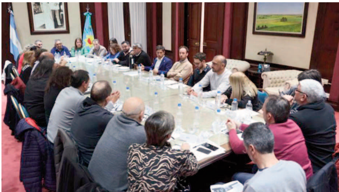
La CICOP retrasa la decisión de paritarias.

por la administración Kicillof, que alcanzaba al 3,2% de incremento salarial escalonado, había sido rechazada por los gremios, pero esta nueva oferta fue aceptada primero por la Unión del Personal Civil de la Nación (UPCN), luego por la Asociación Trabajadores del Estado (ATE) y por la Federación de Educadores Bonaerenses (FEB), con fuerte representación entre los docentes.