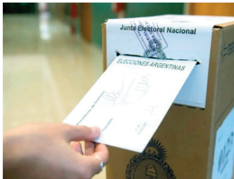
Por ahora las testimoniales siguen.

En la misma, los magistrados “coincidieron con la resuelto en la cuestión de fondo, aunque se abstuvieron de requerir la actuación