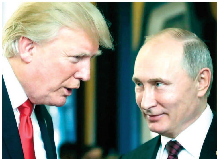
Donald Trump y Vladimir Putin.

reunión de trabajo con el enviado especial de Trump, Steve Witkoff, durante la cual abordaron cuestiones relativas a Ucrania y perspectivas para las relaciones bilaterales. El Kremlin describió las conversaciones como “muy útiles y constructivas”.