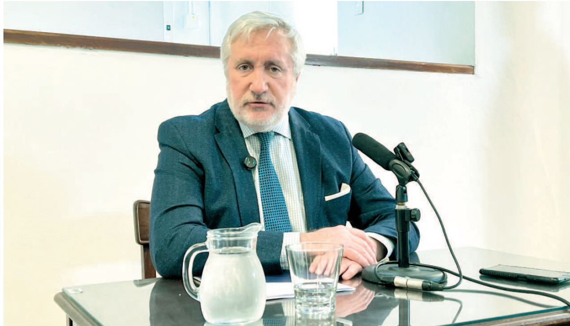
El procurador general de la Suprema Corte bonaerense, Julio Conte Grand. EL NORTE

Poco antes de disertar ante los miembros de la Justicia, mantuvo un encuentro con la prensa. En diálogo con EL NORTE, el procurador general explicó que ante los nuevos desafíos es necesario que todas las organizaciones fortalezcan sus actividades en procura de consolidar las instituciones y avanzar hacia un proceso de rehumanización de los sistemas y de los procesos. “Hoy los contenidos de las reflexiones a compartir apuntan a tratar de comprender a fondo, a seguir analizando e investigando la realidad, preocupándonos por el estado de situación de la evolución de la humanidad en los aspectos tecnológicos y su problemática”, afirmó. “Hemos caracterizado a este momento como una suerte de salida de