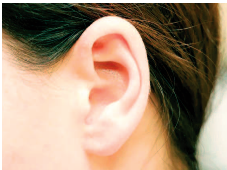
Los investigadores identificaron cuatro compuestos volátiles en el cerumen que varían según la presencia o no de párkinson.

Según los investigadores, los métodos diagnósticos convencionales, como las escalas clínicas y las imágenes neuronales, presentan limitaciones: "Las pruebas actuales, como las escalas de calificación clínica y las imágenes neuronales, pueden ser subjetivas y costosas", señalaron. Por ello, la búsqueda de alternativas más accesibles y objetivas ha cobrado relevancia en la comunidad científica.