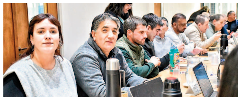
Los gremios estatales vuelven a paritarias.

Según había informado la delegación provincial de UPCN, los trabajadores estatales de la Ley 10.430 pretenden una suba del salario en agosto tomando como base del cálculo los haberes de agosto. La idea de la gestión de Axel Kicillof era tomar esa misma referencia, pero aplicar un incremento en dos cuotas a pagar en septiembre y octubre con reapertura de las negociaciones en noviembre. Ahora, ATE confirmó que fue convocado para la nueva reunión