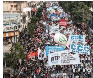
Los gremios volvieron a marchar por trabajo.

"El ajuste económico no debe basarse en la destrucción del empleo