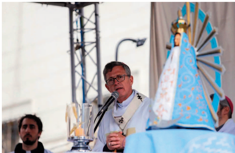
Jorge Ignacio García Cuerva, arzobispo de Buenos Aires.

A través de un crudo mensaje de carácter político, el arzobispo de Buenos Aires, Jorge García Cuerva, dirigió su homilía hacia el Gobierno, en pleno debate público por los vetos del presidente Javier Milei a las leyes de aumentos para los jubilados y la declaración de la emergencia en discapacidad.