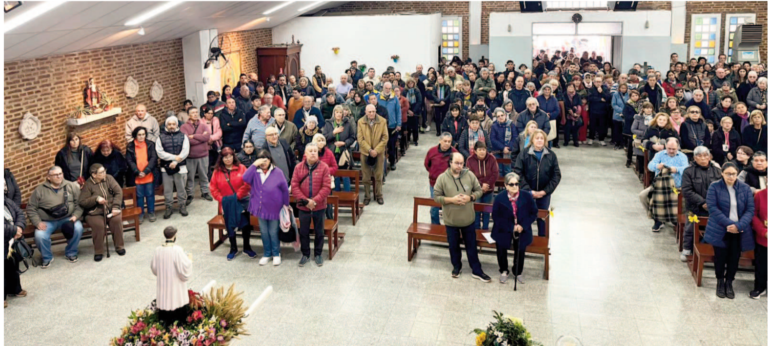
El momento más convocante fue a las 15:00, con la tradicional procesión por las calles aledañas y misa central. EL NORTE

Entre estampitas, espigas y panes bendecidos, la gente se convocó allí