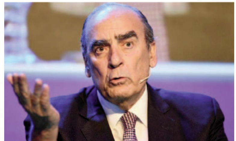
El jefe de Gabinete habló luego de que Javier Milei rompiera el silencio en torno al escándalo de los audios que hablan de coimas en discapacidad.