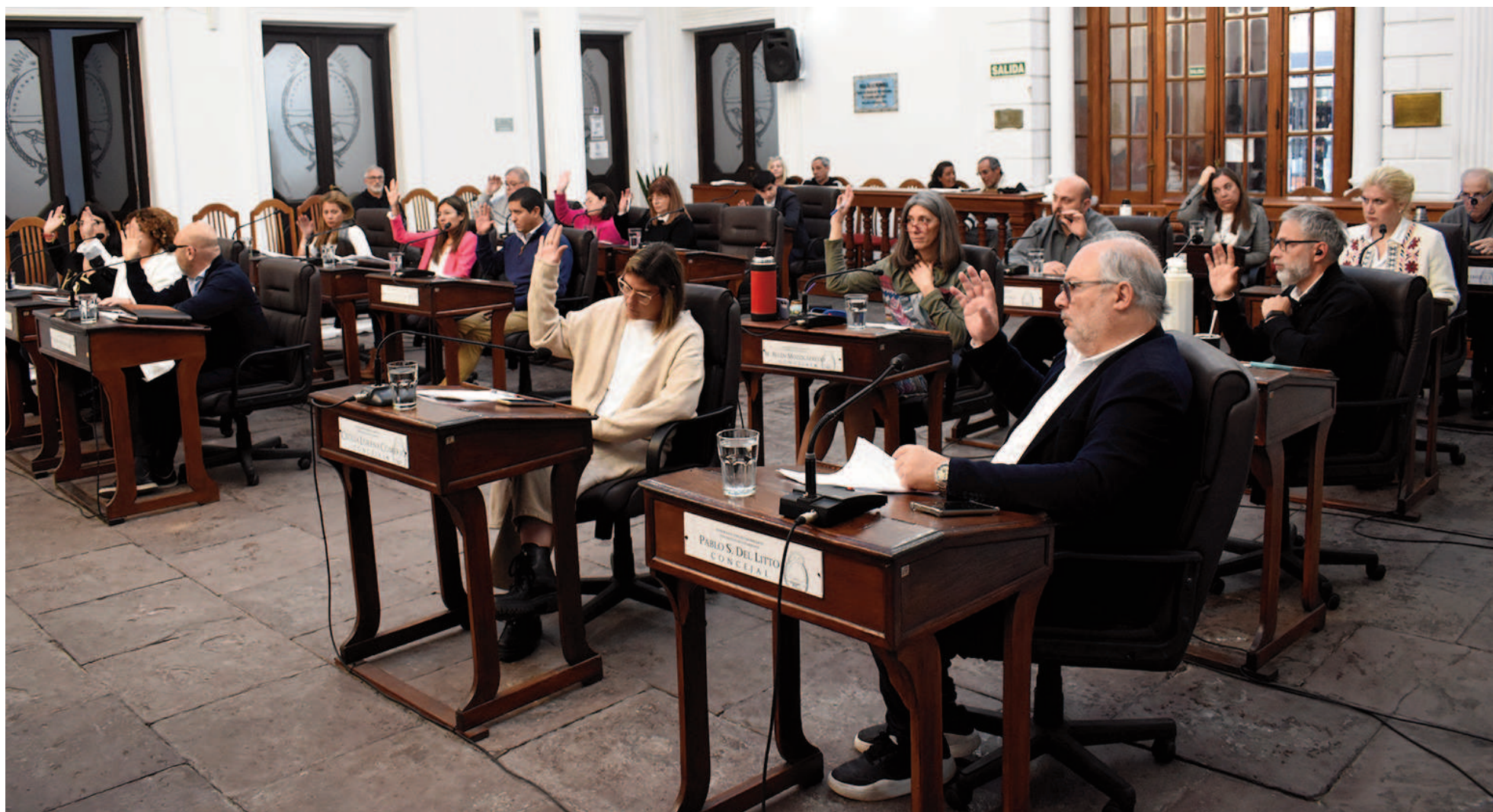
Este jueves el Concejo Deliberante de San Nicolás celebró una nueva sesión ordinaria, la segunda de agosto.