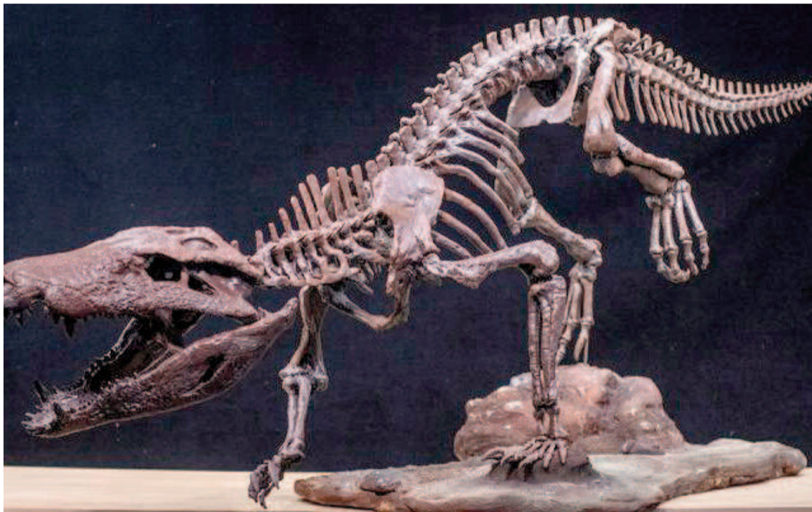
Esqueleto de Kostensuchus . IMAGEN: JOSÉ BRUSCO

Tal como explican los científicos en la publicación de ayer del mismo Consejo Nacional de Investigaciones Científicas y Técnicas, sus hábitos eran depredadores y pertenece a una familia extinguida de cocodrilos (los peirosaurios), los cuales evolucionaron en América del Sur y África durante el Período Cretácico. A diferencia de los cocodrilos vivientes, la cabeza del Kostensuchus era proporcionalmente alta, con los ojos orientados hacia fuera y las fosas nasales proyectadas hacia adelante, indicando que no tenía los hábitos acuáticos de sus parientes vivientes (de cráneos achatados, con ojos y fosas nasales proyectados hacia arriba). “Esta nueva especie se distingue de todas las especies conocidas previamente por características como el gran tamaño de sus dientes y cráneo, la robustez de su mandíbula y el gran tamaño de las cavidades donde se alojaban los músculos respon-