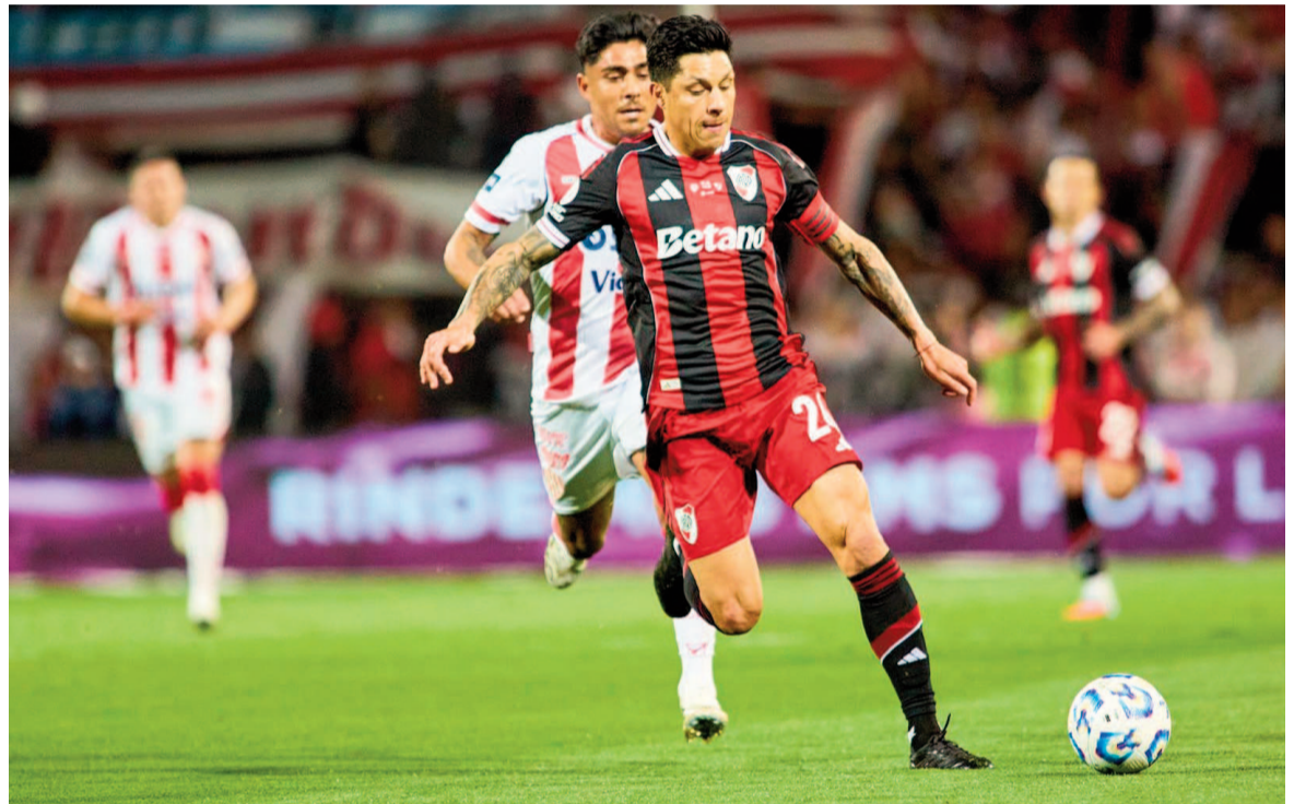
El Millonario sufrió para vencer al Tatengue.

El equipo de Marcelo Gallardo superó a Unión por 4 a 3 en definición desde los doce pasos en Mendoza, siendo figura Armani al atajar dos disparos.