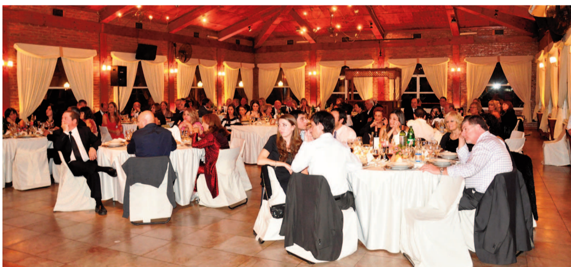
Como todos los años, la cena por el Día del Abogado reunirá a los letrados de nuestra departamental, en un marco de compañerismo y fraternidad.