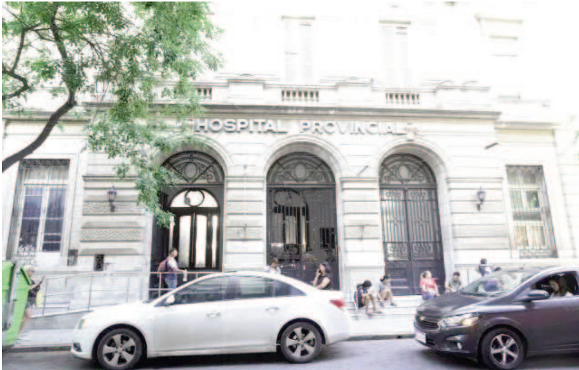
El muchacho lesionado tras la pelea fue atendido en el Hospital Provincial.

El joven de 28 años resultó herido después de una discusión. La hija del sospechoso lo acusó ante la policía.