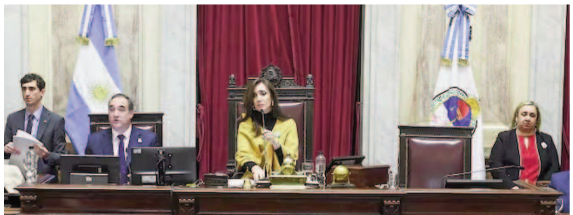
Victoria Villarruel presidió la sesión.

El texto sostenía que la estructura de no se ajustaba "a las necesidades actuales de gestión", lo que se reflejaba en "altos costos operativos" y falta de agilidad, y mencionaba una "desproporción" entre el personal adminis-