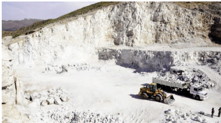
El sector minero concentra la mayor cantidad de proyectos propuestos.

Los siete proyectos aprobados actualmente, que representan una inversión total de 13.067 millones de