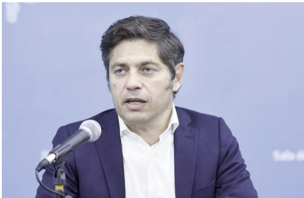
El gobernador de la provincia de Buenos Aires, Axel Kicillof.

En paralelo, la Agencia de Recaudación de la provincia de Bue-