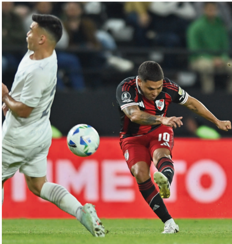
El Millonario definirá la serie de local el próximo jueves. WEB