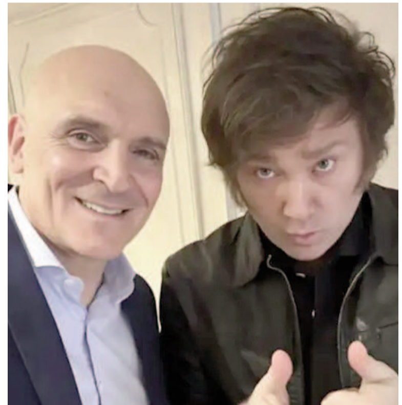
Espert y el presidente Javier Milei

Espert es del discurso de «mano dura» contra la delincuencia, uno de los ejes de la campaña en el territorio que gobierna Axel Kicillof. En los últimos días se sumó el eslogan «Kirchnerismo Nunca Más», con el uso de la frase y hasta la tipografía del libro que reunió los casos de detenidos desaparecidos en la última dictadura.