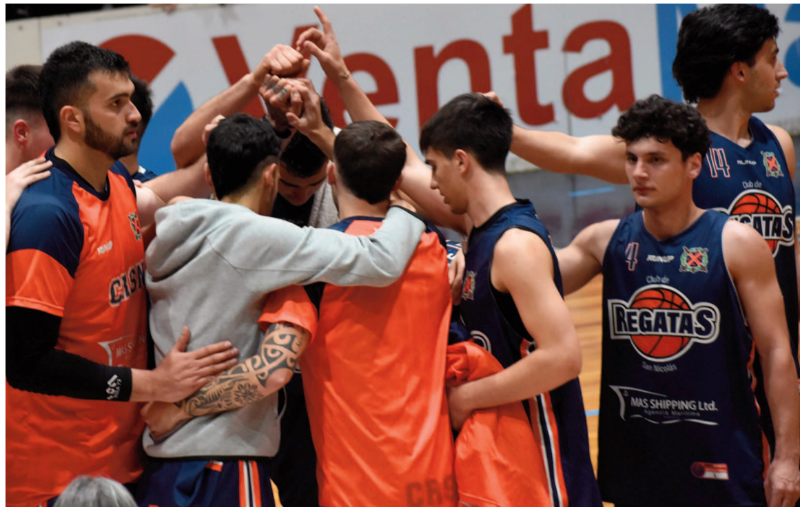
Regatas volverá a competir en el torneo del cual fue excluido diez meses atrás cuando era candidato al título, como lo será ahora.

No menos pretensiones que su clásico rival tendrá Belgrano, que después de la gran campaña que