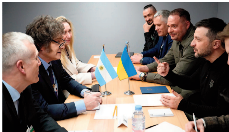
El presidente Javier Milei y Volodimir Zelenski en el Foro de Davos 2025.

“También conversamos sobre los logros económicos de Argentina, en particular la desregulación y la superación de la inflación. Felicité a Javier por estos importantes resultados. Ucrania está interesada en estudiar esta experiencia y conversamos sobre una posible oportunidad para hacerlo. En este momento, las relaciones entre nuestros países están alcanzando un nivel verdaderamente alto. Hablamos de ello en detalle. La tecnología, la economía, la industria agrícola: existen muchas áreas de cooperación potencial. También acordamos reanudar el formato de consultas políticas entre nuestros ministerios de Asuntos Exteriores. Nue-