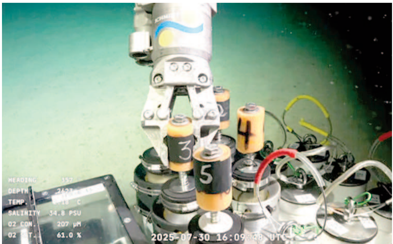
El submarino operado remotamente (ROV SuBastian), por primera vez en el Mar Argentino. CONICET

El proyecto "Viaje a lo desconocido: Descubriendo los Ecosistemas Marinos Vulnerables del Margen Continental y Planicie Abisal del Uruguay" permitirá que investigadores uruguayos y de otros países exploren el margen continental uruguayo de una forma muy similar a la que se realizó en Mar del Plata y se transmitió en vivo por streaming, utilizando el submarino operado remo-