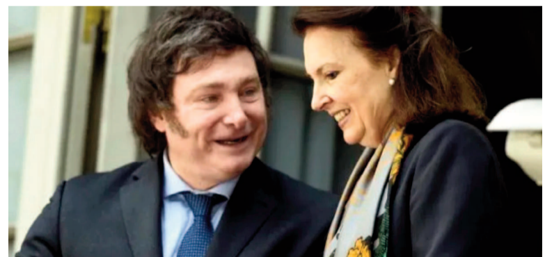
Viejos buenos tiempos entre Milei y Mondino.

Horas más tarde, Adorni retrucó: "Mondino es una persona inteligente