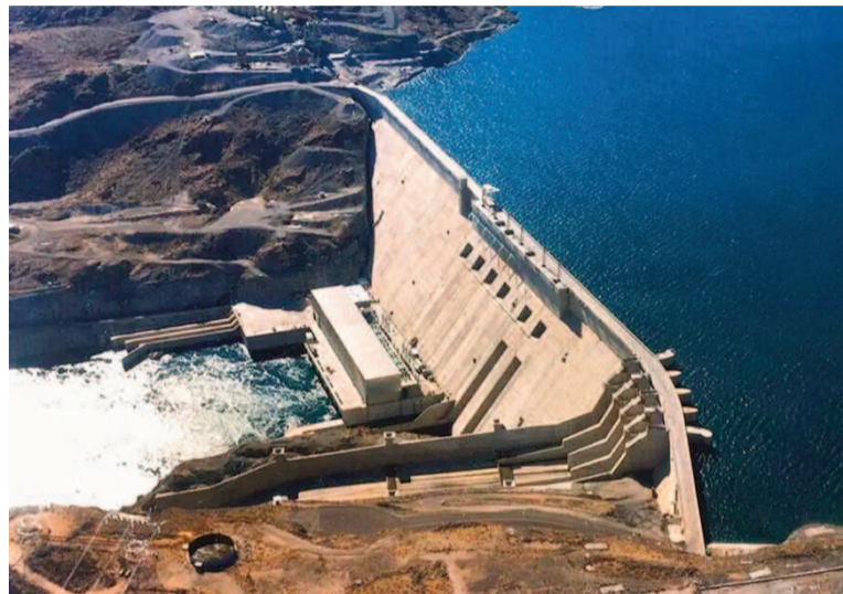
Cuatro empresas hidroeléctricas puestas a la venta.

En caso de no producirse la adhesión, las concesionarias estarán obligadas a continuar generando