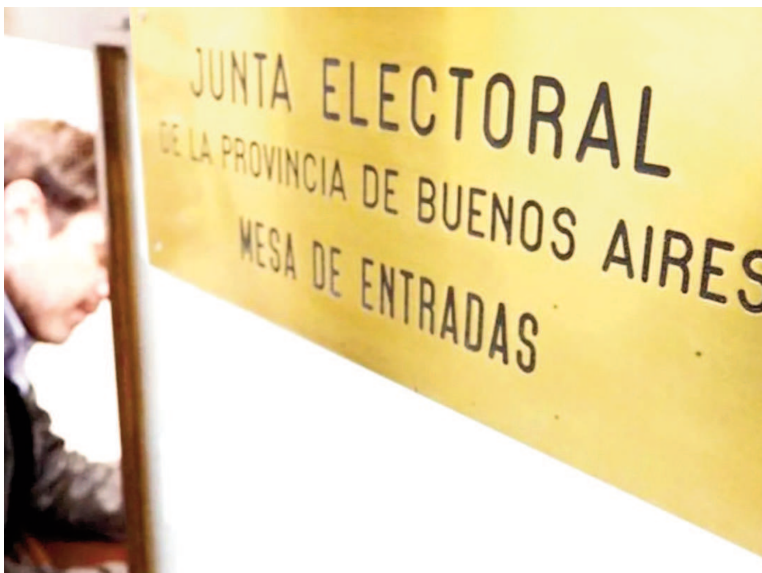
En su sitio web, la Junta Electoral bonaerense publica las listas oficializadas para competir el 7 de septiembre.