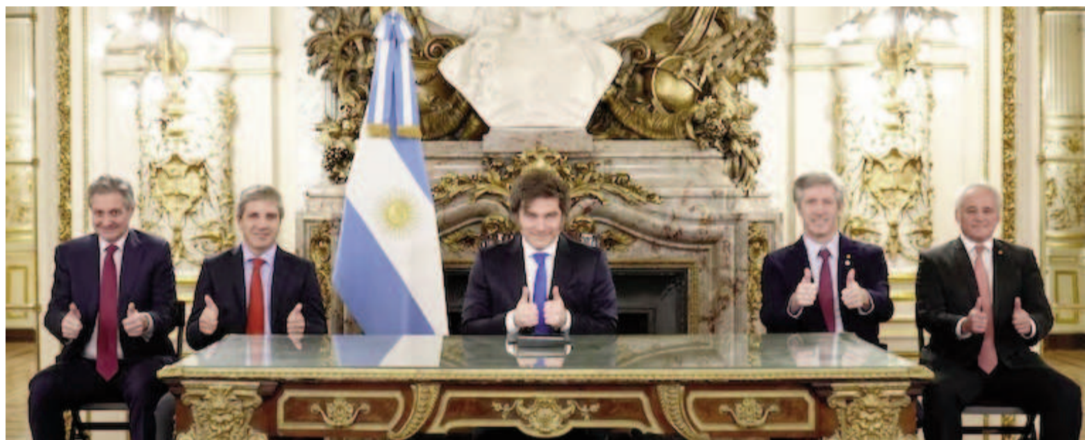
El presidente Javier Milei flanqueado por varios de sus funcionarios.

Además, advirtió sobre las consecuencias de retroceder respecto