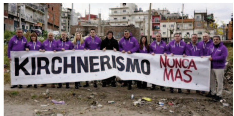
La imagen de la polémica.

"Esto va más allá de lo que se puede permitir, es la ofensa permanente", mencionó, y denunció: "El método es dejarnos cada vez más desprotegidos, abandonar a la gente,