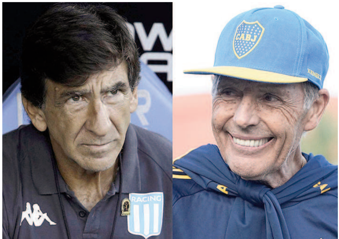
Gustavo Costas y Miguel Ángel Russo estarán frente a frente. WEB

Racing, por su parte, viene de golear 3-0 a Deportivo Riestra para meterse por primera vez en 10 años en los cuartos de final de la Copa Argentina. Sin embargo, el equipo conducido por Gustavo Costas tuvo un flojo comienzo en el Torneo Clau-