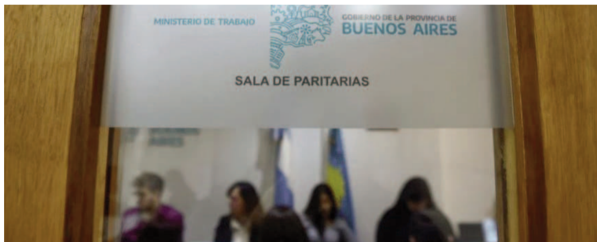
Un día sin acuerdos paritarios.