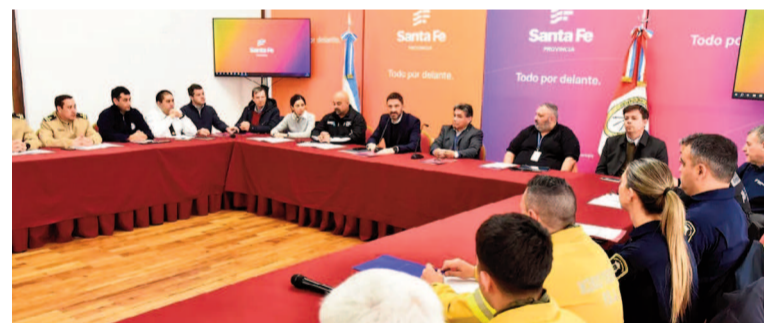
Tres provincias acordaron trabajar en conjunto contra los incendios en las islas.