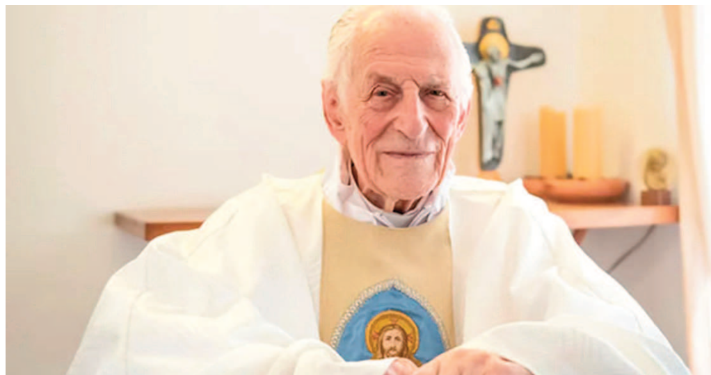
El arzobispo emérito de Paraná, cardenal Estanislao Karlic.

Fue presidente de la Comisión Episcopal Argentina entre 1996 y