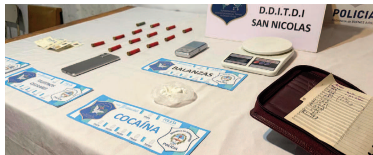
Durante la pesquisa se secuestraron más de 15 gramos de cocaína listos para su fraccionamiento, dos balanzas y dinero en efectivo, entre otras cosas.

La instrucción comenzó meses atrás, luego de que en la Justicia recibieran una denuncia de manera anónima que alertaba sobre la venta de drogas por parte de un hombre mayor de edad, domiciliado en el pueblo de Pérez Millán. A raíz de ello, la agente fiscal comisionó a personal de narcotráfico para dar inicio a la investigación. La división policial especializada, a través de extensas tareas de inteligencia, averiguaciones y vigilancias alternadas, logró ubicar el lugar donde presuntamente se situaba