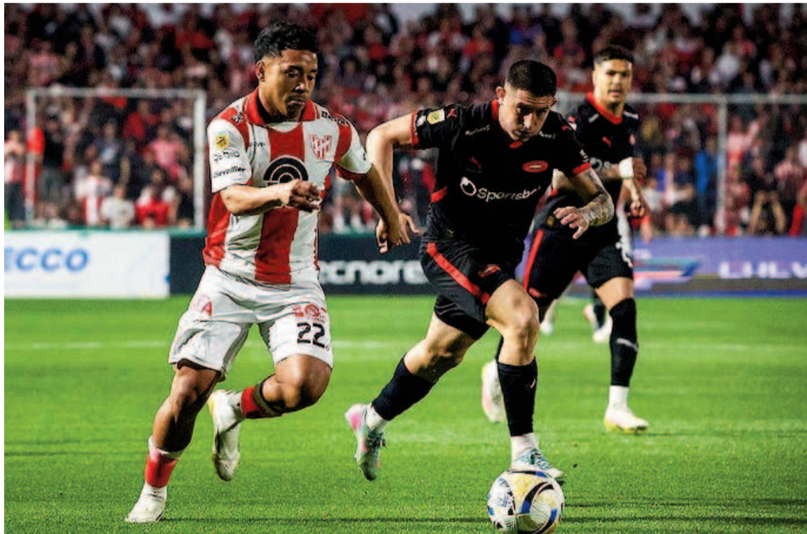
El conjunto de Avellaneda no levanta cabeza y está lejos de los puestos de clasificación.

El Rojo igualó 0 a 0 en su visita a Instituto y con apenas tres puntos marcha en el último puesto de la Zona B junto a Godoy Cruz.