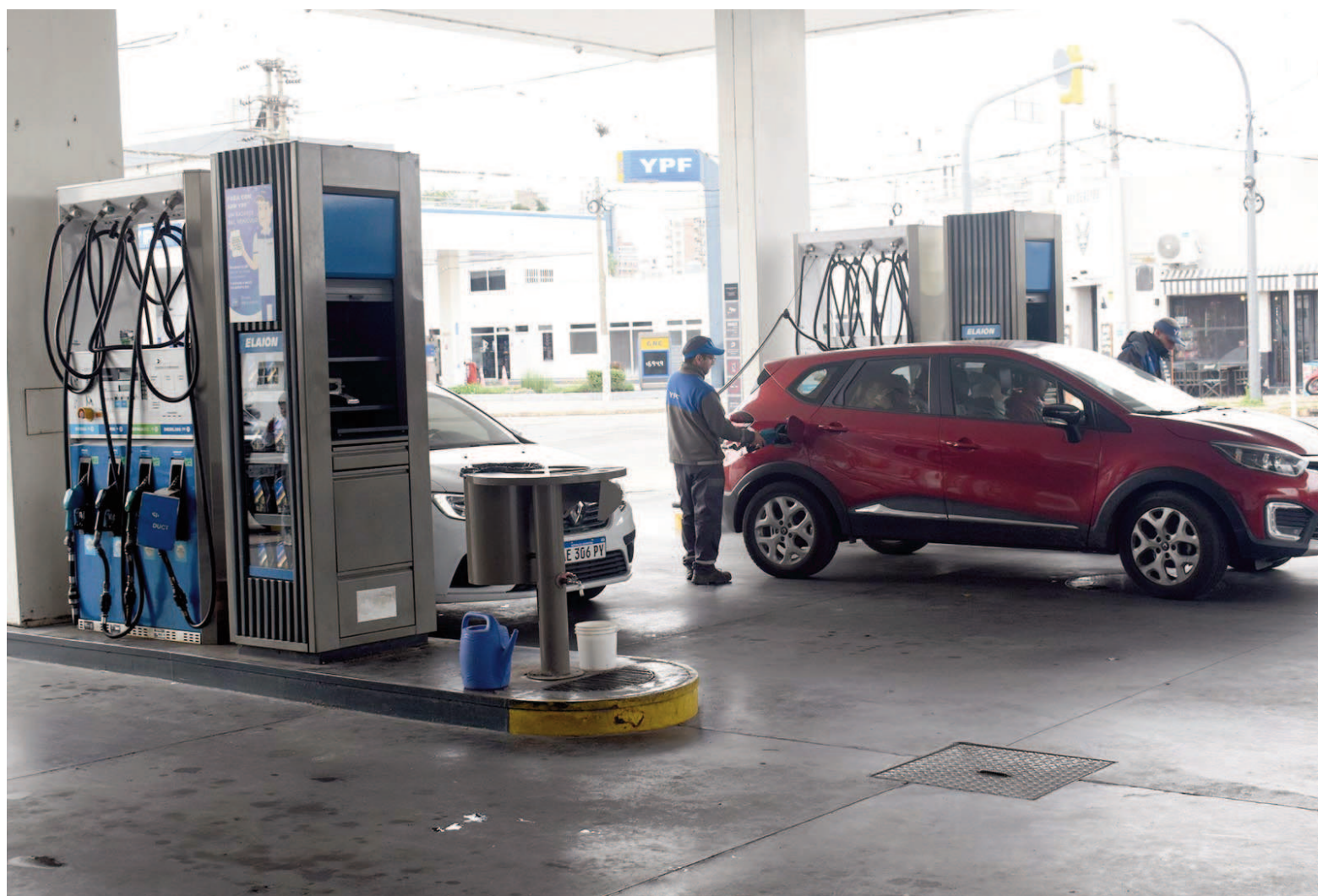
Con el nuevo sistema, el combustible de YPF que más subió en San Nicolás fue la nafta Infinia: en un mes el litro pasó de $1599 a $1716 (+7,32%).

Al cabo del primer mes de implementación, las subas resultaron bastante más pronunciadas que las que venían registrándose anteriormente, con ajustes mensuales del orden del 2,5% en la mayoría de los casos.