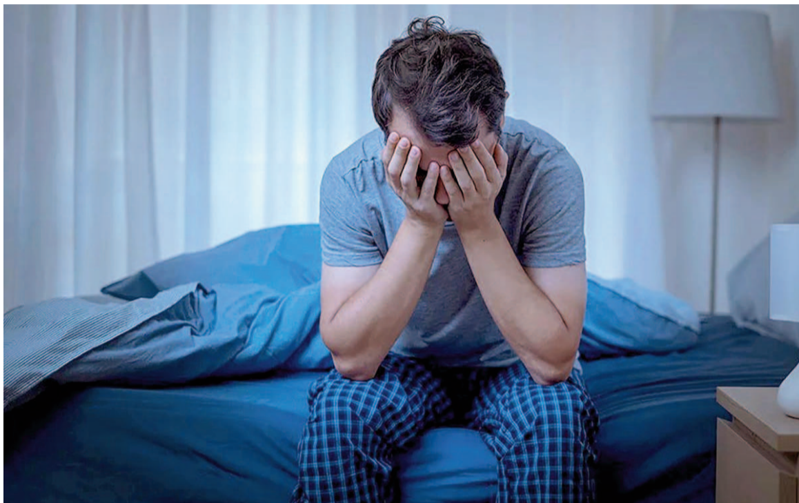
La apnea obstructiva del sueño muestra índices más altos durante los fines de semana, según datos globales.

Los resultados muestran que el índice de apnea-hipopnea (AHI) resulta un 18% más alto los sábados en comparación con los miércoles. El equipo de investigación informó que "los participantes tenían un 18% más de probabilidades de sufrir OSA moderada o grave los fines de semana (sábados), comparado con la mitad de la semana (miércoles)". El efecto resulta más pronunciado en