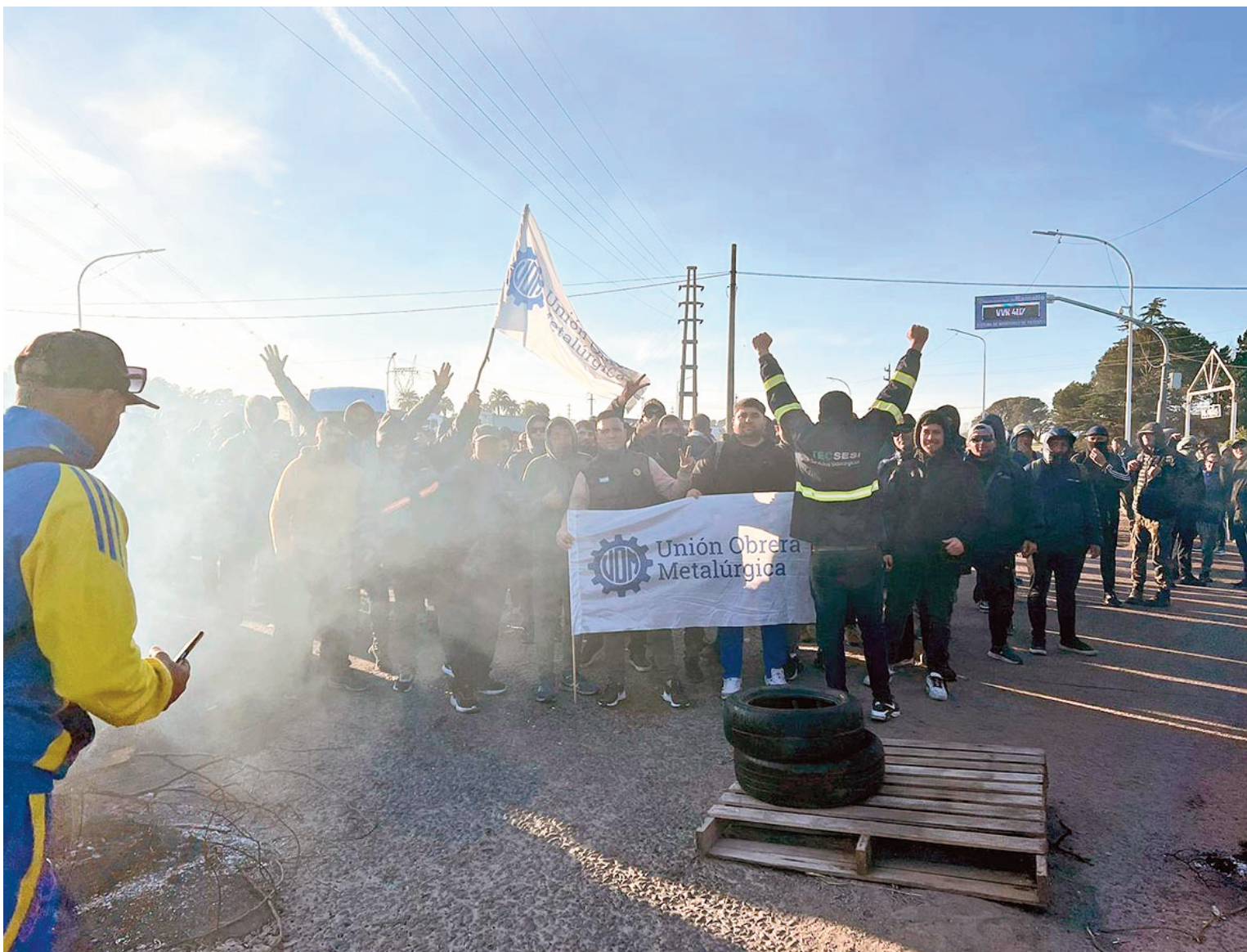
MANIFESTACIÓN. En el décimo día de la medida de fuerza, la UOM se manifestó con quema de neumáticos y corte de ruta frente a la planta General Savio. EL NORTE

Con retención de tareas por décimo día consecutivo, este viernes fueron 1200 los trabajadores de empresas contratistas de Ternium que no pudieron ingresar a la planta General Savio, según informó el gremio. Hubo manifestación, con quema de neumáticos, corte de ruta y presencia policial. Mientras tanto, 20 kilómetros más al norte, Acindar volvió a paralizar su producción, con más de 200 trabajadores suspendidos. La acería no funcionará por 72 horas, mientras que el sector de laminación estará sin operaciones durante una semana. La caída de la demanda, el avance de las importaciones y la parálisis de la construcción agravan la crisis del acero argentino. En foco 2 y Villa Constitución 7