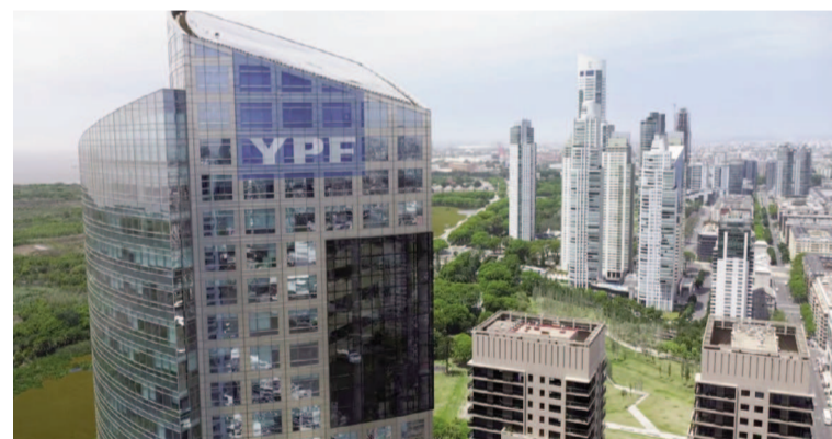
La Argentina se defiende en el caso YPF.

Los argumentos escritos de ese procedimiento por parte de la Argentina se presentarán el 25 de septiembre. Luego, será el turno de los beneficiarios del fallo. Recién después podría haber alguna resolución.