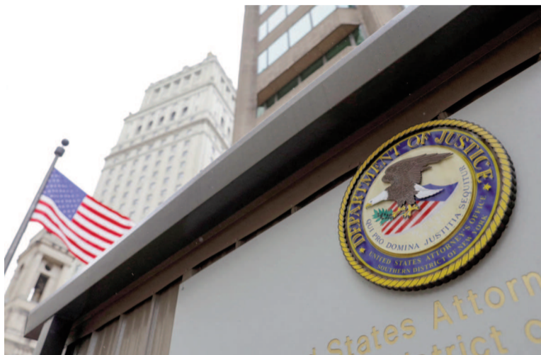
La Justicia de EE.UU. favoreció a la Argentina en el caso Cupón PBI.

Sin embargo, la Cámara de Apelaciones del segundo circuito de Nueva York argumentó en aquel fallo— al igual que lo había hecho Preska