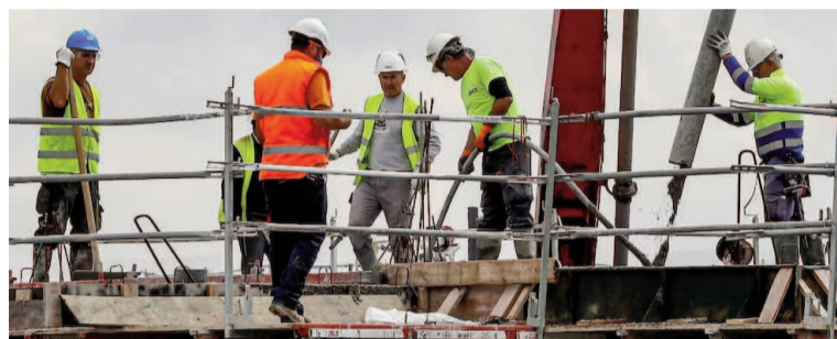
La construcción mostró señales de recuperación.

El análisis sectorial mostró una evolución heterogénea en julio. La intermediación financiera volvió a encabezar el listado de sectores con mejor desempeño, con un crecimiento de 23,1% interanual, acumulando un alza de 26% en los primeros siete meses del año. Minas y canteras también registró un resultado positivo, con un incremento de 10,9% en la comparación anual y