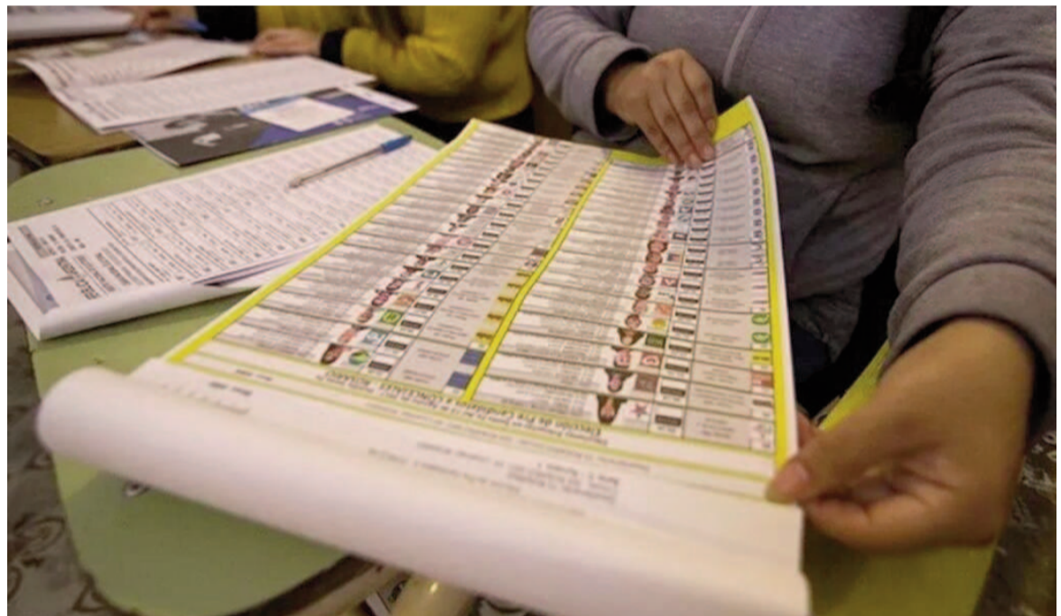
Se definió el orden de la Boleta Única Papel.

Otro espacio que quedó relegado en el sorteo fue la Coalición Cívica, que también llevan en su lista a varios intendentes bonaerenses de la Unión Cívica Radical (UCR). El espacio que encabeza Elisa Carrió terminó en el noveno lugar, entre Unión Liberal y Proyecto Sur, partido conformado por Ricardo Alfonsín.