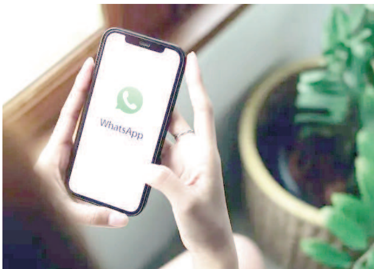
La estafa se concretó a través de una videollamada de WhatsApp.

Del otro lado de la comunicación, un hombre le aseguró pertenecer a una supuesta "Área de Seguridad de Delitos Informáticos". Con un relato convincente y aprovechando la confianza generada en la conversación, el estafador le explicó que su cuenta bancaria podía estar en riesgo y la guio para realizar una serie de pasos que —según le decía— eran necesarios para proteger su dinero. Bajo esas instrucciones, la víctima terminó efectuando varias transferencias de dinero que, en conjunto, sumaron 12.056.498 pesos.