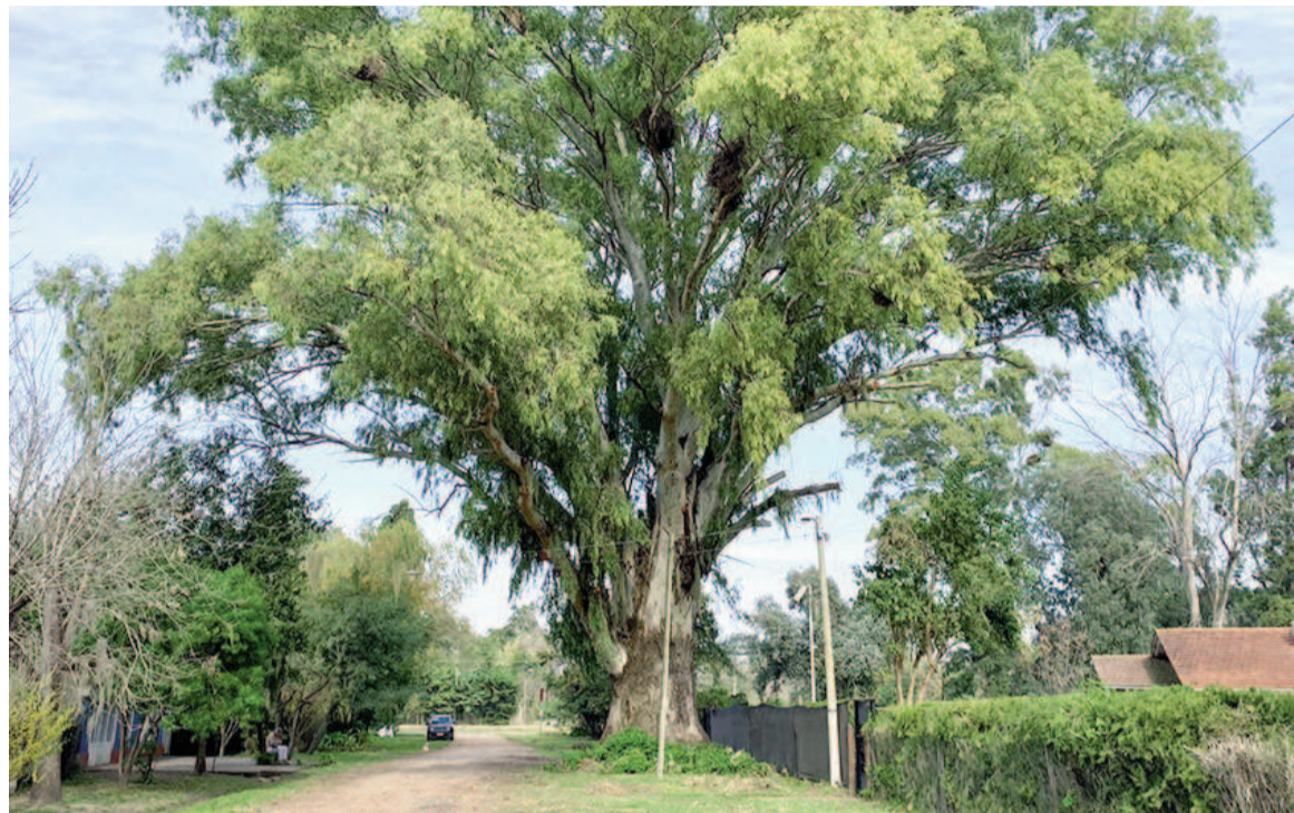
La ciudad de Roldán es lugar de cobijo del eucalipto más grande y longevo de toda la región.

Entre pantanos, zanjones y mosquitos hambrientos, se creyó encontrar la solución en este árbol. En suelos húmedos, el eucalipto podía ab-