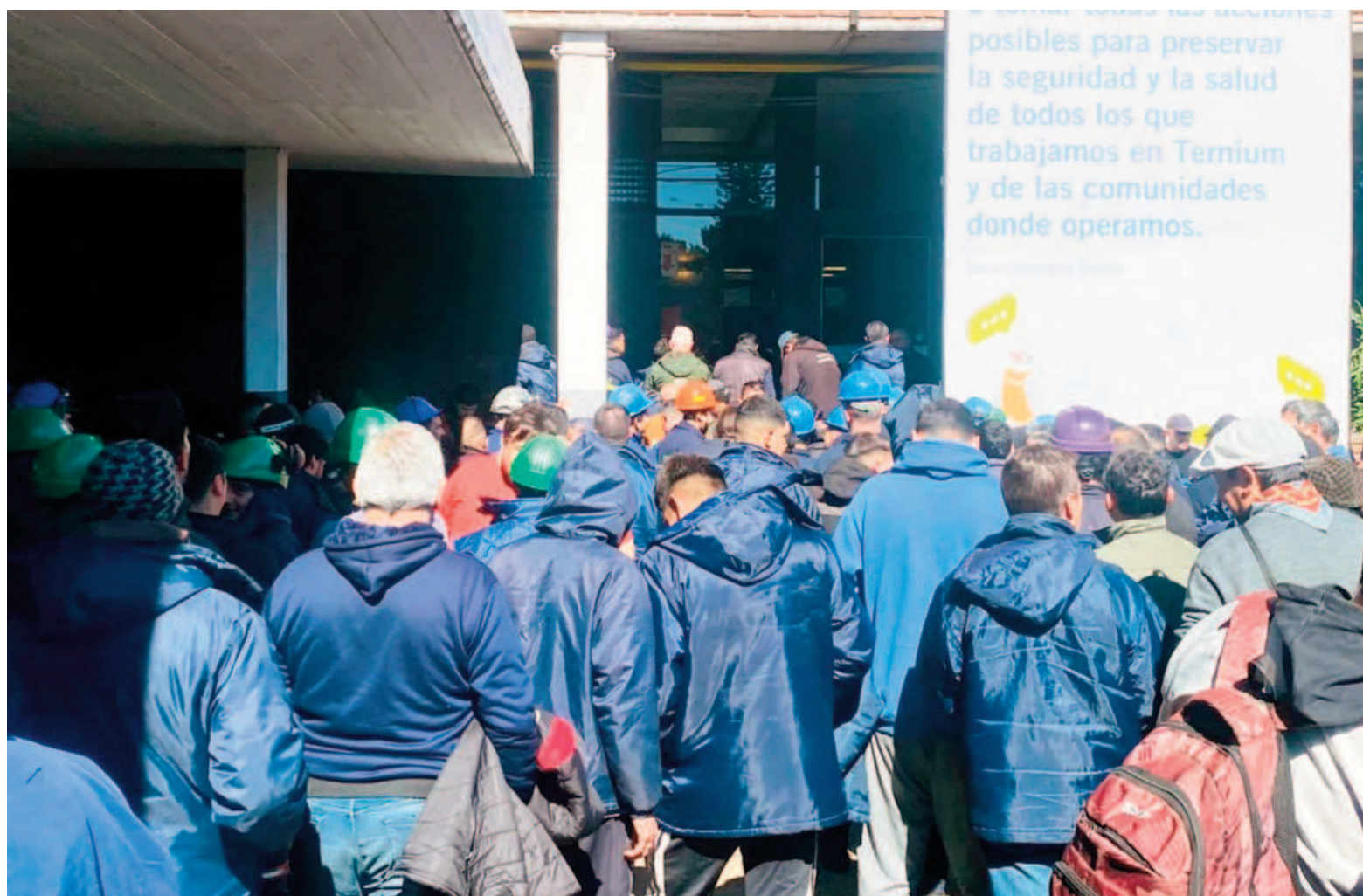
La seccional UOM de San Nicolás inicia hoy su octavo día consecutivo con retención de tareas en las contratistas de Ternium.

Aunque inicialmente el conflicto estaba encuadrado en el ámbito del Ministerio de Trabajo de la Provincia de Buenos Aires (donde incluso se cumplieron periodos de conciliación obligatoria y hasta "voluntaria"), la parte empresaria trasladó luego las actuaciones administrativas a la Secretaría de Trabajo dependiente