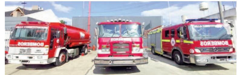
Los bomberos recibieron aportes de contadores.

En esta oportunidad, ALCEC Villa Constitución recibió insumos médicos que permitirán optimizar la atención de pacientes y las campañas de prevención que la entidad lleva adelante. Por su parte, Bomberos Voluntarios de Empalme Villa Constitución fueron beneficiados con materiales de construcción destinados a mejorar la infraestructura del cuartel, un espacio fundamental para la preparación del personal y la respuesta ante emergencias.