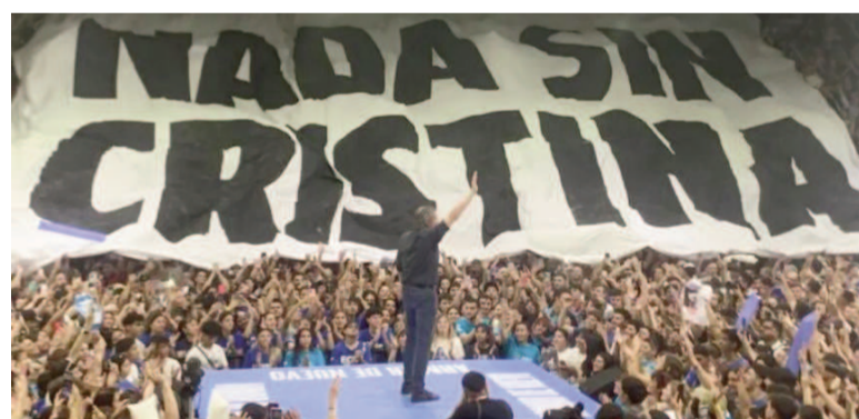
Máximo Kirchner cuestionó a Kicillof.

A menos de dos semanas de las elecciones, la interna en el peronismo bonaerense sumó un nuevo capítulo de tensión tras la viralización de un video en el que el diputado nacional Máximo Kirchner le reclama públicamente al gobernador Axel Kicillof por la distribución de fondos para