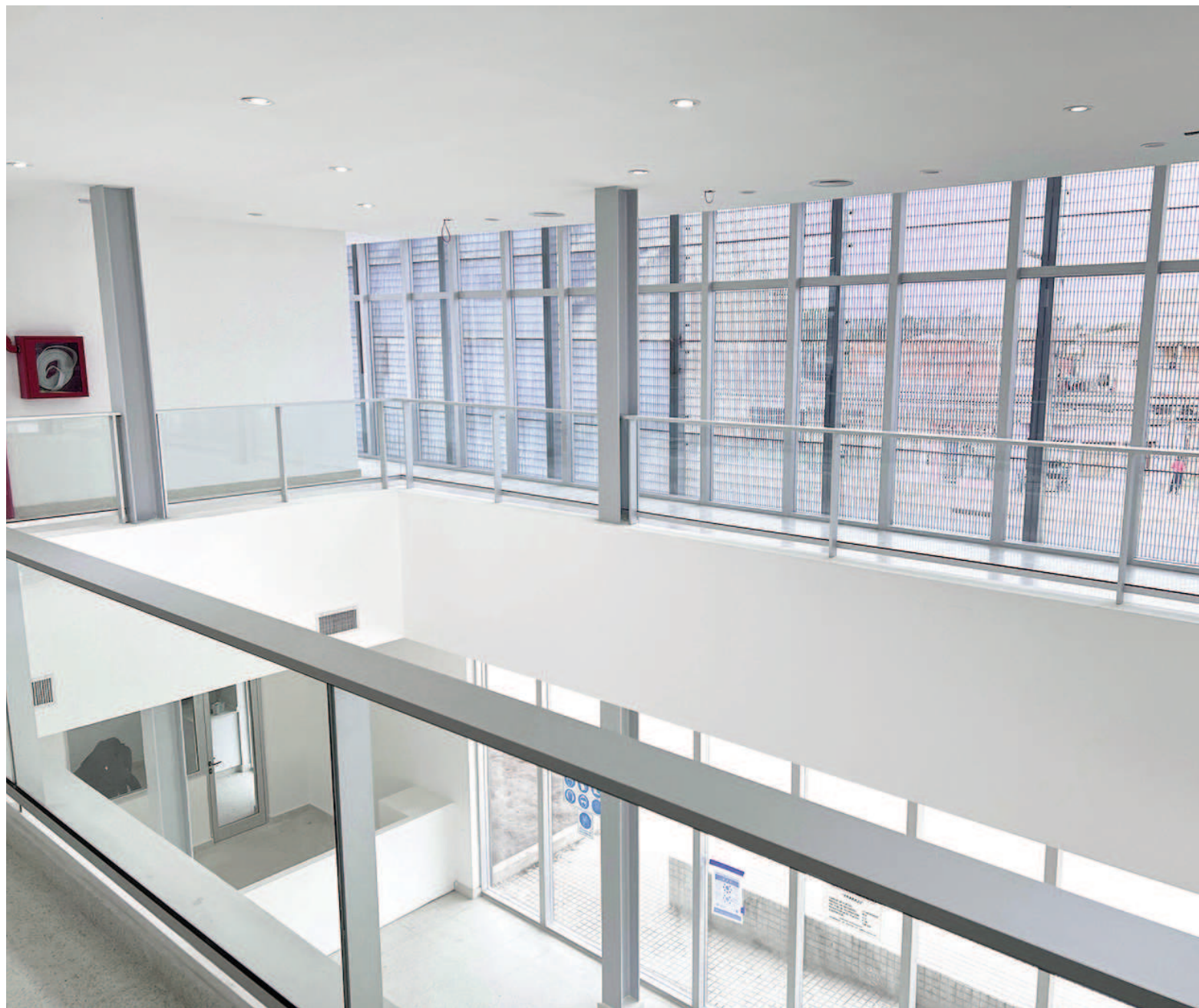
La etapa final de la obra incluye la instalación del mobiliario y el equipamiento, imperioso para poner en marcha la atención al público.

En el anuncio se hizo hincapié en la incorporación de tecnología médica y en un sistema de turnos online, que permitirá a los vecinos solicitar atención sin necesidad de