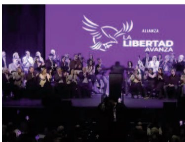
Milei presentó a sus candidatos en Junín.

En medio de la tensión política por el escándalo de los audios de presuntas coimas, el presidente Javier Milei protagonizó un llamativo acto fallido durante un acto con candidatos en la ciudad de Junín. Al criticar a la oposición, el mandatario afirmó que «están molestos porque les estamos afanando los choreos».