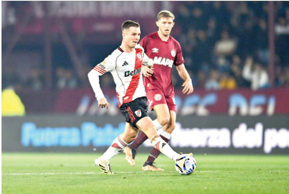
Al Millonario se le escapó el triunfo en la última jugada.