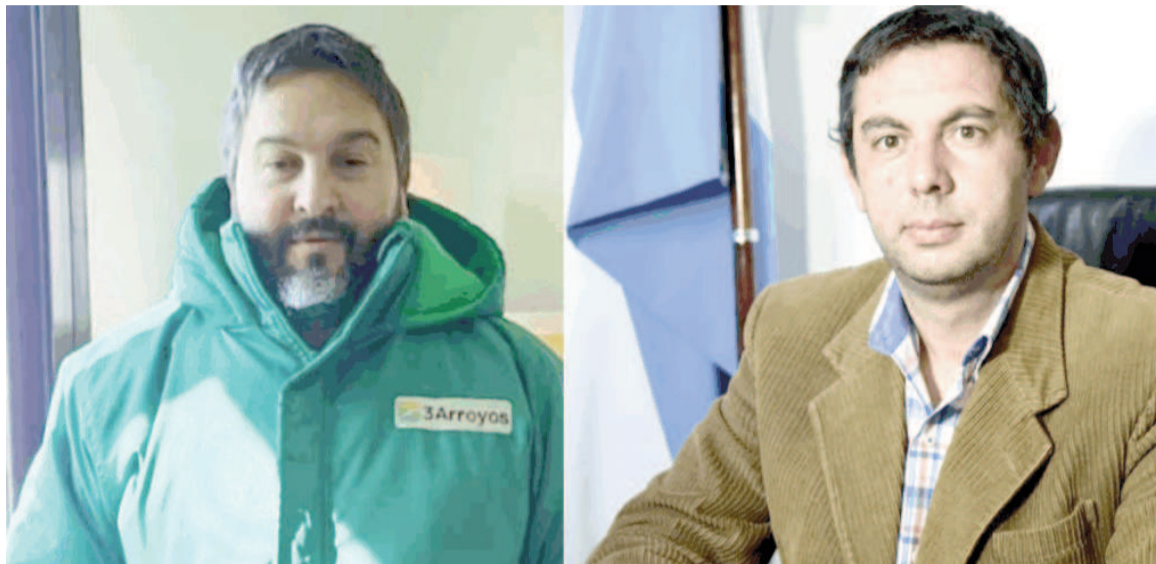
García Furfaro: “Si el fentanilo está contaminado con bacterias, los bichos los puso Andrés Quinteros”.

—En octubre me doy cuenta porque Quinteros se quiere robar 30 ampollas de morfina. Medio plantel en Ramallo lo puso él porque es de San Nicolás. Se quiso robar 30 ampollas de morfina,