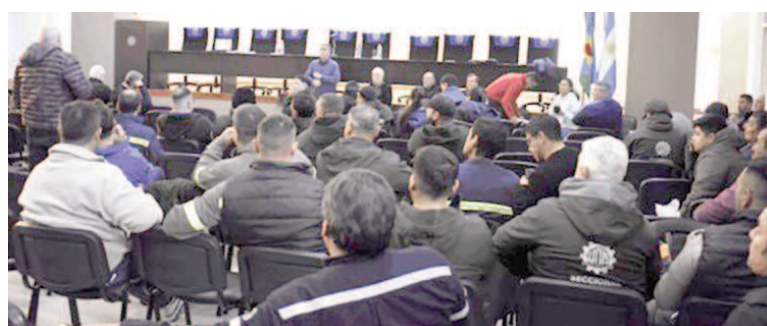
Las partes mantuvieron una nueva audiencia de conciliación.

Trabajadores de la firma Casius, que brinda servicios de limpieza dentro de la planta General Savio que opera la siderúrgica Ternium, no pudieron ingresar en la mañana de este lunes al predio industrial. La situación, en la que estarían involucrados más de 150 empleados de la ex Dohm, se da en el marco del duro y complejo conflicto que enfrenta a la seccional San Nicolás de la Unión Obrera Metalúrgica (UOM) con unas 50 empresas contratistas de la siderúrgica del grupo Techint. El rechazo de los trabajadores en la portería del predio industrial se produjo hacia las seis de la mañana y fue confirmado a este medio por fuentes gremiales que indicaron que los trabajadores afectados por la situación suman alrededor de 170. La empresa de limpieza ya había intimado por escrito a sus empleados, luego de la retención de tareas del viernes, en adhesión a una medida de fuerza lanzada por la UOM.