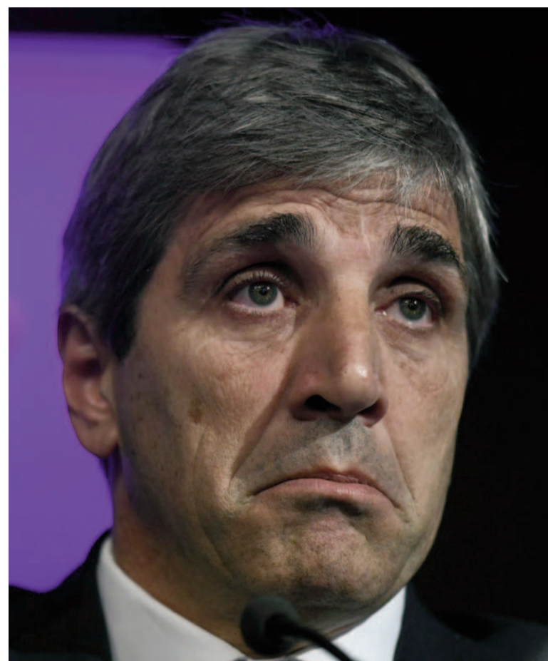
Ministro de Economía Luis Caputo.

rante un largo lapso de tiempo. Sí te puede llevar a una recesión, porque implicaría que la percepción de riesgo seguiría siendo alta, lo que seguramente atentaría contra cualquier inversión en la economía real, más allá que pueda fondearse con capital propio”.