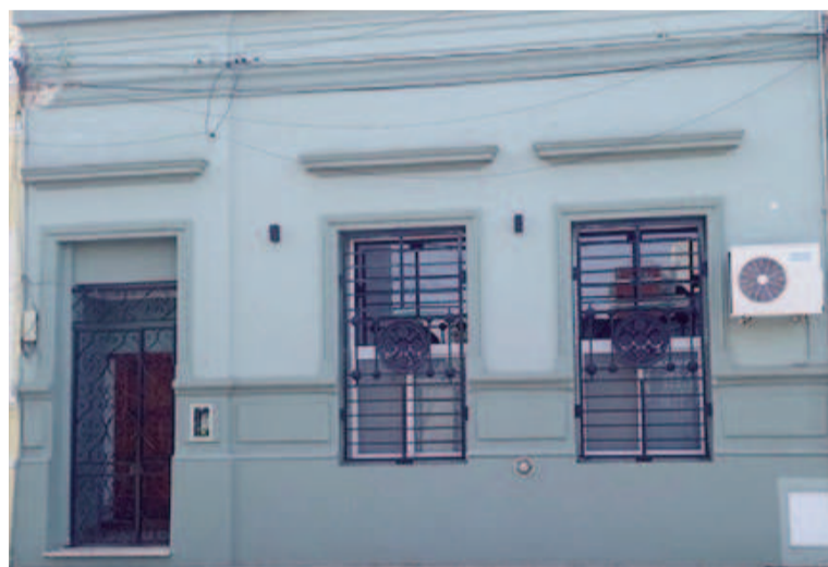
Sede de la AJB San Nicolás.

Además, se reiteraron en la mesa paritaria todos los reclamos que son parte de la agenda del sector como: la solicitud a la cartera de Justicia para concretar una instancia técnica para avanzar con la Ley de Paritarias y la incorporación de las y los trabajadores del Concejo de la Magistratura a la representación plena de la AJB; así como el reclamo por la extensión de subcategorías para jubilados y jubiladas y la definición de un porcentaje para com-