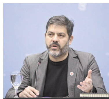
Ministro Carlos Bianco.

La referencia de Bianco es porque este año la administración bonaerense tuvo que prorrogar el Presupuesto y la Ley impositiva luego que el oficialismo y la oposición no llegaron a un entendimiento sobre dos puntos clave: un