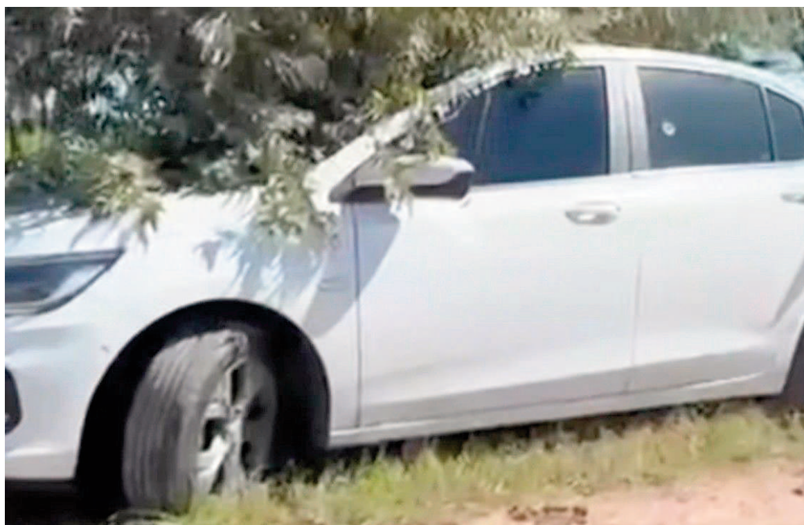
El auto en el que fueron encontrados los cuerpos.