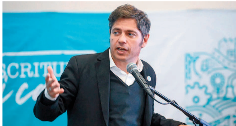
Gobernador Axel Kicillof.

El funcionario bonaerense analizó: “Estamos frente al primer Gobierno de la historia del país que decidió frenar absolutamente toda la obra