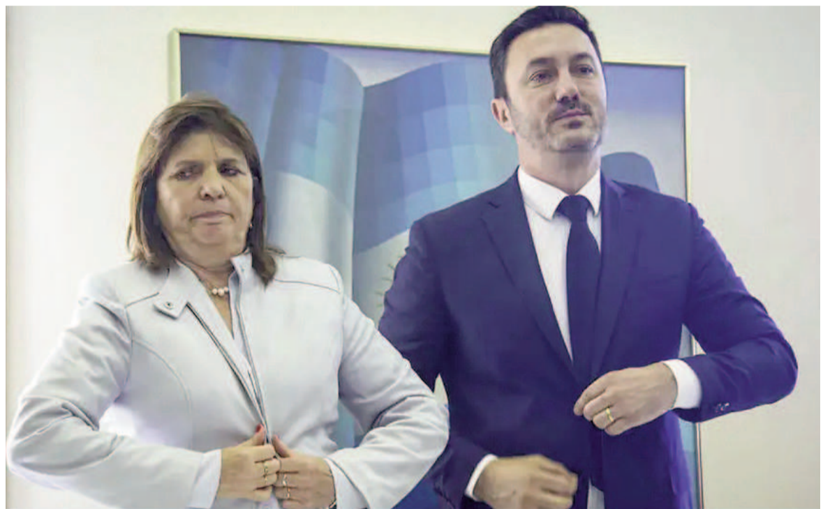
Patricia Bullrich y Luis Petri, los responsables de las áreas intervinientes.

busca reforzar la presencia del Estado en áreas sensibles y mejorar la articulación entre militares y fuerzas federales frente a amenazas vinculadas al crimen organizado y al contrabando.