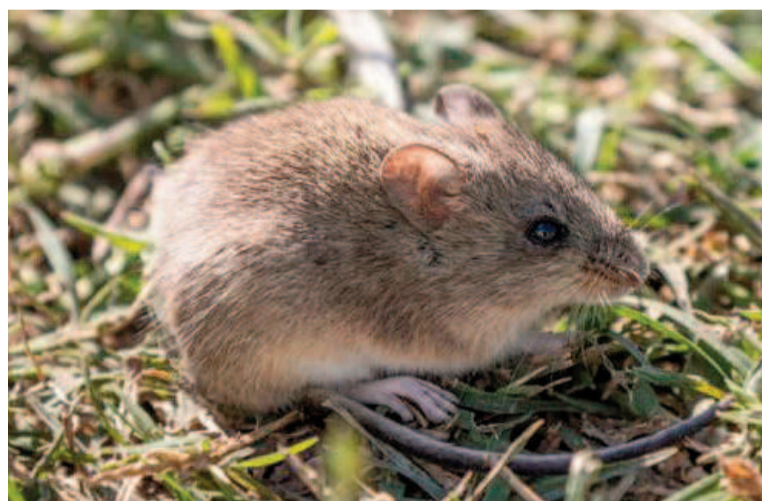
El ratón de campo, conocido como "maicero", ha sido identificado como el reservorio principal del virus Junín.

En los años 2024 y 2022 se registró un aumento de casos confirmados anuales respecto de la serie histórica, con 23 casos en 2024 y 28 casos en el 2022. También en esos años la mayor concentración de casos ocurrió en el municipio de San Nicolás (21/28 casos en 2022 y 18/23 casos en 2024).