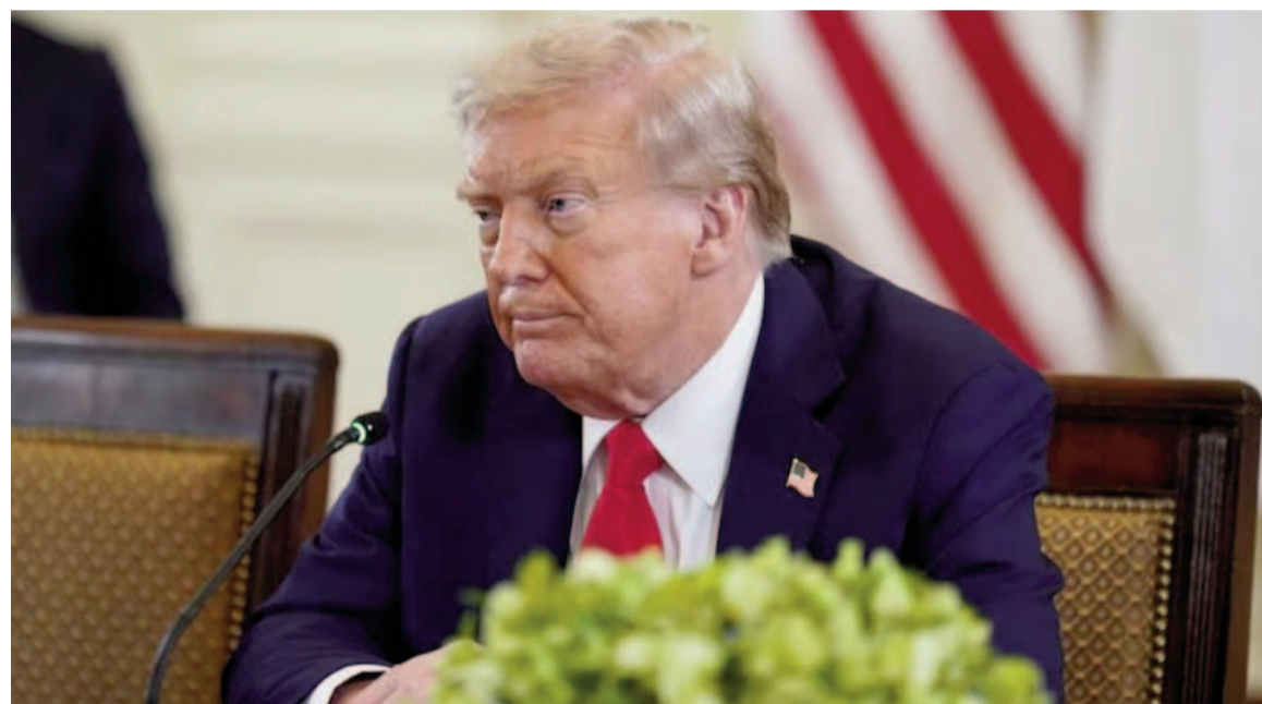
El presidente de Estados Unidos, Donald Trump.

El presidente también detalló que el encuentro con su par ucraniano y los líderes europeos en la Casa Blanca se centró en las garantías de seguridad para Ucrania: "Será proporcionada por los diversos países europeos, en coordinación con EE.UU."