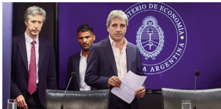
El Gobierno registró déficit financiero por primera vez en siete meses.

El gasto primario, por su parte, sumó $11.356.489 millones (+34,8%