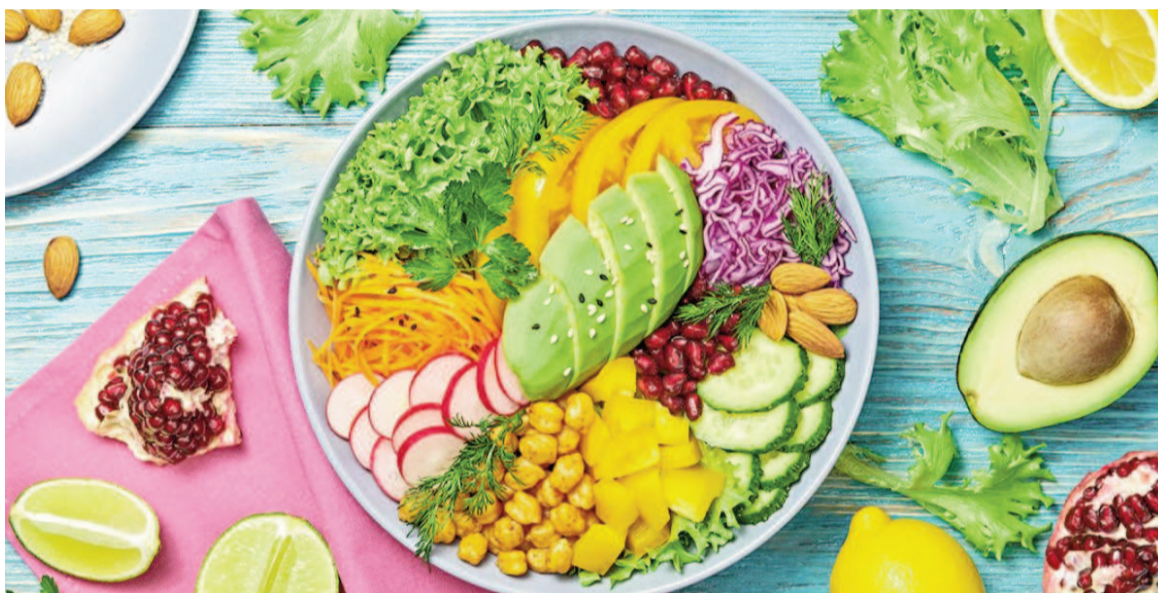
La dieta arcoíris promueve el consumo variado de alimentos vegetales de diferentes colores para mejorar la salud integral.

mita al aparato digestivo. La variedad de colores en los alimentos vegetales fortalece el sistema inmunitario, reduce la inflamación y favorece la comunicación entre intestino y cerebro. Los expertos destacan que esta sinergia alimentaria puede mejorar la memoria, la agudeza mental y el equilibrio emocional.