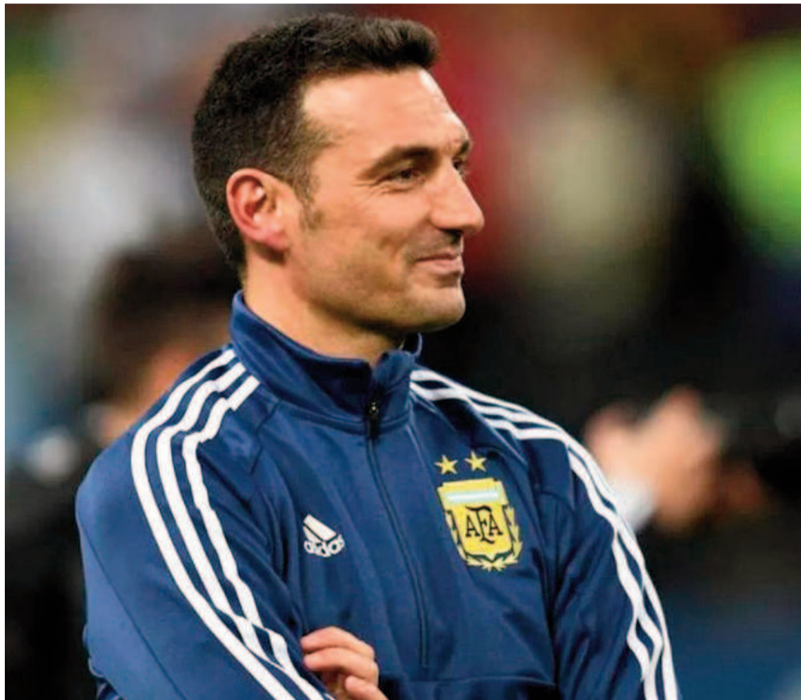
Lionel Scaloni brindó la última lista de las Eliminatorias.

El cuerpo técnico de la Selección argentina planea recortar dos o tres nombres de esta lista para conformar el plantel definitivo que se prepara para enfrentar a su par de Venezuela en el Estadio Monumental el próximo jueves 4 de septiembre y, al siguiente martes, cerrar la participación en estas Eliminatorias Sudamericanas ante Ecuador en Guayaquil.