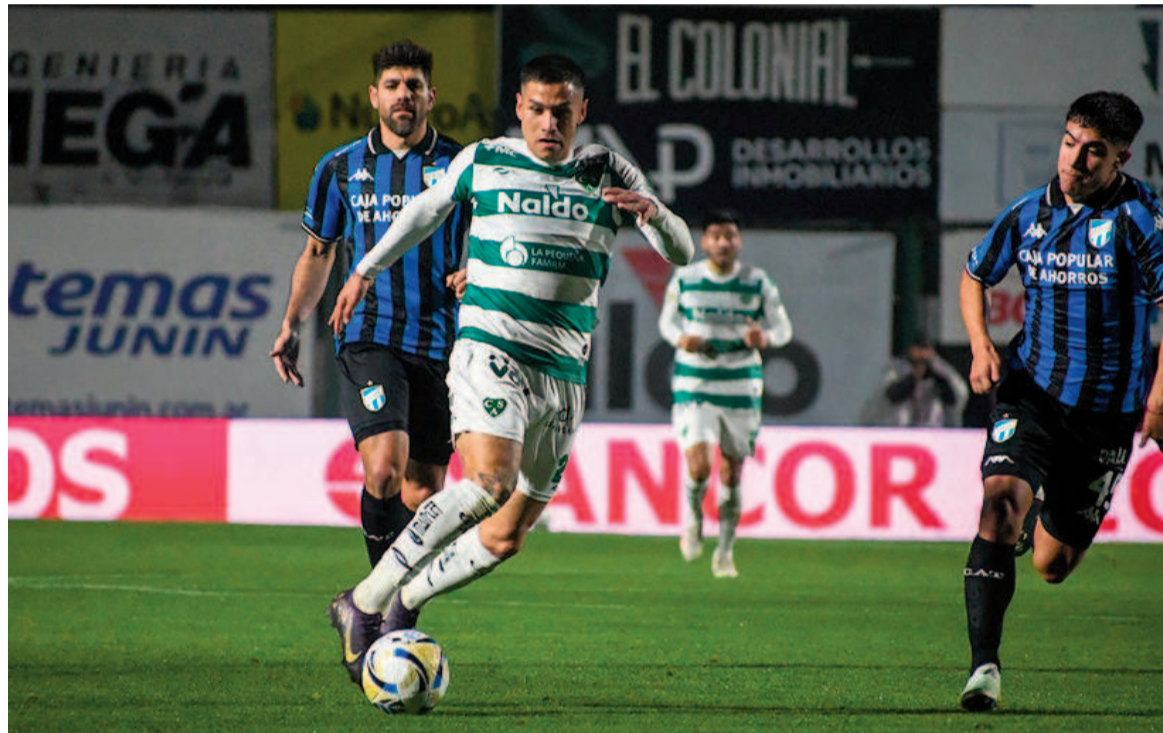
Atlético Tucumán se metió en puestos de clasificación.