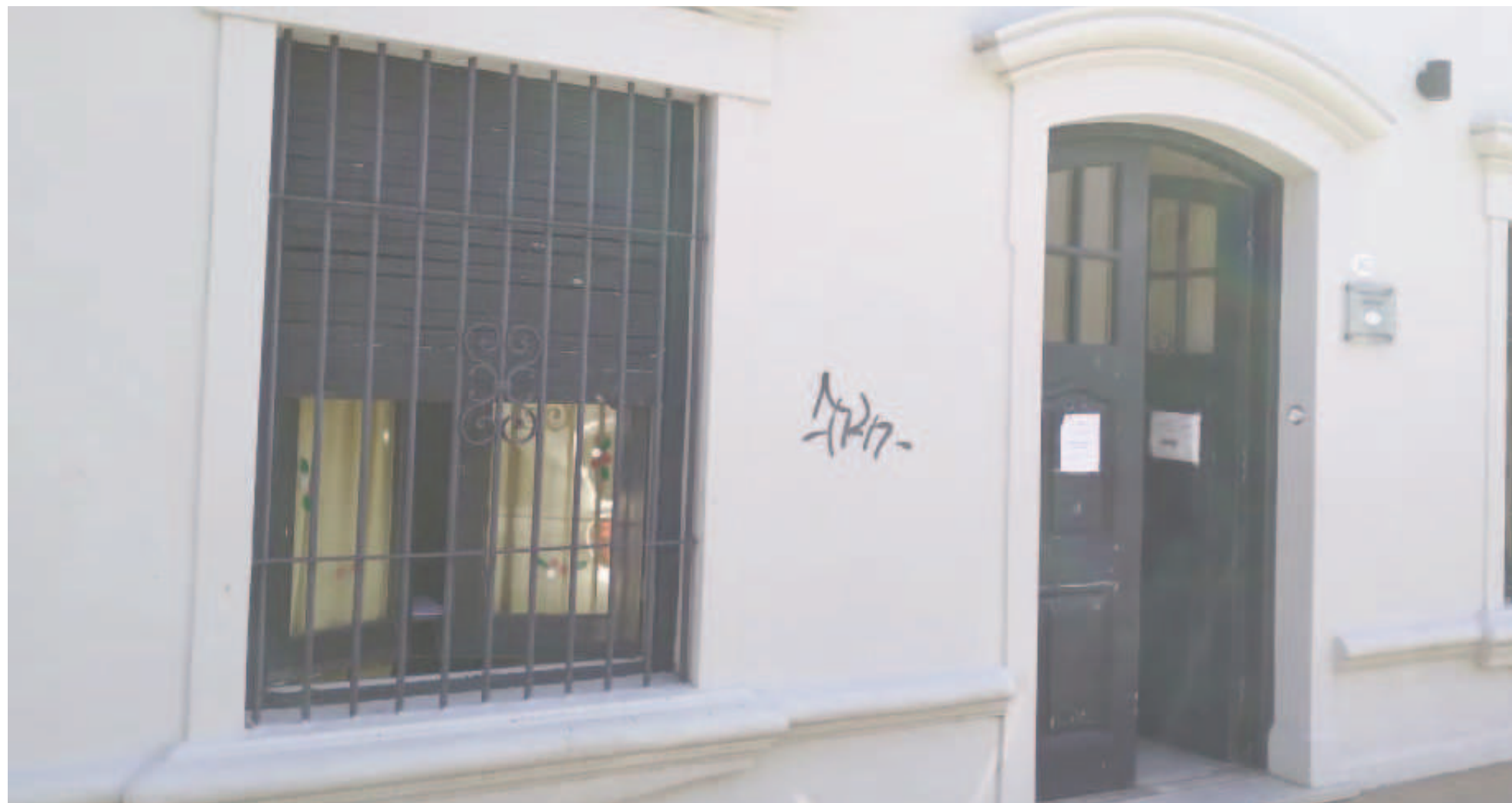
Los consejeros escolares de diferentes distritos exigieron la restitución inmediata de los valores del Fondo Compensador vigentes hasta abril de 2025.

Se trata de una partida afectada al mantenimiento de establecimientos educativos. La situación se replica en el resto de los distritos. En abril habían sido $44.613.741, y en mayo $21.439.600. En julio fueron $12.323.817.