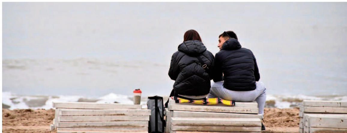
El balance de las vacaciones de invierno, según CAME. NOTICIAS ARGENTINAS

Las vacaciones de invierno dejaron un impacto económico estimado en $1,5 billones (USD1.163 millones) y "superó expectativas previas", según destacó la Confederación Argentina de la Mediana Empresa (CAME). De acuerdo con el informe de ayer domingo, durante el receso invernal viajaron 4,3 millones de personas, aunque la mayoría de las provincias registraron cifras por debajo del invierno pasado. La situación económica y la menor llegada de turistas internacionales, en un contexto de tipo de cambio menos favorable, incidieron en ese comportamiento. El gasto promedio diario por turista fue de $89.000 y la estadía media se ubicó en 3,9 días. Según CAME, el receso invernal se vio afectado por la caída en el poder adquisitivo de las familias, la pérdida de competitividad cambiaria y condiciones climáticas más frías y lluviosas de lo habitual. En ese marco, los 4,3 millones de turistas que recorrieron el país representaron una caída del 10,9% respecto al año pasado. El impacto económico también fue menor: