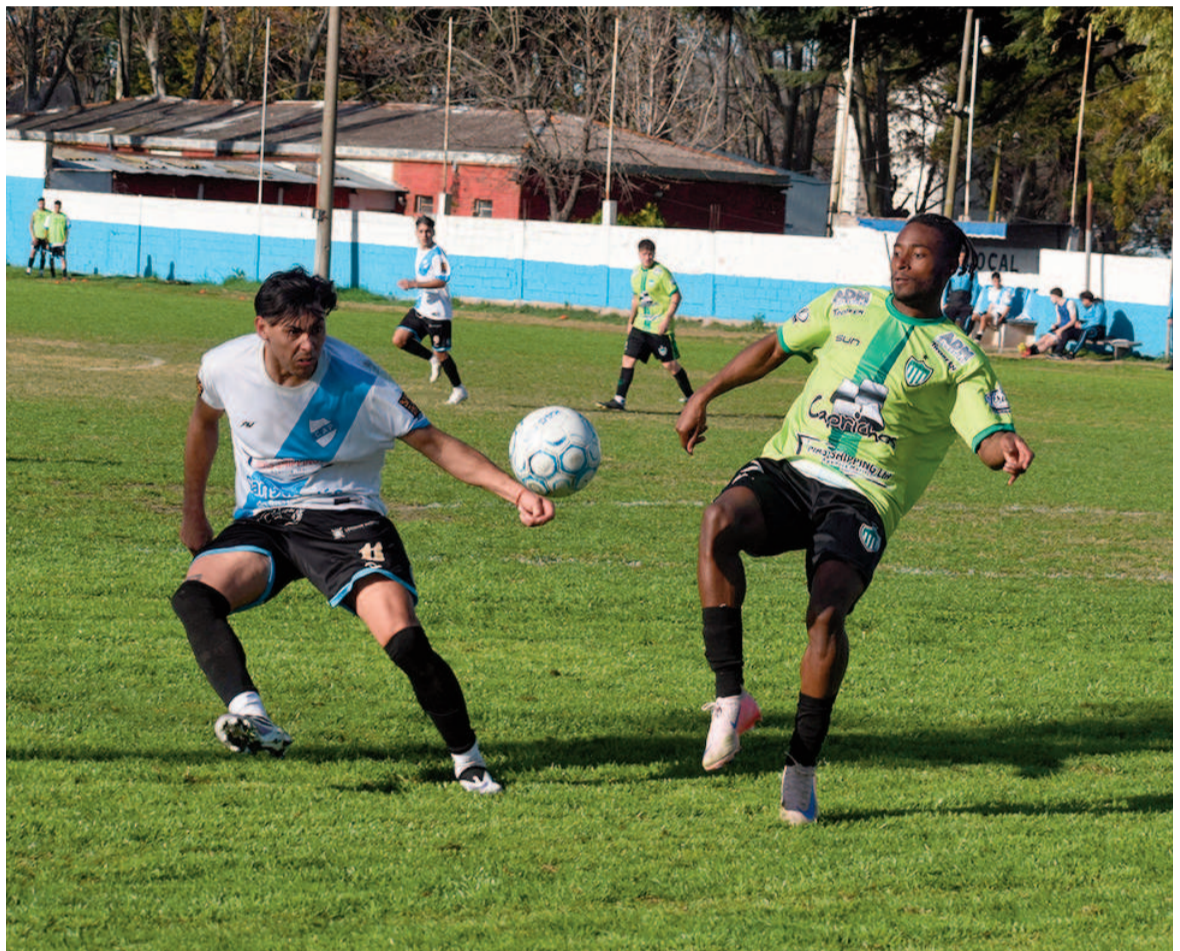
En Rivadavia y Necochea, Paraná y Los Andes terminaron 1 a 1. EL NORTE

12 de Octubre vs. Defensores Matienzo vs. Somisa Regatas vs. Argentino Oeste Los Andes vs. Social La Emilia vs. Paraná El Fortín vs. General Rojo Conesa vs. Fútbol SN San Martín vs. Belgrano