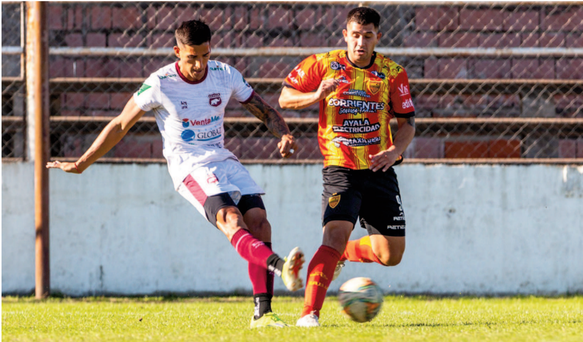
El equipo de Villa Ramallo no levanta cabeza.

El granate cayó por 2 a 0 ante Boca Unidos de Corrientes por la Reválida y comparte el penúltimo promedio con Gimnasia de Concepción del Uruguay.