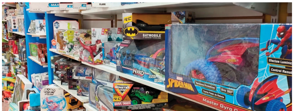
Al igual que otros rubros, la industria del juguete es uno de los que enfrenta una caída general en las ventas, por lo que esperan fechas específicas como éstas para lograr un repunte.