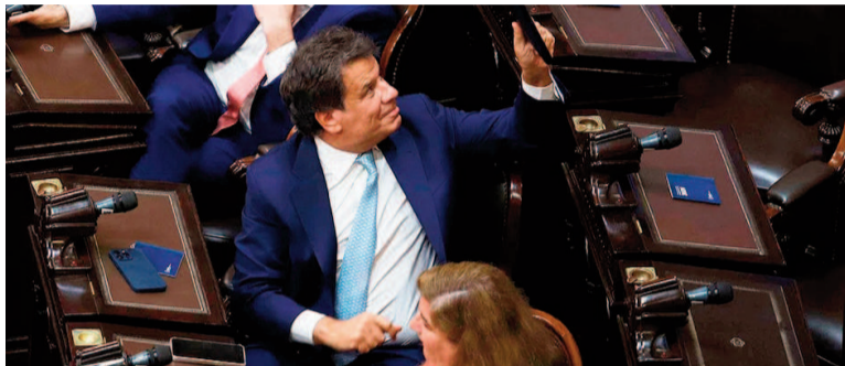
El diputado nacional Facundo Manes

En sus redes sociales, el impulsor de la coalición de centro Somos Buenos Aires, sostuvo que van a seguir "defendiendo la Argentina" de los que "se la quieren llevar puesta", al igual que "la libertad de todos". Desde su asunción, el gobierno libertario puso foco en el aumento de fondos para el organismo estatal: en los primeros cinco meses