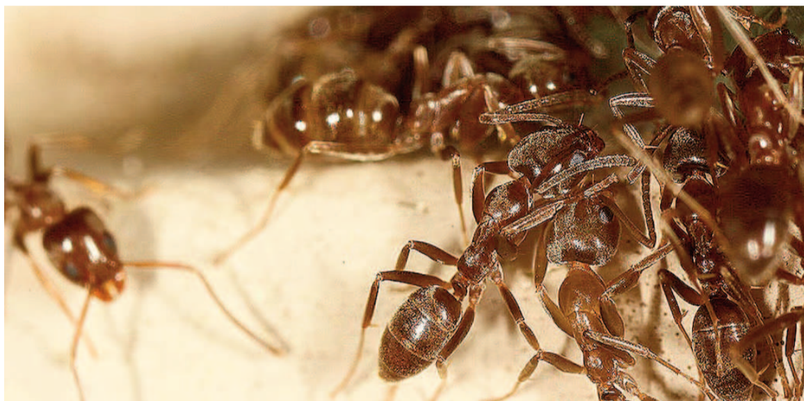
Las hormigas argentinas figuran entre las cien peores plagas del mundo por su capacidad invasora.

de la hormiga y la prueba de que podría funcionar como un controlador biológico tiene grandes implicancias a nivel mundial. Demuestra el potencial de los controladores biológicos para combatir plagas sin utilizar químicos dañinos.