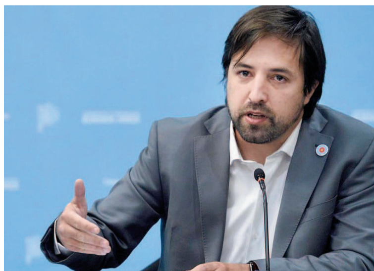
El ministro de Salud bonaerense, Nicolás Kreplak.

Entre otras de las políticas que mostrarán, se encuentra la ampliación del vademécum oncológico con la incorporación de 10 nuevos principios activos y presentaciones, cubriendo el 97% de los requerimientos del IPC y reduciendo las derivaciones al Banco de Drogas Nacional en un 52%; así como también se impulsó la ampliación del vademécum del Programa Medicamentos Bonaerenses que distribuye medicamentos esenciales para patologías prevalentes; también se compraron reactivos para la detección y control de Infecciones de Transmisión Sexual y VIH, medicación para infecciones oportunistas y preservativos para suplir la falta de entrega por parte