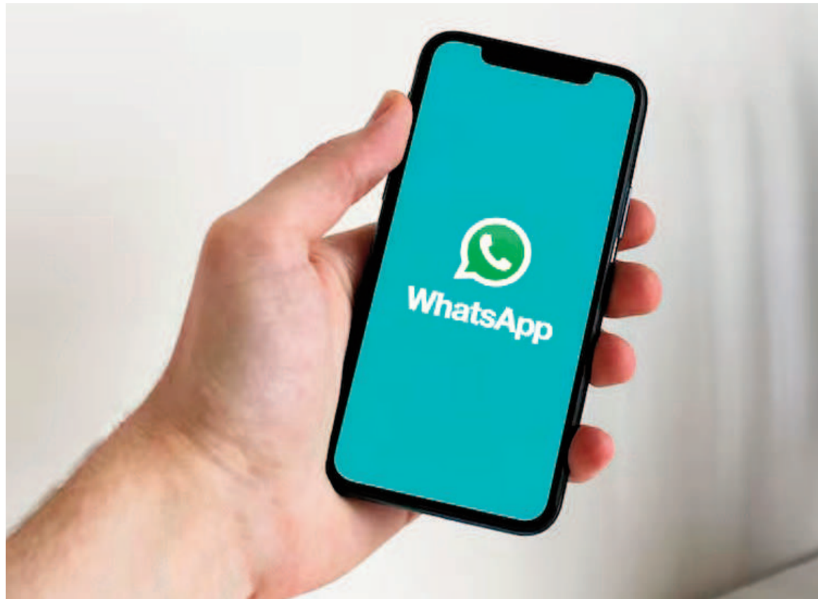
La limpieza de contactos también permite un mejor rendimiento de la aplicación.

Toca el nombre del contacto que quieres eliminar e ingresa a su información. Da clic en el ícono "Más opciones" (tres puntos verticales) y entra en "Editar". Finalmente, selecciona "Más opciones" (tres puntos verticales)