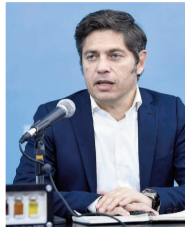
El gobernador Axel Kicillof.

El gobernador también recordó su mirada sobre Spagnuolo a par-