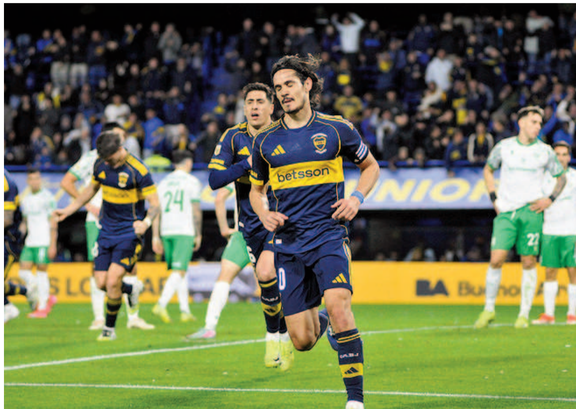
Edinson Cavani rompió su racha y anotó el segundo gol del Xeneize.

Con goles de Merentiel y Cavani, el equipo de La Ribera se impuso por 2 a 0 sobre el Taladro en La Bombonera y se ubica en puestos de clasificación para la fase final del certamen.