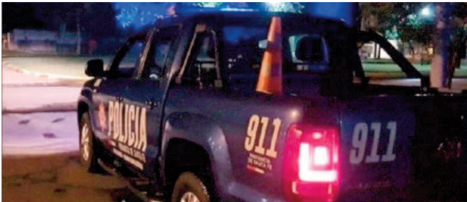
No se reportaron detenidos por los diferentes hechos.

Un joven de 26 años fue herido con un arma blanca en el rostro en inmediaciones de Felipe Moré y Gálvez. Personal policial indicó que fue asistido en el Hospital de Emergencias Clemente Álvarez (HECA), donde quedó en observación. En otro episodio ocurrido en inmediaciones de Av. 27 de Febrero y Circunvalación, un hombre de 40 años sufrió un disparo en la pierna derecha. Fue trasladado al Hospital Centenario.