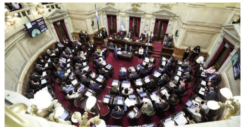
Mañana los legisladores se reunirán en comisiones.

Uno de sus artículos recoge el reclamo de los trabajadores del Hospital Garrahan y de otros hos-