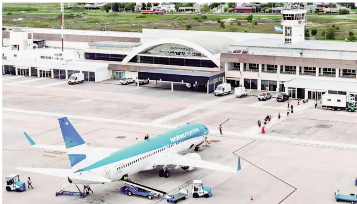
El aeropuerto de Rosario suma reformas para mejorar la conectividad y sus instalaciones.

La decisión de asumir el financiamiento total de las obras fue to-