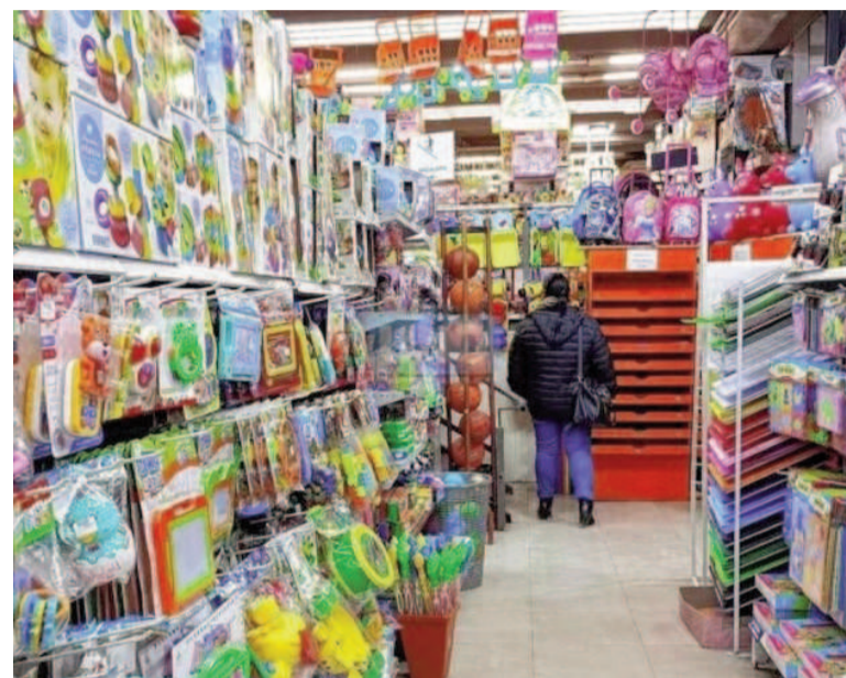
La venta de juguetes tuvo una leve alza del 1% frente al 2024, según CAME.

Además, especificó que "también se observó que en segmentos de mayor poder adquisitivo el ticket promedio resultó más alto, aunque igualmente limitado por la búsqueda de promociones agresivas", sosteniendo que "esta diversidad en las experiencias refuerza la idea de que la fecha no impacta de manera homogénea, sino que depende en gran medida del sector, la