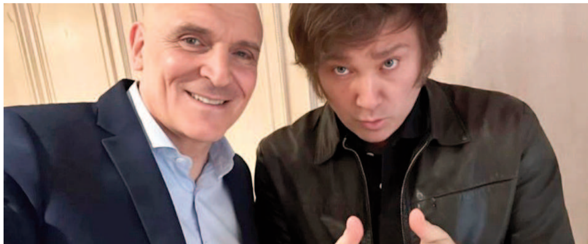
José Luis Espert, el alfíl libertario en provincia.