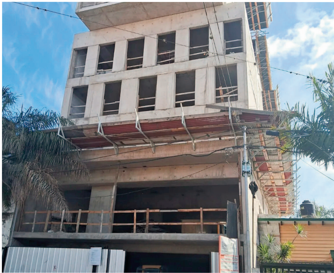
Cuatro obreros muertos al caer un montacargas.

Voceros policiales dijeron que el drama se desató ayer al mediodía en una obra de San Carlos al 1000. Hay un quinto operario herido.