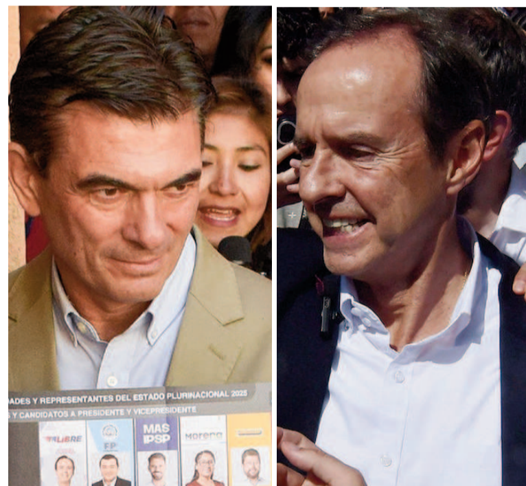
Habrá balotaje entre el senador Rodrigo Paz Pereira y Jorge "Tuto" Quiroga.

El candidato del Partido Demócrata Cristiano, Rodrigo Paz Pereira, se posicionó en primer lugar en la primera vuelta electoral con un 31,6% de los votos, seguido por Jorge Tuto Quiroga con 27,1%.