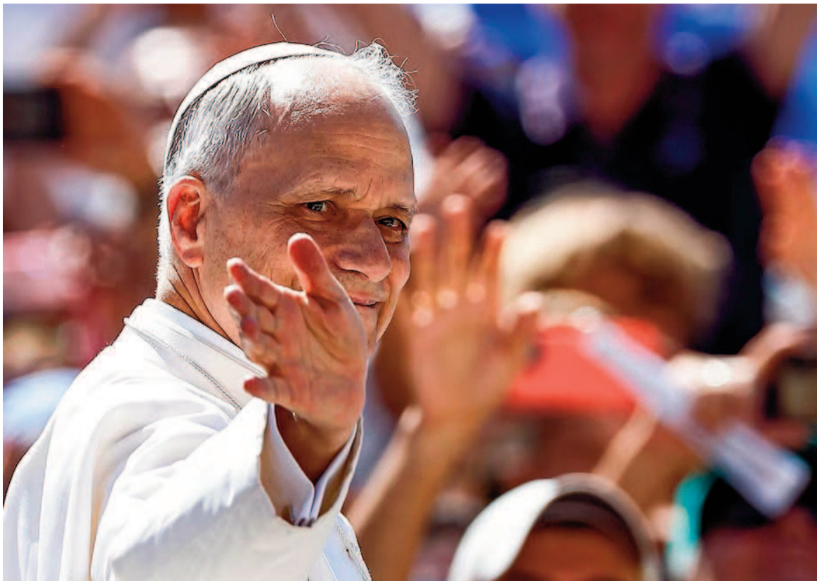
El papa León XIV volvió a pedir el cese de todas las guerras.

El papa León XIV expresó este domingo su deseo de que las negociaciones de paz y los esfuerzos para poner fin las guerras "tengan buen éxito", en un llamamiento realizado al finalizar el rezo del ángelus en Castel Gandolfo, a las afueras de Roma, donde pasa un periodo de descanso.