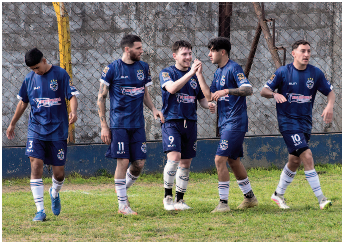
El equipo del Barrio fue contundente y consiguió su cuarta victoria al hilo.