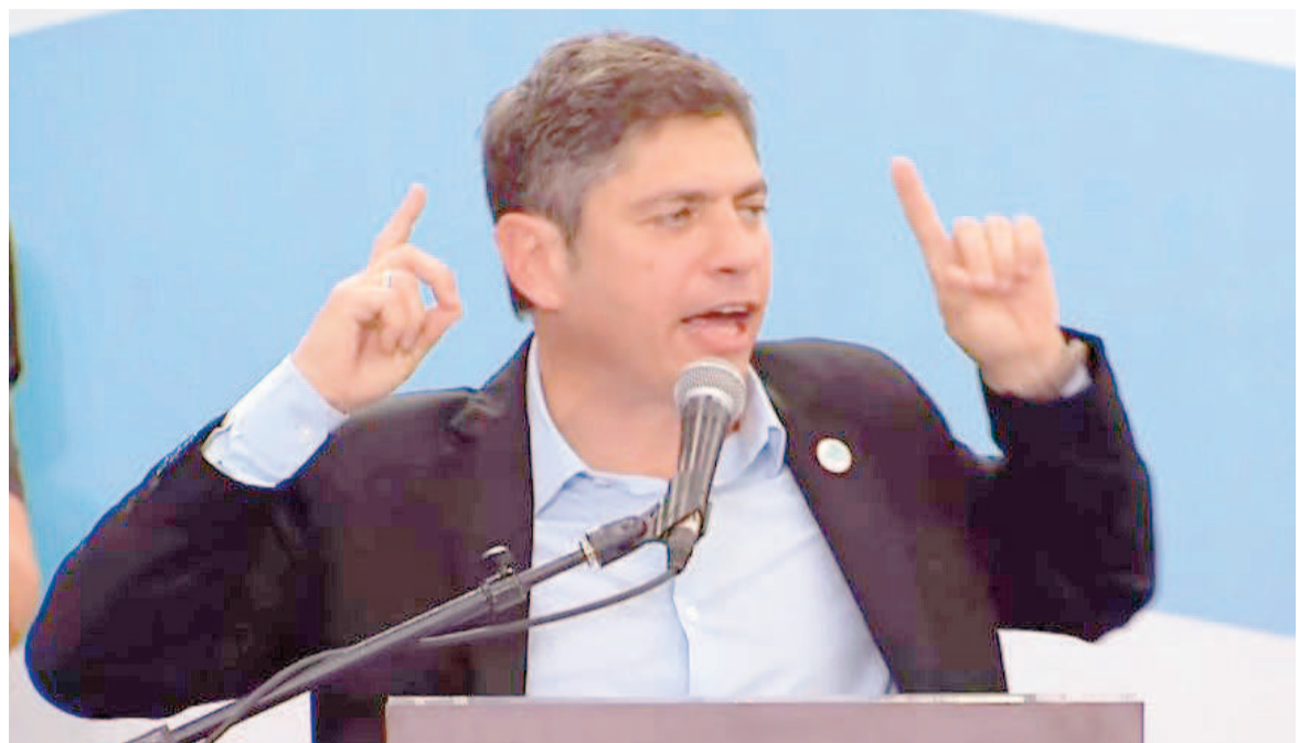
Gobernador Axel Kicillof.

Antes de que Kicillof pronunciara su discurso, se reprodujo un mensaje grabado por la expresidenta Cristina Fernández de Kirchner, que cumple la pena de prisión domiciliaria en su departamento del barrio porteño