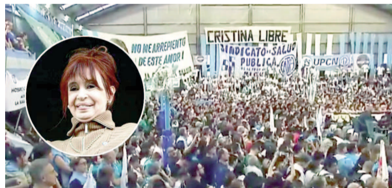
Cristina Fernández, irónica, en acto en Pilar.

para la jornada en Pilar, hizo un repaso por distintas situaciones que, según Kirchner, configuran una “catástrofe social”. Enumeró la quita de medicamentos gratuitos del PAMI, la interrupción de la entrega de psicofármacos y vacunas, y el colapso de la atención en hospitales públicos como consecuencia del aumento de la demanda. “Se ha incrementado la demanda de atención por parte de todos aquellos que han perdido el trabajo o que no pueden hacer frente al copago en las obras sociales o directamente a la cuota de la prepaga”, señaló.