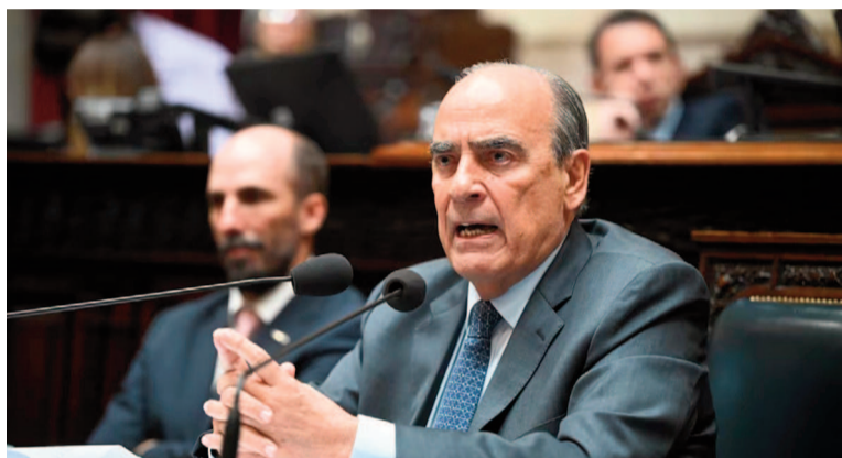
El ministro Guillermo Francos durante la sesión especial.

"Hoy, al apellidado Menem se lo vincula con hechos de corrupción que se enfocan sobre el Presidente y desgastan la imagen del Gobierno",