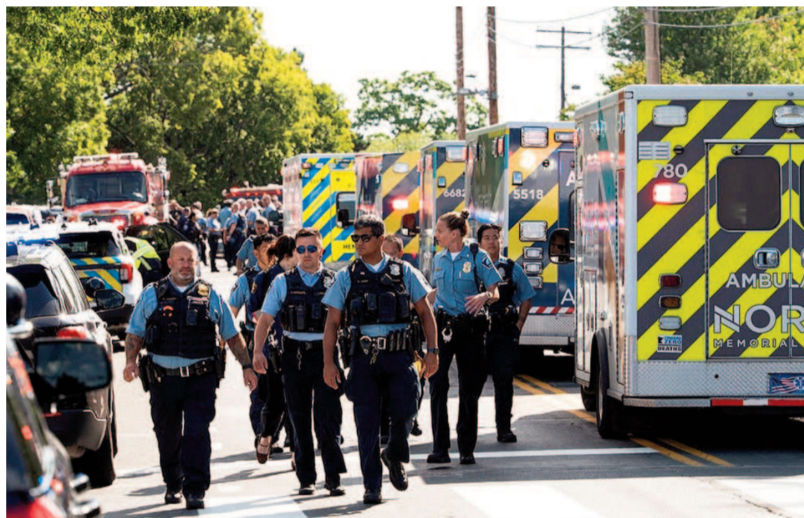
Tiroteo en una escuela católica de Minnesota.

En un episodio devastador ocurrido ayer miércoles, un hombre armado irrumpió durante una misa escolar en la Annunciation Catholic School de Minneapolis, matando a dos niños e hiriendo gravemente a otros 17. El atacante, que se quitó la vida, fue rápidamente neutralizado y las autoridades activaron un operativo masivo en el lugar.