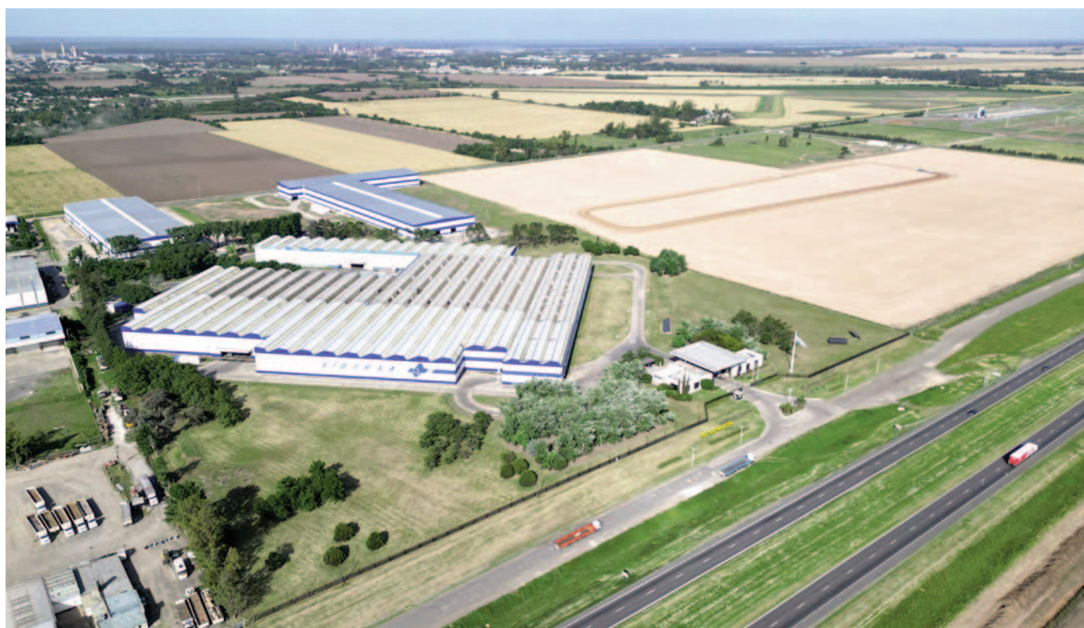
La nueva planta siderúrgica estará montada en el predio de Sidersa sobre la Ruta 9, cerca del cruce con la 188.

Sidersa anunció la puesta en marcha del proyecto «Sidersa+», que implica la construcción de una planta siderúrgica de última generación en San Nicolás y que demandará una inversión de 300 millones de dólares. Esta iniciativa recibió el pasado martes 22 de julio, a través de la Resolución 1028/2005 del Ministerio de Economía de la Nación, la aprobación dentro del Régimen de Incentivo para Grandes Inversiones (RIGI), lo que representa la primera presentación netamente industrial que se incorpora al citado régimen y, por su impacto económico, sus caracte-