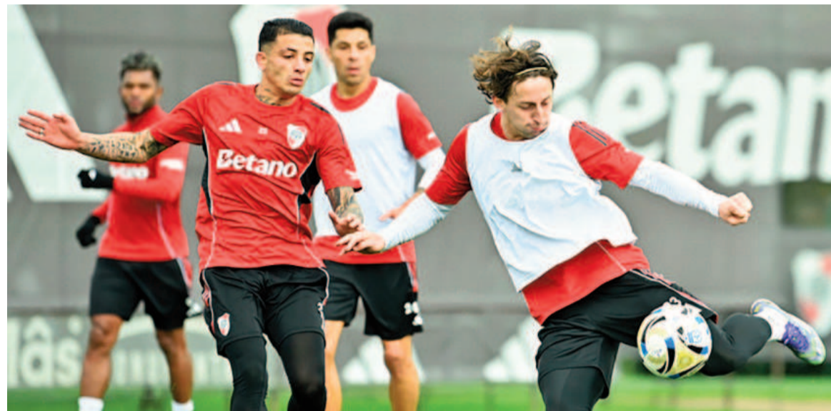
El millonario tendrá un duro escollo ante el tatengue.

Se enfrentarán hoy desde las 21.15 en el Malvinas Argentinas de Mendoza. Gallardo pondría tres delanteros netos buscando mejorar la imagen de las últimas presentaciones.