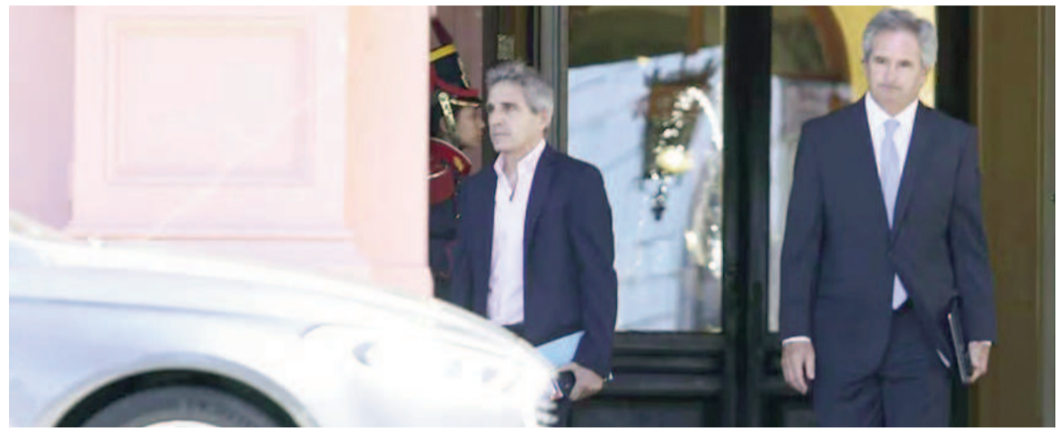
El ministro de Economía, Luis Caputo, saliendo de Casa Rosada.

El riesgo país se ubicó en torno a los 850 puntos básicos, 21 unidades por encima del cierre anterior, reflejando la cautela de los inversores frente a la licitación y al ruido político. "El dólar tiene poco combustible