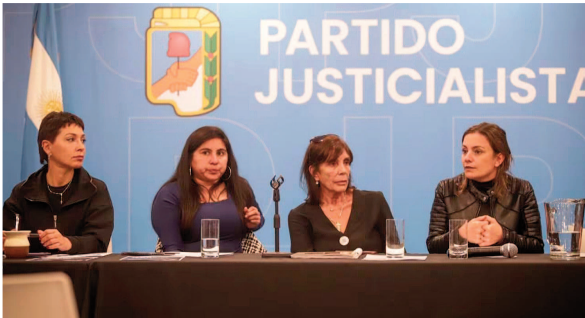
El ala dura kirchnerista se reunió en el PJ para definir la estrategia de campaña.

Las diferencias se hacen visibles cada vez que se presentan en público, pero también en reuniones a puertas cerradas. El kirchnerismo duro cree que no hablar de la condena de Cristina Kirchner es un "acto de ingratitud", además de perder la oportunidad de que confronte con el presidente Javier Milei, mientras que del otro lado de la grieta sostienen que "hay que hablarle a la gente que la está pasando mal". La Cámpora quiere tener presente a Cristina Kirchner en la campaña, aunque ella no pueda ser la candidata.