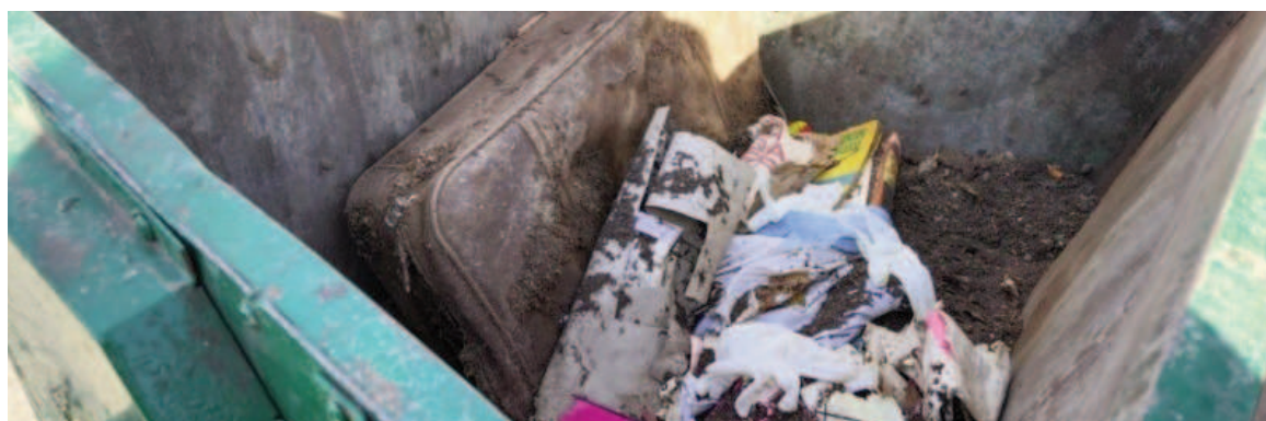
El hallazgo se produjo cuando un reciclador observó el contenido de una vieja valija.

también contenía revistas y otros objetos que habrían sido descartados por un vecino. El hallazgo se produjo al mediodía, cuando el reciclador observó el contenido y no dudó en llamar a la Central 911. Todo ocurrió a metros de la avenida 27 de Febrero. Se informó que los restos óseos tenían adherida tierra, al igual que la valija. Por lo pronto, los objetos fueron cautelados en dos bolsas negras de residuos y serán sometidos a peritajes para establecer la data de muerte.