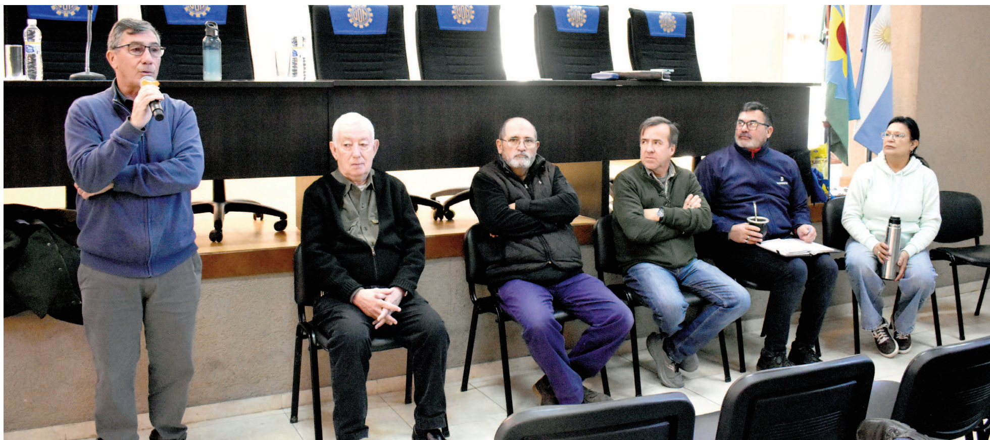
En el marco del conflicto, las audiencias de conciliación se vienen desarrollando en el Centro de Formación Laboral «Fray Luis Beltrán».