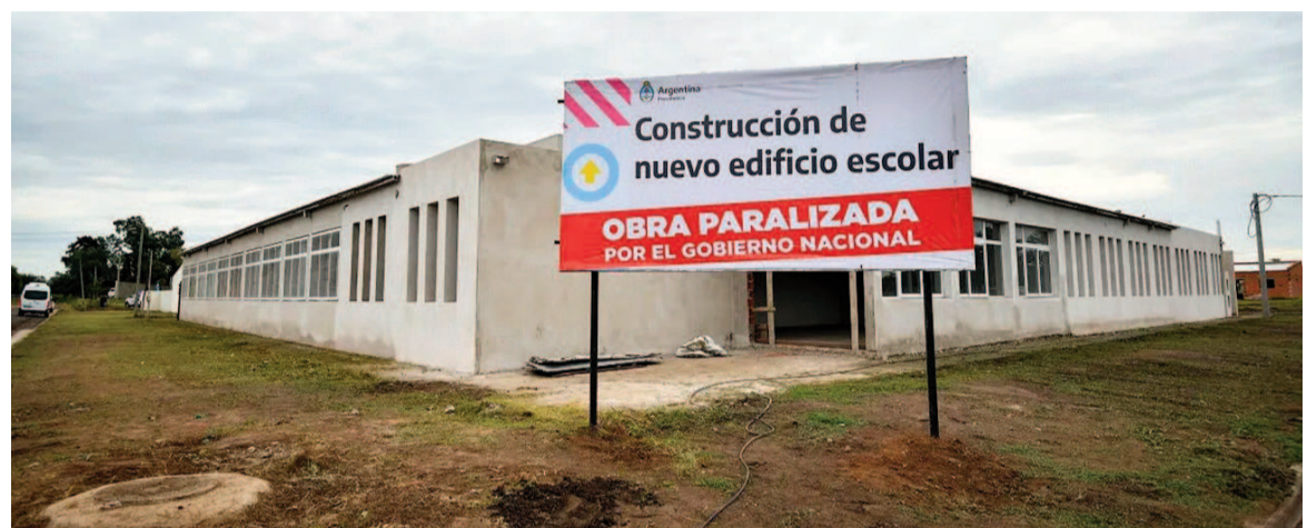
Mil obras detenidas: el impacto de la decisión de Milei en Buenos Aires.

tina Fernández de Kirchner mantiene un rol activo en la estrategia electoral, y su presencia -virtual- se espera en actos clave. El gobernador Kicillof también subió el tono y acusó a Milei de llevar adelante una "campaña roñosa" llena de fake news.