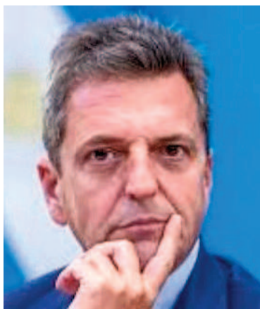
Massa desistió de participar en la próxima elección.

El massimo y Grabois habían protagonizado una interna ante las as-