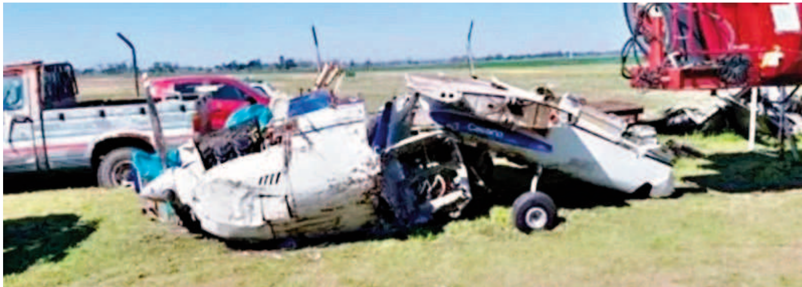
La avioneta estaba a la vera de la Ruta 8.

Los datos, citados por el medio Periodismo en bicicleta, revelan que el avión llevaba entre 7 y 10 días en el lugar. Esto fue determinado por el estado de las ramas que se usaron para camuflarlo, las cuales tardan ese tiempo en secarse, según indicaron las fuentes del caso. Además de los rastros del estupefaciente confirmados por pericias químicas luego de que los perros lo detectaran, las autoridades secuestraron luces led. De acuerdo con la