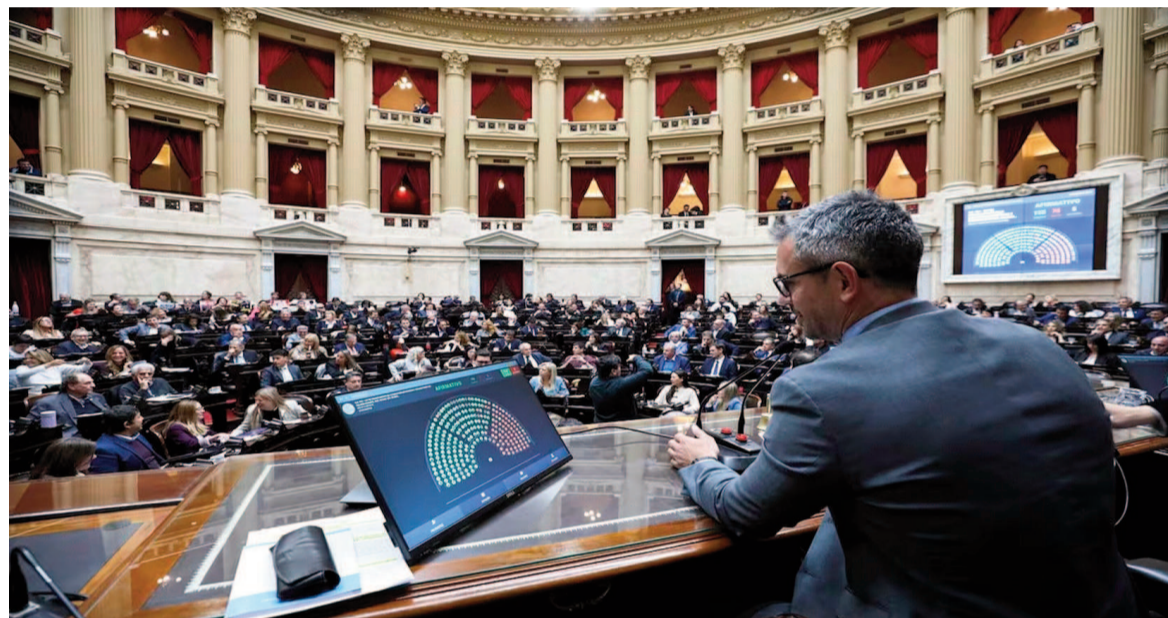
El recinto de Diputados, que preside Martín Menem.

Será en la próxima sesión, prevista para fines de agosto. Ambos proyectos cuentan con media sanción del Senado. En la Comisión de Presupuesto y Hacienda, que preside Espert, el bloque del PRO mostró unidad, pero el frente de los mandatarios provinciales exhibió algunas diferencias.