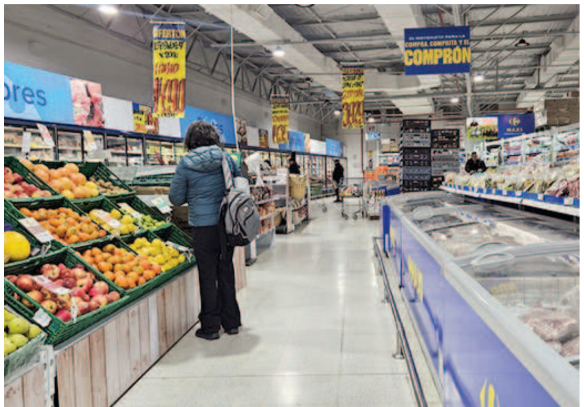
En los primeros 7 meses de 2025, el IPC acumuló un alza de 17,3%.

Según el Relevamiento de Expectativas de Mercado (REM) del Banco Central, que recoge las proyecciones