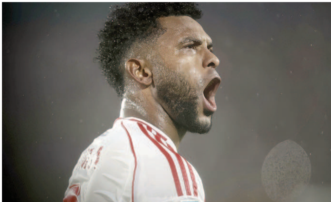
El equipo de Núñez se medirá ante el albino paraguayo en Asunción.

El Millonario jugará por octavos de final hoy desde las 21.30. La única duda de Gallardo en la formación está en el mediocampo, donde el colombiano Juanfer Quintero, Galoppo y Matías Galarza Fonda disputan un lugar sobre la franja izquierda.