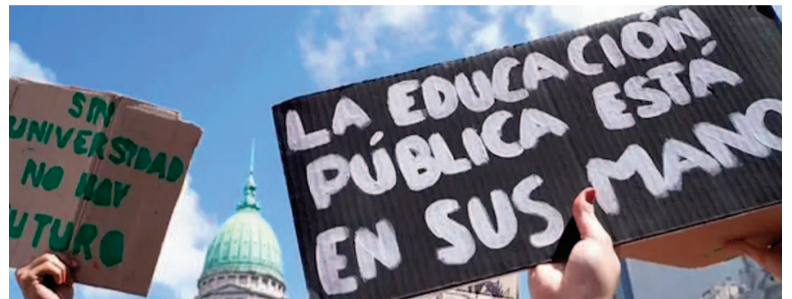
Aumento del 7,5% a los docentes y no docentes universitarios.

El Gobierno nacional anunció el aumento del 7,5% de los salarios para los docentes y no docentes de las universidades nacionales. El otorgamiento se dará entre septiembre y noviembre. La novedad fue confirmada por el Ministerio de Capital Humano, a través de la Subsecretaría de Políticas Universitarias. Previamente, el personal de las universidades realizó un paro hoy, con motivo salarial y contra el ajuste de Javier Milei. De esta manera, la medida incluye un 3,95% en los salarios de agosto. Además, de forma complementaria se dispuso que el personal no docente percibirá sumas fijas excepcionales de $25.000 por cargo. En el caso del personal docente, las deducciones exclusivas percibirán la suma fija excepcional de $25.000 por cargo, quedando asignado de forma