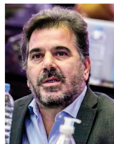
Diputado Cristian Ritondo.

En este marco, Cristian Ritondo aclaró que María Eugenia Vidal no está de acuerdo con el pacto en CABA», mientras que en PBA lo «entiende» porque «va a estar el kirchnerismo enfrente». Además, el diputado agregó: «Las veces que se firmaron alianzas electorales, para las provinciales y las nacionales,