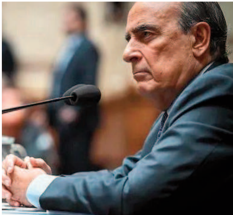
El jefe de Gabinete Guillermo Francos.

audios, Francos admitió que, de confirmarse que provinieran de dentro de la Casa Rosada, sería un hecho "grave" y "sin precedente", ya sea responsabilidad de un funcionario o de un visitante. Anticipó que el