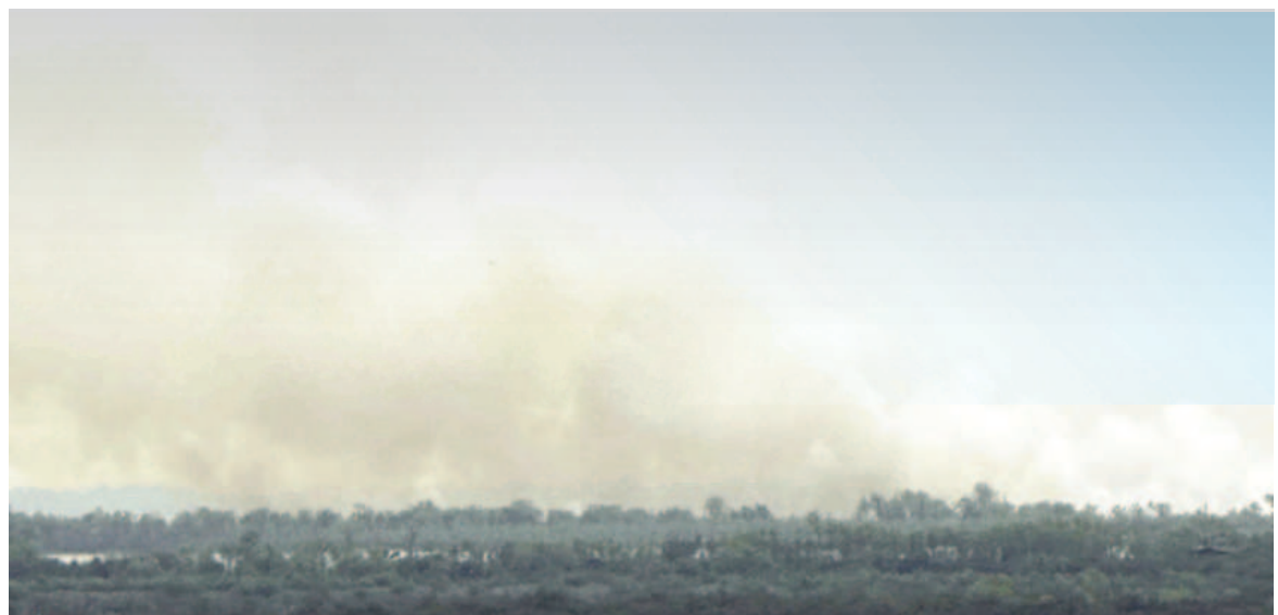
El humo de los incendios se pudo apreciar desde el continente.

Los focos ígneos se desarrollan en la zona de islas del departamento Victoria, en Entre Ríos. Allí se concentran la mayoría de los incendios que afectan al delta del Paraná y que ya se habían detectado en jornadas anteriores.