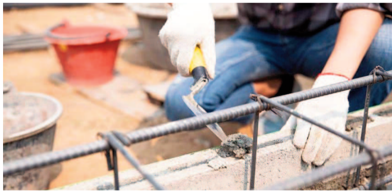
Preocupa la caída en la construcción.

El ministro de Economía bonaerense, Pablo López, alertó sobre la fuerte crisis que atraviesa la construcción en la Provincia de Buenos Aires desde la asunción del presidente Javier Milei.