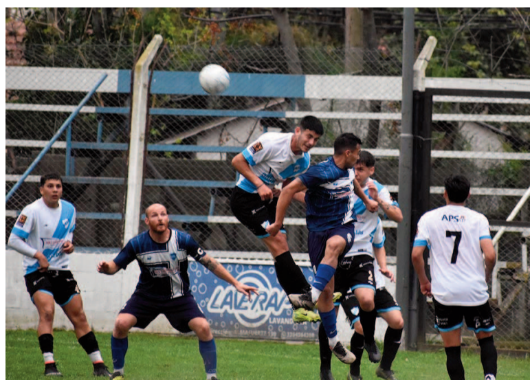
Paraná y San Martín repartieron puntos. EL NORTE