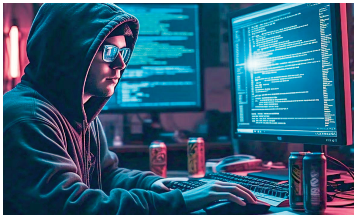
El malware, bautizado como PromptLock, usa IA para cambiar su código y esquivar los sistemas de seguridad tradicionales.

La inteligencia artificial (IA) ya revolucionó la música, los libros y hasta los videojuegos. Pero ahora, el lado oscuro de la tecnología dio un paso más: investigadores de ESET Research detectaron el primer ransomware creado con ayuda de una IA, capaz de evadir los antivirus más avanzados.