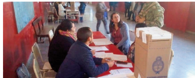
Capacitan a autoridades de mesa.

Este esquema integral se implementó por primera vez en las elecciones de 2023 y, este año, contempla la coordinación entre el Juzgado Federal N°1 de La Plata, la Cámara Nacional Electoral, la Junta Electoral de la provincia de Buenos Aires, el Instituto de Capacitación Judicial de la Corte Suprema bonaerense, el Gobierno provincial —a través del Programa "Puentes" y la Dirección General de Cultura y Educación—, las universidades públicas nacionales y provinciales con sede en la provincia, y la