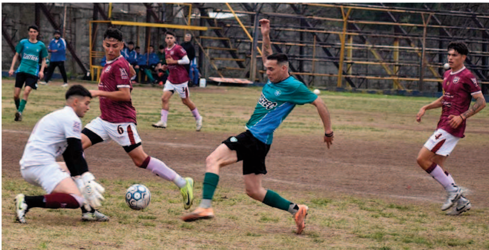
Los de la Estación dieron el batacazo de la jornada. EL NORTE

Por su parte, en Villa Ramallo, La Emilia consiguió un triunfo ante Los Andes, jugando más de un tiempo con dos futbolistas menos por las expulsiones de Gonzalo Cres-