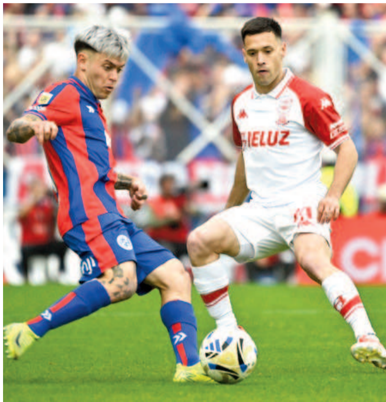
El Santo de Boedo debió conformarse con una igualdad. WEB

De esta manera, San Lorenzo, que venía de ganarle 1-0 como local a Instituto de Córdoba, dejó pasar una muy buena oportuni-