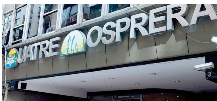
Investigan acciones gubernamentales contra UATRE.