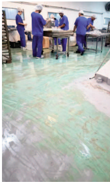
Empleados de los laboratorios de García Furfaro relataron las condiciones en las que operaba la planta de producción de medicamento y aportaron fotos.

“En Ramallo nos conocemos todos, y los García tienen poder y