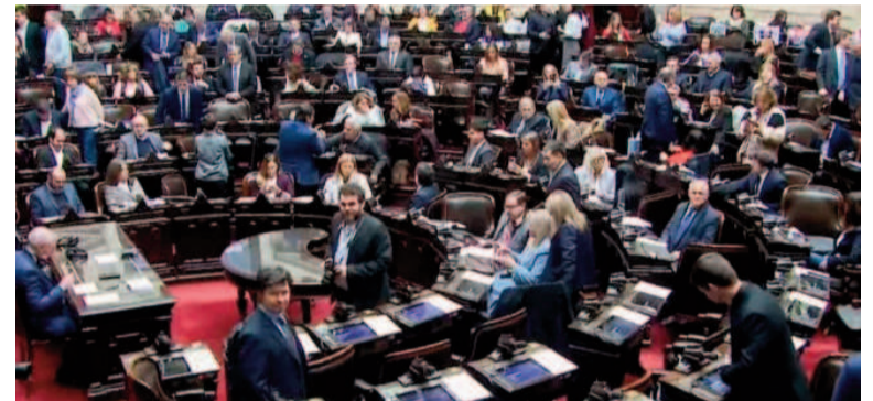
La oposición se prepara para volver a arrinconar al Presidente.

Tras la aprobación de la Emergencia en Pediatría, la oposición forzó, asimismo, el tratamiento en comisión de otro proyecto de ley que busca una