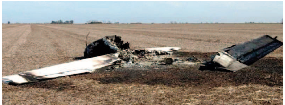
Los restos de otra aeronave, en este caso hallada en un campo de La Vanguardia.

El viernes por la tarde, un productor agropecuario advirtió la presencia de los restos de una aeronave oculta en el campo que arrienda. Es el tercer avión fantasma que aparece abandonado en solo tres meses entre el sur santafesino y el norte bonaerense.