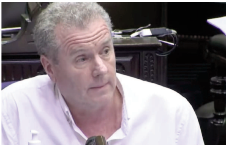
El diputado Gerardo Milman.

En medio de la pulseada política por el veto presidencial al aumento de las jubilaciones, el PRO reactivó un proyecto para poner fin a las asignaciones vitalicias que cobran quienes ocuparon los más altos cargos del país. La propuesta, firmada por el diputado bonaerense Gerardo Milman, apunta a derogar un régimen que —según sus fundamentos— resulta "inmoral, injustificable e incompatible