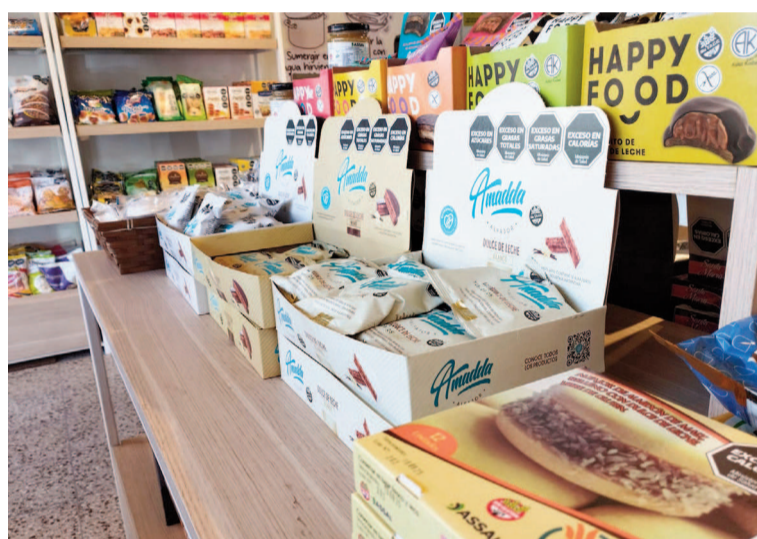
“La gran mayoría de los productos industrializados libres de gluten vienen del exterior porque acá no se fabrican”, sostienen comerciantes locales. EL NORTE

En cuanto a los precios, además de las pretensiones de ganancia propias de cada comercio, marcaron que se deben principalmente a la dificultad de acceso a los productos y materias primas para la elaboración. “La gran mayoría de los productos industrializados vienen del exterior porque acá no se fabrican. A nivel nacional hay muy pocas industrias de productos libres de gluten, en comparación con las cientos o miles de industrias que elaboran