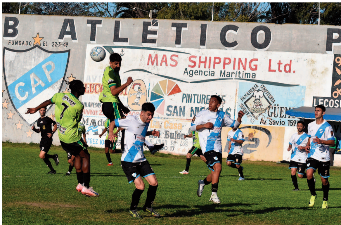
Hoy se jugarán ocho partidos en el ámbito del fútbol de Primera. EL NORTE

El otro puntero, Defensores, chocará con el siempre duro 12 de Octubre en Soler y América. El Granate debutó venciendo a Conesa como visitante y la semana pasada derrotó como local a San Martín. Con la base del equipo que llegó a semis en el Apertura, los de Villa Ramallo apuntan una vez más a ir por el título. Hoy tendrán enfrente a un Doce renovado, que ganó en el debut pero que en la fecha pasada fue