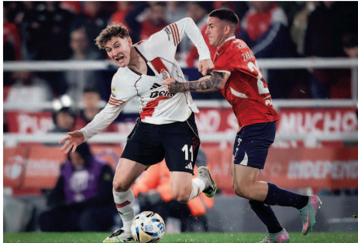
El Rojo tuvo las mejores chances en el clásico. WEB

En un partido en el que hubo tres goles anulados por offside, el Rojo y el millonario finalizaron 0 a 0, en un partido en el que el equipo de Julio Vaccari fue un poco más.