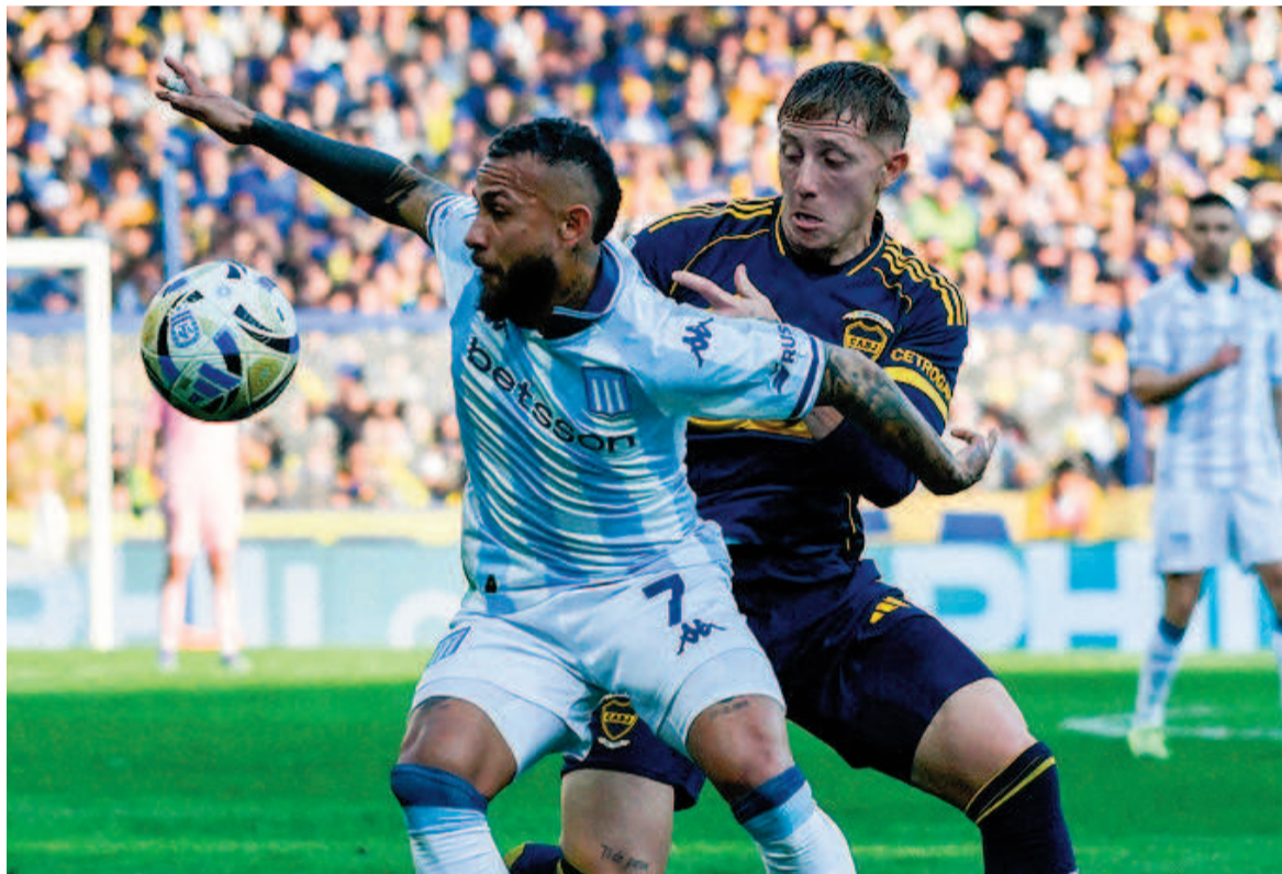
El xeneize estiró a doce encuentros al hilo su racha sin triunfos. WEB

En el complemento, la visita logró ponerse en ventaja a los 31 minutos con un rebote en el área, el cual fue capitalizado por Solari, que definió para el 1-0. Boca reaccionó y, tras varios intentos frustrados ante Cambeses, encontró la igualdad a los 43 minutos con un cabezazo de Giménez