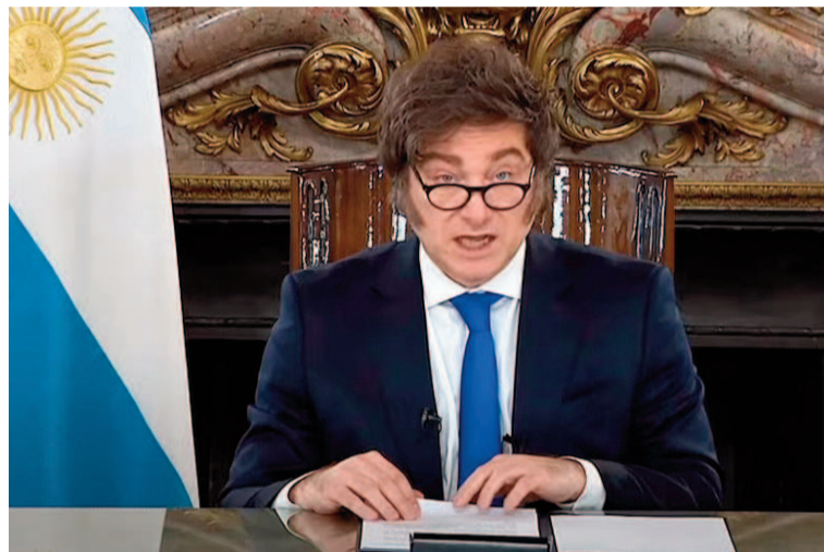
El presidente Javier Milei en su última cadena nacional.

Según él, el dinero “no es nada más que un bien de intercambio indirecto y que sólo sirve a los efectos de llevar a cabo transacciones, sean las mismas presentes (demanda transaccional) y/o futuras (atesoramiento). Por lo tanto, si entendemos esto, la demanda de dinero es una demanda derivada de la demanda total de bienes y servicios de la economía o dicho de modo más simple, es una demanda espejo”.