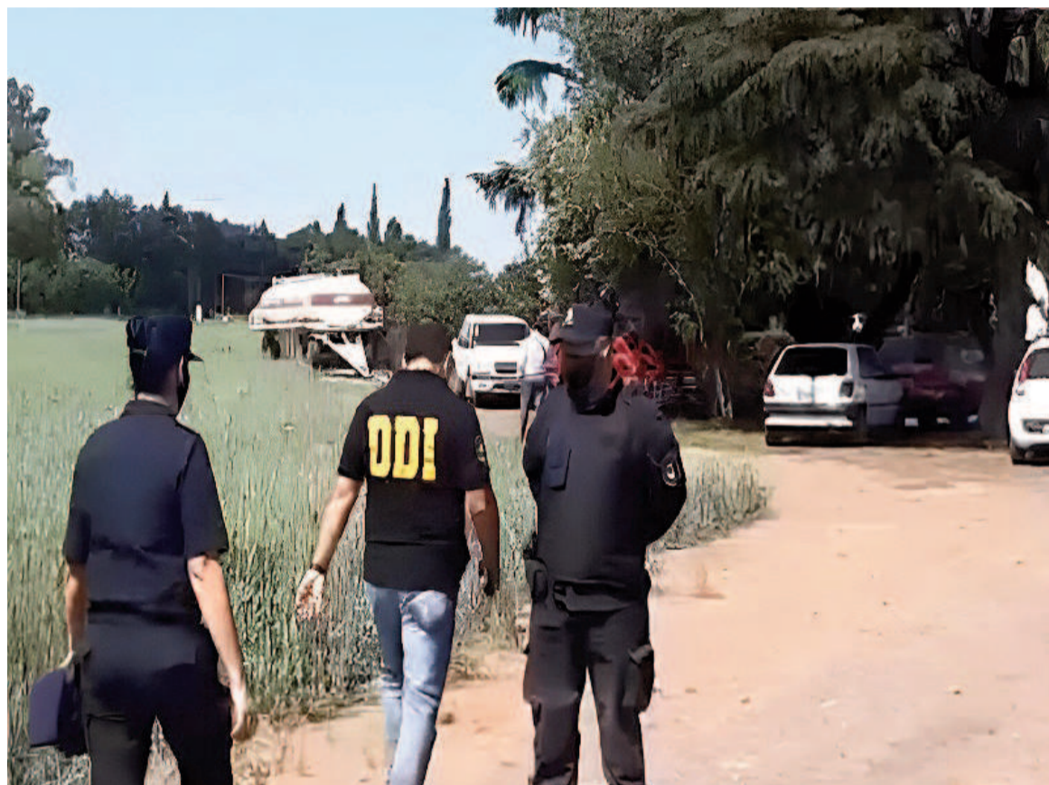
Sobre el crimen de Juan Donato, ocurrido en 2020.

Los cuerpos de Nasif, de 55 años, y de Ramírez, de 31, habían sido masacrados en una de las habitaciones de la casa y la caja fuerte donde antes se habrían guardado 84.000 dólares estaba abierta y vacía. El hombre tenía al menos un impacto de bala en la cara y otro orificio en