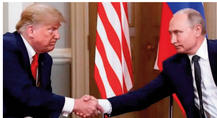
Los mandatarios de EE.UU. y Rusia ya mantuvieron varios encuentros.

"Esta guerra debe terminar, y Rusia debe terminarla. Rusia la