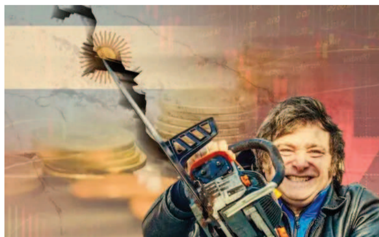
La motosierra sigue vigente para el gasto en obra pública.

Analytica dice que "el 57,6% del gasto restante -transferencias a provincias, empresas públicas, universidades, entre otros- disminuyeron un 63,3%".