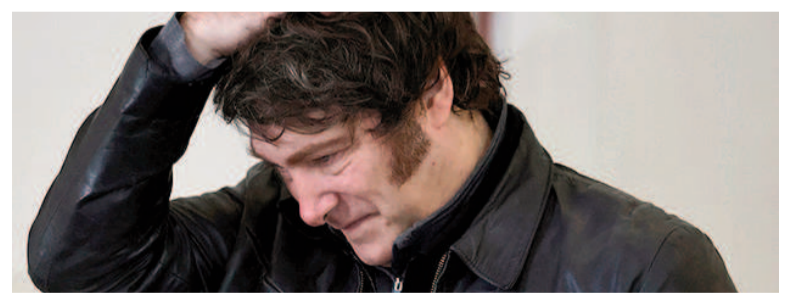
Los números no le cierran a Milei.

Otro factor que también influye en la caída de la popularidad del presidente descansa en la baja de las expectativas acerca de las mejoras económicas en el corto plazo. Para ser más concreto, es importante mencionar que el 55 por ciento de los argentinos no creen que la economía pueda perfeccionarse en los próximos meses. Dicho en otras palabras, muchos de sus simpatizantes periféricos han empezado a desconfiar. El dato más duro, que evidencia el mal