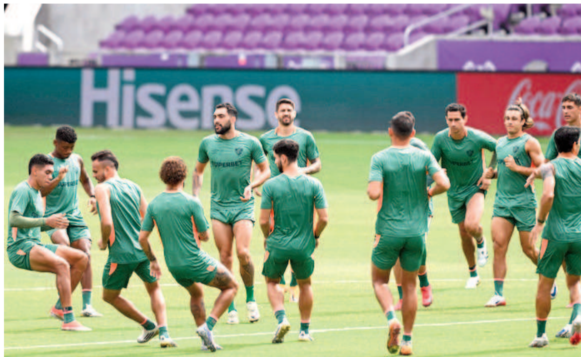
Fluminense se prepara para enfrentar al Al Hilal.

Fluminense se mide con el Al Hilal de Arabia Saudita y Palmeiras frente al Chelsea. Los dos equipos brasileños son los únicos representantes del fútbol sudamericano, y de ganar se enfrentarán entre sí en semifinales, asegurando un lugar en la final.