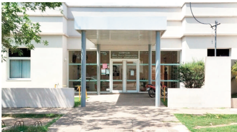
Hospital José María Gomendio.

"El hospital tiene deteriorada la atención. Tenemos muchos médicos que vienen a trabajar con contratos poco claros, por tiempo determinado y montos a percibir diferentes a los profesionales de planta permanente. En algunos casos con cifras mucho más altas que algunos médicos que vienen trabajando hace años en el hospital. Esto trae una diferenciación entre los propios colegas. Un mé-