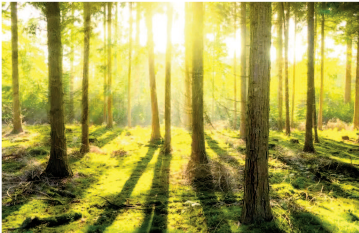
El dióxido de carbono es un componente clave del calentamiento global, por lo que su captura por bosques se ha vuelto crucial en la lucha contra el cambio climático.

Los mapas, con resolución de 1 kilómetro cuadrado, fueron construidos a partir de más de 100.000 mediciones de campo y un modelo que incorpora 66 variables ambientales "que cubren clima, propiedades del suelo, radiación, topografía y bio-