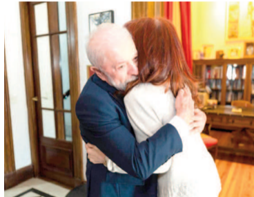
Lula Da Silva y Cristina Fernández de Kirchner.

Continuó: “Los ojos del mundo están viendo con atención como la ARGENTINA VIVE UNA AUTÉNTICA DERIVA AUTORITARIA DE LA MANO DEL GOBIERNO DE MILEI; EN LO QUE PODEMOS IDENTIFICAR COMO TERRORISMO DE ES-