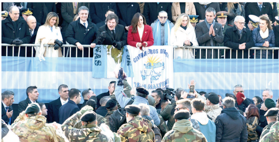
EL GOBIERNO SUSPENDIÓ EL DESFILE MILITAR DEL 9 DE JULIO