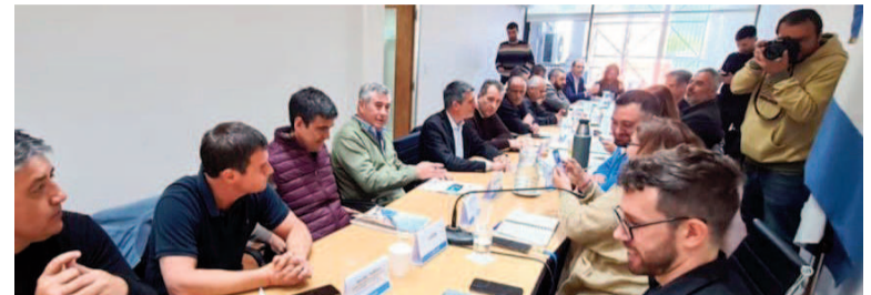
Los gremios y el Gobierno bonaerense se encontrarán el martes próximo.

Los gremios bonaerenses se verán las caras con los integrantes del Ejecutivo para encarar una nueva actualización salarial