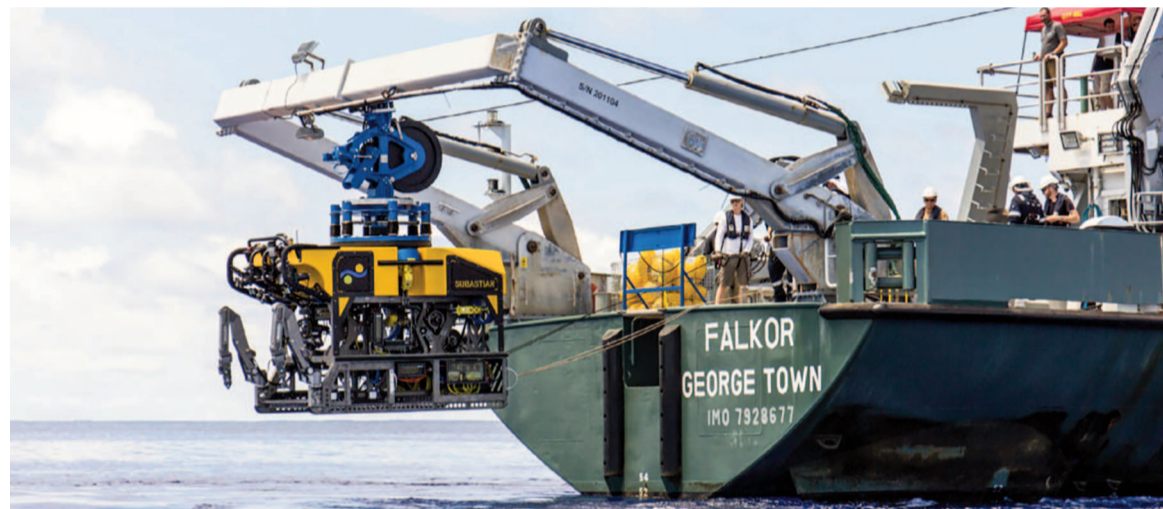
El ROV SuBastian desciende casi 4000 metros, en el Cañón de Mar del Plata, transmitiendo en vivo.

Tras el furor del primer streaming, investigadores del Conicet concretaron ayer una nueva emisión en tiempo real desde las profundidades del Cañón de Mar del Plata.