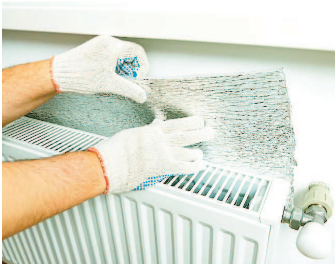
Colocar con cuidado detrás de un radiador un papel o placa de aluminio.

asegurándote de que no toque partes calientes del equipo para evitar riesgos. Podés sujetarlo con cinta, ganchos o apoyarlo directamente si queda firme.