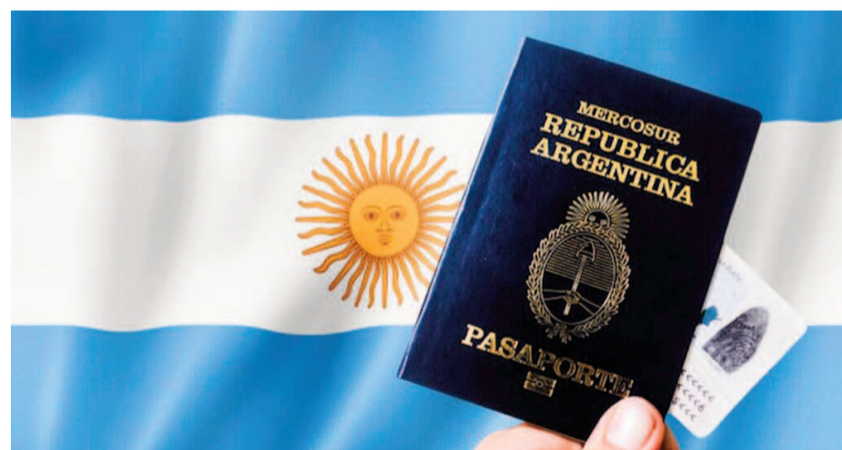
Inversiones extranjeras igual a ciudadanía argentina.

El Gobierno nacional anunció este jueves una nueva medida que busca flexibilizar las condiciones para los extranjeros que realicen una inversión “relevante” en el país y que a cambio puedan obtener la ciudadanía argentina.