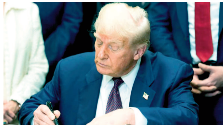
Trump anunció que la Argentina deberá pagar 10% a sus exportaciones.

biernos de Javier Milei y Donald Trump se profundizaron en las últimas semanas.