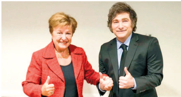
El FMI aprobó el acuerdo con Argentina.

«Cabe destacar que Argentina ha recuperado el acceso a los mercados internacionales de capital antes de lo previsto, aunque los diferenciales de tipos de interés siguen siendo elevados», aseveró.