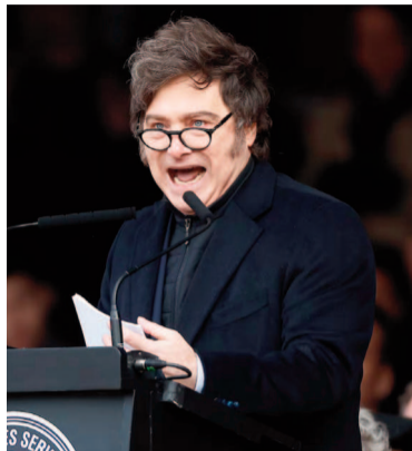
La baja de las retenciones la prometió Milei en La Rural.

La reducción en el gravámen resulta necesaria para “continuar fortaleciendo el impulso agroexportador del sector agroindustrial”. El Ejecutivo aclaró además que entiende a los derechos de exportación como un