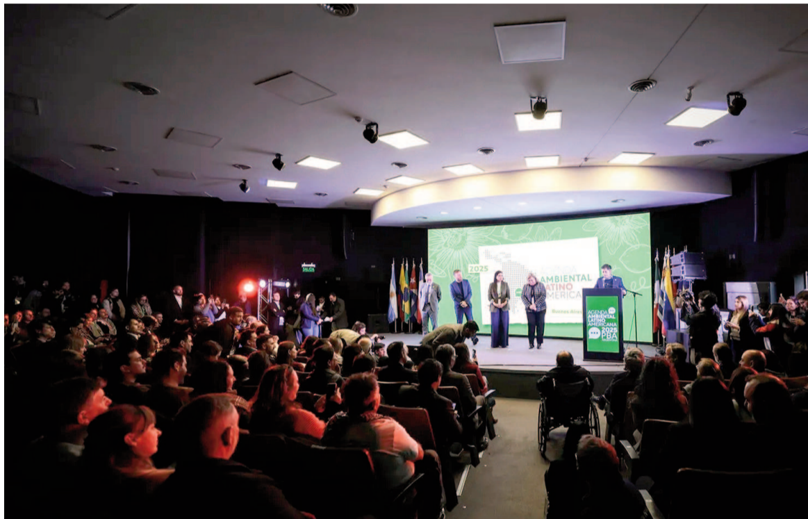
Kicillof abrió la PreCOP con duras críticas al Gobierno por el cambio climático.

El gobernador bonaerense abrió la PreCOP en Lomas y cruzó fuerte a Milei por negar el cambio climático. "No vamos a permitir el negacionismo", disparó.