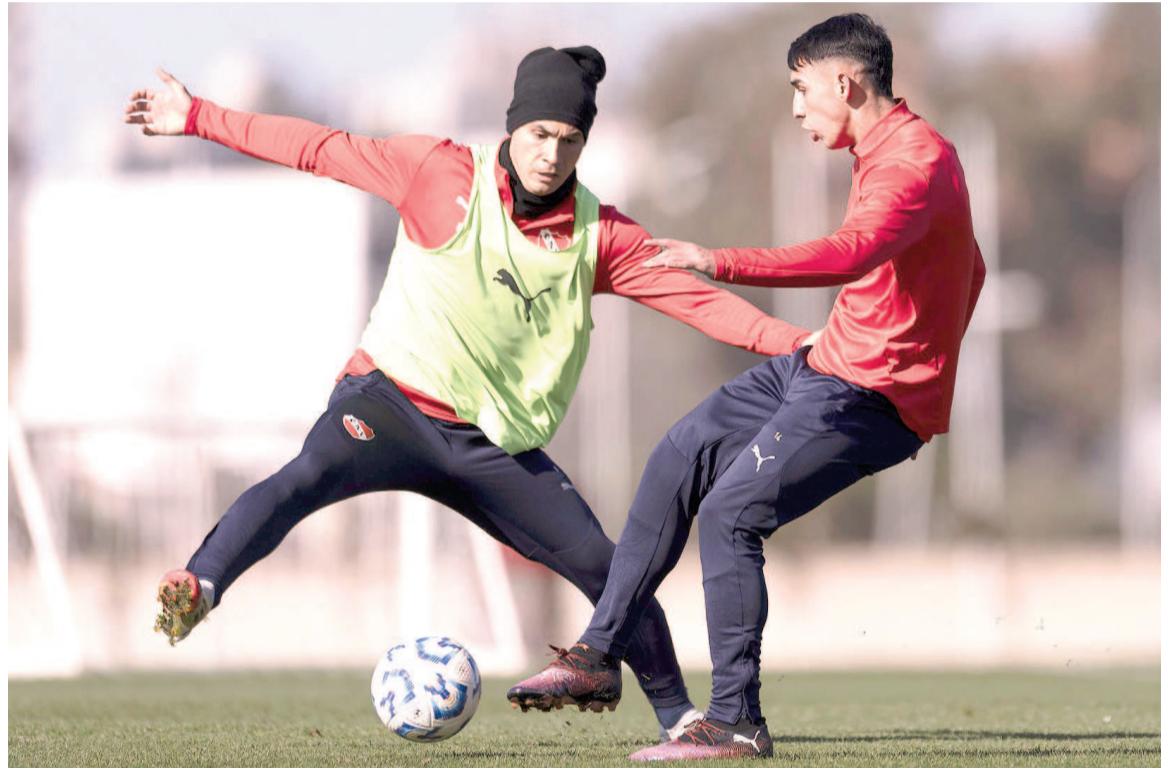
El Rojo quiere seguir su camino en la Copa. WEB

El "Rojo" viene de sufrir dos derrotas consecutivas en el Torneo Clausura y ya no quiere más sorpresas. Hoy enfrenta al Pirata cordobés desde las 18.15 en Rosario, por los 16avos de final de la Copa Argentina.