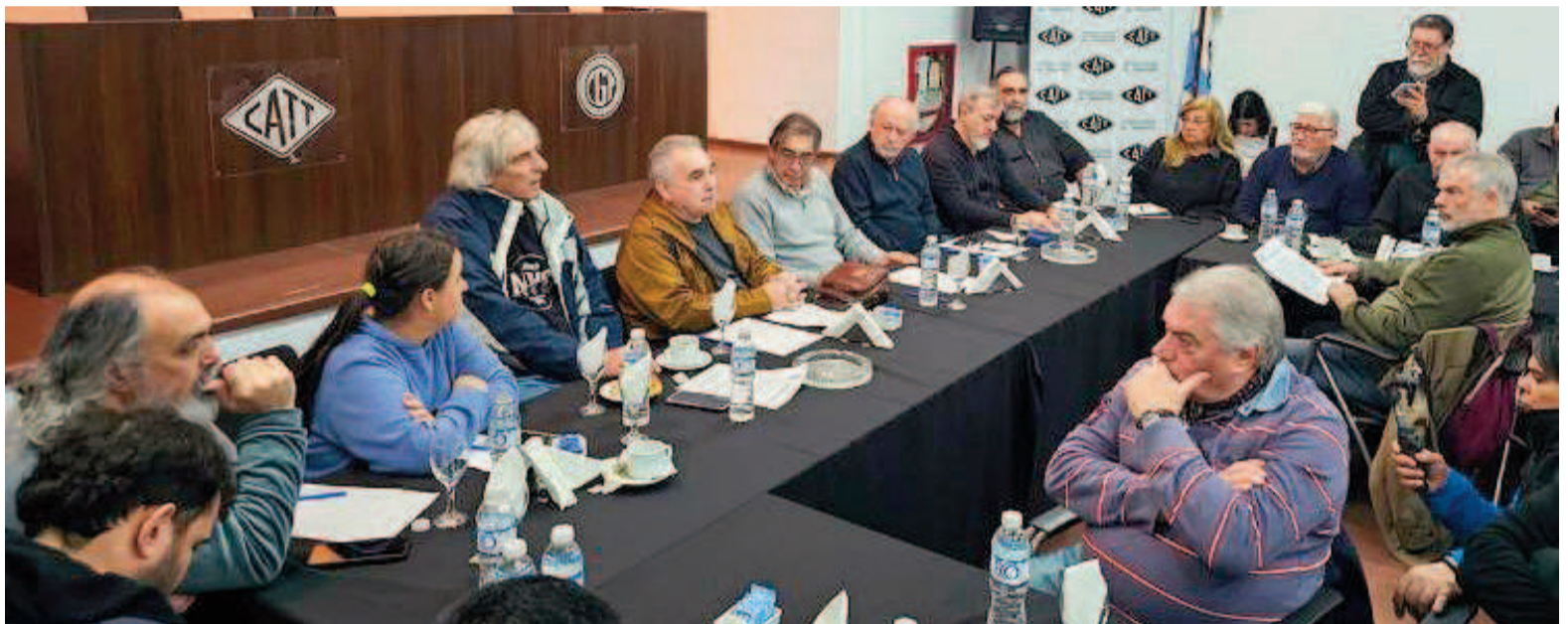
Los referentes sindicales confirmaron la marcha del 7 de agosto.

Ayer a la mañana, y con la presencia de los movimientos sociales que conforman el Frente de Lucha por la Soberanía, el Trabajo Digno y el Salario Justo, los sindicatos confirmaron que se congregarán el próximo jueves 7 de agosto, a las 8.00hs., en la iglesia San Cayetano, situada en el barrio porteño de Liniers, para dirigirse hacia Plaza de Mayo.