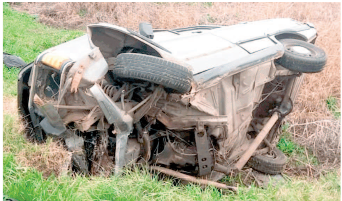
Falleció Daniel Badía, expolicía de Conesa, tras volcar con su auto.

La víctima tenía 33 años y murió en el acto luego de perder el control de su vehículo y volcar sobre la ruta.