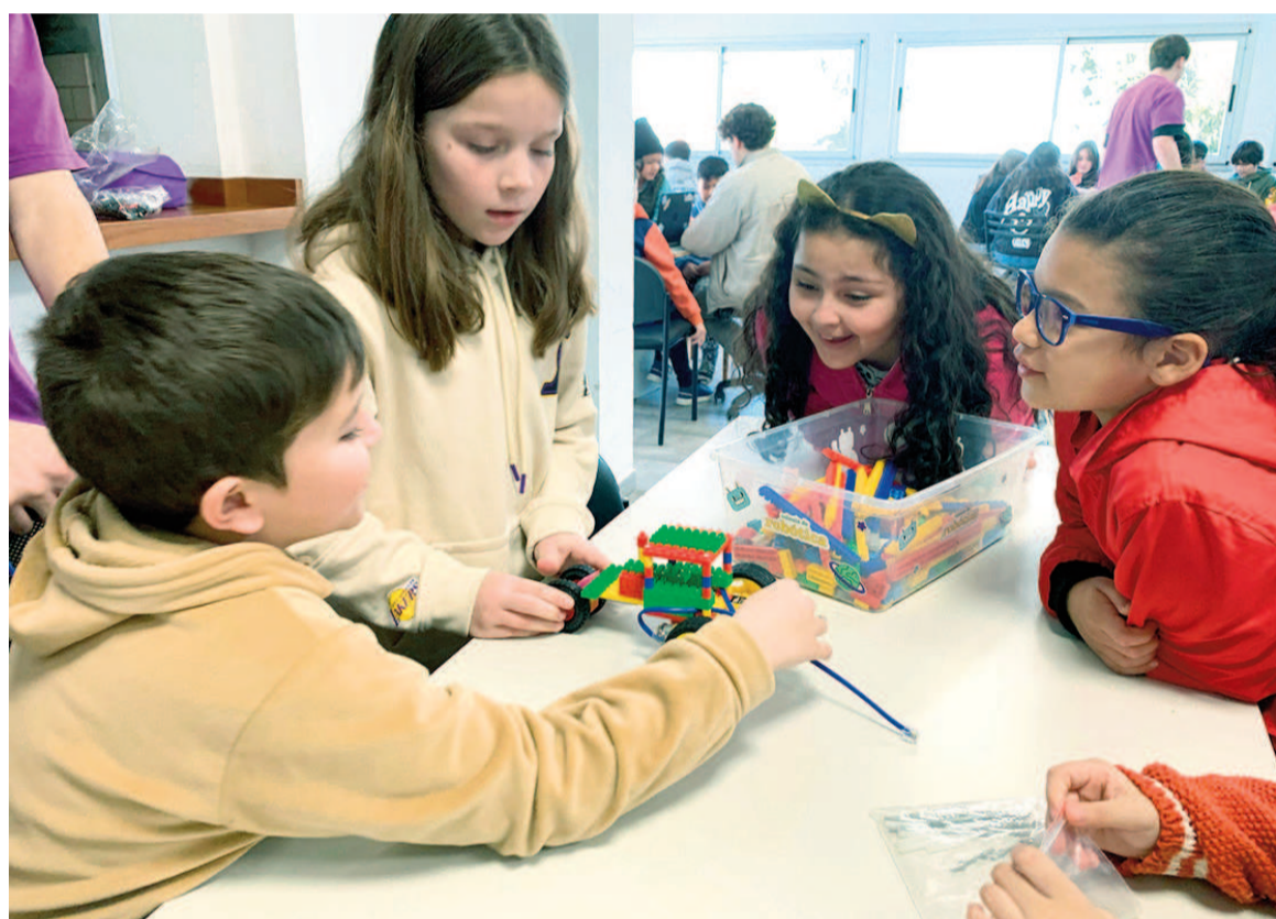
En la colonia se enseña a los niños, mediante juegos didácticos, programación, coordinación de equipo y robótica.