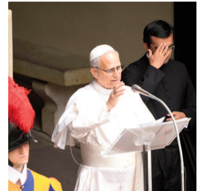
León XIV expresó su «profunda tristeza» por lo ocurrido.