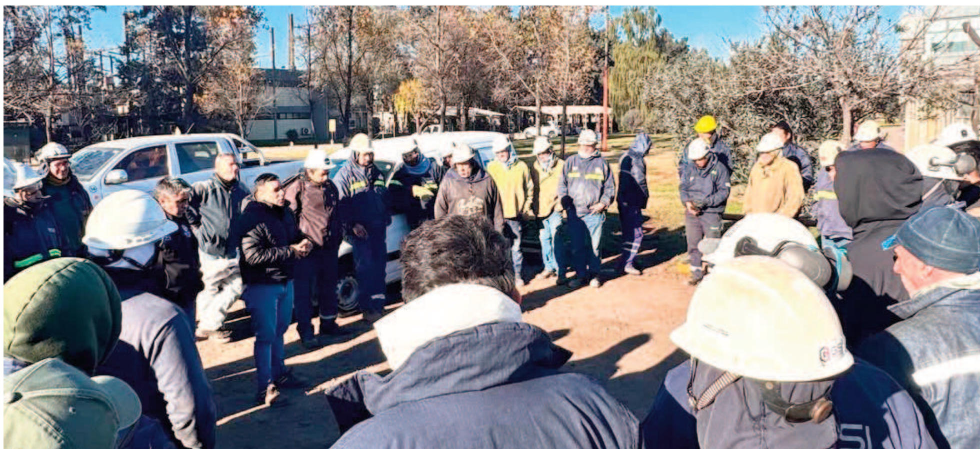
Tras un paro en Acindar, trabajadores contratistas de la Rama 17 se mantienen en estado de alerta en Villa Constitución.

Las gigantes siderúrgicas de la región afrontan dificultades propias de sendos conflictos laborales entre la Unión Obrera Metalúrgica y las empresas contratistas de ambas acerías. En Ternium, una conciliación obligatoria desactivó una retención de tareas que hubiera afectado a medio centenar de empresas que prestan servicios en la planta General Savio. En Acindar hubo paro y la seccional villense se mantiene en “estado de alerta”.