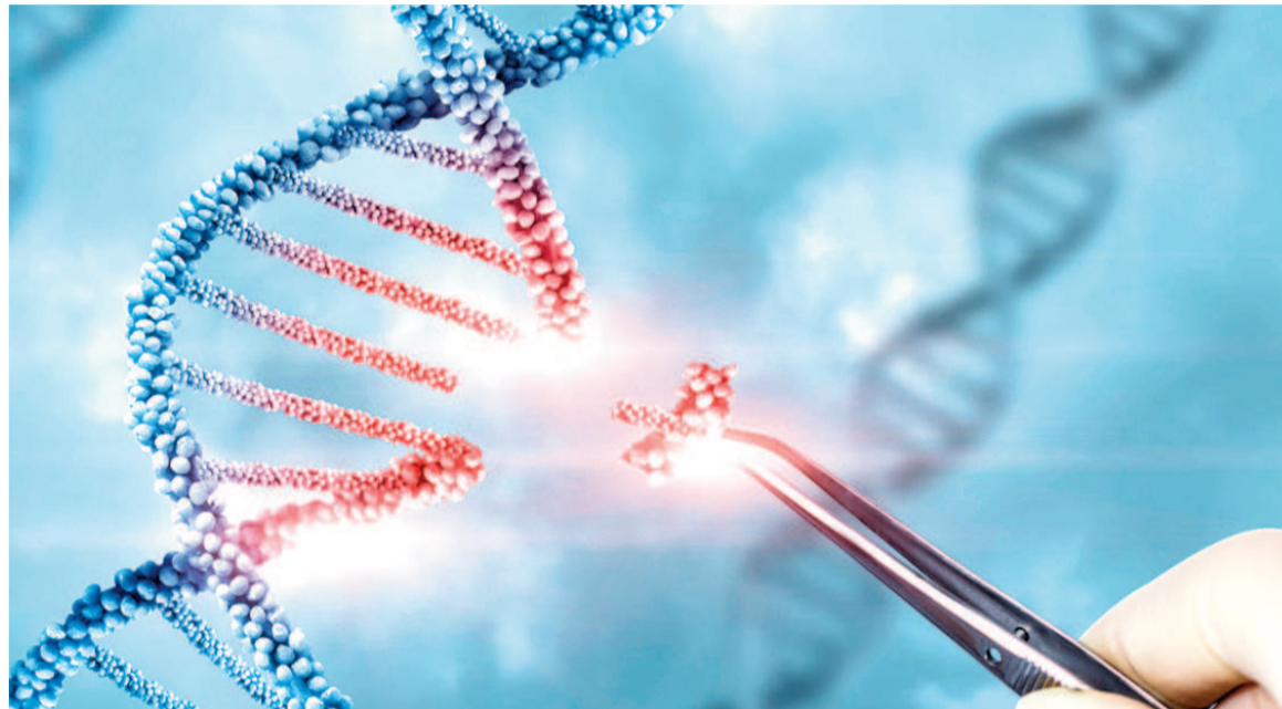
La tecnología NGS está transformando la forma de prevenir y de diagnosticar enfermedades.