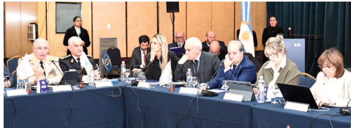
La ministra Patricia Bullrich encabezó ayer la reunión del Consejo de Seguridad Nacional

La ministra lo expresó tras encabezar la reunión del Consejo de Seguridad que reúne a la Nación y a los 24 ministros de Seguridad de las provincias.