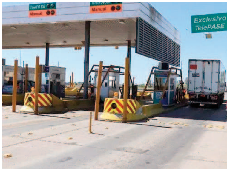
El Gobierno sigue allanando el camino hacia la privatización.

La transformación de Corredores Viales se inscribe en un proceso más amplio de reestructuración del sistema nacional de transporte, que incluye la disolución o reformulación de organismos históricos como la Dirección Nacional de Vialidad, la Agencia Nacional de Seguridad