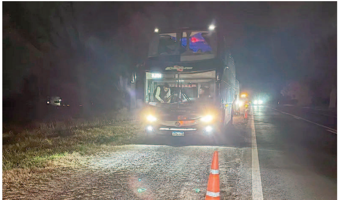
La llanta de una rueda impactó en el rostro y la cabeza de un joven.