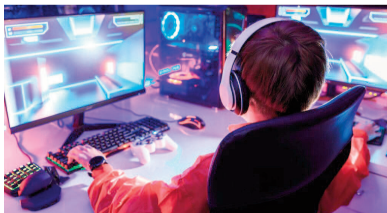
Uno de los componentes más estudiados del síndrome gamer es el Game Transfer Phenomena (GTP).

El otro componente del síndrome gamer es su impacto físico. La fatiga visual digital, conocida también como síndrome visual del informático, es reconocida por la American Optometric Association (AOA) como un cuadro asociado a la exposición prolongada a dispositivos electrónicos sin pausas suficientes.