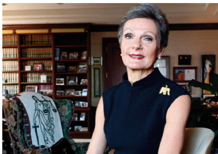
La jueza federal de Nueva York Loretta Preska.

gina por la expropiación del año 2012 en la cual la administración nacional no cumplió con el estatuto de YPF que obliga a realizar una