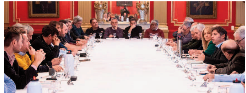
El gobernador citó a su tropa de intendentes.

El gobernador de la provincia de Buenos Aires, Axel Kicillof, reunió ayer a la tarde a más de cuarenta intendentes del Movimiento Derecho al Futuro (MDF), que conduce, y les encomendó una misión: cerrar las listas locales de sus respectivos distritos antes del jueves de la semana que viene. El plazo involucra, por supuesto, a todos los intendentes peronistas, no sólo a los enrolados en el MDF. “Es lo primero que hay que resolver”, resaltó el mandatario, que enfatizó que cada jefe comunal tendrá la lapicera en su distrito, aunque deberá utilizarla con “generosidad” para con los otros sectores internos del peronismo. En el cónclave, del que también participaron ministros de su gabinete, Kicillof emplazó a los intendentes a armar y enviar las nóminas con el 17 como fecha límite. Dos días después vence el plazo para presentar las boletas, según lo marca el calendario electoral para las elecciones legislativas del 7 de