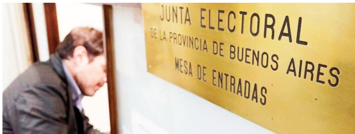
Cerradas las alianzas electorales, el próximo 19 de julio vence el plazo para la presentación de las listas de candidatos.

La oficialización del acuerdo se realizó en el Hotel Libertador -escenario frecuente de actos libertarios- con la firma de un documento por parte del presidente de los par-