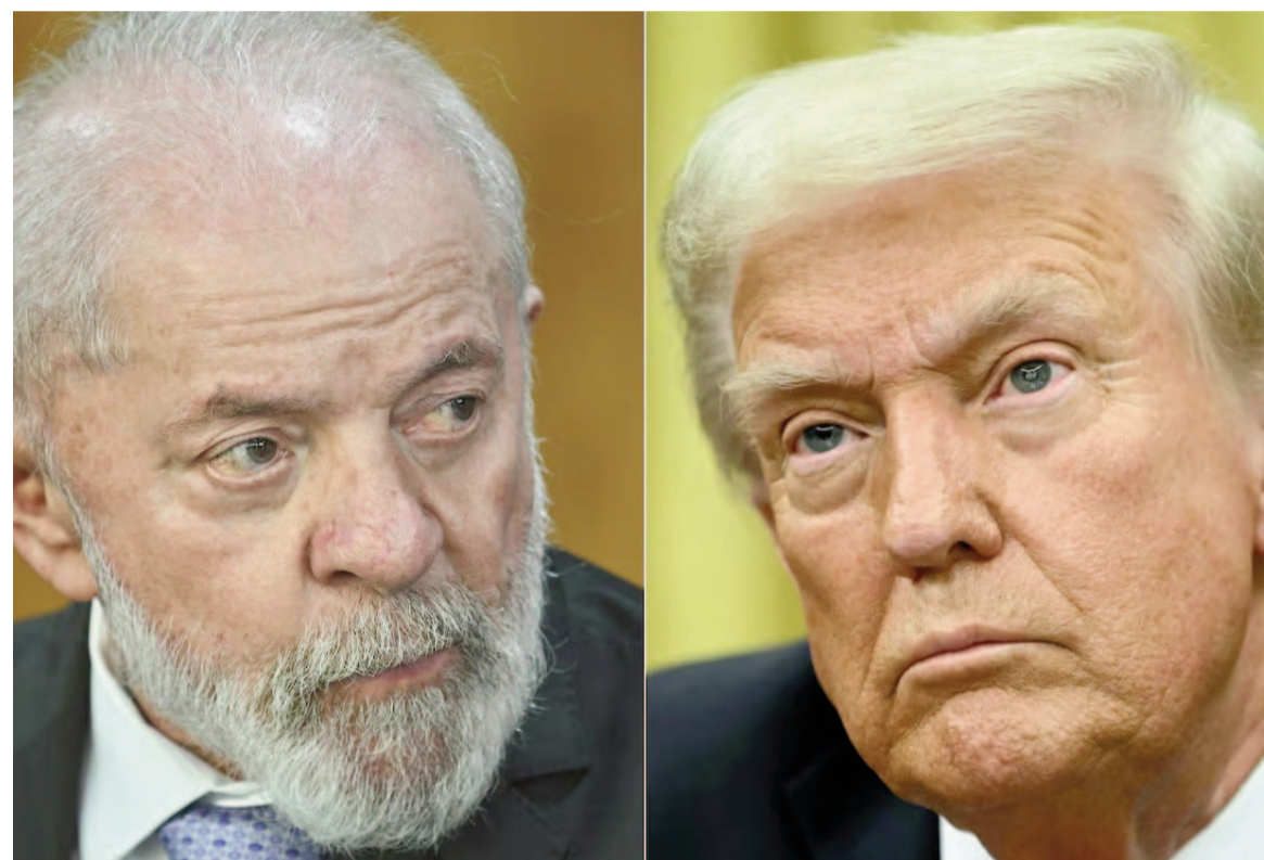
Lula da Silva le contestó a Trump tras la amenaza de aranceles.

El presidente brasileño advirtió que responderá con reciprocidad a los aranceles impuestos por Estados Unidos.