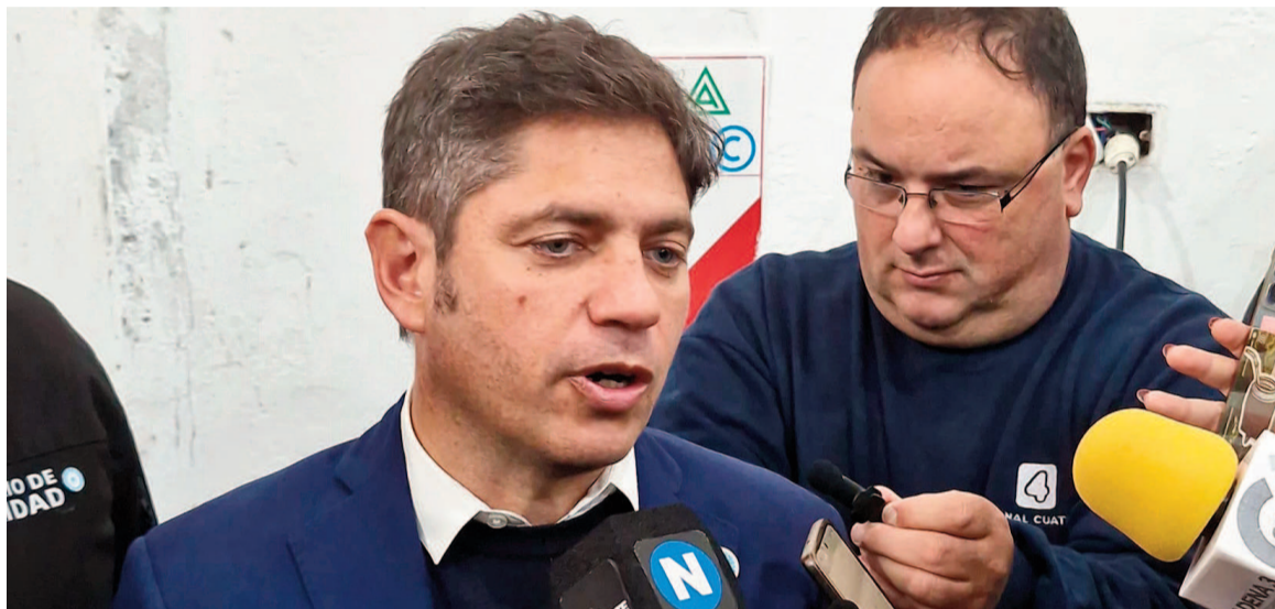
Kicillof visitó Pergamino. EL NORTE

En la vecina ciudad, y con presencia de EL NORTE, Kicillof se refirió a la unidad con Massa y Máximo Kirchner, cuestionó con dureza al presidente y habló sobre las prioridades de campaña en la segunda sección.