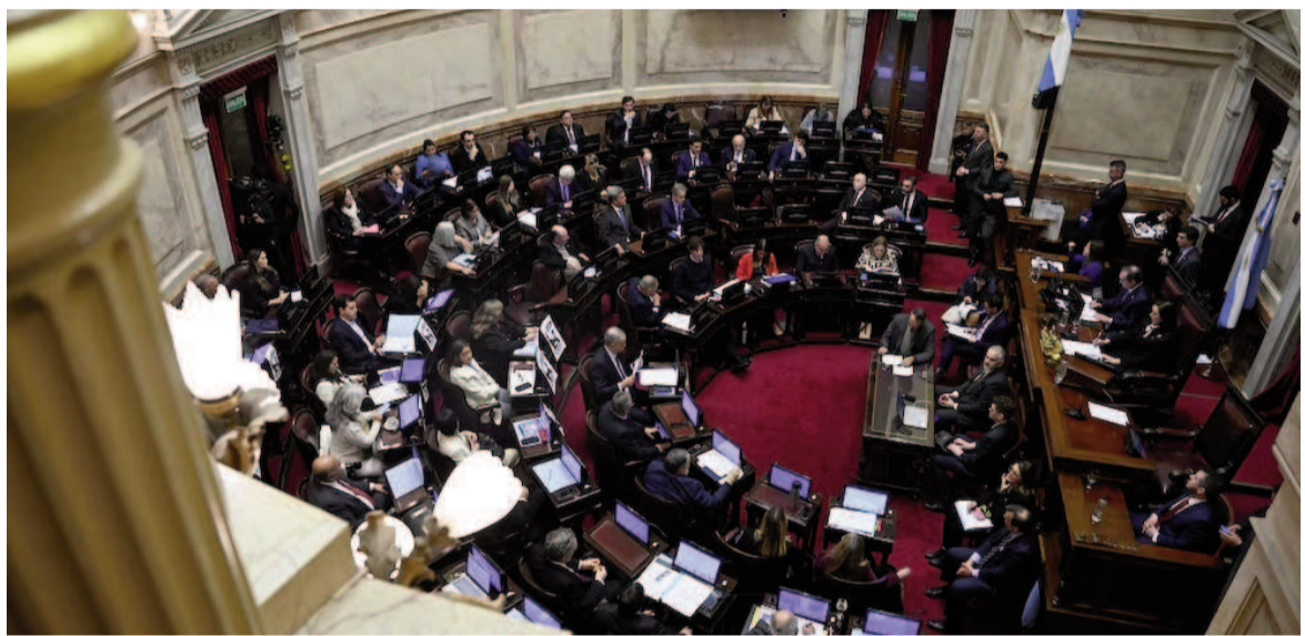
El pleno del Senado durante la sesión de ayer jueves.

"Tenemos que actualizar el Certificado Único de Discapacidad. El trámite con el CUD es hoy toda una complicación y este proyecto propone una metodología en este sentido",