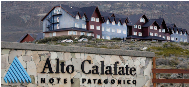
Hotesur - Los Sauces, nuevo dolor de cabeza para Cristina.

El peritaje contable clave en la causa "Hotesur-Los Sauces" volvió a ponerse en marcha y se convirtió en el último paso antes del inicio del juicio oral que tiene como principal acusada a la expresidenta Cristina Kirchner. La investigación apunta al presunto lavado de dinero a través del alquiler de hoteles y propiedades a empresarios favorecidos por obra pública durante su gestión.