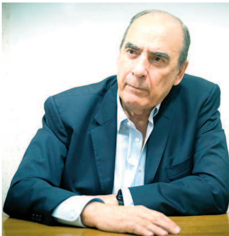
El jefe de gabinete Guillermo Francos.

Respecto al diálogo con los gobernadores, tenso desde que los mandatarios provinciales se le plantaron a Milei en reclamo por más fondos, Francos puso paños fríos. "Nunca creo que esté todo roto, siempre hay posibilidad de conversar. Con algunos gobernadores vamos a tener acuerdos electorales. Las conversaciones siempre están abiertas. No todos son lo mismo, hay algunos que se dedican a gastar y otros a preservar los recursos", diferenció. Esta frase llega luego de que el jefe de Estado afirmó antes esta semana en una entrevista radial que "todos" los gobernadores, por presionar en el Legislativo con los proyectos,