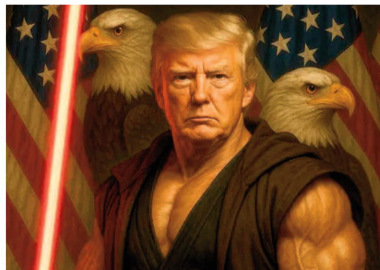
Caracterizado como otro personaje del mundo del espectáculo.