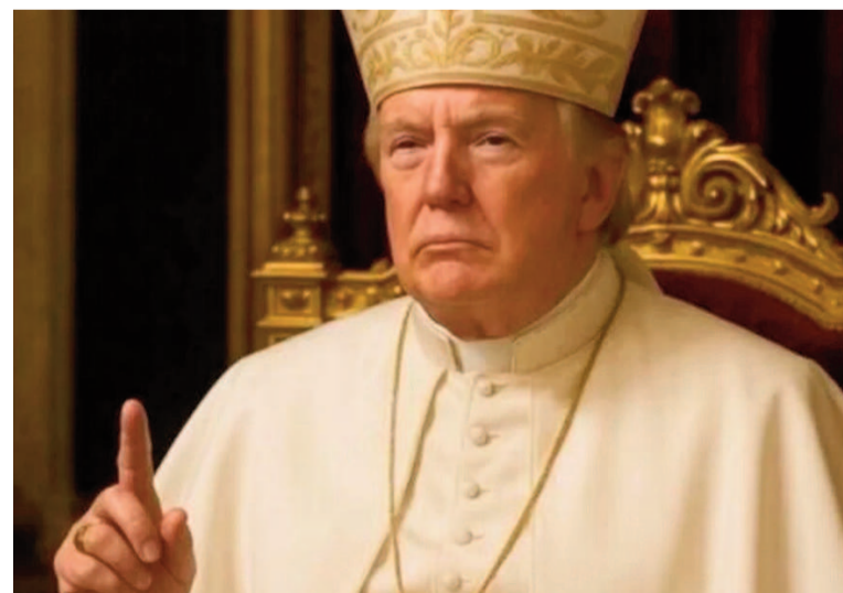
Donald Trump como Sumo Pontífice.

Entre los memes más compartidos, se destaca una imagen de la criptonita —el mineral capaz de debilitar a Superman— con el texto: "Archivos