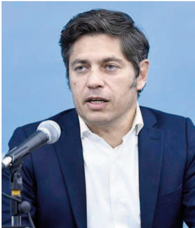
El gobernador Axel Kicillof.

“Tienen pisado el dólar y los salarios de sectores populares y trabajadores, lo que causa una obvia consecuencia caída de demanda y caída de producción: una espiral que estamos viendo de pér-