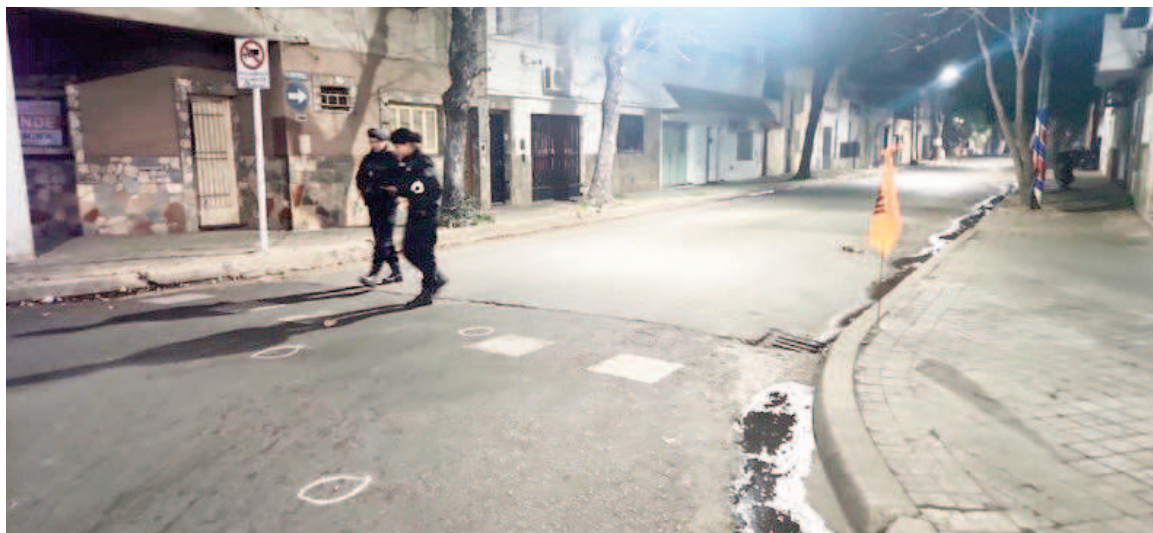
La cuadra de Independencia al 3100, donde dejaron un reguero de vainas.

Ya entrada la noche, efectivos policiales habían demarcado con tiza los doce casquillos que escupió la