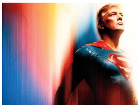
Donald "Superman" Trump.

"Símbolo de la esperanza. Verdad. Justicia. Al estilo estadounidense. Superman Trump", reza la publicación en X, en alusión parcial al icónico lema del superhéroe de DC Comics, que incluye "Verdad, justicia y el