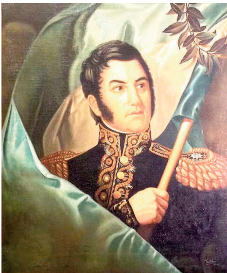
El 17 de agosto es feriado en la Argentina, fecha en que se recuerda a San Martín.

Por lo tanto, son pocas las personas que podrán aprovechar el fin de semana largo.