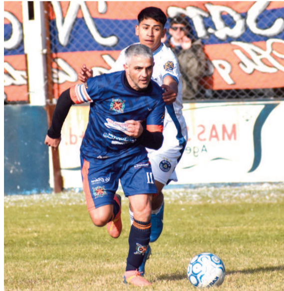
Varas y Stoccafisso hoy estarán cara a cara en el Estadio San Nicolás. WEB

Regatas atravesó el certamen como favorito, con una solidez que