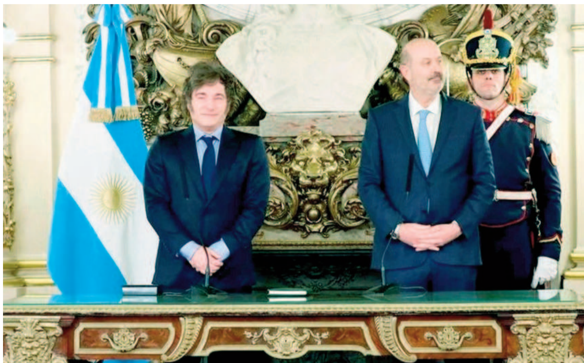
Javier Milei y Federico Sturzenegger.

El ministro de Desregulación, Federico Sturzenegger, el lunes, había afirmado que no iban a buscar prorrogar esa atribución mediante la cual el Gobierno avanzó con el «plan motosierra».