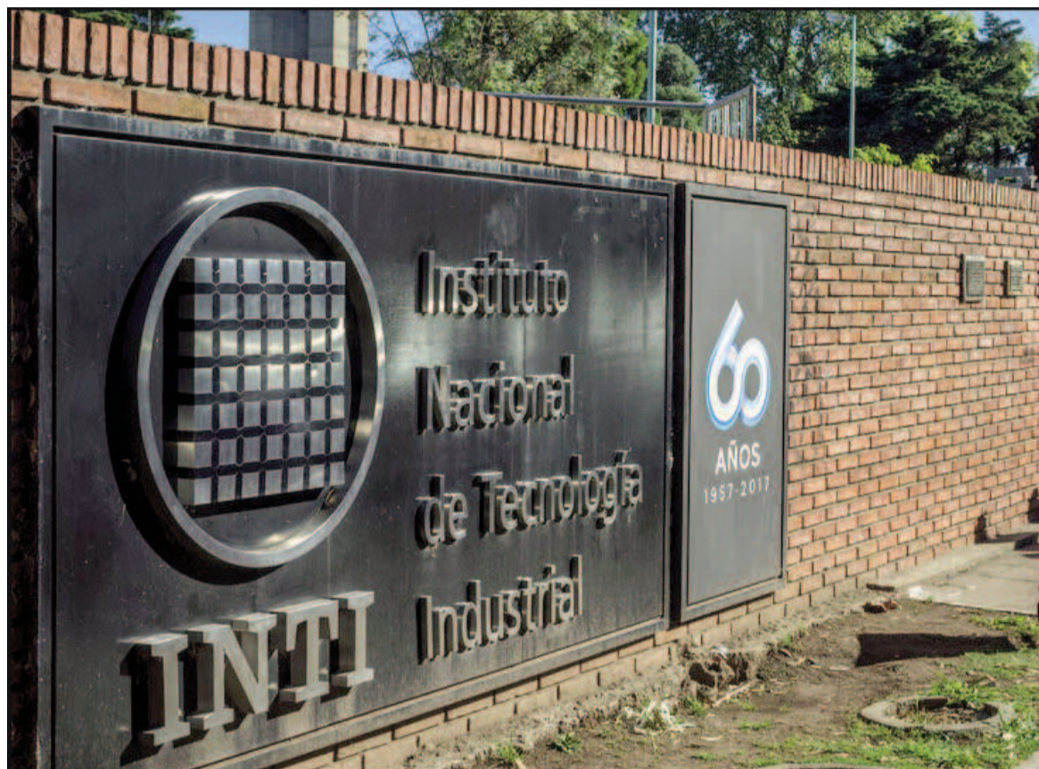
El artículo 46 incluido dentro del Título II Capítulo II de la normativa menciona la reestructuración del INTI.

El caso del INTA, en tanto, aparece en el artículo 59 que da inicio al capítulo IV del mismo Título que el INTI. Hasta ahora, funcionaba como un "organismo autárquico para impulsar, vigilar y coordinar el desarrollo de la investigación y extensión agropecuaria y acelerar la tecnificación y el mejoramiento de la empresa agraria y de la vida