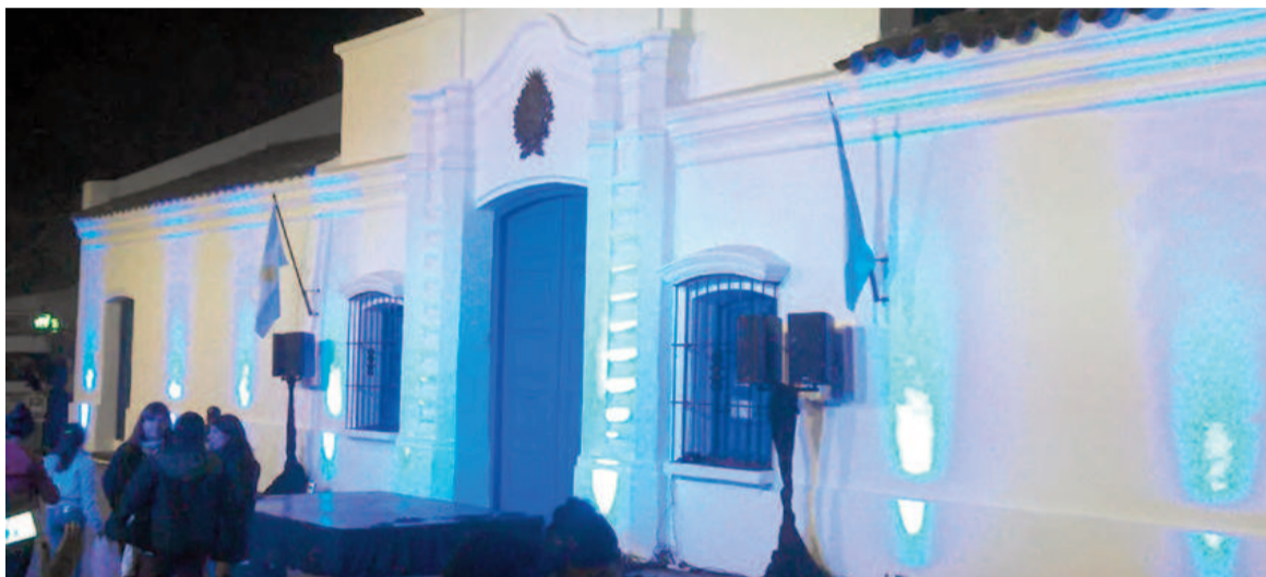
Fachada de La Casa de Tucumán.

El acto por el Día de la Independencia en Tucumán se realizará sin el presidente Javier Milei ni la mayoría de los gobernadores, en un escenario opaco y fragmentado que contrasta con la imagen de unidad proyectada el año pasado durante el Pacto de Mayo.