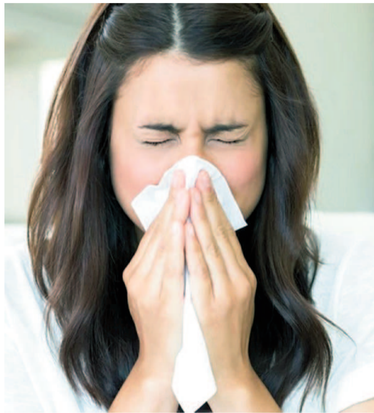
Una parte muy grande de la población sufre de alergias.

La detección temprana es fundamental para poder tratar y controlar esta condición. Para ello, el alergista puede indicar pruebas cutáneas como