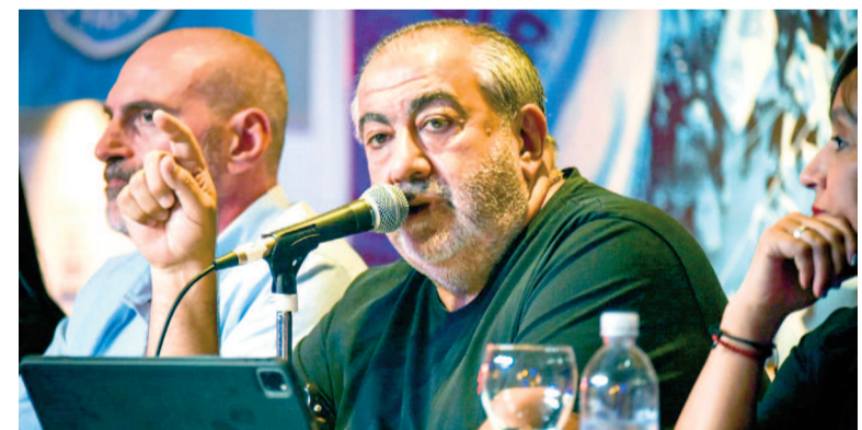
Héctor Daer, secretario general de la CGT

«Este nuevo avance del Gobierno Nacional no hace más que transformar a las rutas argentinas en un espacio donde, más temprano que tarde, el abandono derivará en más accidentes y peligro para los millones de personas que las transitan día a día», agregó la CGT. En ese sentido, se puso «a disposición» de las acciones y medidas de fuerza que lleven adelante los trabajadores afectados «en defensa de los puestos de trabajo y la seguridad de nuestros caminos».