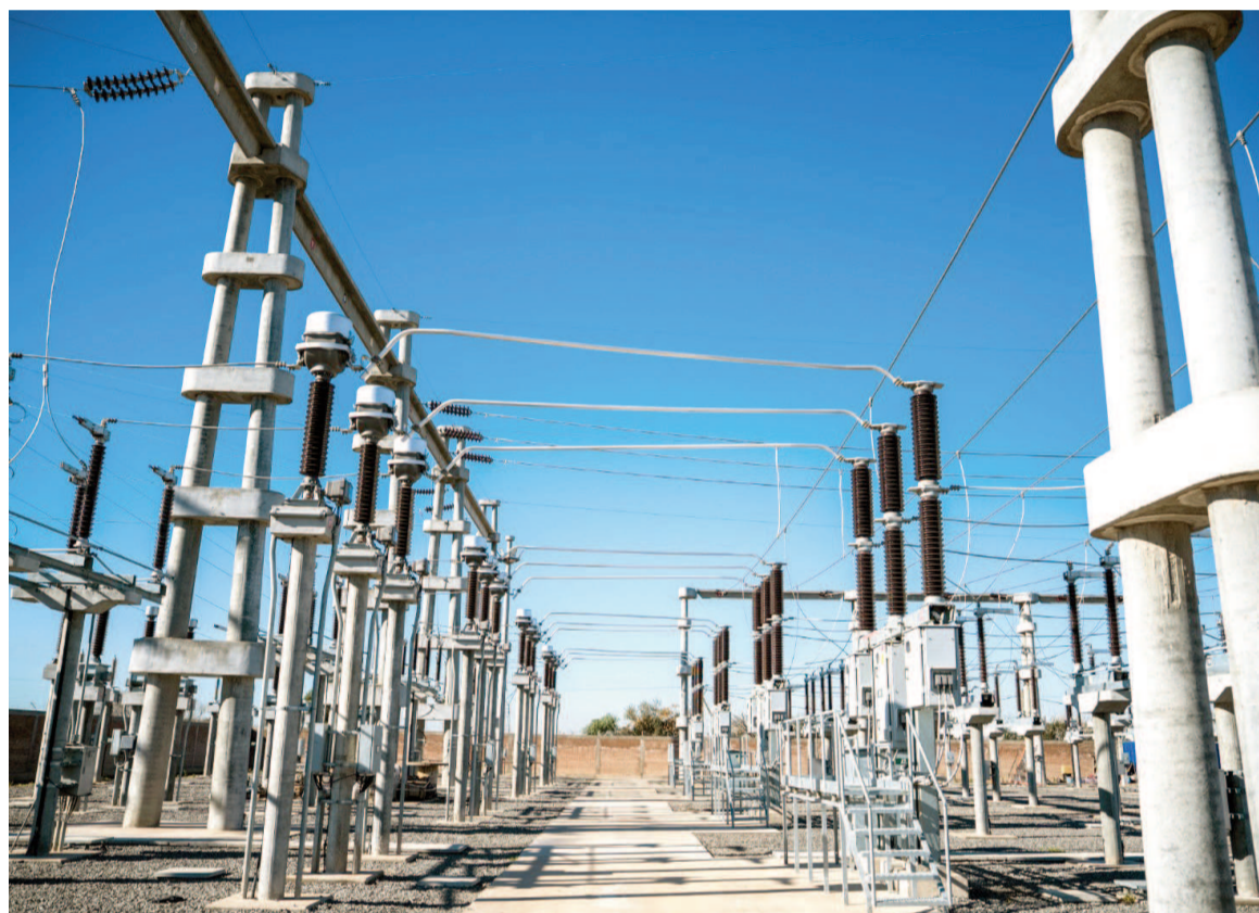
La nueva estación permite ampliar la potencia instalada de 148 a 228 megavatios, reforzando así la red eléctrica que abastece San Nicolás y alrededores.

La inversión de 20 millones de dólares fue posible gracias a la contribución del Fondo Fiduciario para el Transporte Eléctrico de la Provincia de Buenos Aires y del trabajo conjunto y articulado entre la empresa