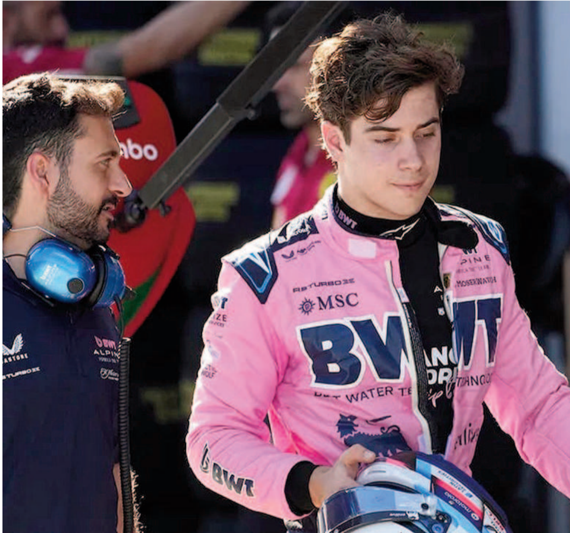
El pilarense necesita un buen resultado. WEB

Las flojas actuaciones primero de Doohan y ahora de Colapinto quedan más expuestas aún por los milagros que consigue el francés Pierre Gasly,