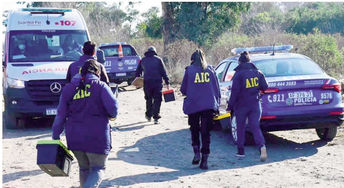
Bajó la tasa de homicidios en Rosario.

El año pasado, más de la mitad de crímenes ocurridos durante el primer semestre fueron en los primeros tres meses del año. Entre enero y marzo de 2024 se registraron 36 hechos, entre los que estuvo la saga de ataques en la que cuatro personas fueron asesinadas en un lapso de cuatro días mientras estaban en sus puestos de trabajo. Luego, los números comenzaron a descender