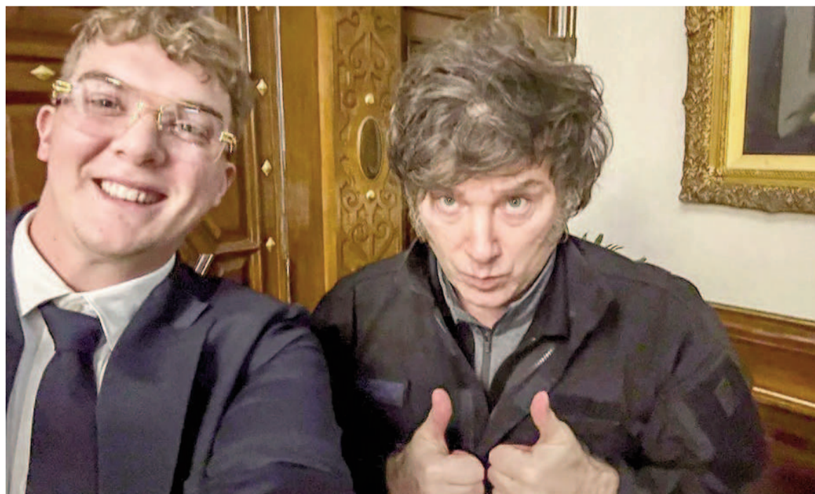
Milei y Davis: en ese encuentro surgió el escándalo cripto.

"En lugar de actuar con independencia para resguardar la ética pública, parece convertirse en una herramienta de blindaje político", afirmaron los diputados nacionales en su presentación ante la justicia federal. La denuncia ahora deberá ser evaluada por el juez federal correspondiente, quien decidirá las acciones a seguir y las medidas de prueba solicitadas por Ferraro y Frade.