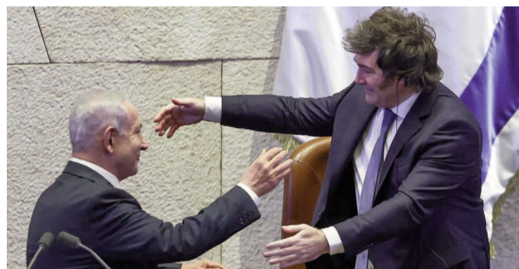
Irán acusa a la Argentina de estar alineada con Israel.

Un funcionario iraní calificó la decisión judicial de "ilegal y politizada". Afirmó que el presidente actúa influenciado por el "régimen sionista" y los Estados Unidos.