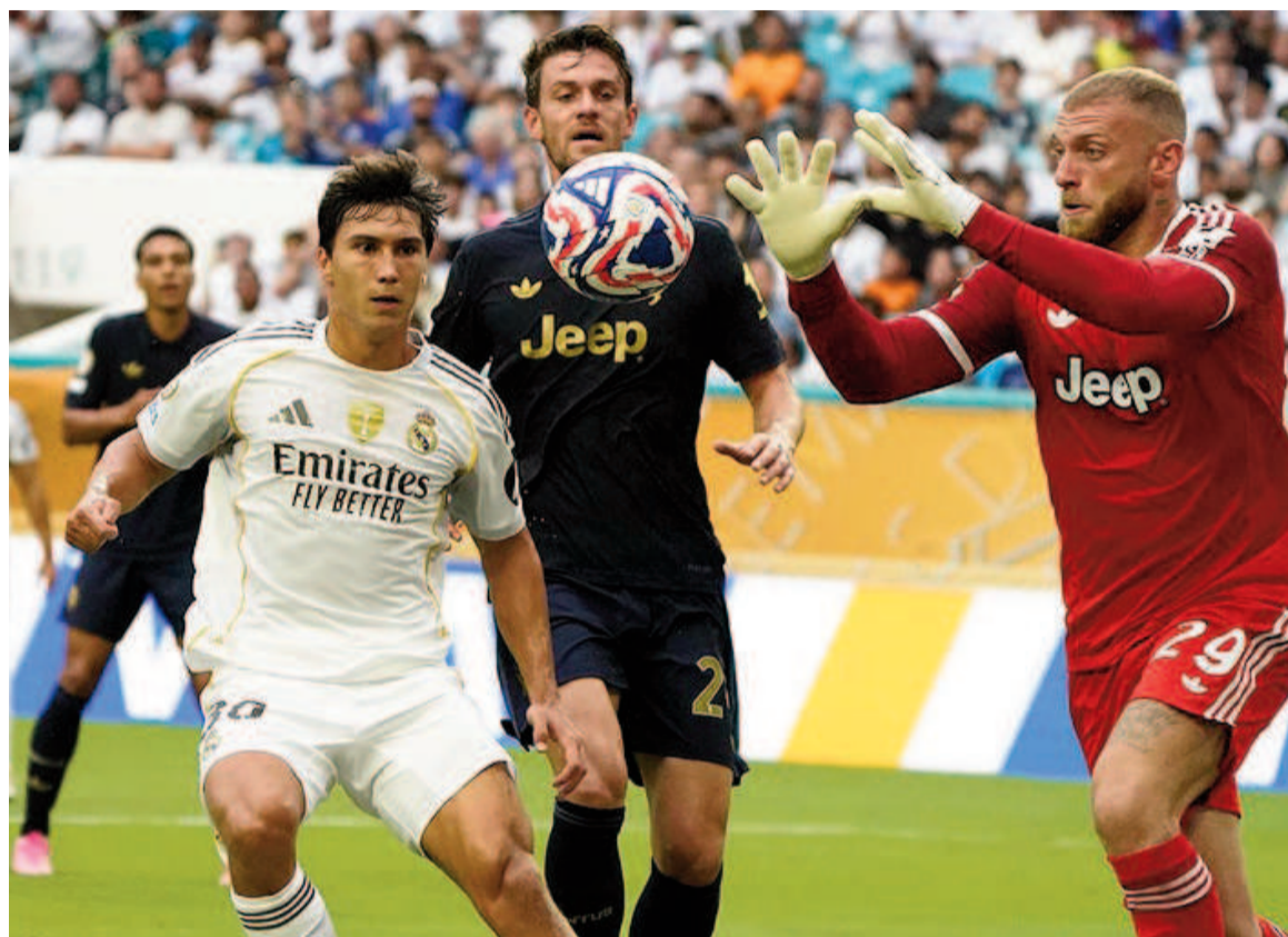
El conjunto madrileño derrotó a la Juve.