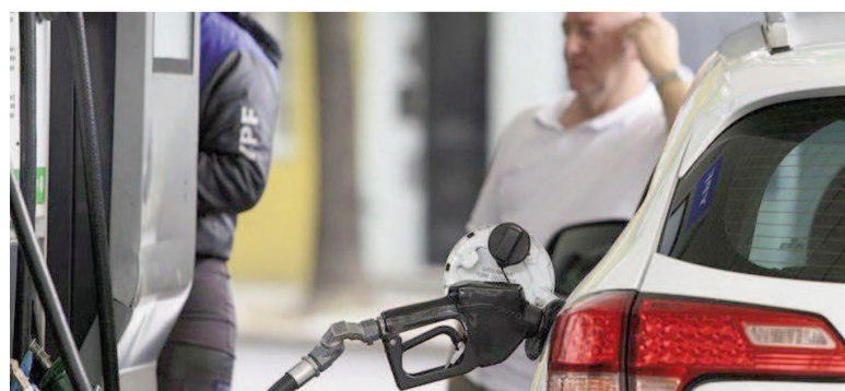
En PBA el costo de las multas depende del precio de la nafta.