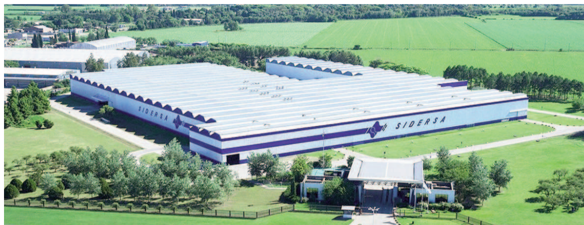
El de Sidersa es el quinto proyecto que se aprueba en el marco del RIGI; es el primero de perfil industrial, puesto que los anteriores eran energéticos y de minería.

La nueva planta permitirá abastecer al mercado con 360.000 toneladas anuales de insumos, para la industria nacional y exportaciones, había dicho la compañía. Incorporará tecnología de última generación para ahorrar tiempos de construcción y lograr mayor pro-