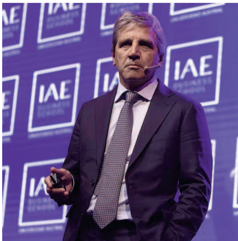
Luis Caputo durante el Summit 2025.

También resaltó el crecimiento del crédito al sector privado: “Cuando llegamos, el nivel de crédito sobre PBI era de 3,5 puntos. Ahora se duplicó en términos reales”. Afir-