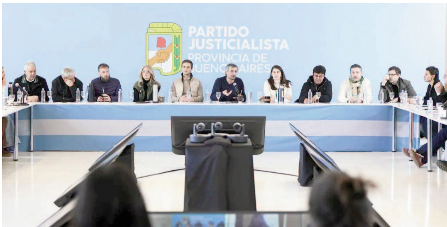
El PJ bonaerense se reunió en San Vicente.

La aprobación de esta convocatoria es clave para el armado del frente electoral y, aunque fue aprobada sin mayores inconvenientes, no estuvo exenta de tensiones. Una de las discusiones más calientes giró