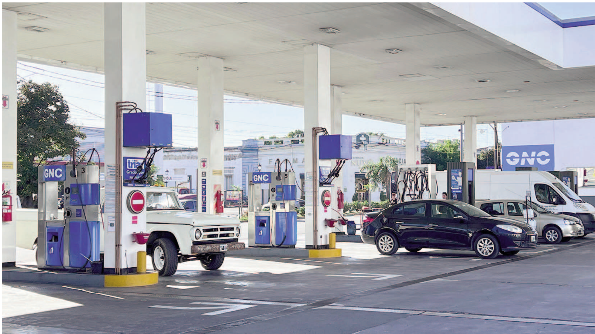
Desde ayer, llenar un tanque de 45 litros con nafta súper cuesta $61.110 en las estaciones de servicio YPF de San Nicolás.