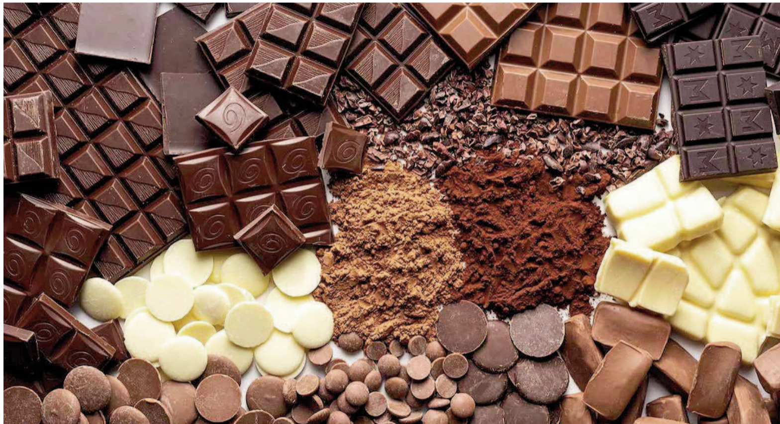
La Semana de la Dulzura es celebrada todos los años por los fanáticos de las golosinas.

La movida surgió de una iniciativa comercial y se transformó en una tradición invernal. Por qué se festeja en Argentina.