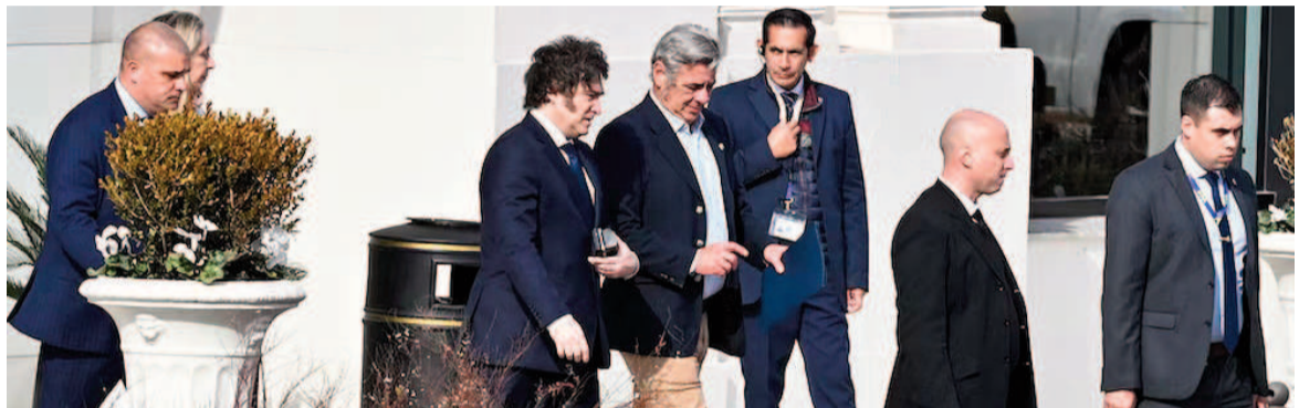
Milei se reunió este martes con los integrantes de la Mesa de Enlace.

Pino destacó que Milei considera al campo como el sector más competitivo del país y valoró especialmente el aporte “permanente” del agro a la economía nacional. En sus palabras, el apoyo del sector no se orienta a “ningún tipo de partido”, sino al país en su conjunto. “Hablamos de varios temas, pero el Presidente hizo mucho hincapié en la apertura de Argentina al mundo y en la responsabilidad que tenemos como productores de encarar este desafío”, explicó Pino tras el encuentro. En cuanto a medidas concretas, el presidente Milei ratificó su com-