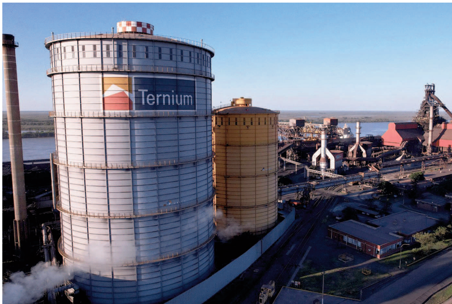
La medida de fuerza dispuesta por la UOM en empresas contratistas de Ternium quedó en stand by : las partes no pueden innovar y deberán seguir negociando.

Los reclamos del gremio venían siendo materia de discusión con las empresas en el ámbito de la delegación regional San Nicolás