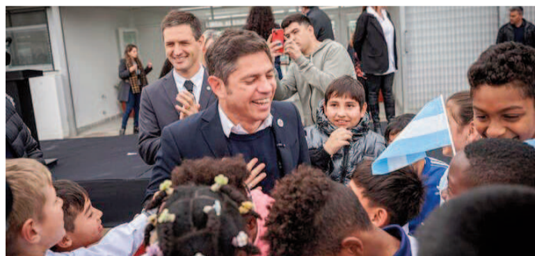
Axel Kicillof junto a alumnos en San Vicente.

El gobernador Axel Kicillof inauguró este martes el Polo Educativo "San José" en el distrito bonaerense de San Vicente y aprovechó el acto para lanzar críticas, y una chicana, al Gobierno de Javier Milei: "Esto no lo iban a hacer las fuerzas del cielo". Durante su discurso, Kicillof remarcó que las nuevas obras son producto de "un Estado presente" y resaltó que la idea es que los alumnos puedan completar todo su recorrido educativo en un mismo lugar y cerca de sus casas.