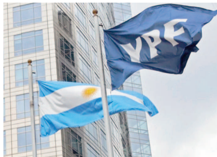
Frenaron temporalmente el fallo contra YPF.

La medida busca garantizar una presentación ordenada de argumentos por ambas partes antes de tomar una decisión más definitiva.