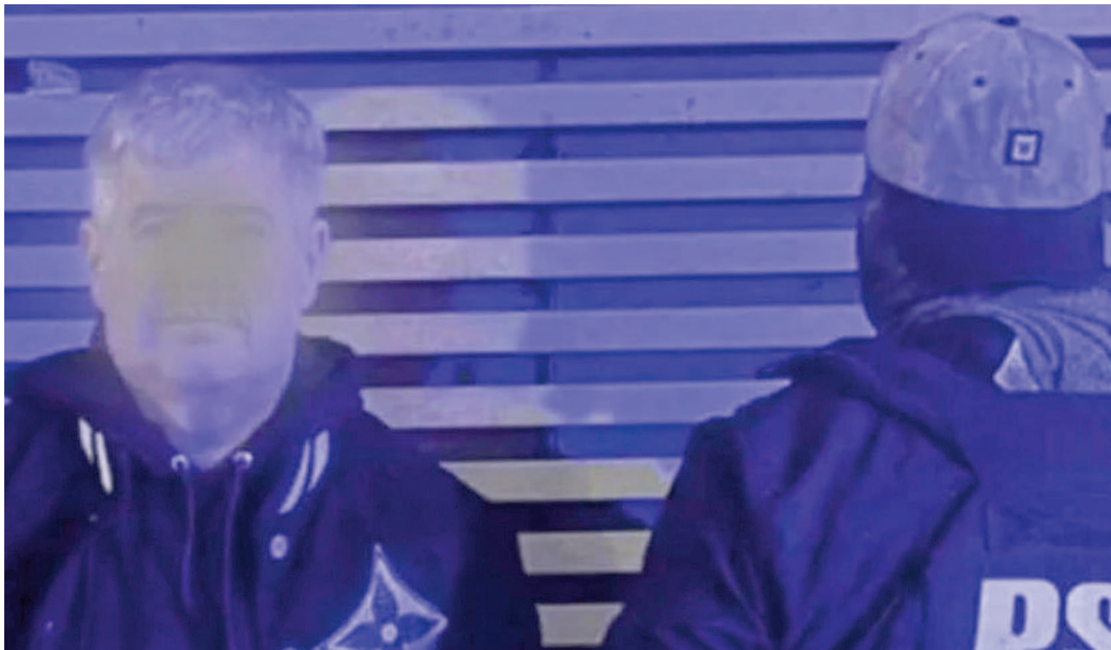
El piloto figuraba entre los prófugos con prioridad máxima para la captura.

De acuerdo a la evidencia reunida por la Procuraduría de Narcocriminalidad (Procunar), la banda traía cocaína de Bolivia en aeronaves que ingresaban al país en forma clandestina y circulaban por rutas no autorizadas. Uno de los puntos clave de la red de distribución era un hangar del country Campo Timbó en la vecina localidad de Oliveros.