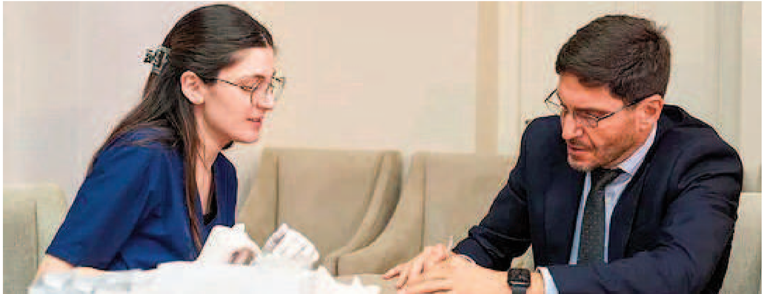
Maximiliano Pullaro se realizó el primer narcotest.

“No vamos a tener ningún funcionario que consuma sustancias ilegales”, remarcó el mandatario provincial, quien estuvo acompañado