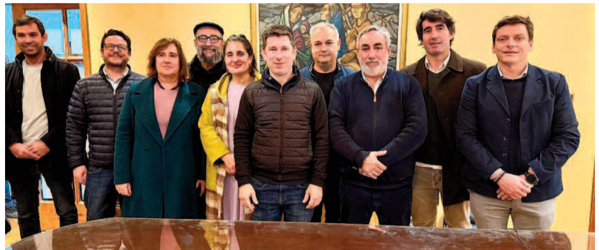
La UCR confirmó integrar Somos Buenos Aires.