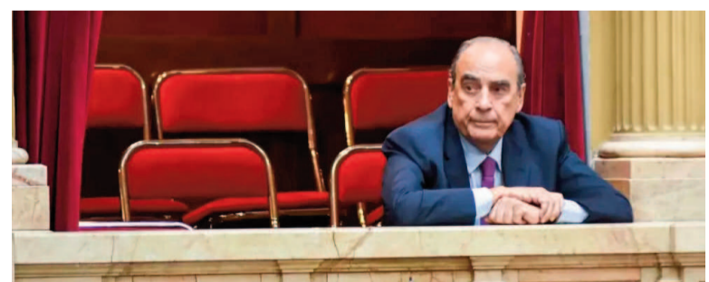
El jefe de Gabinete Guillermo Francos.

Reivindicó como ejemplo la Asignación Universal por Hijo (AUH), política que —irónicamente— fue implementada por el kirchnerismo. Consultado por el nuevo proyecto que busca reforzar las jubilaciones mínimas —con un 7,2% adicional aprobado recientemente