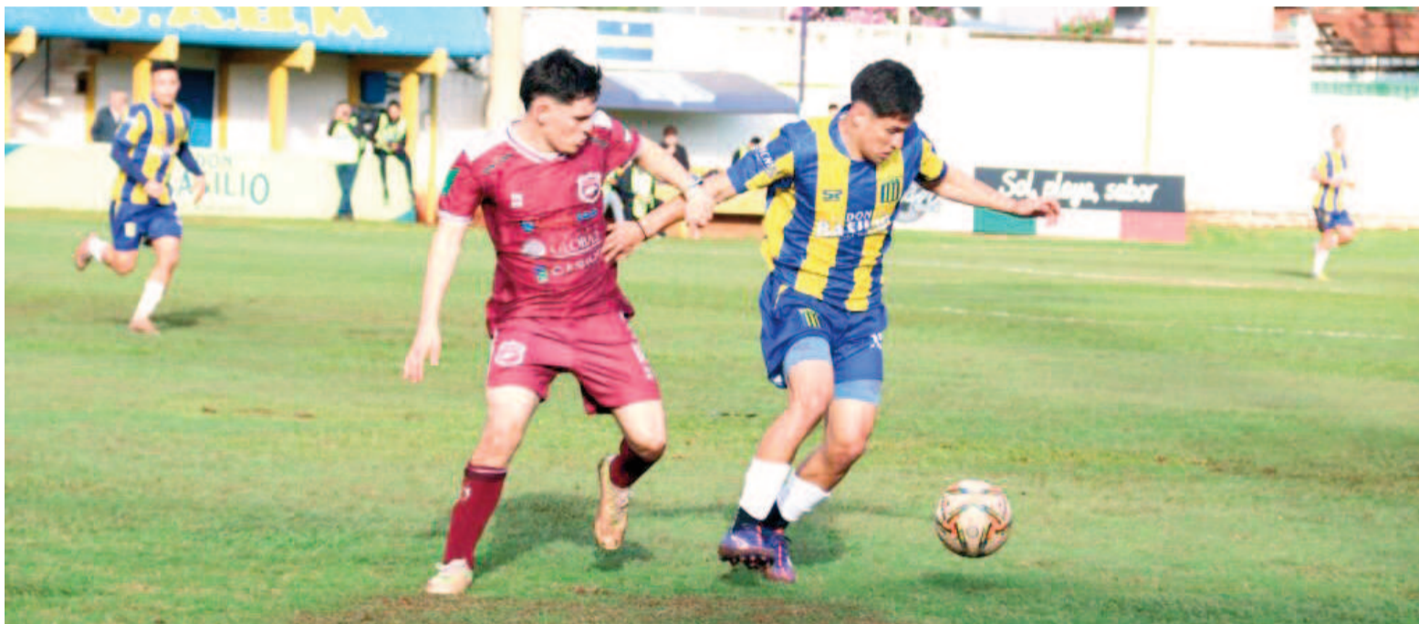
El conjunto de Villa Ramallo fue perjudicado por el árbitro.