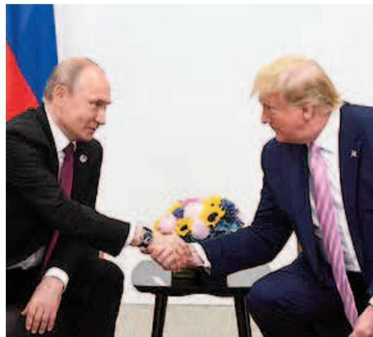
Trump le dio un ultimatum a Putin.

Las declaraciones se dieron en medio de la reunión de Trump con Keir Starmer, primer ministro de Reino Unido, en el lujoso resort de golf del líder estadounidense en Turnberry, al sur de Glasgow.