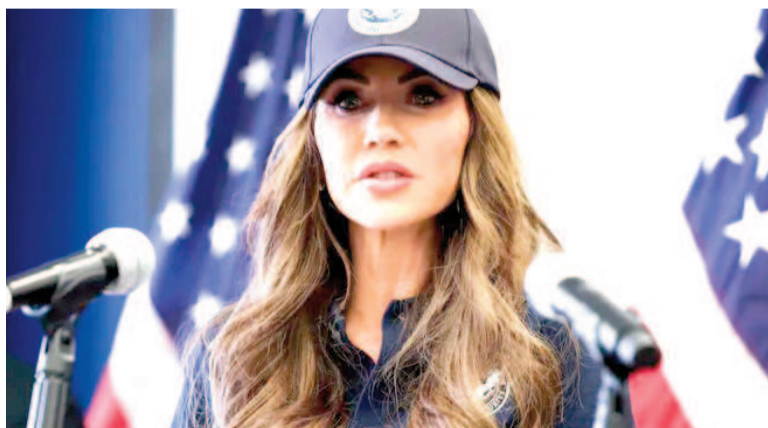
La secretaria de Seguridad Nacional de EEUU, Kristi Noem.

Luego de su reunión con el presidente Javier Milei, la secretaria del departamento de Seguridad de Estados Unidos, Kristi Noem, se refirió a los plazos posibles para que la Argentina pueda acceder al beneficio del Programa de Exención de Visa (Visa Waiver Program -VWP-). "Sería muy difícil que sea en menos de un año", dijo. "Podríamos simplificar el proceso y facilitar los traslados tanto para los turistas como para quienes viajan por negocios", destacó Noem