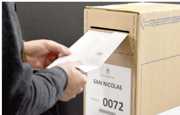
La provincia de Buenos Aires realizará elecciones simuladas para poner a prueba cada paso del proceso.

En cuanto al traslado de urnas, Bianco indicó que “cada camión va a contar con un patrullero de