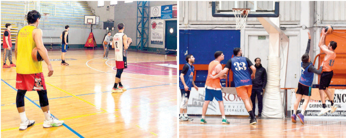
Náuticos y Rojos volvieron a los entrenamientos.

Como lo había hecho ya Somisa la semana pasada, el Rojo y el Náutico iniciaron su pretemporada pensando en el Prefederal Bonaerense.