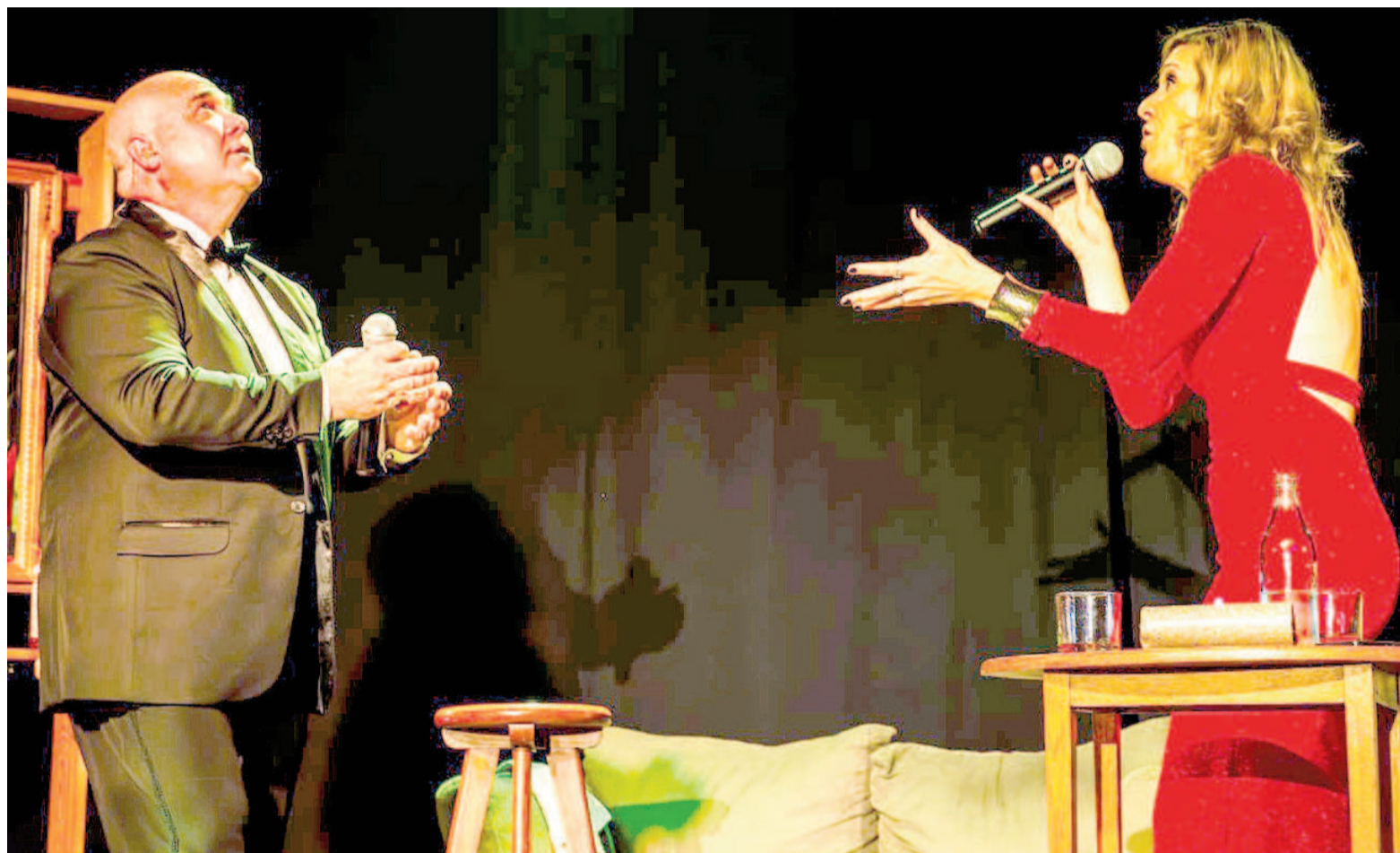
"ECOS, el Musical" se presenta en la Asociación Cultural Rumbo.

La obra se presenta el sábado 9 de agosto en Asociación Cultural Rumbo. Todo lo recaudado será destinado a Latidos Rosa, organización que confecciona pelucas oncológicas.