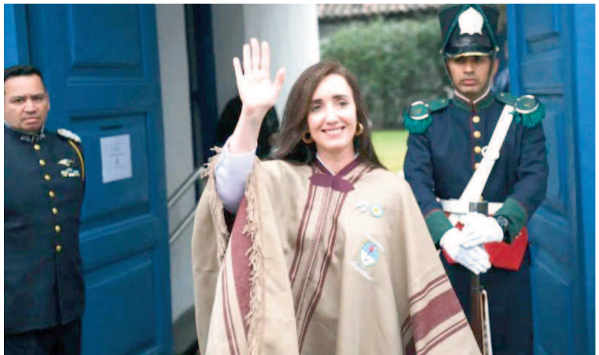
La vicepresidenta reapareció a través de las redes.

La reaparición de la vicepresidenta con un mensaje dirigido a las fuerzas de seguridad fue interpretada como una reafirmación de su perfil propio dentro del oficialismo. Villarruel no mencionó el episodio de La Rural ni hizo alusión al presidente, pero el momento elegido y el tono institucional del mensaje fueron le-