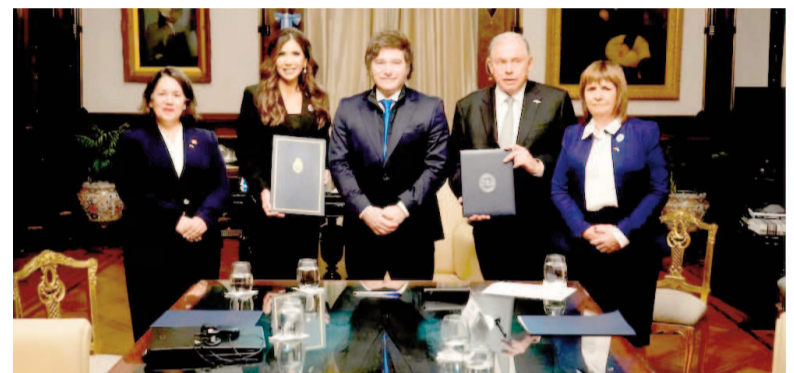
El momento de la firma de la carta de intención.

ves de la administración de Donald Trump, llegó a Buenos Aires el domingo y se irá hoy, luego de mantener una serie de encuentros oficiales.