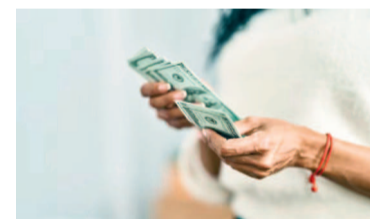
Se podrán comprar dólares a través de la billetera digital.

rramienta de bajo riesgo, administrada por Industrial Asset Management y custodiada por Banco Industrial (BIND), es 100% digital y ofrece una tasa anual estimada del 2,4% (promedio de los últimos 30 días)".