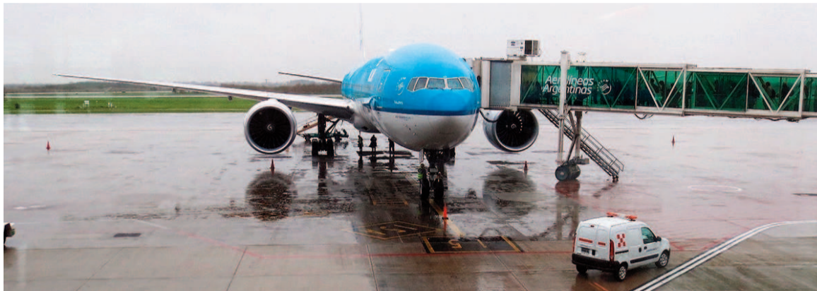
En la séptima edición del Travel Sale, se promueve la venta de pasajes aéreos con ofertas de cupones de descuento.

El ingreso de visitantes durante junio estuvo compuesto por 318,8 miles turistas y 223,6 miles excursionistas. El 71,7% del turismo receptivo provino de los países limítrofes. Los principales fueron Brasil, que aportó 27,6%; Uruguay, 20,3%; y Chile, 11,2%. En cuanto a la forma de arribo al territorio nacional, el informe detalló que el 51,5% de los turistas no residentes llegó a Argentina a través de la vía aérea; el 37,9% lo hizo por vía terrestre; y el 10,6% restante arribó