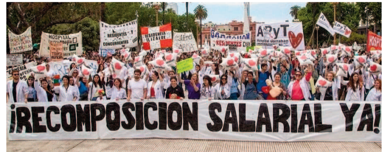
Aeronáuticos en pie de guerra.

El conflicto se originó tras la publicación, a comienzos de junio, del DNU 378/2025, que deroga el