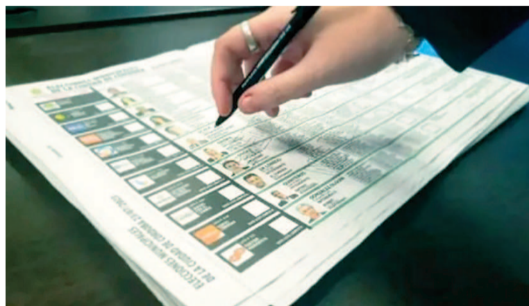
La Boleta Única Papel debutará en las elecciones de octubre.

Acordada extraordinaria N° 40/25, firmada por los jueces Daniel Bejas, Alberto Dalla Via y Santiago Corcuera, y establece el modelo general de boleta que servirá de base para cada distrito. Luego, las Juntas Electorales Nacionales provinciales confeccionarán las versiones definitivas una vez oficializadas las listas de candidaturas para diputados y se-