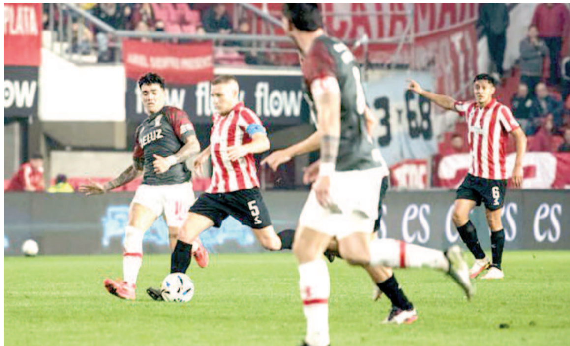
El León volvió a la victoria tras una larga sequía.