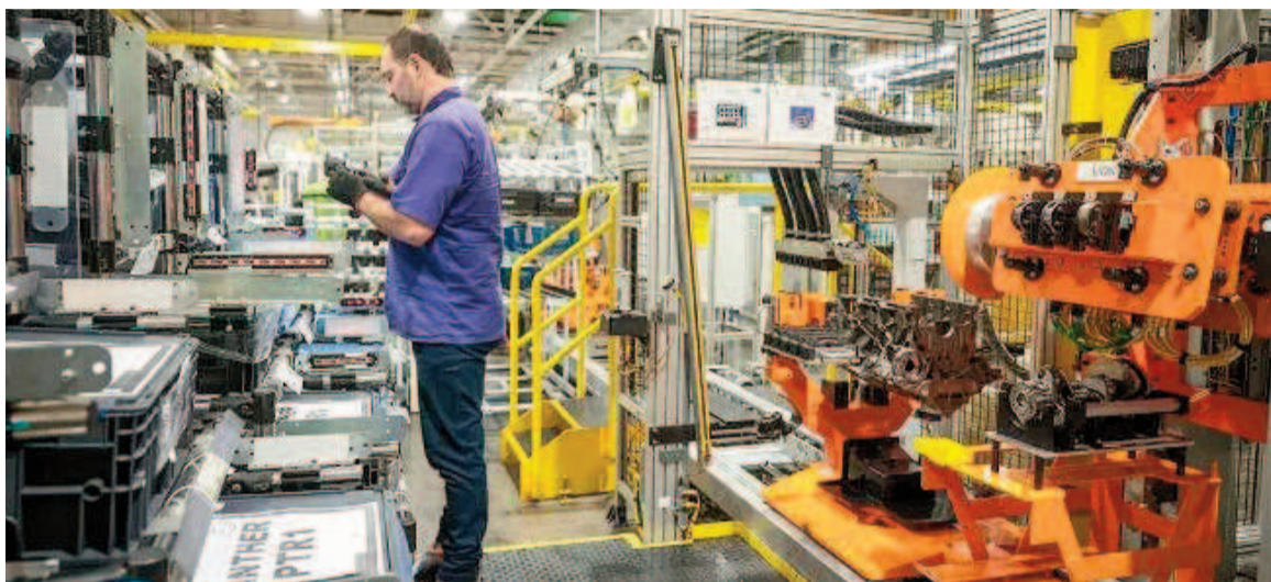
La economía muestra un «estancamiento».

registraron caídas en la comparación interanual: Electricidad, gas y agua (-9% i.a.) y Administración pública y defensa y planes de seguridad social de afiliación obligatoria (-0,9% i.a.). Estas actividades le restan 0,2 puntos porcentuales (p.p.) al crecimiento interanual del EMAE.