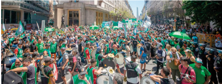
ATE y el Gobierno se vuelven a ver las caras.