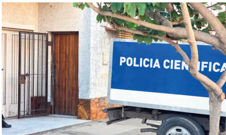
La puerta estaba violentada.

Una vez en el lugar, personal del SAME constató el fallecimiento del hombre. Fue convocada la Policía Científica para preservar la escena de los hechos y fue ordenada la operación de autopsia a cargo del médico forense Juan Pablo Valdez. La pericia comenzó avanzada la tarde y hasta el cierre de este informe no se habían emitido aún las primeras conclusiones para determinar la participación de terceros en la muerte. Aunque los datos no fueron confirmados oficialmente, se supo que