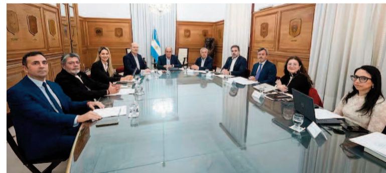
El Consejo volverá a reunirse en agosto.

el Ejecutivo quiere lograr figurar la descentralización de la negociación colectiva y la limitación de las cuotas solidarias.