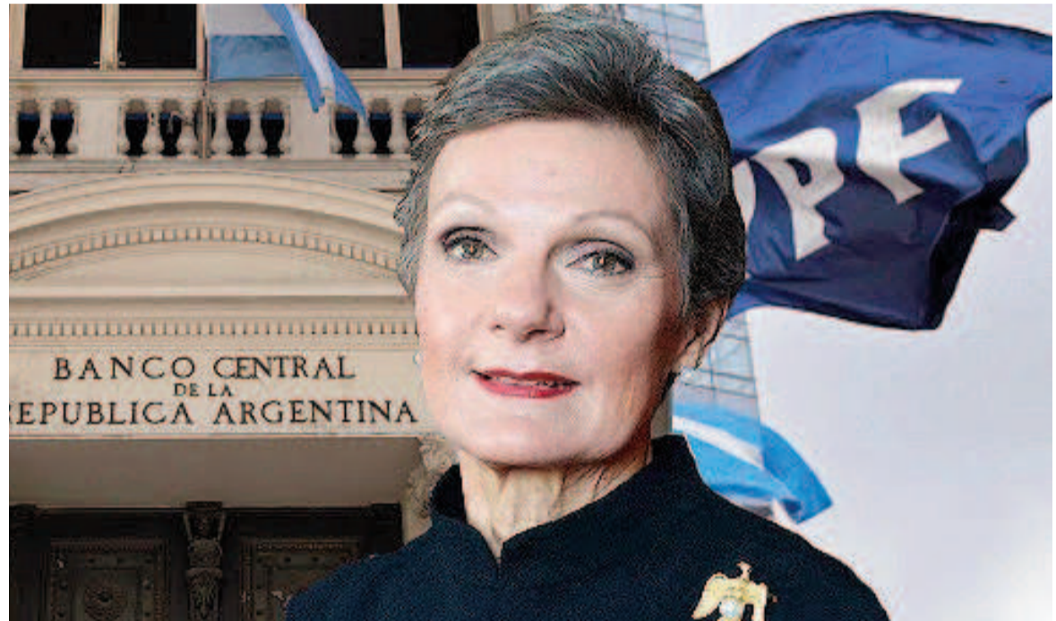
La jueza estadounidense Loretta Preska.

El Ejecutivo había solicitado una suspensión temporaria ("stay") mientras continúa su estrategia judicial.