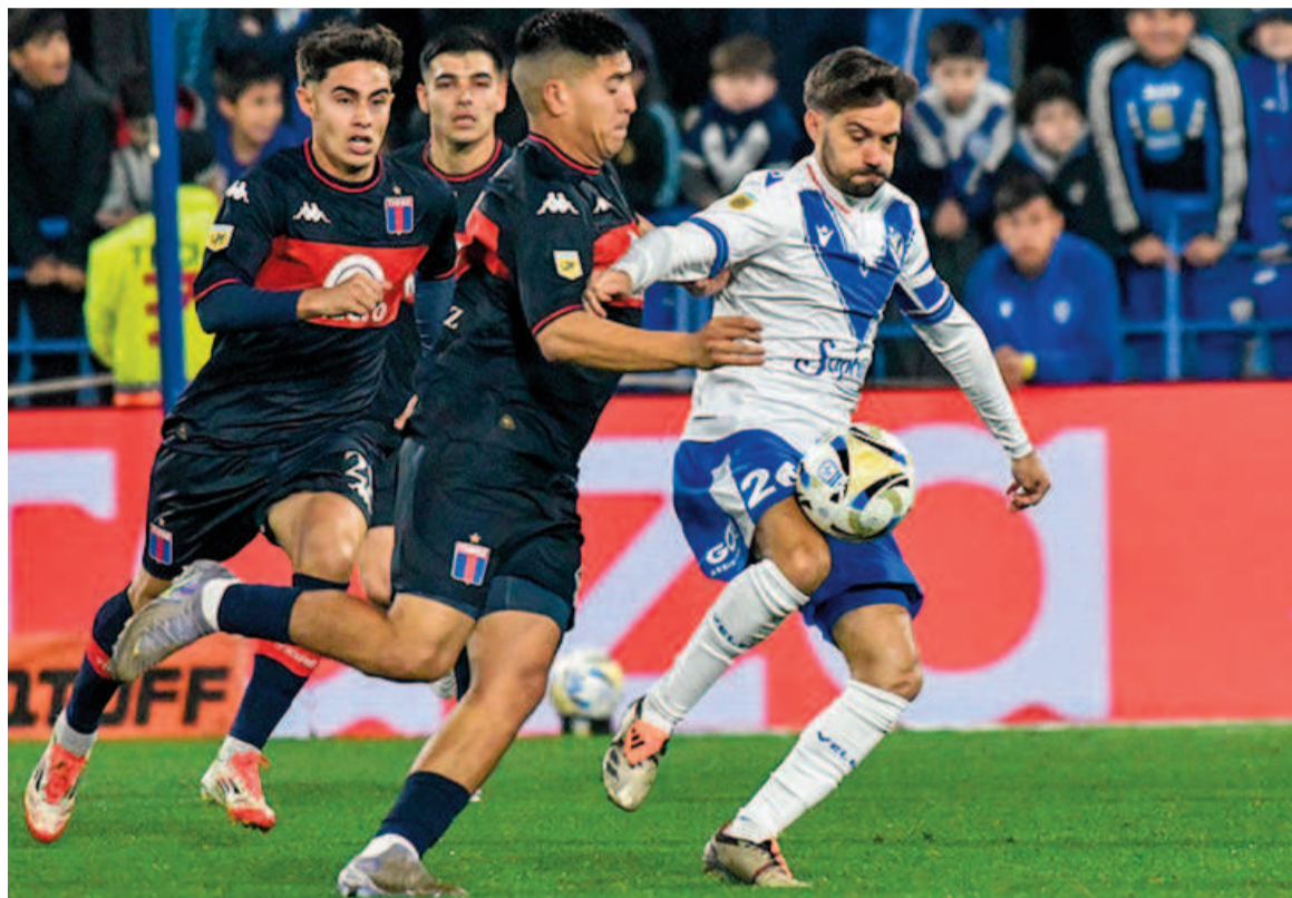
El equipo de Liniers debutó ganando.