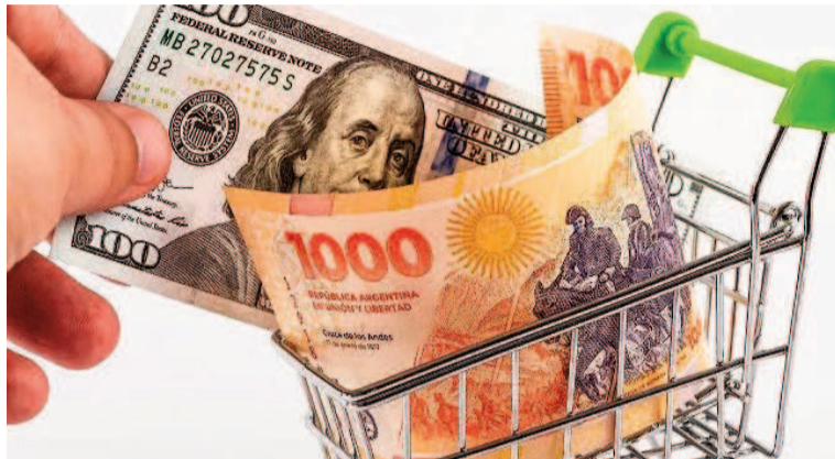
La inflación en junio subió respecto al mes anterior.

En un posteo en su cuenta de X, el ministro de Economía Luis Caputo destacó que la inflación núcleo de 1,7% fue la más baja desde mayo de 2020 y que "si se excluye el efecto