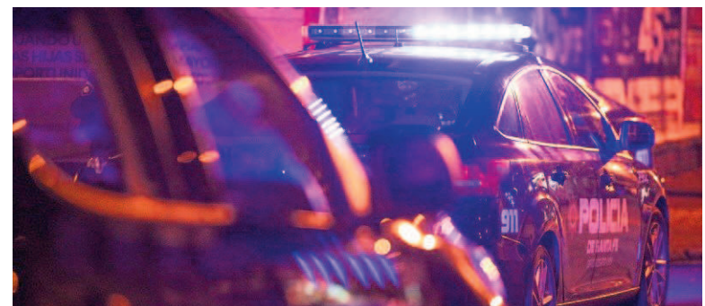
La localidad es escenario de disputas entre bandas.

Aunque la cantidad de impactos no coincide con el número de proyectiles hallados, la policía recogió al menos 37