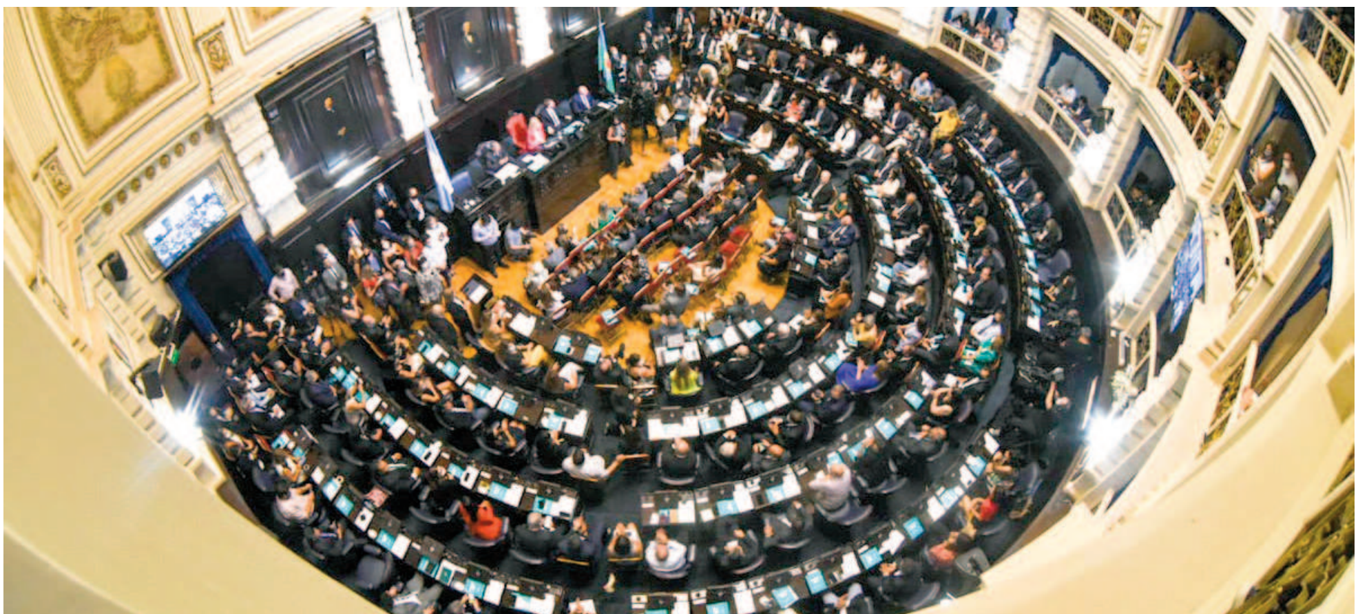
En las legislativas del 7 de septiembre, la Segunda Sección Electoral renueva sus 11 bancas en la Cámara de Diputados bonaerense.