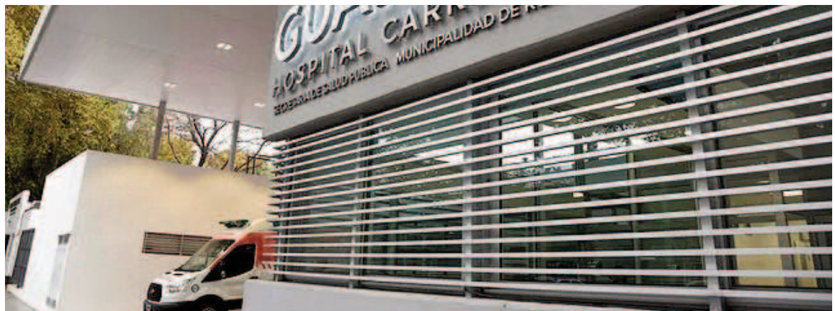
El hombre baleado en la zona oeste fue trasladado por particulares al Carrasco.

Tras recibir las primeras atenciones, los médicos del nosocomio público no pudieron rescatar a la víctima y declararon su fallecimiento producto de la grave herida producida por el ataque a tiros.