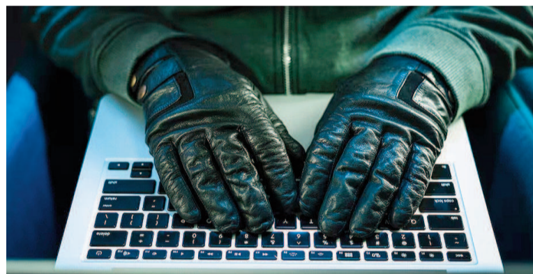
En foros de la dark web, los usuarios celebran la velocidad con la que estas herramientas evolucionan.

En los primeros meses de 2025, la Internet Watch Foundation (IWF) ha identificado 1.286 materiales audiovisuales ilegales generados con inteligencia artificial, una cifra que representa un aumento drástico.