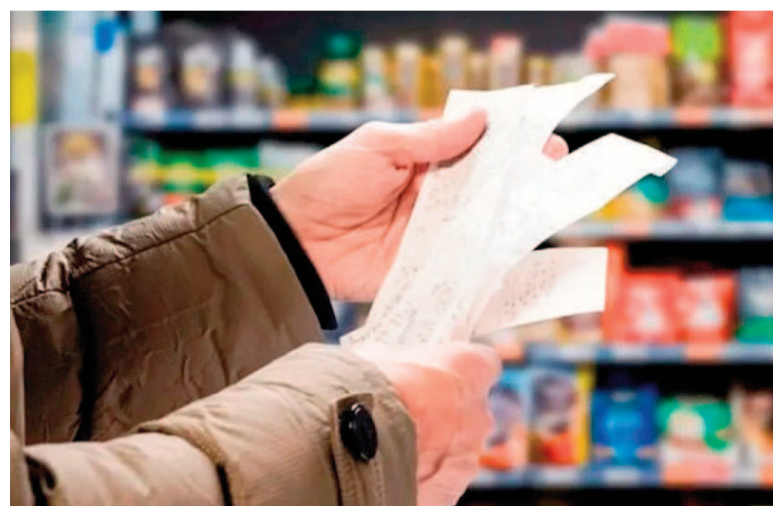
En junio, una familia tipo necesitó $1.128.398 para no ser pobre.

Asimismo, esa misma familia requirió $506.008 para no caer en la indigencia, dado que ese fue el valor de la CBA. Vale recordar que el valor de esta cesta se determina tomando en cuenta los nutrientes imprescindibles que un varón adulto de entre 30 y 60 años debe satisfacer durante un mes. Los alimentos y sus cantidades se toman en función de los