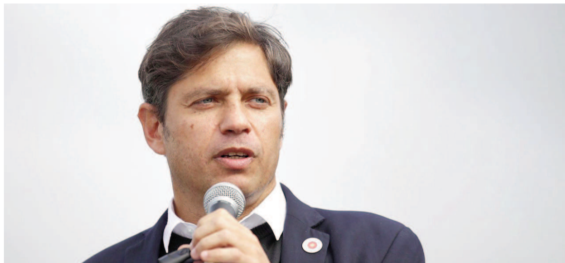
El gobernador Axel Kicillof.

El gobernador provincial reconoci  las diferencias que existen dentro del peronismo, a las que calific  como “miradas distintas”, pero sostuvo que hay “una urgencia que supera cualquier diferencia o disputa”. “En cada plenario, militantes, trabajadores y vecinos nos piden lo mismo a los dirigentes: vayan juntos”, remarc . Kicillof asegur  que la motosierra de Milei “se est  volviendo cada vez m s despiadada”, y su autoritarismo “dej  de ser solo un dis-