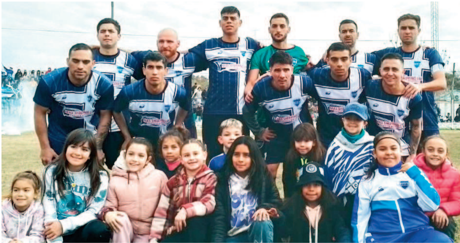
El General goleó y definirá el título frente a Regatas.

El conjunto de Pérez Millán goleó 5-0 al Granate como local en la segunda semifinal y jugará la final de la Liga Nicoleña en su primera participación.