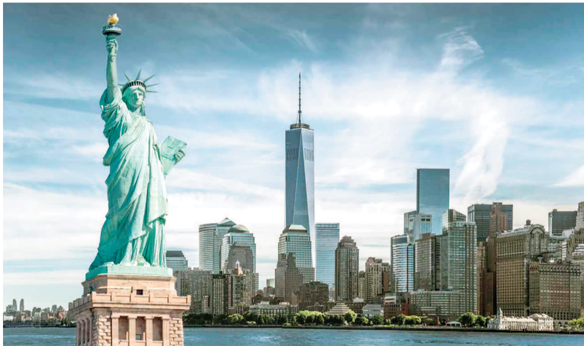
Nueva York está entre las ciudades más felices del mundo.

El informe destaca que la felicidad urbana no se puede alcanzar con una única fórmula, sino con políticas públicas sostenidas y evaluaciones constantes. Algunas localidades analizadas mejoraron su ranking al implementar medidas exitosas en salud mental, seguridad o movilidad.