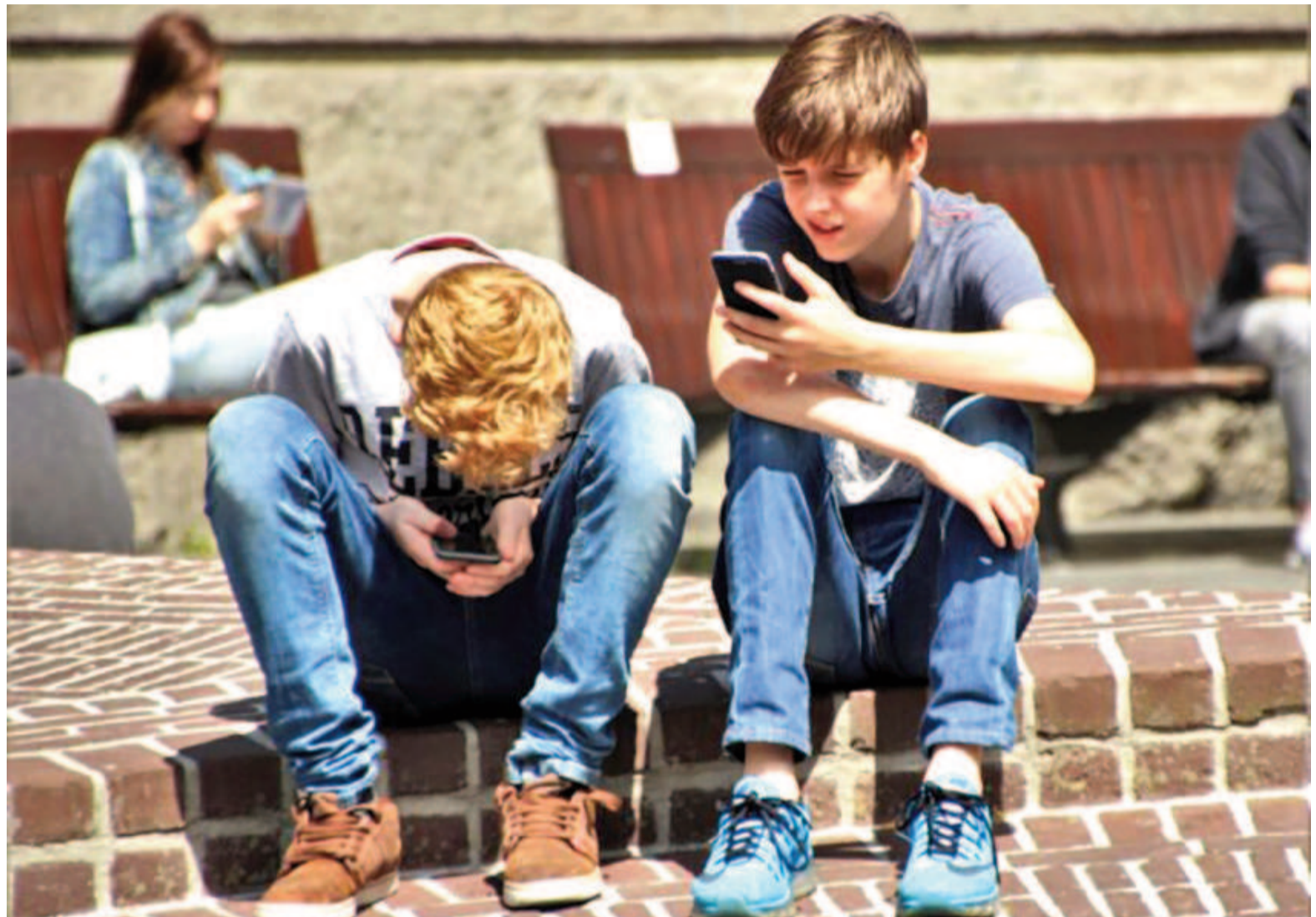
Chicos de la generación alfa.

¿Y las IA? Un papelón. GPT-4, Claude, Gemini y Llama 3 entendieron solo entre el 32,5% y el 42,3% de los casos en los que había intención de daño. Es decir, más de la mitad del bullying digital pasó totalmente inadvertido para sistemas diseñados, en parte, para protegernos de eso.