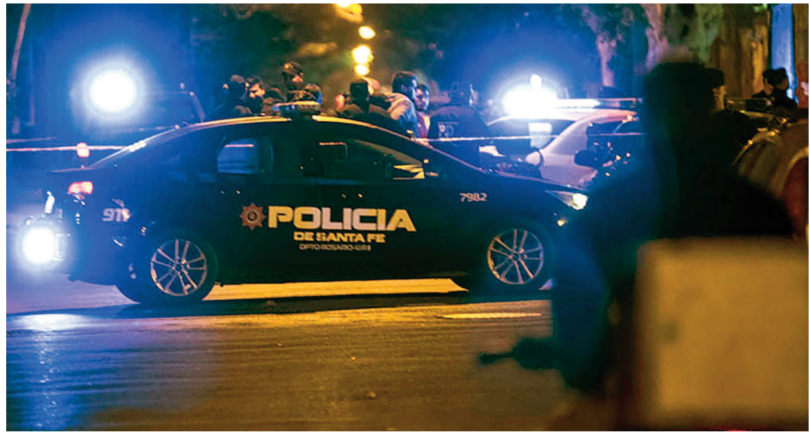
Un menor perdió la vida tras una balacera.

Un chico de 13 años fue asesinado con varios disparos en el torso y su primo de 8 está internado con dos heridas de bala, una en la cabeza. El brutal ataque a tiros sucedió contra una casa de la zona sudoeste, en barrio Tío Rolo.