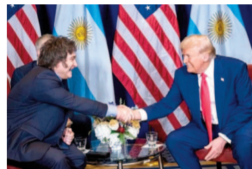
Javier Milei y Donald Trump durante una reunión en la CPAC, en Washington

Desde esta perspectiva, Lutnik y Greer eran flexibles para negociar determinados aranceles de los bienes argentinos que se exportan a los Estados Unidos. Pero se mantuvieron reacios para aceptar una baja a los aran-