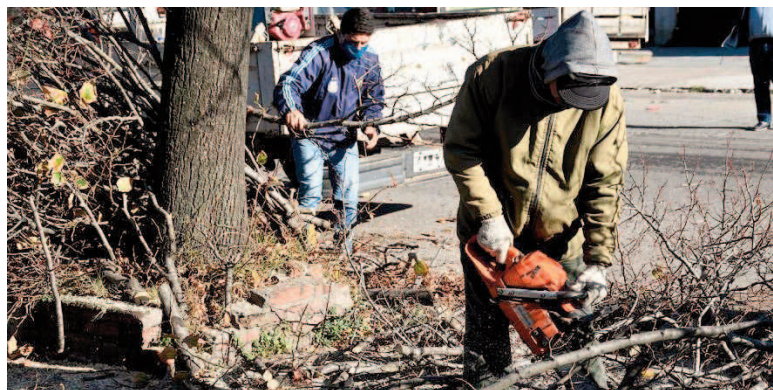
Modifican la ordenanza vigente sobre podas.

El Concejo Deliberante aprobó una propuesta de la oposición para modificar la ordenanza vigente sobre podas (Nº 5784/18), con el objetivo de mejorar los mecanismos de control, sanción y concientización sobre esta práctica tan importante para el cuidado del ambiente. Según explicaron, estos cambios son necesarios, no solo para actualizar la normativa, sino también para generar mejores mecanismos de control y sanción. Uno de los aspectos tiene como fin las podas clandestinas o incorrectas, que continúan efectuándose.