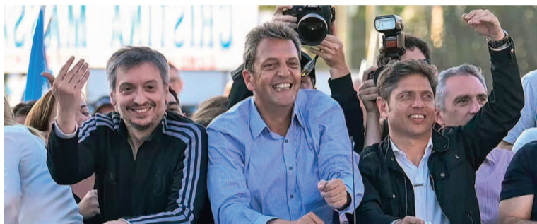
Kicillof ubica mejor a sus candidatos en Fuerza Patria.