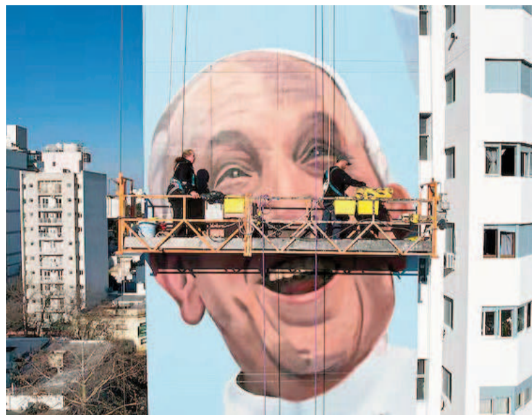
El enorme mural durante su producción.

murales. Junto a su equipo, Al Escobarón, ya pintó murales de figuras icónicas como Diego Maradona y Lionel Messi en Buenos Aires. Pintó otras imágenes en los silos de Rosario y en las calles de San Nicolás, en el interior de las provincias de Santa Fe y de Buenos Aires. Y en las playas de Miramar.