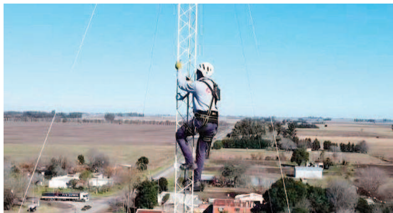
Se concretó el enlace Pérez Millán - Paraíso - Ramallo.

El Ejecutivo local informó que se concretó el enlace Pérez Millán - Paraíso - Ramallo. De este modo, en breve las cámaras de seguridad de la localidad se podrán vincular con el Centro de Monitoreo Municipal.