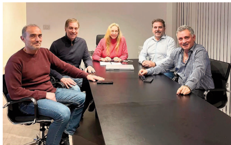
Prórroga en Provincia, libertarios denuncian "juego sucio" y cuestionan apagones durante el cierre.