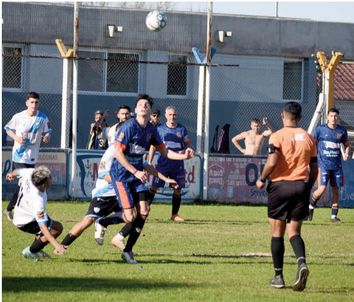
El Náutico fue más y sumó de a tres. EL NORTE

Incidencias: 42m ST expulsado Troilo (P).