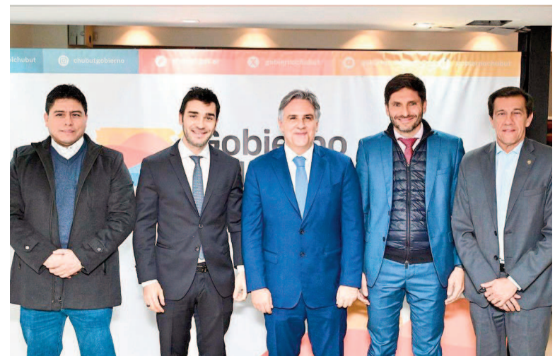
Gobernadores Vidal, Torres, Llaryora, Pullaro, y Sadir.

"Nuestra vocación es clara: construir, todos los días, la Argentina de los sueños de todos", concluyeron los mandatarios provinciales.