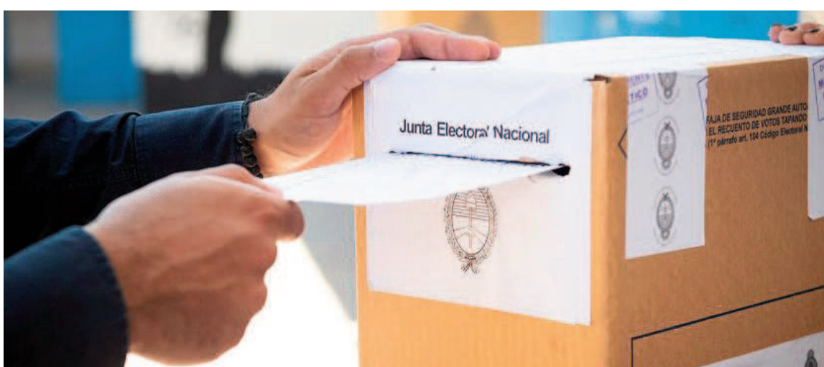
Tratan de impedir candidaturas testimoniales.