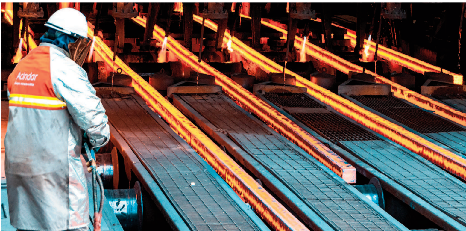
La Cámara Argentina del Acero está integrada por las siderúrgicas Ternium, Tenaris, Acindar, Gerdau y Acerbrag.

El análisis incluyó la actualidad de los sectores demandantes del acero, que en su mayoría transitan un período de baja actividad, lo que se termina reflejando en la menor producción registrada durante el mes pasado.