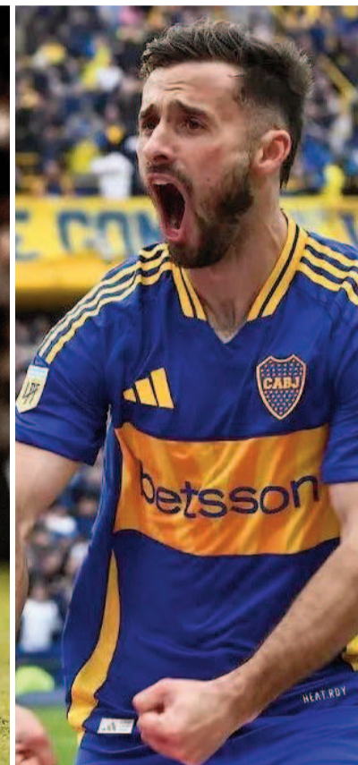
Los tres futbolistas no se entrenarán más con el plantel mayor del Xeneize. WEB

tocircuito (ya habían discutido en Miami), rápidamente trascendió desde las entrañas de Boca Predio que ninguno de los tres iba a estar citado para algunos entrenamientos de doble turno que están programados para el viernes y el sábado.