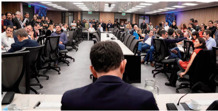
El plenario de la comisión investigadora.

«Distintas expresiones de los bloques de Unión por la Patria o Democracia para Siempre demuestran que