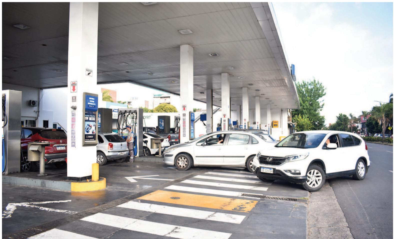
En las estaciones de servicio YPF de San Nicolás, el precio de los combustibles registró bajas de entre el 0,29% y el 0,52%.

A través del Real Time Intelligence Center (RTIC), la petrolera estatal definió 170 corredores en todo el país donde se monitorean variables clave como la afluencia de autos, la ubicación estratégica de las estaciones y el entorno competitivo.