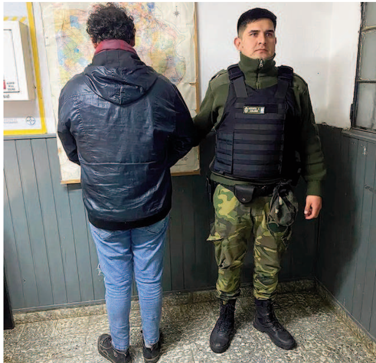
El sujeto fue trasladado apprehendido a una dependencia policial.

Ante esta situación, los uniformados procedieron a su apprehensión inmediata y lo trasladaron a la dependencia policial a