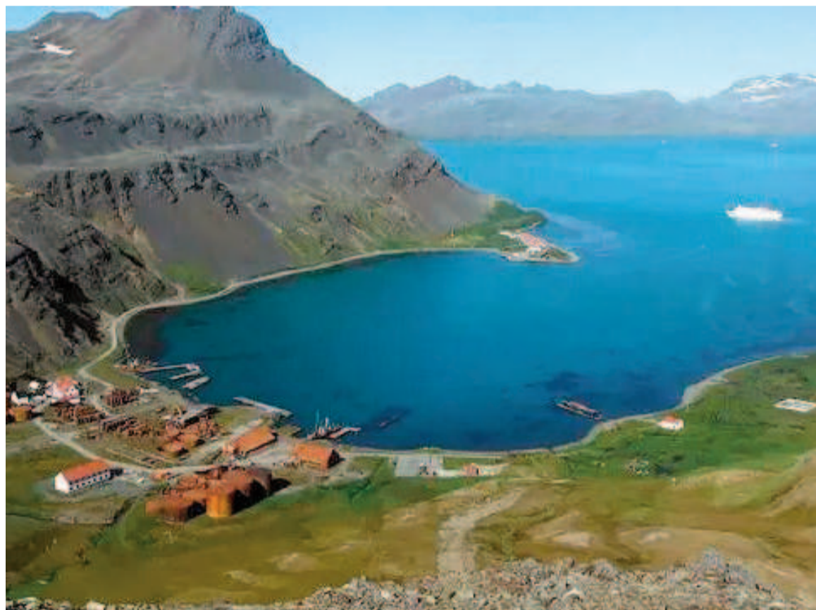
Ambos sismos fueron en zonas remotas y sin consecuencias para la población.

El Servicio de Hidrografía Naval y el USGS reportaron un temblor de magnitud 5,6 en el Atlántico Sur, mientras que en Jujuy se registró un movimiento leve.