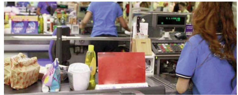
Nuevo acuerdo paritario en Comercio.

El sindicato de comercio informó que el acuerdo paritario con la CACC alcanza un incremento del 6% en los sueldos de los empleados, repartido en los meses de julio, agosto, septiembre, octubre, noviembre y diciembre. El alza