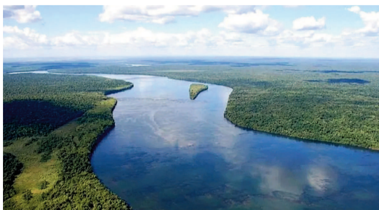
El agua dulce almacenada en los continentes desaparece a un ritmo sin precedentes, según un estudio basado en datos satelitales de 22 años.

la disponibilidad de agua dulce está disminuyendo y el aumento del nivel del mar se está acelerando. Las consecuencias de continuar con la sobreexplotación del agua subterránea podrían socavar la seguridad alimentaria y del agua para miles de millones de personas en todo el mundo. Este es un momento de 'todas las manos a la obra': necesitamos una acción inmediata en materia de seguridad hídrica global", agregó en el comunicado oficial de la universidad.