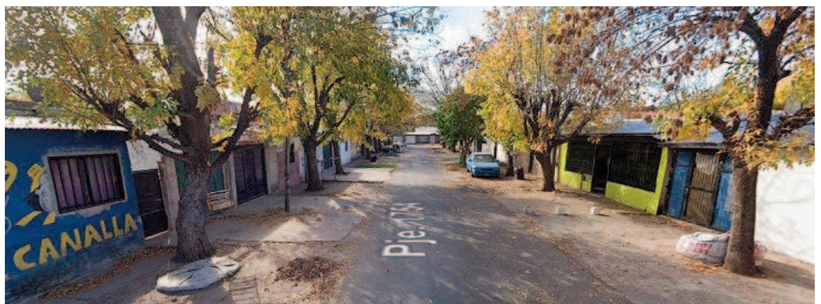
Pasaje 1754 al 2000, donde tuvo lugar el ataque.

Personal de la Policía de Investigaciones realizó las primeras medidas por pedido del Ministerio Público de la Acusación, como la toma de testimonios, relevamiento de cámaras, levantamiento del material balístico y del papel.