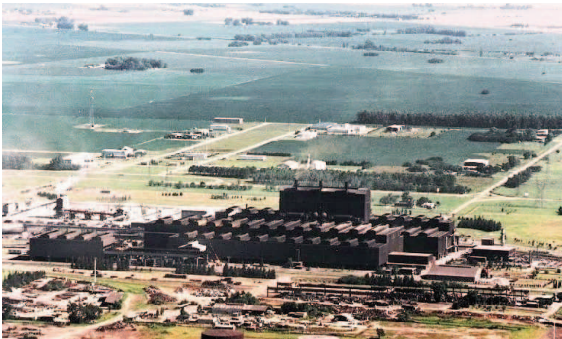
SOMISA, en San Nicolás. ILUSTRACIÓN WEB

El primer gobierno de Perón, a través del fomento de la producción de materias primas nacionales planeado en su Plan Quinquenal, le otorgó a la DGFM un protagonismo y responsabilidad considerable en lo que respecta al desarrollo de actividades de ciencia y tecnología en ese momento. El organismo efectuaba ex-