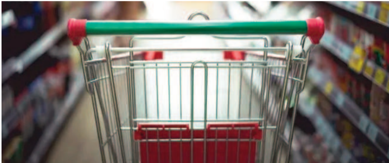
Inflación, la cuestión central para el Gobierno en su plan económico.

El dato surge de la última actualización del informe de Perspectivas de la Economía Mundial (World Economic Outlook) del FMI.