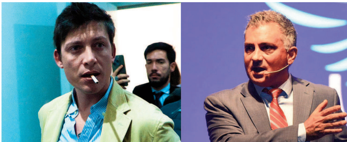
Santiago Caputo y Sebastián Pareja fueron convocados por Karina Milei.

La hermana del presidente de la Nación, Javier Milei, convocó a ambos dirigentes a una mesa política de la que también participaron el diputado nacional y probable candidato a gobernador bonaerense por LLA, José Luis Espert, y su propio asesor en la Secretaría General, Eduardo "Lule" Menem.