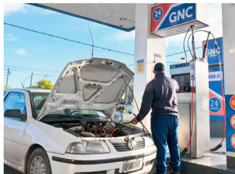
Se interrumpió el suministro de GNC en estaciones de servicio.

en hogares alcanzó un récord histórico de 100 millones de metros cúbicos diarios, lo que precipitó la primera reunión del comité en el año, convocada el martes por la noche a pedido de la distribuidora Camuzzi y continuada esta mañana. Para comparar, los picos de los últimos años no habían superado los 96 millones de metros cúbicos.