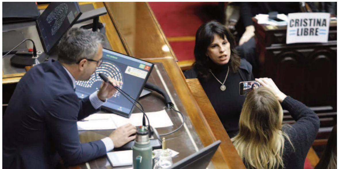
Otra sesión vergonzante en Diputados.