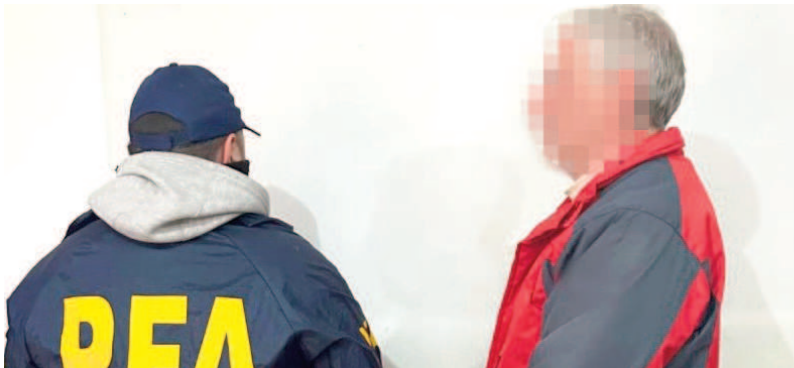
El sospechoso estaba evadido desde que encontraron la cocaína en Empalme Graneros.