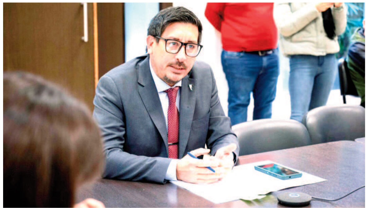
El diputado Martín Rozas, de Unión, Renovación y Fe.

El bloque libertario se basa en que “Docentes y padres coinciden en señalar que, en muchos casos, el uso del celular en clase dificulta la atención y la participación activa; además promueve conductas indeseadas tales como el cyberbullying, que se manifiestan a través de mensajes insultantes, amenazas, difusión de rumores, publicación de contenido humillante y la exposición a contenidos inapropiados. Asimismo, fragmenta la atención, reduce la capacidad de concentración, dificultando la adquisición de conocimientos. Entendemos que, al limitar el acceso a este tipo de contenido durante las