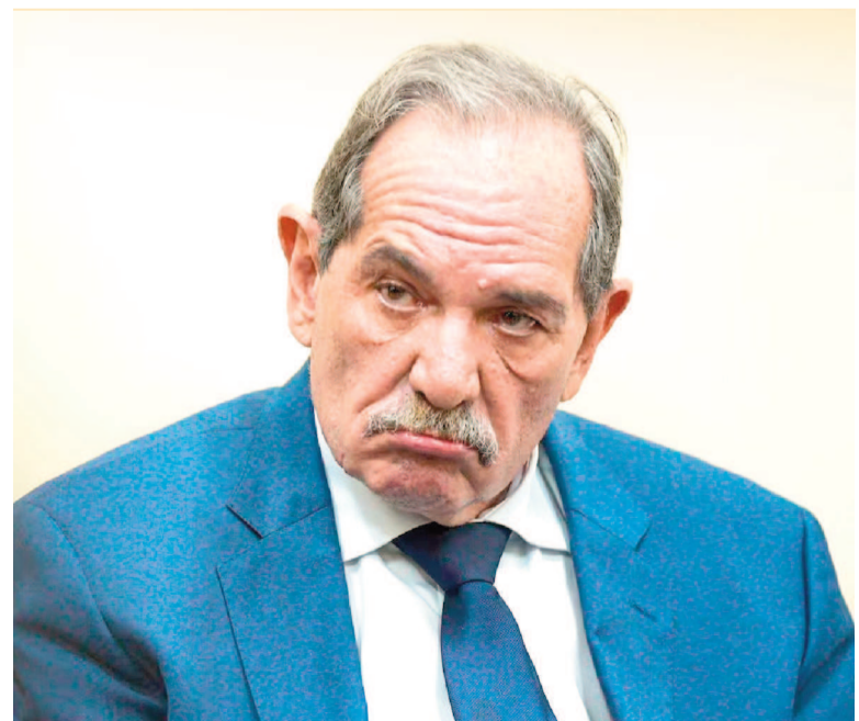
José Alperovich "goza" de reclusión domiciliaria.

El caso sigue siendo seguido de cerca por organismos de derechos humanos y colectivos feministas, quienes destacaron la solidez del fallo condenatorio y advirtieron sobre la necesidad de garantizar que se cumplan todas las restricciones impuestas.