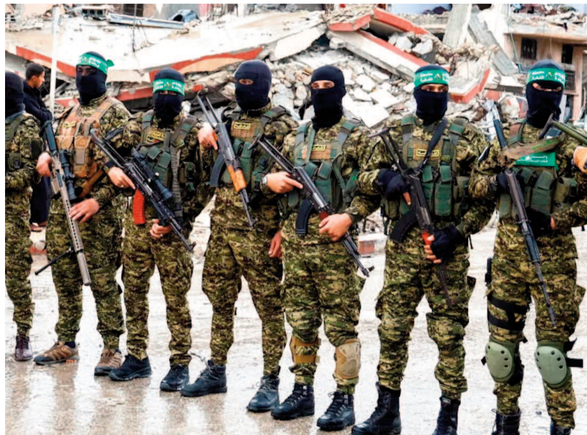
Milicianos de Hamás en Gaza.

Israel ya aceptó el plan propuesto por Estados Unidos. Hamás aseguró que trabaja para "salvar las distancias entre las partes".