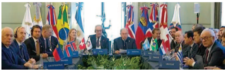
El bloque anunció el acuerdo con el EFTA.

En el marco de la Cumbre del Mercosur —que se lleva a cabo en Argentina—, el espacio común regional confirmó que se alcanzó un acuerdo por el tratado de libre comercio con el bloque europeo EFTA, compuesto por Islandia, el Principado de Liechtenstein, el Reino de Noruega y la Confederación Suiza. Las autoridades de Cancillería argentina destacaron que el acuerdo creará un área de «casi 300 millones de personas con un PIB combinado de más de US$ 4,3 trillones».