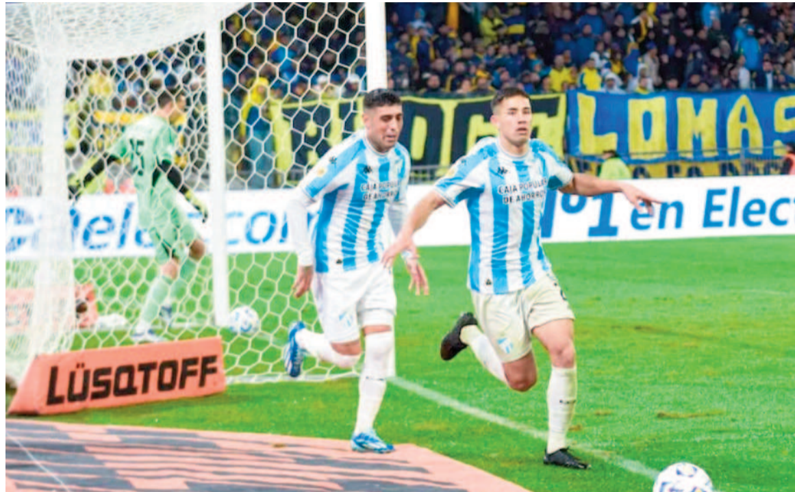
Los tucumanos festejaron un gran triunfo en el Madre de Ciudades.

El Decano aprovechó sus chances para derrotar al Xeneize por 2 a 1 en Santiago del Estero y avanzó a octavos de final. Clever Ferreira y Bajamich anotaron para el albiceleste; descontó Cavani.