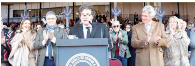
Javier Milei volverá a la Rural.

El Presidente hará pública la decisión en su discurso en la Sociedad Rural. Se aplicaría a las exportaciones de novillos. Y no afectaría a los granos.