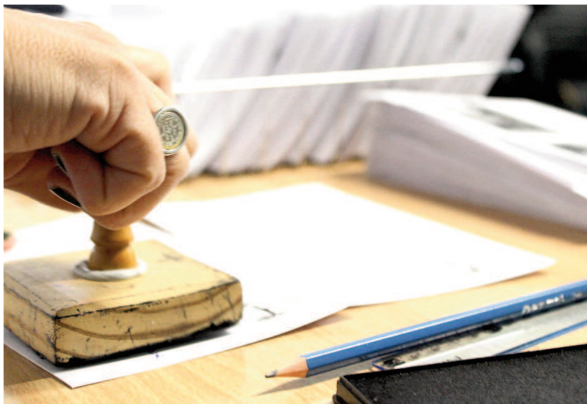
Desde la Junta Electoral informan que no se inscribió ninguna lista nicoleña de Fuerza Patria para competir por bancas en el Concejo. ILUSTRACIÓN

Sin embargo, ¿llegarán ambas listas a competir? ¿Llegará alguna de las dos? En otros términos, acaso más dramáticos: ¿habrá candidatos