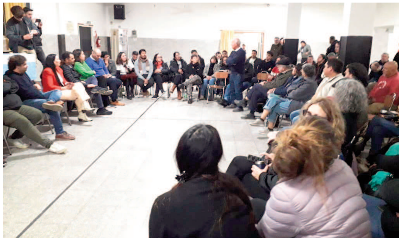
La redacci n del comunicado fue consensuada este martes en una reuni n de dirigentes de distintos sectores enrolados en el MDF.

Las organizaciones que integran en San Nicolás el Movimiento Derecho al Futuro repasaron el caótico cierre de listas de la quebrada alianza Fuerza Patria. Indicaron que la unidad no fue posible debido a “mezquindades, egoísmos y personalismos por parte de quien conduce La C mpora en San Nicol s”.