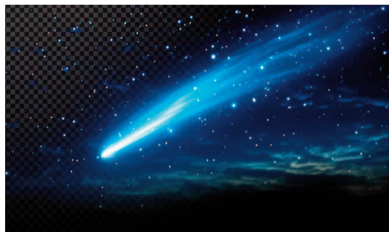
El cometa C/2025 K1 (ATLAS) será el visitante más brillante de finales de 2025.

sibilidad de observación dependerá de la latitud y de la ausencia de contaminación lumínica.