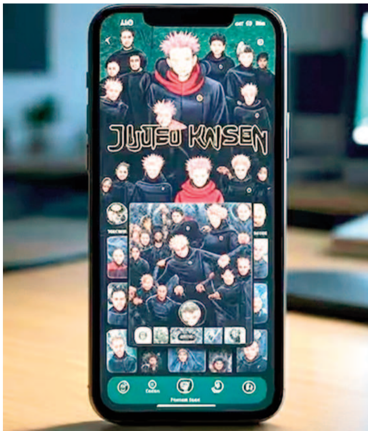
«Modo Jujutsu Kaisen» en WhatsApp.

En caso de que el usuario quiera regresar el logo a como estaba antes, puede volver a entrar a Play Store y desinstalar Nova Launcher. Luego de hacerlo, los cambios de personalización de la interfaz realizados con esta aplicación desaparecerán.