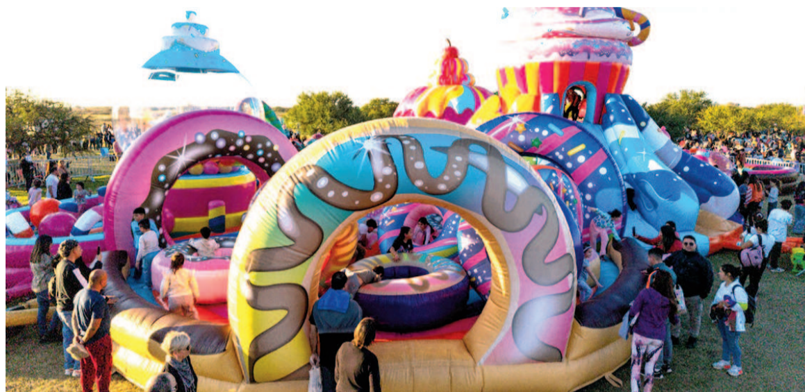
El Festival Río tiene como novedad al parque inflable «Candyland», hasta el 10 de agosto, de 12 a 18 horas.

El Festival Río ofrece múltiples atracciones para todas las edades. La gran novedad de esta edición es «Candyland», el parque inflable que se presenta como el más grande del país, que deslumbra a los más chicos con una estructura imponente inspirada en un mundo de golosinas y colores. Además de esta atracción estrella, el evento cuenta con áreas deportivas y recreativas, una zona kids especialmente diseñada para la primera infancia, el clásico Yaguarón –el juego más grande de la ciudad–, espacios de descanso, food trucks, baños públicos y un estacionamiento para más de 300 autos. En su primera edición en 2024, el Festival Río reunió a más de 300.000 personas de San Nicolás y la región. En esta ocasión se extenderá hasta el 10 de agosto, todos los días de 12 a 18 horas.