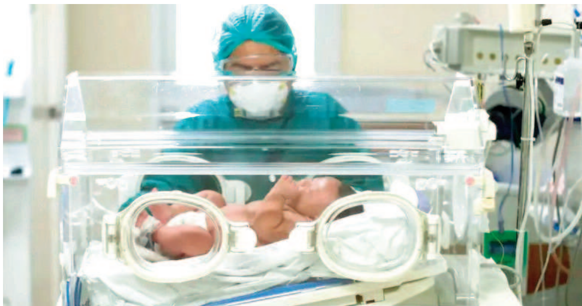
La beba nacida prematura está asistida en forma integral con cuidados pediátricos intensivos.

Aunque lamentablemente no fue posible revertir el cuadro cardíaco que terminó con la vida de la madre, los médicos lograron realizar una cesárea de emergencia para rescatar a la recién nacida, que ahora per-