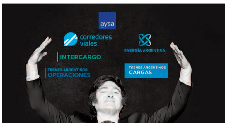
Algunas de las empresas a privatizar.