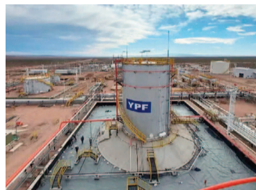
Novedades del fallo YPF.

La defensa nacional pidió mantener en suspenso la transferencia de las acciones mientras se resuelve la apelación sobre la cuestión de fondo: si la expropiación de YPF en