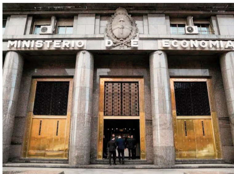
El primer semestre de 2025 cerró con superávit.

También se indicó que las remuneraciones alcanzaron los $1,3 billones, con un alza de 29,0% interanual, atribuida a los incrementos