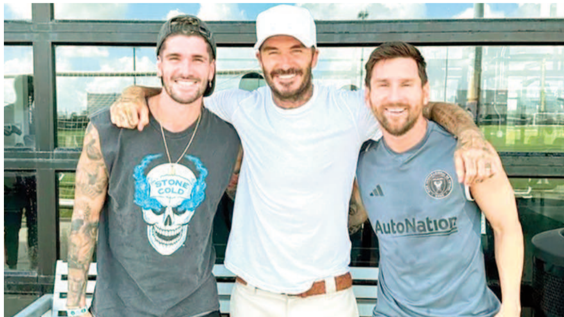
De Paul, David Beckham y Messi, juntos en Miami.

Se trata del quinto equipo en la carrera del exRacing, que jugó en Valencia, Udinese y llega procedente de Atlético de Madrid, donde disputó cuatro temporadas y anotó 14 goles en 186 encuentros.