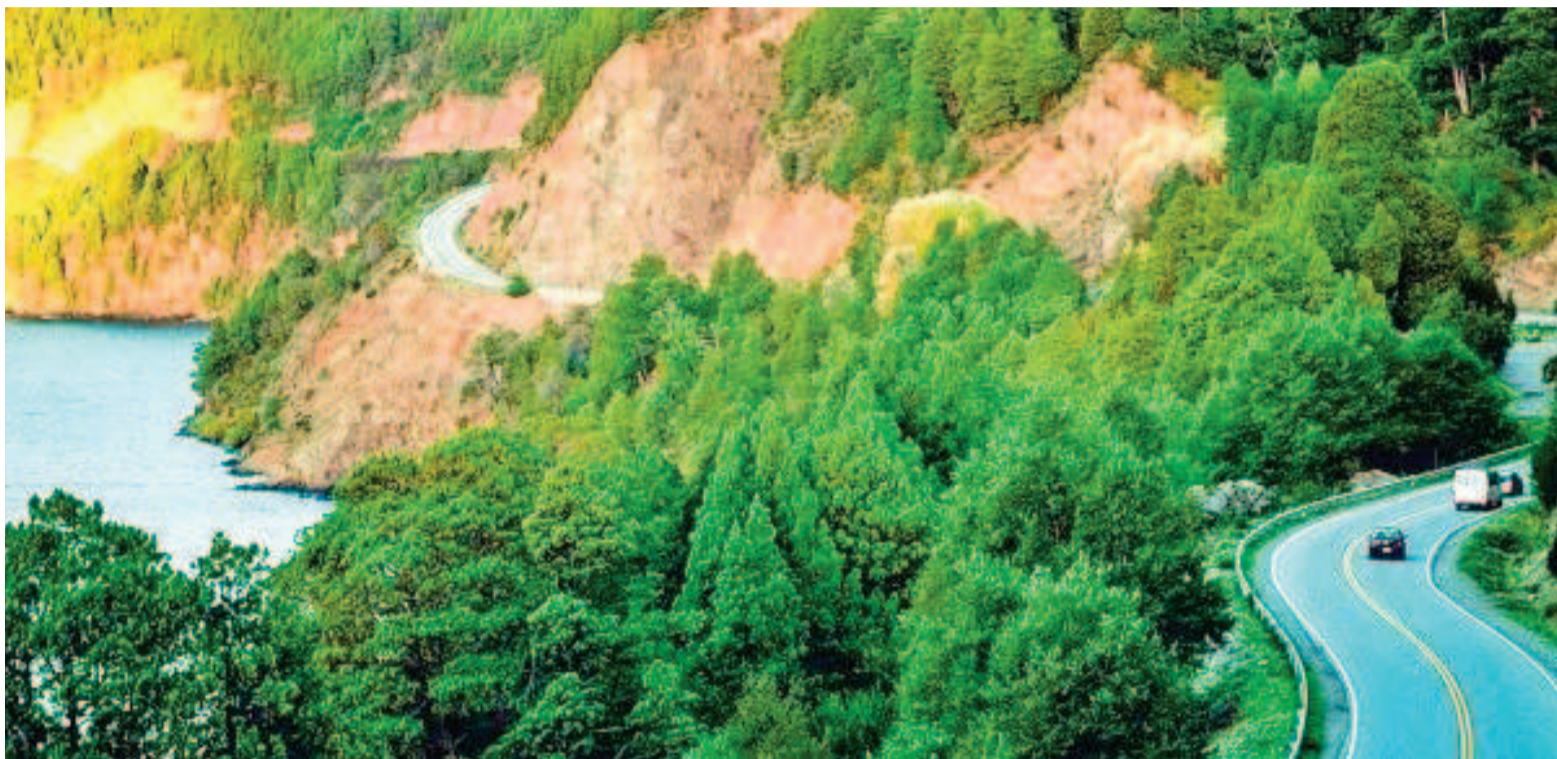
Distintos paisajes naturales se pueden recorrer en la Ruta de los Siete Lagos.

Meliquina y Lolog se integrarán al recorrido clásico entre San Martín de los Andes y Villa La Angostura. El circuito se llamará Paseo de los Nueve Lagos.