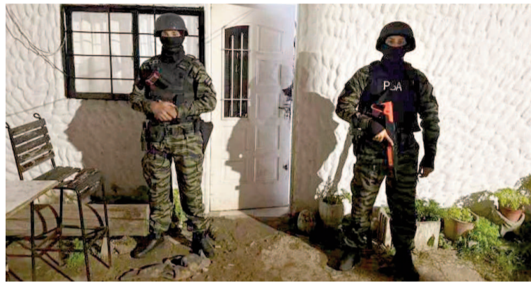
Rosario, la primera ciudad donde se activará la Ley Antimafias.

En detalle, la decisión judicial establece el encuadre de una "zona sujeta a investigación especial", conforme al artículo 4º de la Ley Antimafia, y habilita el uso de herramientas excepcionales de investigación en un perímetro geográfico demarcado.