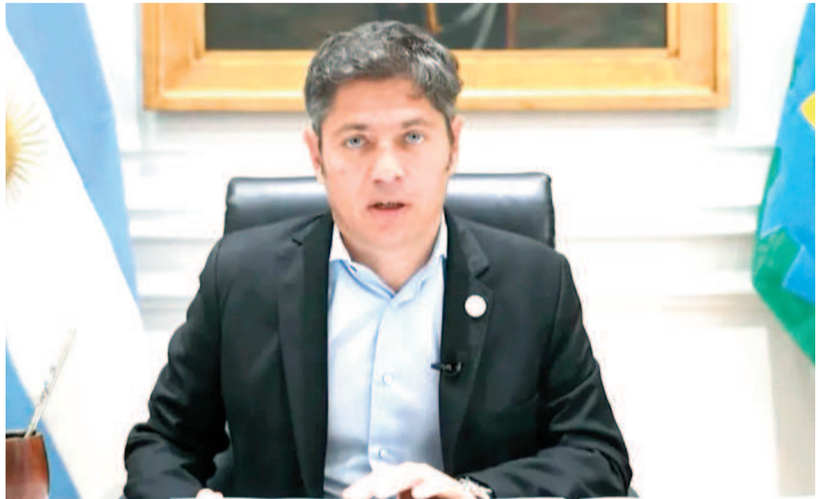
Axel Kicillof durante el cierre del 3° Congreso Productivo Bonaerense.

Durante el congreso, participaron el ministro de Producción, Ciencia