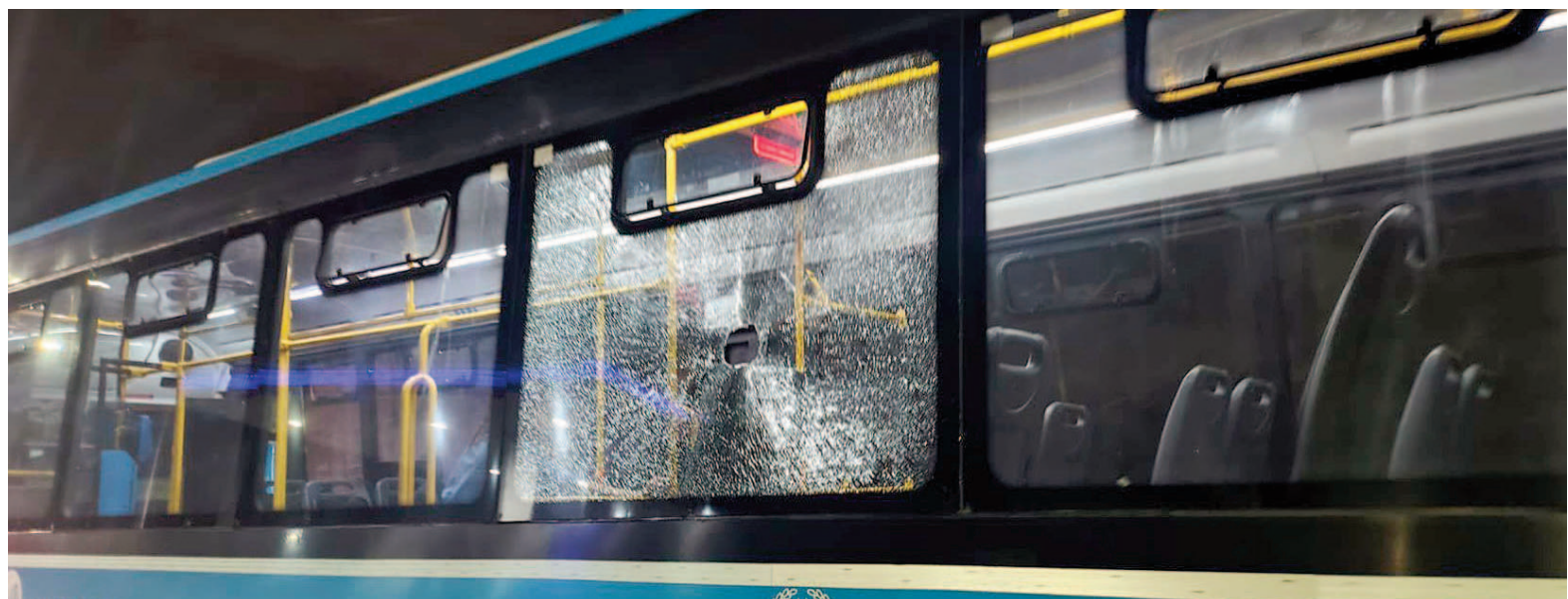
La conductora del colectivo asistió a la víctima apenas estalló el cristal.

Apenas sintió el piedrazo, la chofer fue a buscar a la joven y la llevó hacia el otro lado del ómnibus para que volviera a sentarse. Los médicos del Sies constataron que no tenía heridas graves, pero ayer miércoles continuaba con molestias en el ojo izquierdo. La víctima aseguró: