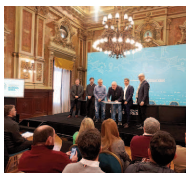
Ramallo adhirió al MUNA.

Esta jornada estuvo a cargo de representantes de Unicef, equipos técnicos y el Grupo Pharos, en el marco del acompañamiento meto-