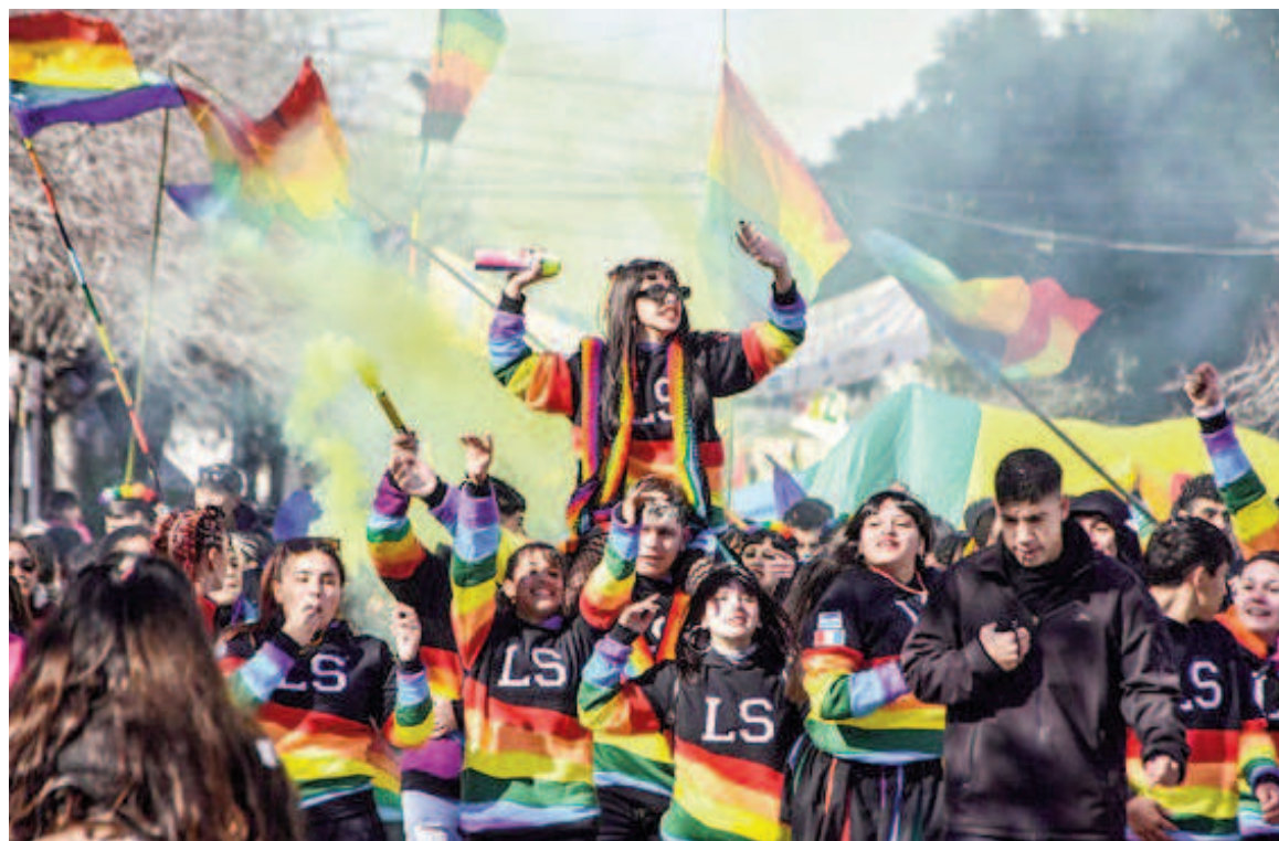
Durante esta semana la ciudad estará inundada de juventud.

Además, destacó que el impacto de las jornadas trasciende fronteras: “Hay intendentes y equipos técnicos que nos consultan cómo organizamos semejante evento. Porque lo nuestro no es solo una competencia: