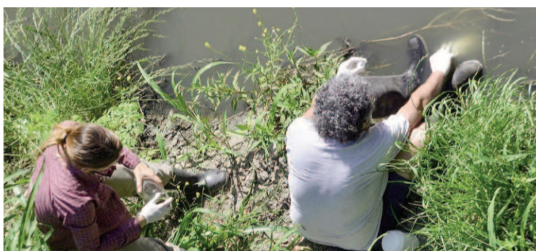
Recolección de muestras por parte de los investigadores. ILUSTRACIÓN WEB

Concretamente, en los arroyos Las Tunas y Crespo, en Entre Ríos, "se documentaron condiciones de extrema toxicidad: cocteles de agrotóxicos, coloración negra, olor pútrido, oxígeno disuelto por debajo de niveles críticos