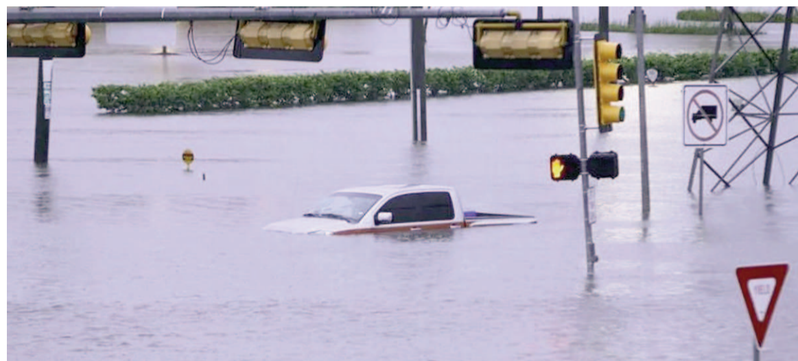
El río creció ocho metros en una hora en Kerrville.

El desborde repentino del río Guadalupe arrasó zonas del centro del estado y dejó una escena de devastación inédita. La búsqueda continúa contra reloj y crece el temor por nuevas lluvias.