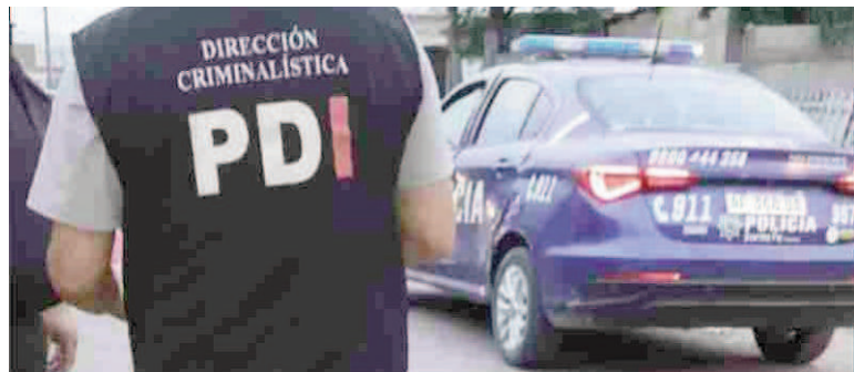
Otra escuela utilizada como "buzón" narco.

La Escuela N° 1333 "Dalagaic Qui-tagac-Nueva Esperanza" fue blanco de una balacera este sábado por la mañana. Tiratiro pasaron por la puerta de la institución, ubicada en Maradona y Qom, y gatillaron al menos tres veces contra la puerta de ingreso.