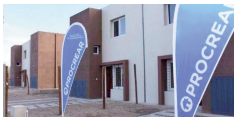
El Gobierno ya eliminó la Secretaría a cargo del Procrear.

La medida aprueba también el modelo de contrato de mandato con el Banco Hipotecario S.A., que continuará