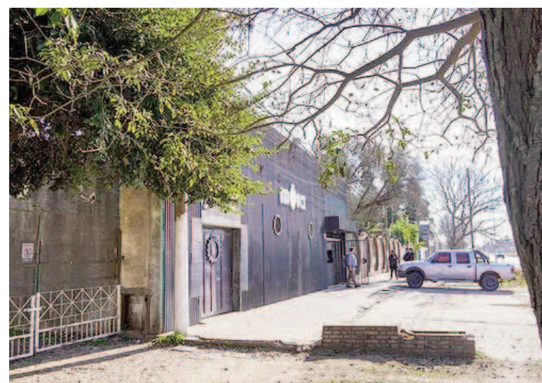
Los policías heridos y la otra víctima estaban afuera del local.

Después de la huida de los delincuentes, el Sistema Integrado de Emergencias Sanitarias (SIES) se encargó de trasladar a la mujer policía que estaba trabajando en el lugar y a su compañero. Tanto los efectivos como el paramédico contratado por los dueños del boliche fueron aten-