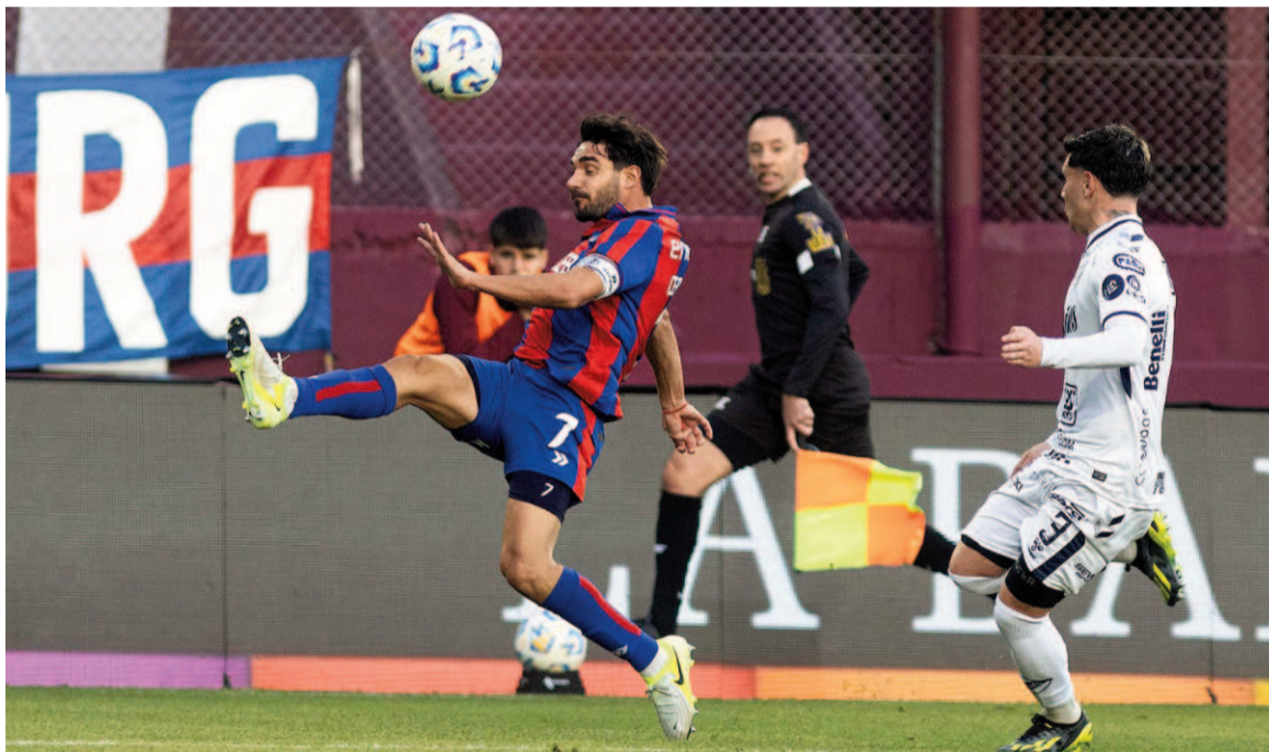
El Ciclón se metió entre los mejores 16 de la Copa Argentina. X SAN LORENZO

El segundo tiempo comenzó sin situaciones claras para ninguno de los dos equipos, pero todo se le empezó a hacer muy cuesta