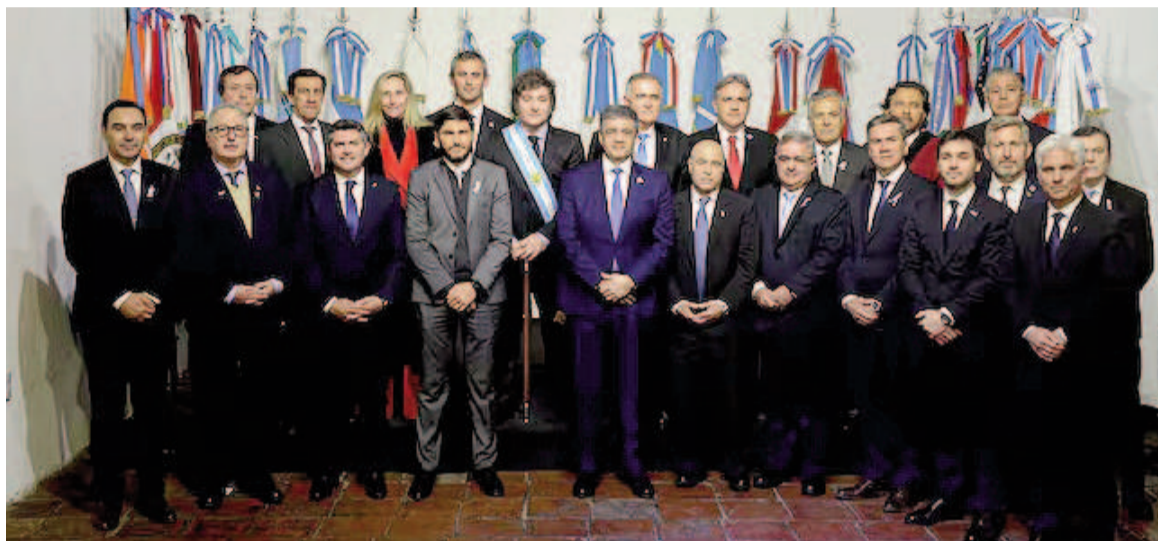
El Gobierno busca frenar, con los gobernadores, la embestida opositora.

Javier Milei y los integrantes del gabinete viajarán a la provincia de Tucumán para la vigilia de 8 de julio por el Día de la Independencia. Estará junto al gobernador Osvaldo Jaldo, que se reunió esta semana con la secretaria general de la Presidencia, Karina Milei. Se trata de un aliado que tensó el vínculo con el oficialismo en las últimas semanas.