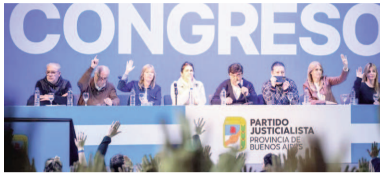
El PJ bonaerense conformará un frente electoral.