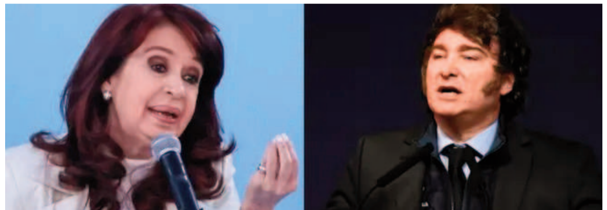
Cristina Kirchner apuntó con duras críticas contra Javier Milei.