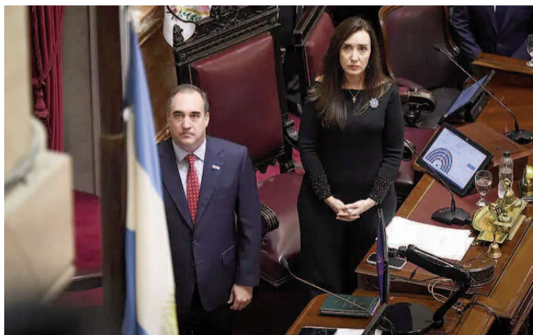
La oposición analiza “autoconvocarse” si no los llama Villarruel.

La jugada opositora “está viciada de nulidad”, coincidieron dos altas fuentes del Senado que conocen el reglamento al detalle. Este permite