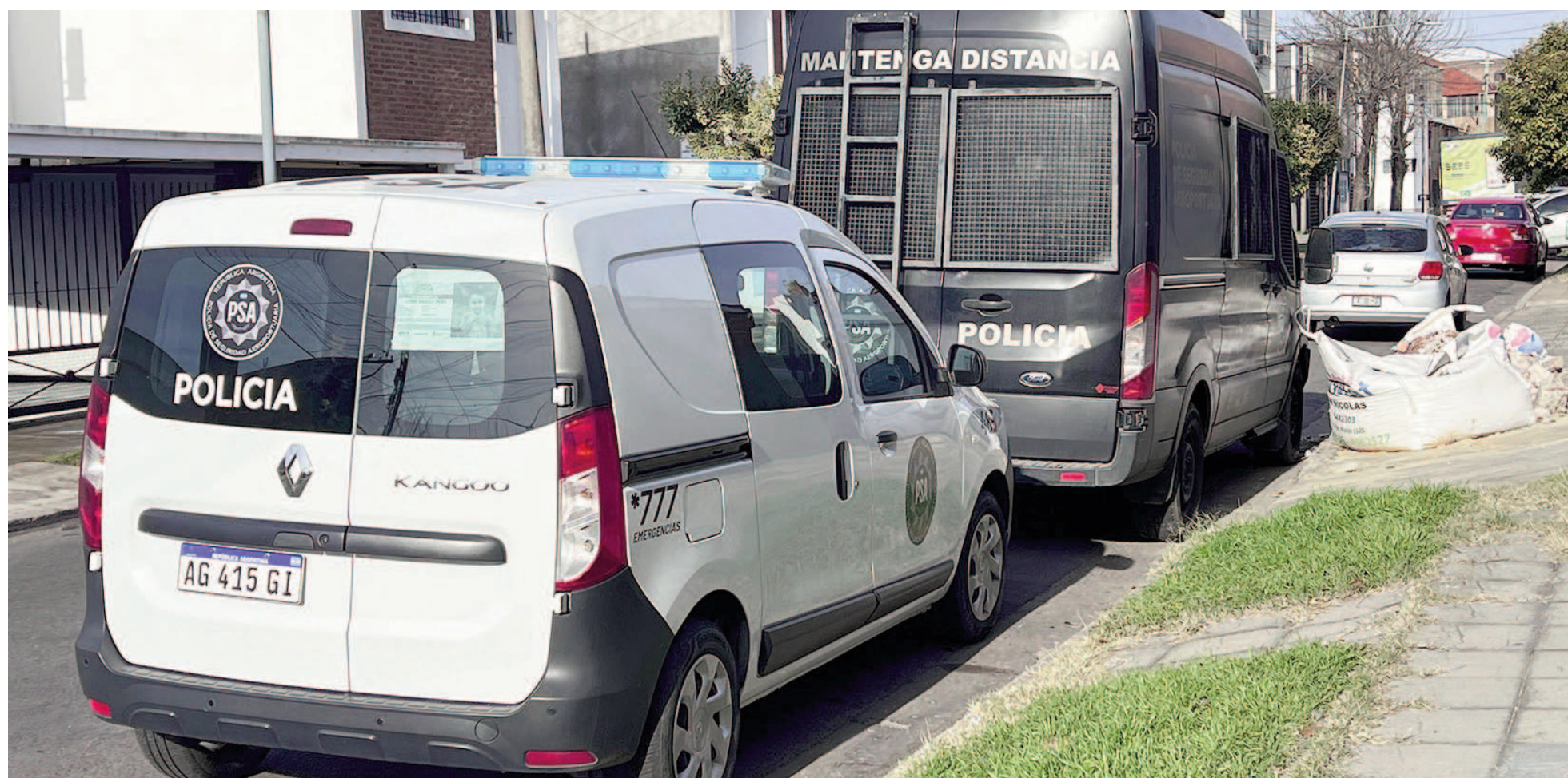
El megaoperativo desplegado este viernes incluyó un total de 22 allanamientos en domicilios de distintas ciudades del país. EL NORTE