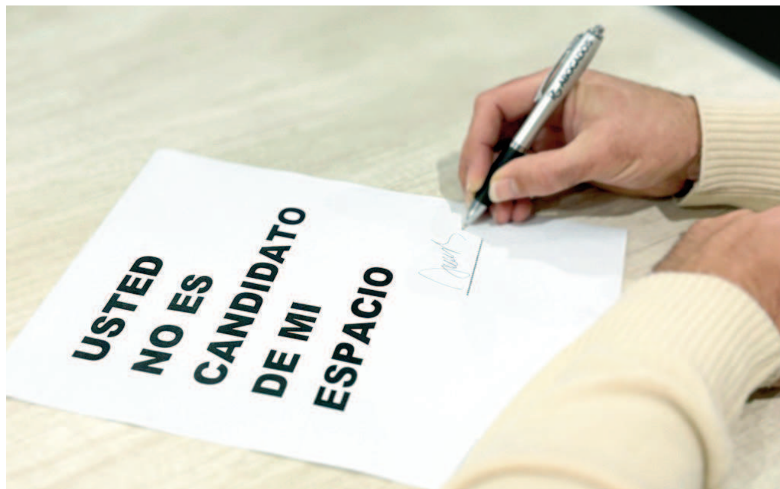
Cuando la posibilidad de un consenso no se alcanza, aparece el poder de la lapicera y el estiletazo deja heridos.