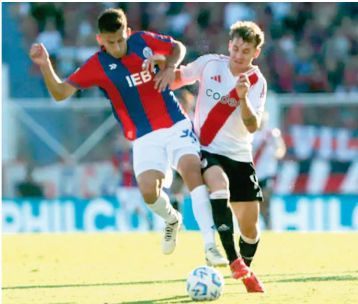
El equipo de Gallardo quiere sumar su tercer triunfo al hilo.