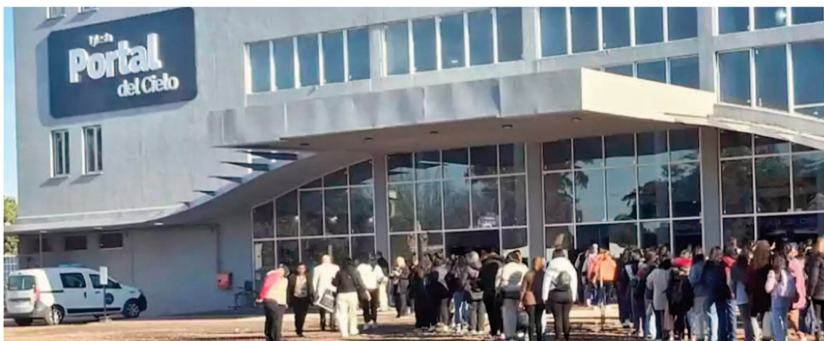
El Gobierno estableció cambios en la inscripción jurídica de las organizaciones religiosas.

Según detalló el Gobierno, ahora los entes relacionados con la reli-