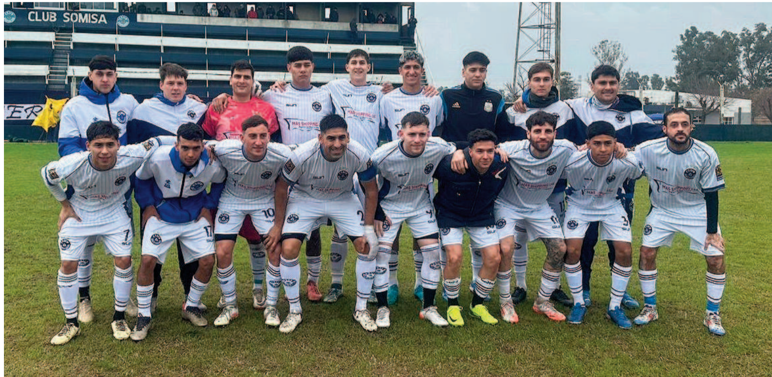
El equipo somisero que ayer venció a 12 de Octubre y es líder.