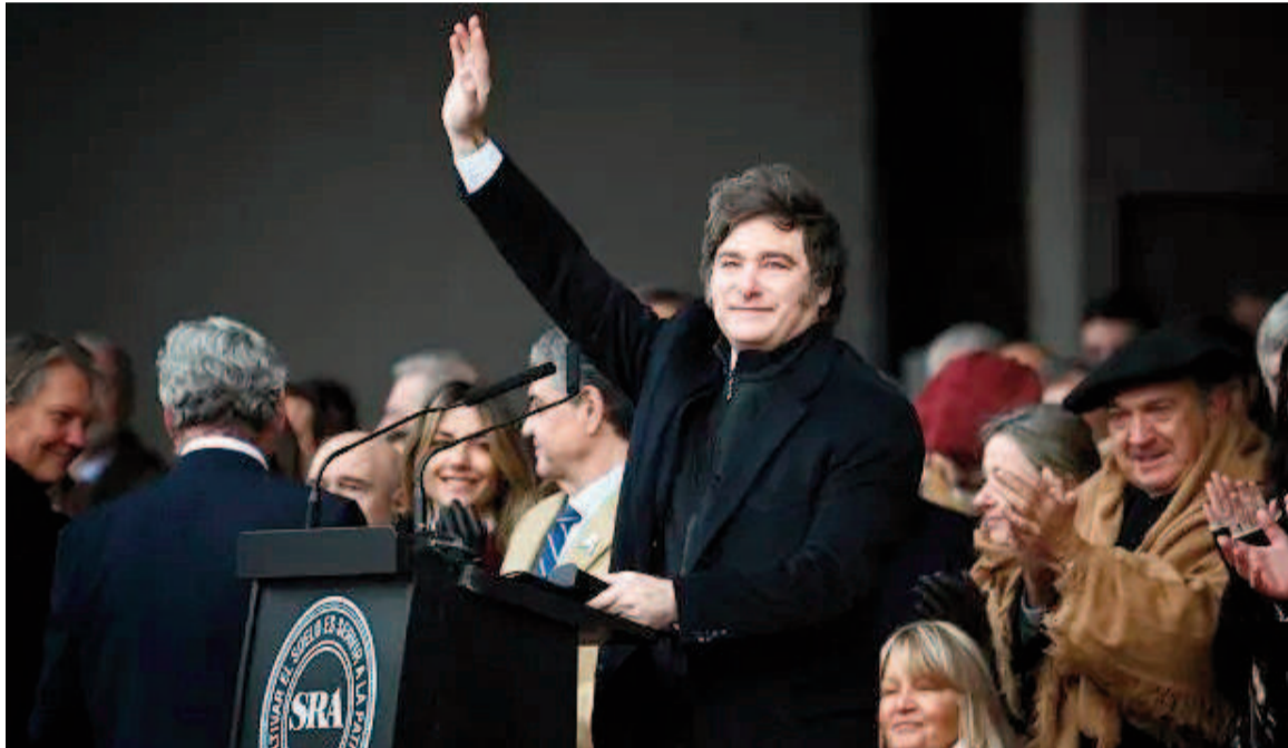
El presidente Javier Milei habló en la Exposición Rural.

En detalle, Milei anunció una reducción en las retenciones a la carne aviar y vacuna del 6,75% al 5%; al maíz, del 12% al 9,5%; al sorgo de 12% a 9,5%; al girasol de 7% y 5% al 5,5% y 4%; a la soja del 33% al 26% y a sus subproductos de 31% a 24,5%. "Esto busca dar impulso al campo, el sector con mayor productividad de la economía y fuertemente castigado por