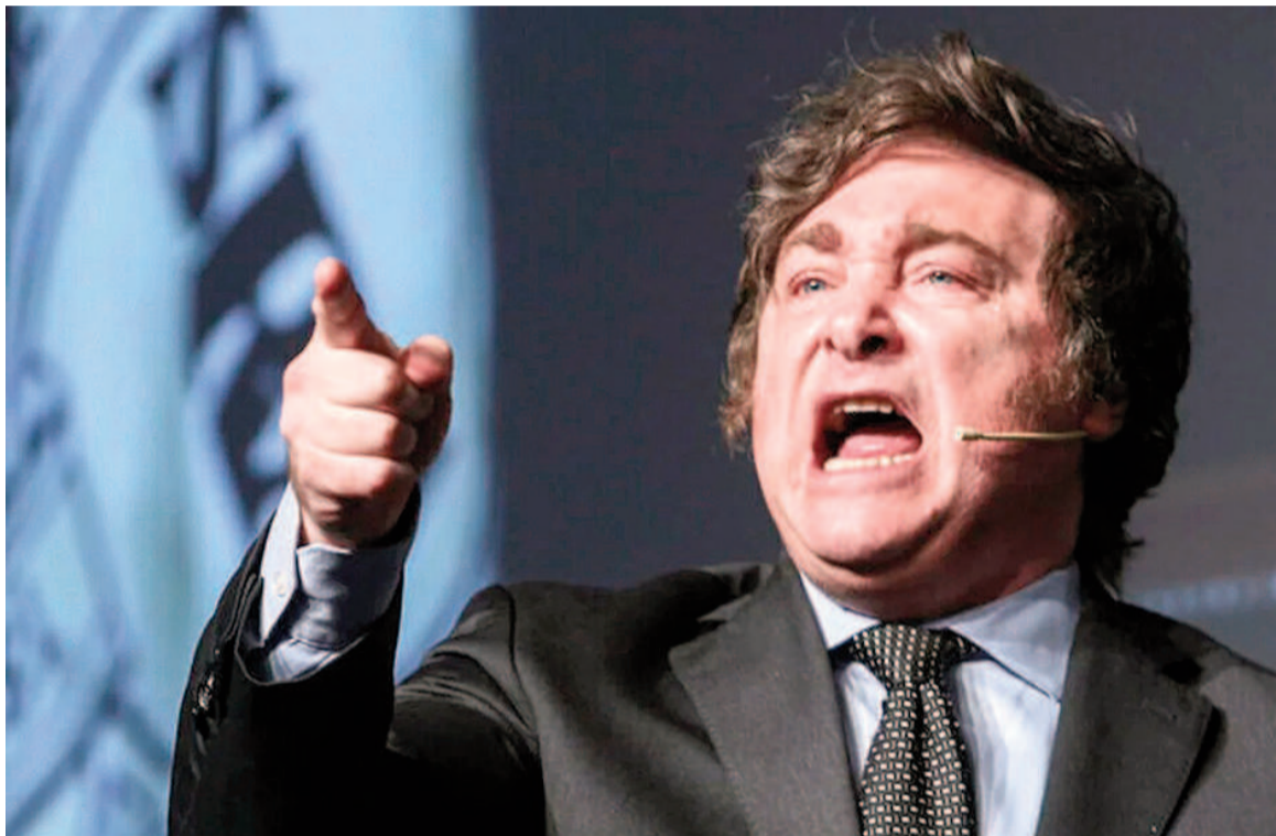
Aquellos que no acompañen el veto son genocidas”, espetó el Presidente.

En otro tramo de la entrevista, el Presidente criticó con dureza lo que llamó “demagogia” de la clase política: “Los políticos en el Senado votaron un aumento de casi tres puntos del