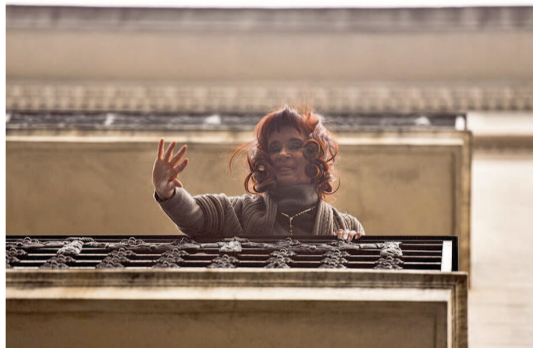
De CFK para Luis Caputo: "No le sale una".