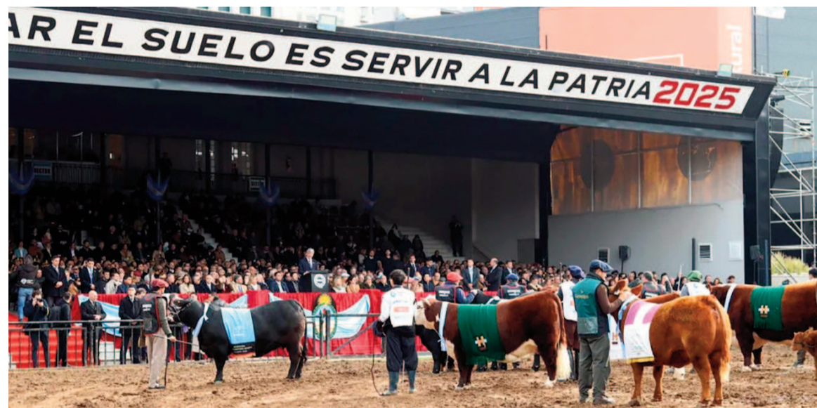
Nueva muestra rural.

Por su parte, Gustavo Idígoras, presidente de CIARA-CEC, también respaldó los anuncios de Milei en relación con la baja de retenciones al sector agropecuario. "Los anuncios del Presidente en el marco de la Exposición Rural de Palermo son auspiciosos, tanto en lo que respecta a medidas de facilitación, desregulación e incentivos, como en los derechos de exportación", expresó. Además, agregó: "La baja de reten-