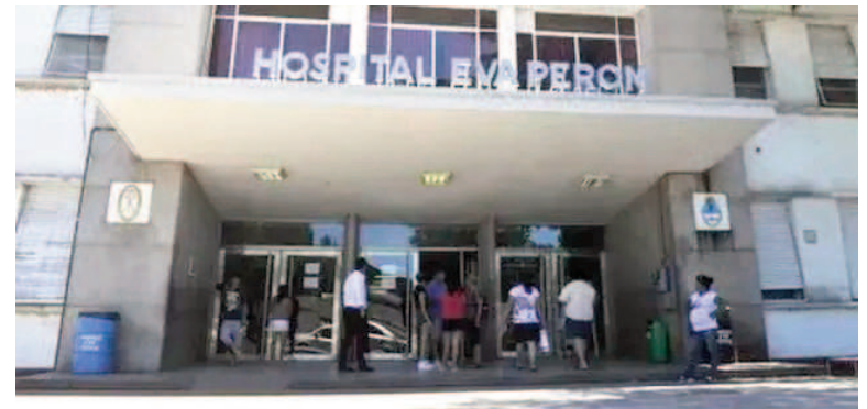
Hospital Eva Perón

La ciudad de Capitán Bermúdez fue escenario de otro homicidio cometido por un menor de edad. Se trata del hecho ocurrido el martes pasado en una casa ubicada en Yapeyú al 400 en el que la víctima y su asesino eran hermanos de apellido Arévalo.