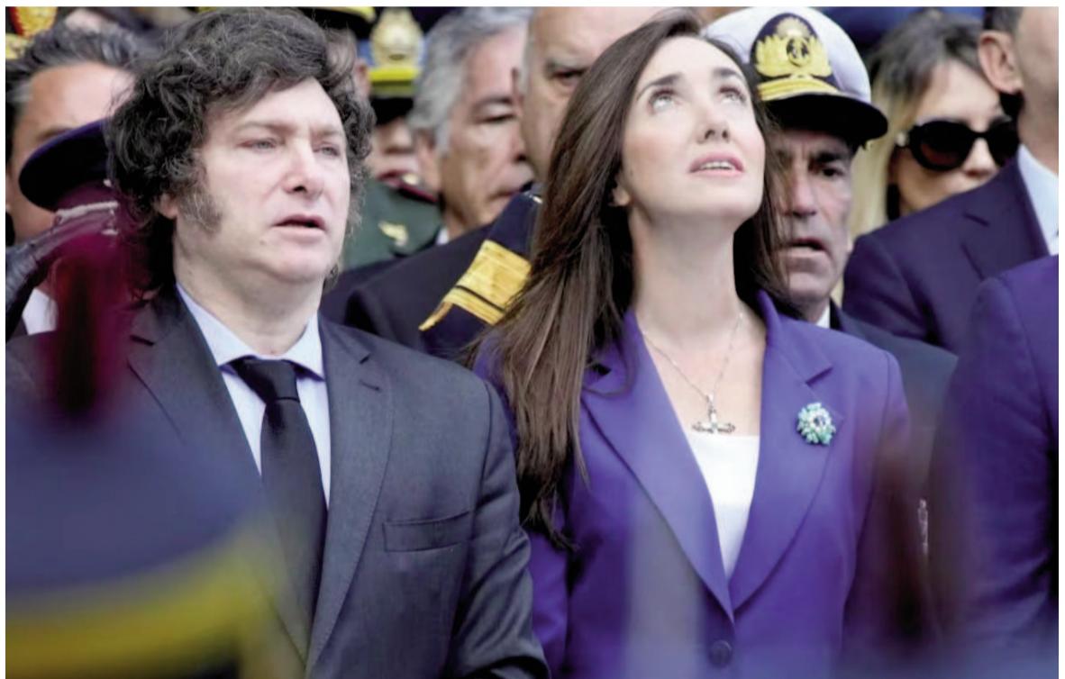
Crece la tensión entre el presidente Javier Milei y la vice Victoria Villarruel.

“El aumento señalado será incorporado al haber mensual siguiente, sobre el haber percibido en el mes de su sanción”, sostiene el dictamen aprobado en Diputados el 4 de junio. Es decir, que tras la