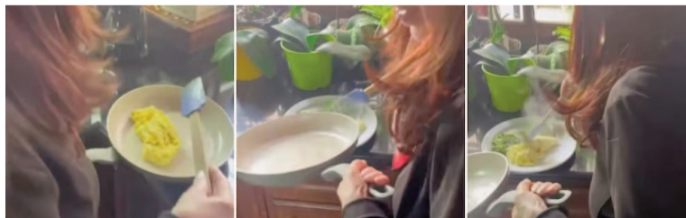
Cristina Kirchner aseguró que los huevos revueltos son “buenos para la salud” y que “con eso me alcanza y me sobra”.