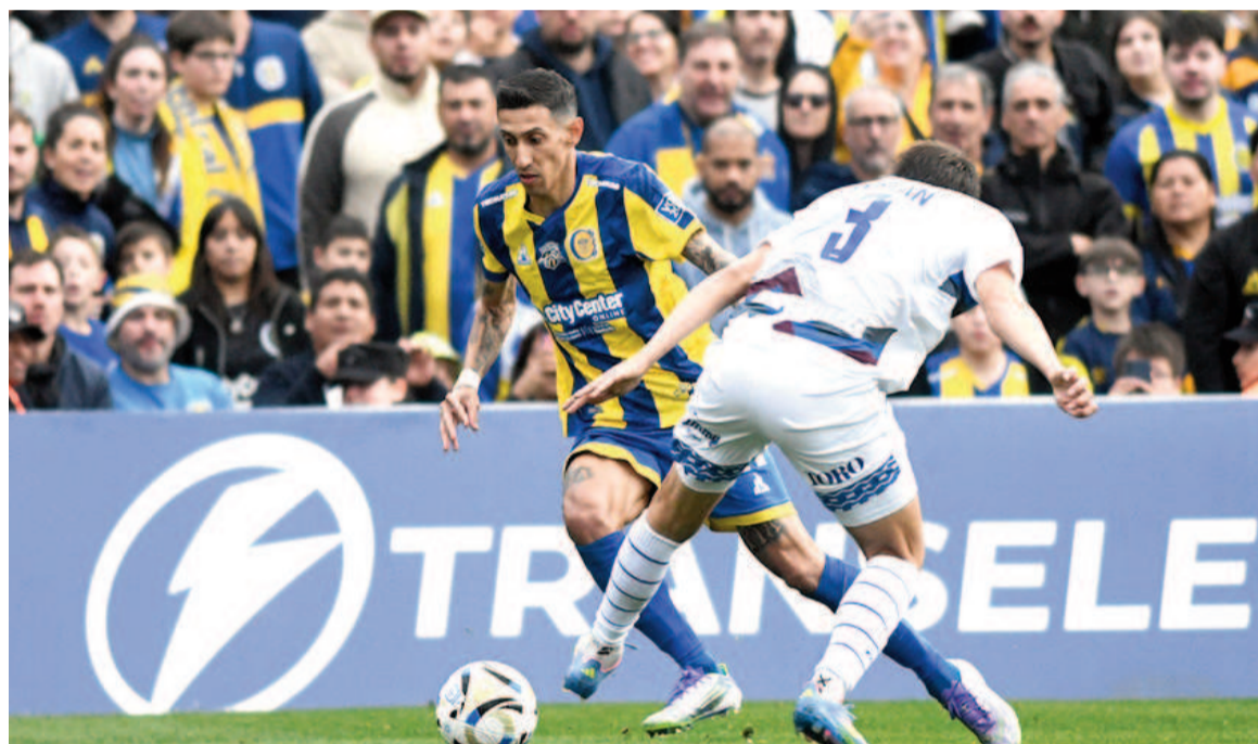
Ángel Di María anotó de penal en su regreso al club de sus amores.

Con gol de Di María en su regreso, el Canalla igualó 1 a 1 ante Godoy Cruz en el Gigante de Arroyito. El Tomba logró la agónica paridad por intermedio del uruguayo Vicente Poggi.