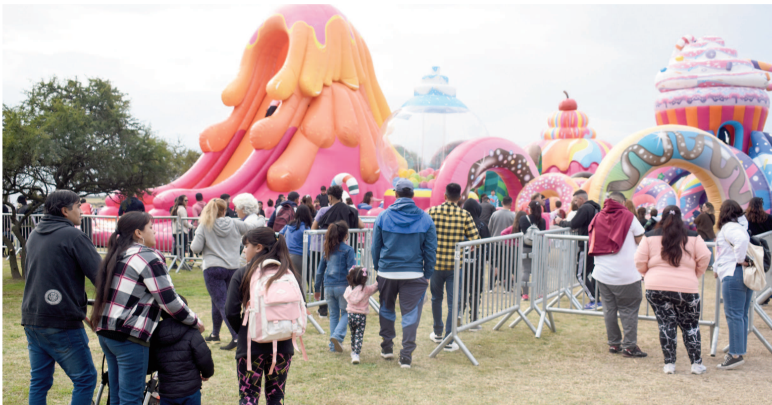
Los parques inflables son un gran foco de atención para los más pequeños, entre las variadas propuestas del Festival Río. IARA CERASIEL NORTE

público de pasajeros, desde ayer la línea 501 de colectivos modificó su recorrido para cubrir la zona del Yaguarón. La medida regirá hasta el domingo 10 de agosto inclusive, durante los días que dura el festival. El nuevo trayecto facilitará el acceso de los