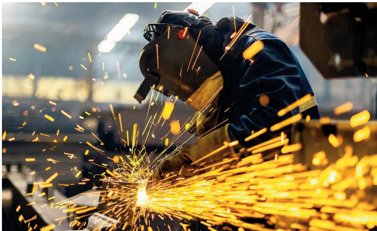
El acuerdo que la UOM firmó para la Rama 17 ahora deberá ser homologado por la Secretaría de Trabajo de la Nación.

En tal sentido, en la UOM pesa el antecedente más reciente. El Gobierno nacional, reacio a convalidar acuerdos que estén por encima del 1% mensual, demoró mucho más de lo esperado para convalidar el anterior entendimiento, que se firmó hacia mediados de enero y que la Secretaría de Trabajo recién homo-