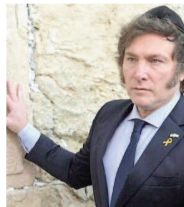
Milei en el muro de los lamentos, en un viaje anterior a Israel.

Durante su estadía en Jerusalén, Milei visitará sitios sagrados como el Muro de los Lamentos y el Santo Sepulcro y se reunirá con familiares de rehenes secuestrados por Hamas