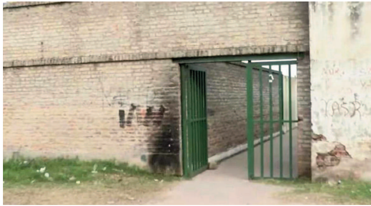
El jardín de infantes fue escenario del hecho.

últimas horas, el incidente sucedió el martes por la tarde cuando personal docente de la institución detectó que el chico había ingresado a la escuela con un revólver entre sus pertenencias. Ante esa situación, las autoridades de la institución pusieron en marcha el protocolo para estos casos. Es decir, se comunicaron con la policía y con el Ministerio de Educación de la provincia. Tras los primeros minutos de sorpresa, se comprobó que se trataba de un