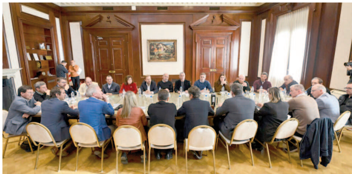
El gobernador sentó a varios intendentes a la mesa.

Los nuevos convenios firmados en el Salón de Acuerdos permitirán que los distritos accedan, a través