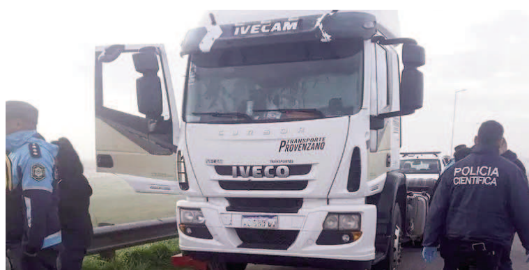
Misterio en Ruta 9.

Lo que sorprendió a los investigadores fue que no había señales de violencia asociadas a un robo. Dentro del vehículo se hallaron la billetera de la víctima con $240.000 en efectivo, documentación personal y del camión, y cajas con herramientas de trabajo, todas en perfecto estado. Otro detalle llamativo fue la ventanilla del acompañante, que estaba rota aparentemente por