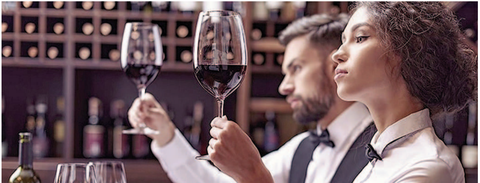
La sommellerie en Argentina conecta a productores y consumidores, impulsando la valoración de la diversidad vitivinícola nacional.

Claro que la sommellerie argentina ha evolucionado mucho desde 1999; se podría decir que al ritmo de la evolución de los vinos argentinos.