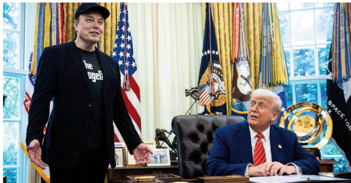
Tiempos felices que quedaron muy atrás.

Mientras se intensifica la disputa pública por el proyecto de ley de reducción de impuestos, el presidente de Estados Unidos dice que el CEO de Tesla debe "extrañar" trabajar con él.