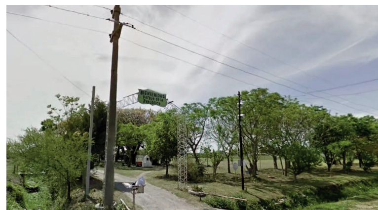
Proyectan hacer habitable el Parque de la República.

Con recursos locales y sin intermediarios, se crearán 207 lotes con servicios. El proyecto marca un cambio profundo en la política habitacional de la ciudad.