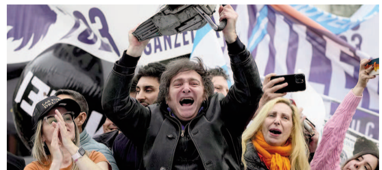
Desde el inicio del Gobierno de Milei, la reducción de personal ahorró al Estado USD 2.000 millones según cálculos oficiales

“SIGUE LA MOTOSIERRA. Recordemos que cada peso que ahorra el Estado es un peso menos de impuestos que pagamos los ciudadanos. Ya vamos por un ahorro anual de US$ 2.000 millones. Por