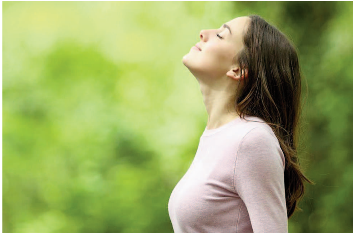
Practicar la observación consciente favorece una mayor calma y estabilidad emocional.

El doctor Andrew Budson, neurólogo de Harvard Medical School, contó en una entrevista con Harvard Health que esta iniciativa per-