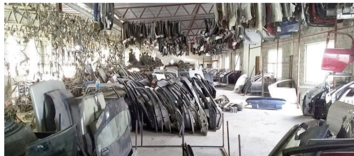
Una serie de autopartes de vehículos en un desarmadero.

La decisión impacta en el sector automotor, especialmente en los desarmaderos y comercios de autopartes usadas, que deberán adaptarse a los nuevos procedimientos digitales.