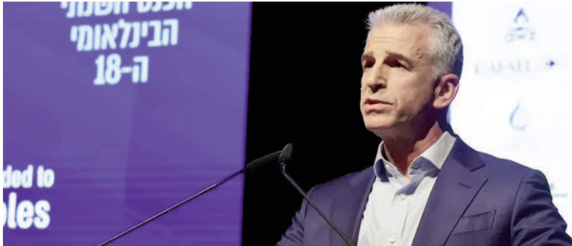
David Barnea, jefe del Mossad.

"Seguiremos vigilando de cerca todos los proyectos de Irán que ya conocemos a profundidad. Estaremos ahí como lo hemos estado hasta ahora", dijo David Barnea, jefe del Mossad.