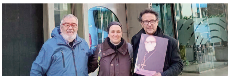
Instancia de entrega de la solicitud en la Cámara de Apelaciones de Rosario.