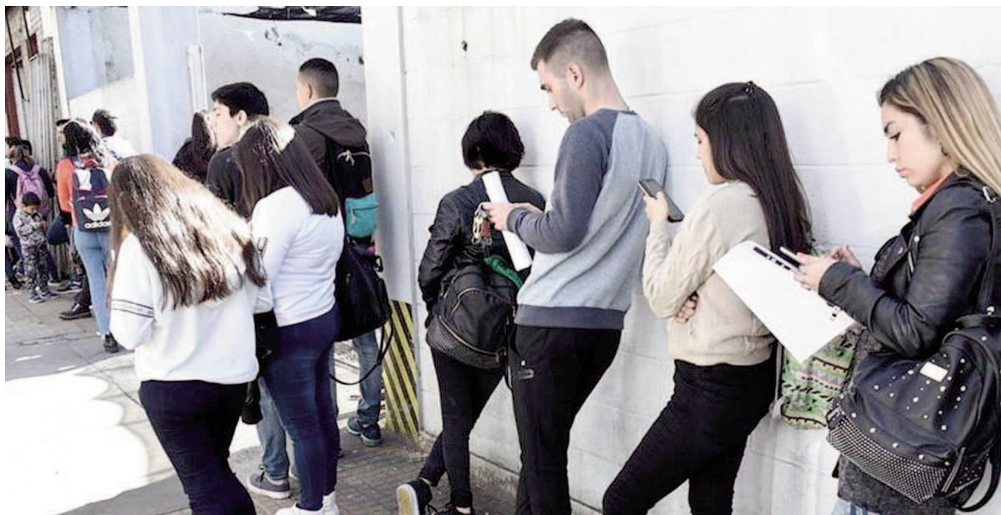
San Nicolás-Villa Constitución es uno de los 31 aglomerados urbanos de todo el país que el Indec releva a través de su Encuesta Permanente de Hogares.

Así lo informó el Indec en el reporte correspondiente al primer tramo de este año. En el aglomerado que integran San Nicolás y Villa Constitución, el registro de desocupación fue de 8,5% y marcó un crecimiento de 0,5 puntos porcentuales en relación con el trimestre anterior (8,0%), aunque con una baja de dos décimas en la comparativa interanual (8,7%).