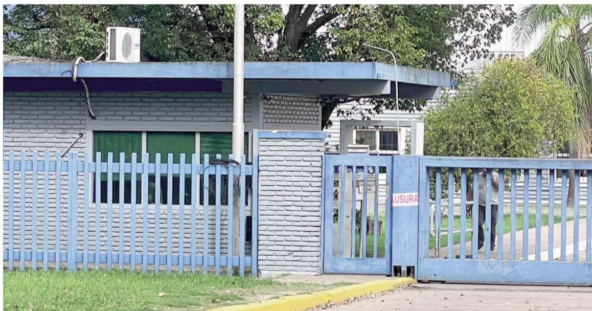
El fentanilo de uso medicinal contaminado con al menos dos bacterias fue producido por HLB Pharma y su elaborador Laboratorios Ramallo. EL NORTE

De acuerdo con los datos preliminares que recibió el Juzgado Federal en lo Penal y Criminal N° 3 de La Plata, “solo los lotes 31202 y 31244 de fentanilo HLB/citrato fentanilo, concentración 0,05 mg/ml, solución inyectable, ampollas por 5 ml, estarían contaminados” y que “casi todos los pacientes recibieron 31202”, ya que del segundo lote “se llegó a