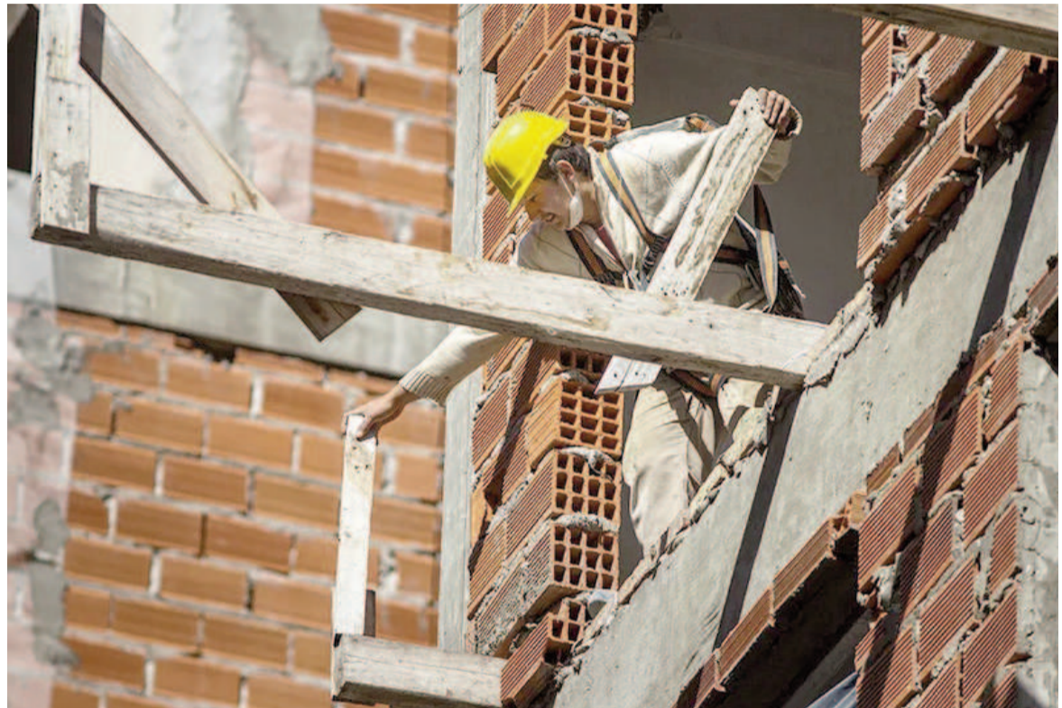
En lo que va de 2025, la venta de insumos para la construcción creció 10,5% interanual.

De esta forma se recortó la suba del acumulado anual a 11%, equi-