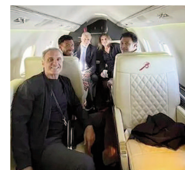
Caniggia, Tevez, Astrada y Ruggeri.

Por último, la Fiscalía también pidió oficios a Migraciones para confirmar los movimientos del exjugador y solicitó incorporar como prueba un video difundido por la Conmebol, donde se ve a Caniggia en el evento realizado en Paraguay.