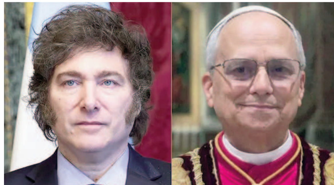
Javier Milei se reunirá, hoy sábado, con el papa León XIV.

El presidente argentino mantendrá su primer encuentro formal con el pontífice, en el marco de su gira internacional. Está previsto que ocurra a las nueve de la mañana (hora local, 4 de Argentina).