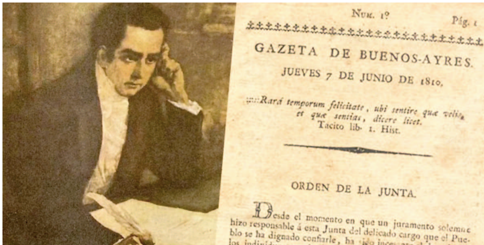
Fundada el 7 de junio de 1810, la Gazeta de Buenos Ayres nació para ser un órgano de difusión de las ideas de la Primera Junta de Gobierno.

Creó la biblioteca pública y el órgano oficial del gobierno revolucionario, La Gazeta, dirigido por el propio Moreno. Moreno encarnaba el ideario de los sectores que propiciaban algo más que un cambio administrativo. Se proponían cambios económicos