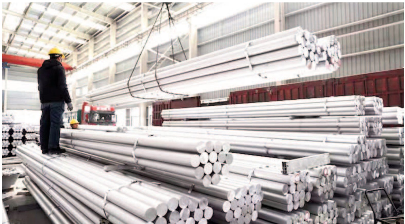
Siderúrgicos advirtieron que podría haber también un desvío de comercio, especialmente en mercados regionales.

En paralelo a las inquietudes empresarias, funcionarios del Ministerio de Economía y de la Secretaría de Comercio mantuvieron esta semana en Washington reuniones con el objetivo de iniciar una instancia formal