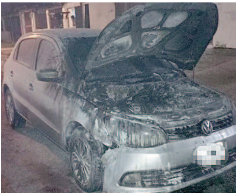
Uno de los autos incendiados esta semana de manera intencional.

El pasado miércoles hubo otros dos casos. Uno en Fraga al 3500, donde un Fiat Uno fue incendiado, según testimonios, por sospechosos que le tiraron una bomba molotov. Casualmente, en los asientos traseros del vehículo se halló el pico de vidrio de una botella.