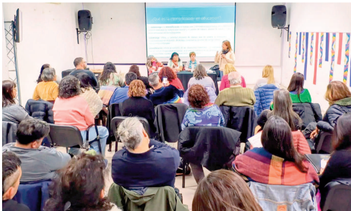
Docentes definen la agenda paritaria para la próxima reunión con la Provincia.

Este ámbito, definido como “permanente”, permite que los gremios con personería o inscripción parti-