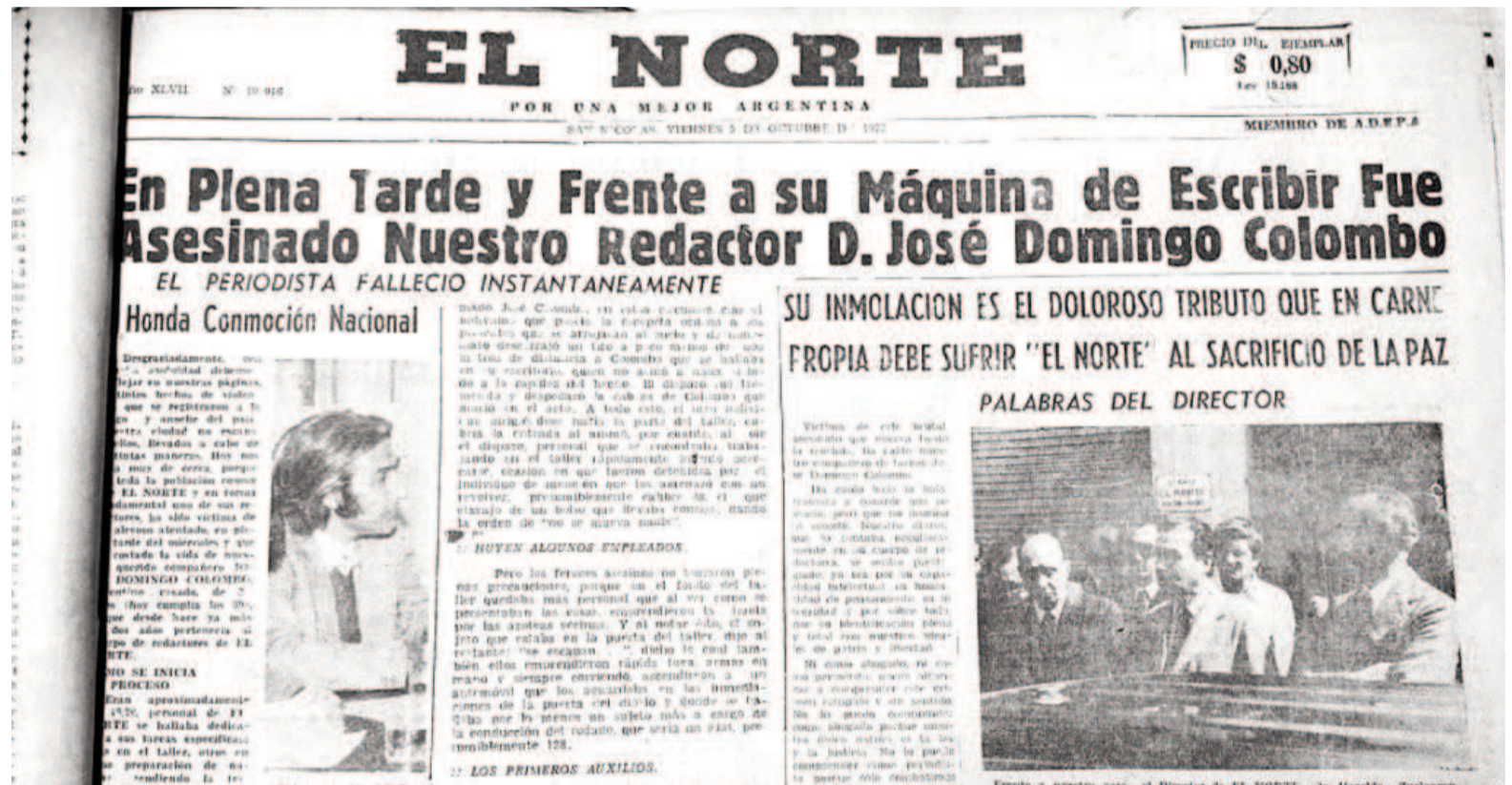
Así titulaba EL NORTE aquel 5 de octubre de 1973, tras el trágico hecho ocurrido a manos del terrorismo de Estado que terminó con la vida de José Colombo.

Dentro de los recordatorios, además de la presencia de una placa en la redacción del diario, Colombo fue declarado ciudadano ilustre del partido de San Nicolás el 26 de septiembre del año 2013, en el Honorable Concejo Deliberante por motivación de un grupo de colegas locales. Además, su nombre forma parte del registro del Monumento a las Víctimas del Terrorismo de Estado, en el Parque de la Memoria en la Ciudad Autónoma de Buenos Aires, que consigna 8.857 memoriales.