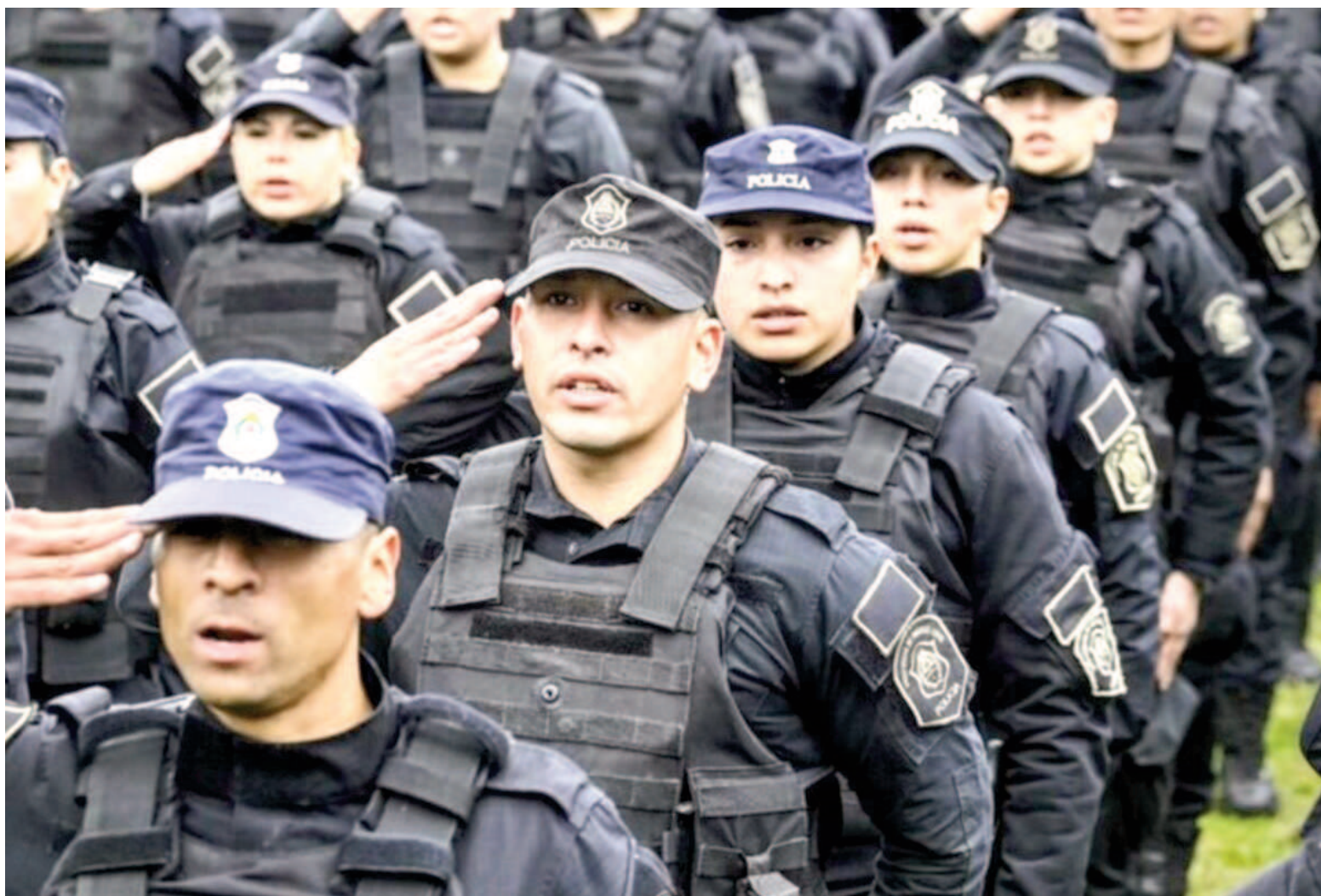
El Plan de Gobernanza en Seguridad que discute la Legislatura bonaerense puede convertirse en una herramienta clave para los municipios.

En ese momento, Passaglia remarcó que los municipios se enfren-