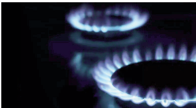
Vuelve a aumentar el gas.