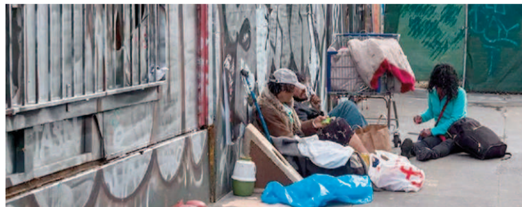
La pobreza en la Argentina se ubicó en 31,7% durante el primer trimestre de 2025.

Es importante aclarar que la información de Capital Humano no es la que suele utilizarse de manera oficial. El Indec publica los datos de estos indicadores sociales dos veces por año, con los datos del semestre anterior. El organismo estadístico había publicado en marzo que la tasa de pobreza había finalizado en 38,1% en el segundo semestre de 2024 y la primera mitad del año fue de 52,9 por ciento. El próximo dato oficial se dará a conocer en septiembre y será el correspondiente al primer semestre de 2025.