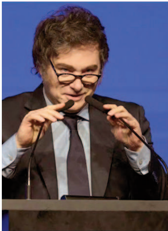
Milei lo criticó y Kicillof recogió el guante.

El Presidente cerró este jueves el Congreso de la Libertad en La Plata, en el que se expusieron las políticas que el partido busca implementar en la provincia de Buenos Aires. Lo hizo con fuertes críticas a Kicillof, a quien llamó “pichón de Stalin”. “Nunca se le pasó por la cabeza a este p... bajar el gasto público”, dijo.