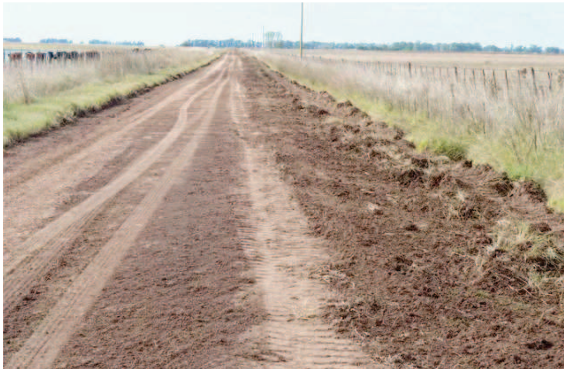
El aterrizaje clandestino de una avioneta y dos camionetas a toda velocidad levantaron sospechas en Sanford.

Fue el 3 de junio, cuando dos hombres fueron detenidos en los alrededores de un campo de Estación Díaz en el que había sido hallada una avio-