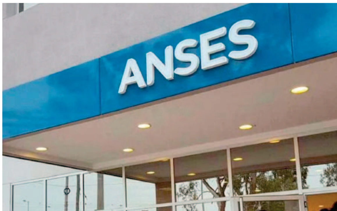
Los cambios estaban planificados, según lo dispuesto por el Decreto 274/24.

Además, en el tercer artículo de la resolución establecieron que "las bases imponibles mínima y máxima previstas en el primer párrafo del artículo 9° de la Ley N° 24.241 -texto según Ley N° 26.222- en la suma de $ 104.170,43 y $ 3.385.490,05 respectivamente, a partir del período