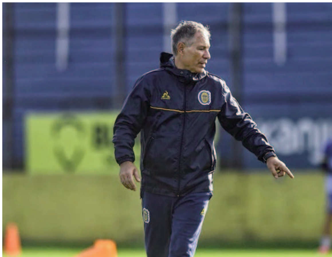
Central intentará avanzar a octavos de final ante el Tatengue.

Chocarán hoy desde las 13.00 en nuestra ciudad por los dieciseisavos de final. El conjunto canalla, que contará con el regreso de Di María en el segundo semestre, quiere ser protagonista de todo lo que juegue.