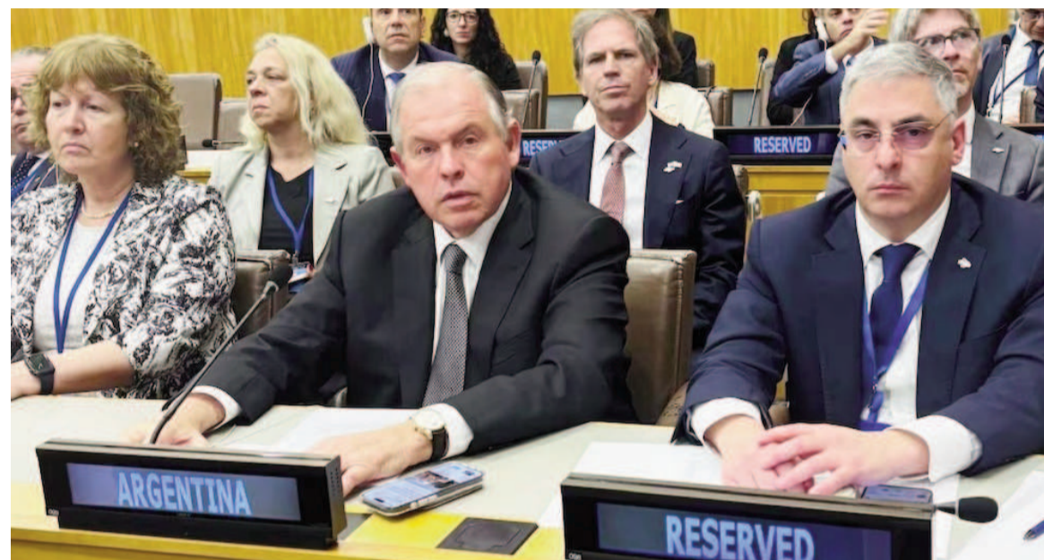
El canciller remarcó la necesidad de volver a abrir el diálogo con el Reino Unido.

La organización hemisférica instó al Reino Unido a retomar las negociaciones por la soberanía de las Islas. "En lugar de nacionalismo de pacotilla y berreta, el Gobierno responde con logros", dijo el Presidente.