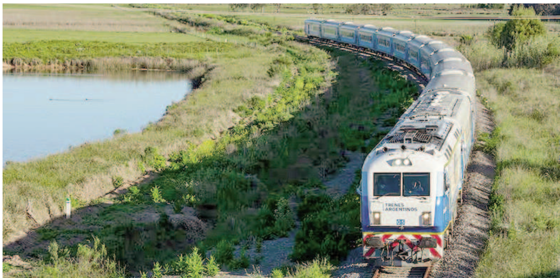
El viaje en tren requiere de una paciencia infinita. Hay tramos en los que el convoy marcha a 40 kilómetros por hora.

Quedó habilitada la venta de pasajes en tren durante los meses de julio y agosto, una opción que atrae puesto que es mucho más barato que hacerlo por otro medio. Pero que resulta esquivo para la mayoría debido a los tiempos del traslado. Viajar desde San Nicolás a Córdoba capital cuesta $13.300 en primera y $16.100 en pullman, y el trayecto se completa en 15 horas y 30 minutos, aproximadamente. El boleto desde esta ciudad a San Miguel de Tucumán tiene un costo de $30.700 y $36.800, según la clase. Y demora 27 horas y 30 minutos.