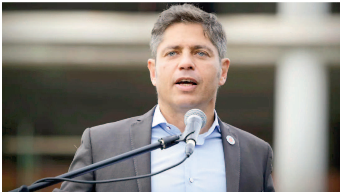
El gobernador de la provincia de Buenos Aires, Axel Kicillof.

El gobernador bonaerense también había cuestionado días atrás al Gobierno nacional durante un acto en Plaza de Mayo, donde se