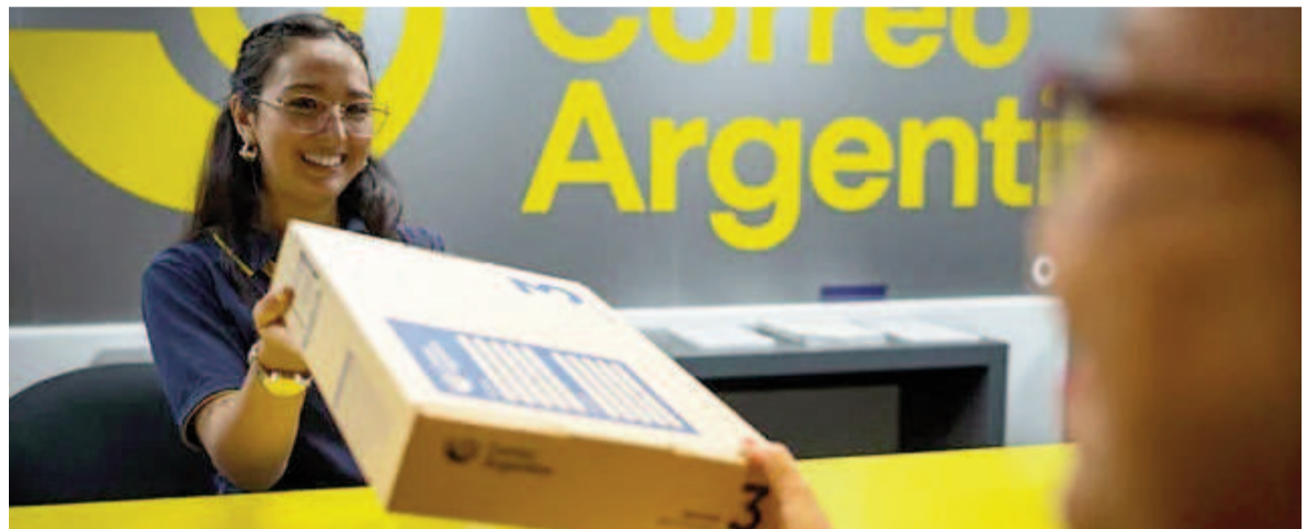
El Correo Argentino perteneció al Grupo Macri.