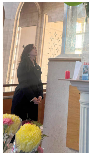
La vicepresidenta oró ante los pies de la Virgen.

Luego de su visita al Santuario, la vicepresidenta compartió una merienda con su entorno en un restaurante céntrico de nuestra ciudad.