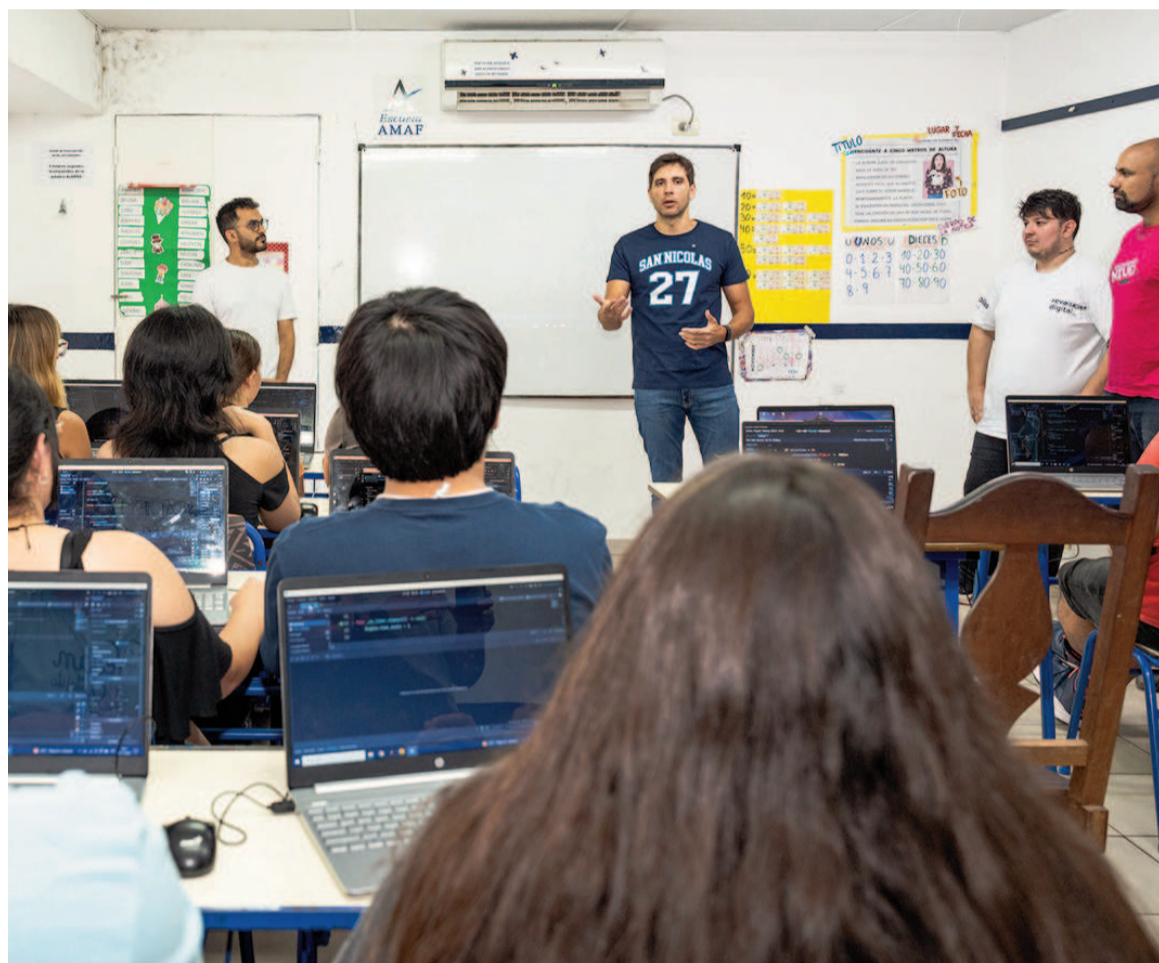
Vista del curso “Academia Siguiente Nivel” desarrollado el año pasado, con la presentación del intendente Santiago Passaglia.

La inscripción está abierta hasta el 23 de junio y debe ingresarse a