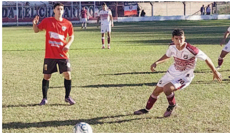
El equipo de Jaureguizar ganó y está entre los cuatro mejores.