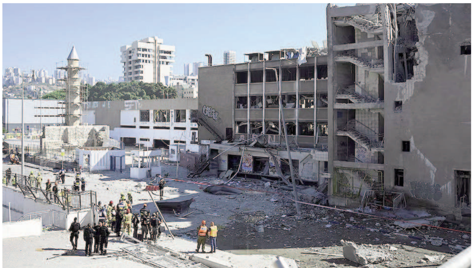
Misiles iraníes impactaron contra edificios israelíes.

No está claro de inmediato si Irán lanzó otra bomba de racimo en el ataque, que esparce municiones más pequeñas sobre un área amplia.