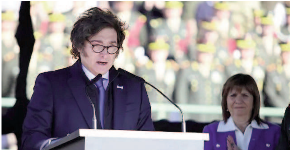
Javier Milei habla en el Campo de Polo por el Día de la Bandera.

Tras tomarle lealtad a la bandera a aspirantes y soldados, el primer mandatario pronunció un breve discurso. "Es un orgullo cumplir el rol de Presidente y comandante en jefe de las Fuerzas Armadas, por eso quiero agradecerles en nombre de toda la ciudadanía por la valiente decisión que tomaron al unirse a nuestras fuerzas. Esta decisión deberá ser honrada a diario en el ejercicio de sus funciones sabiendo que corren riesgo sus vidas por los ar-