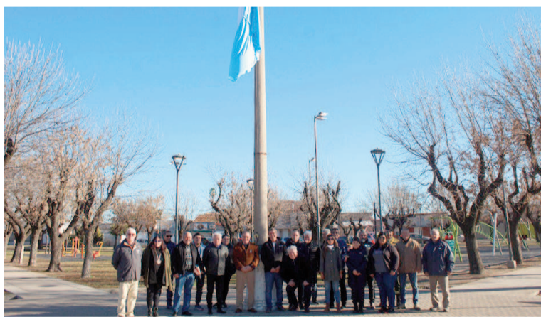
Los sanmartinianos honraron a Belgrano.