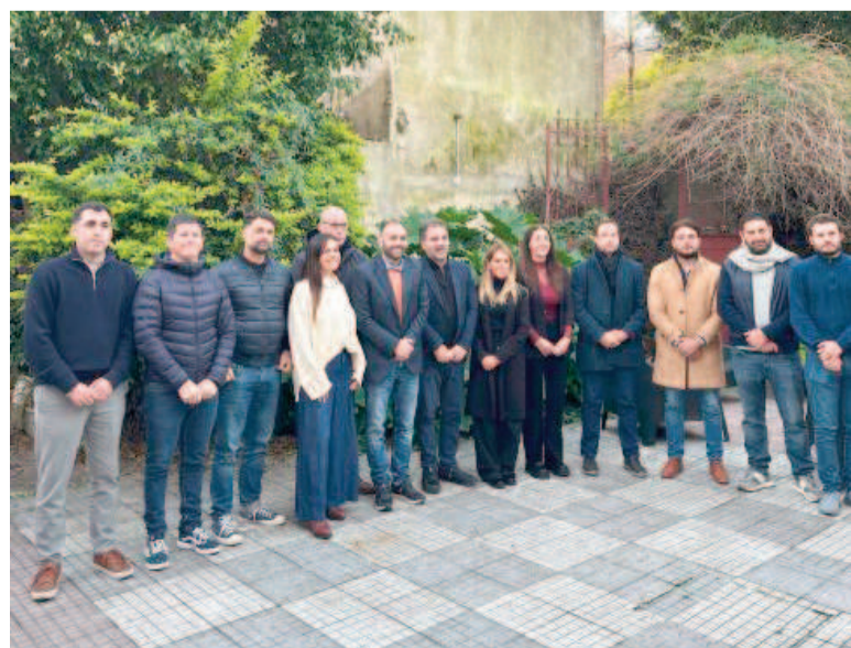
El presidente del PRO bonaerense mantuvo diferentes encuentros.

“Estamos en el buen camino y con la ratificación del presidente de este frente para nosotros es muy importante”, añadió el diputado nacional. Allí sostuvo que “hay que discutir qué provincia queremos y cómo la vamos a transformar”.