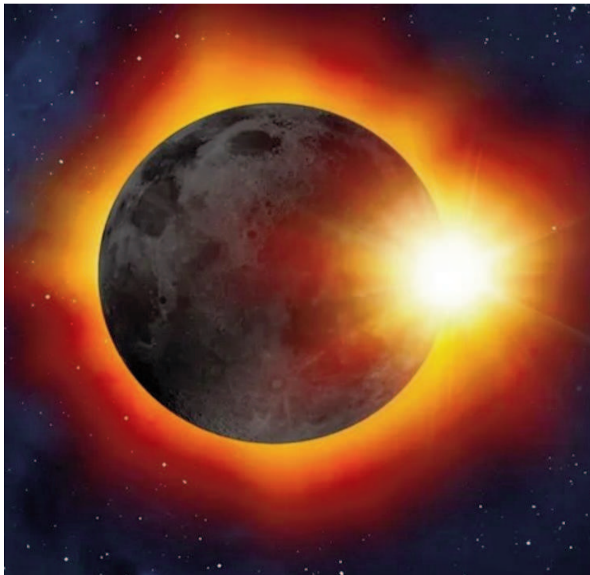
Con el telescopio se podrán observar planetas como Mercurio, Venus y Saturno durante el eclipse más largo del mundo.

En Argentina y en el hemisferio sur, la visualización será parcial, provocando un oscurecimiento que oscilará entre el 10% y el 90% del anillo solar, dependiendo de la ubicación específica.