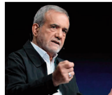
Masud Pezeshkian, mandatario iraní.

El presidente Masud Pezeshkian insistió en que su país no fabrica armas nucleares.