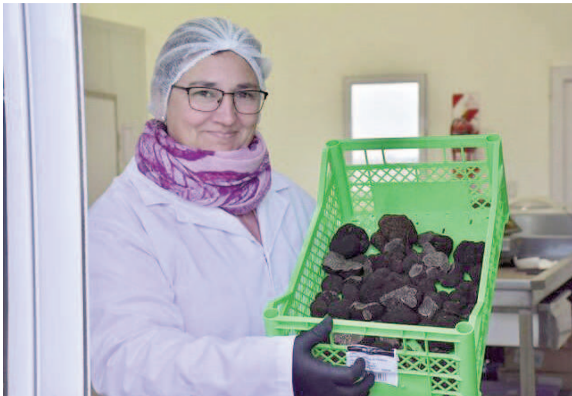
Las codiciadas trufas negras.