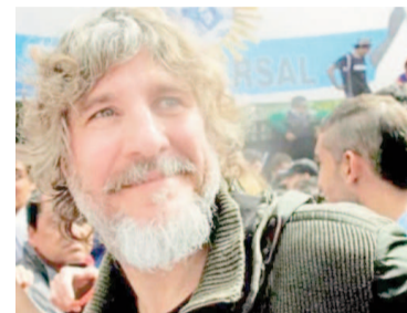
Exvicepresidente Amado Boudou.