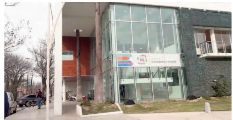
Mansilla fue derivado al Hospital Granaderos a Caballo donde falleció.

Cuando los efectivos de la Policía de San Lorenzo arribaron al sitio, hallaron a un hombre tendido en el suelo. En forma simultánea, también llegó un vecino conduciendo una camioneta Ford Ranger de color azul.