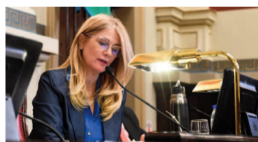
Vicegobernadora Verónica Magario.

El Senado bonaerense aprobó este martes las reelecciones indefinidas para legisladores, concejales y consejeros escolares en la provincia de Buenos Aires. Con 22 votos positivos, 22 negativos y una abstención, la vicegobernadora Verónica Magario tuvo que desempatar para darle media sanción al proyecto.