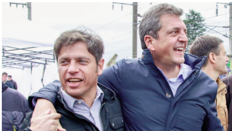
Kicillof y Massa podrían confluir en el sello "Peronismo".