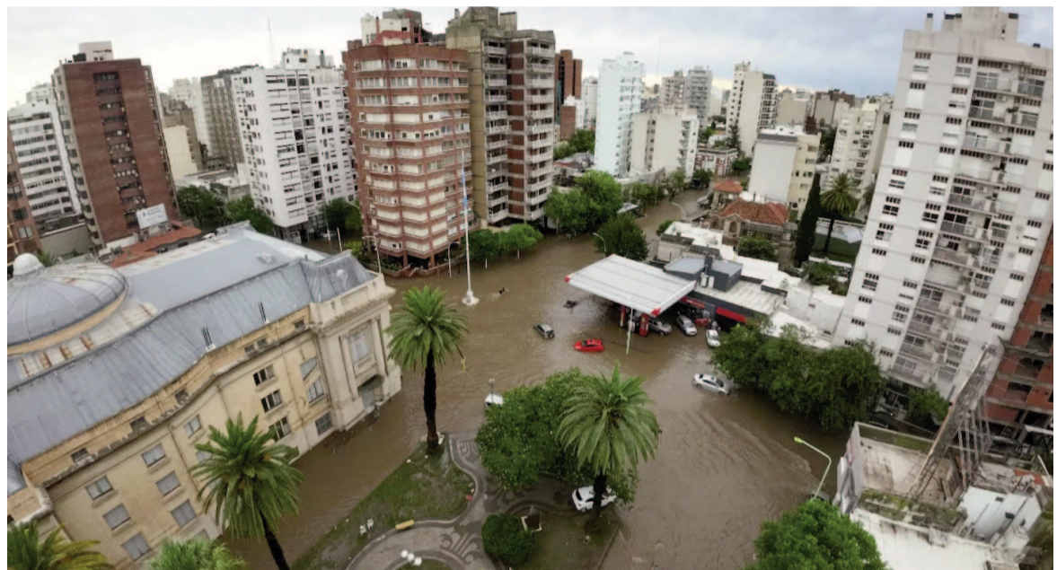
El centro de Bahía Blanca, inundado.

Dijeron asimismo que el Ejecutivo implementó un financiamiento para Bahía Blanca a través de un préstamo del Banco Interamericano de Desarrollo (BID), y que el Banco de la Nación ya tiene facultades para otorgar asistencia a las micro, pequeñas