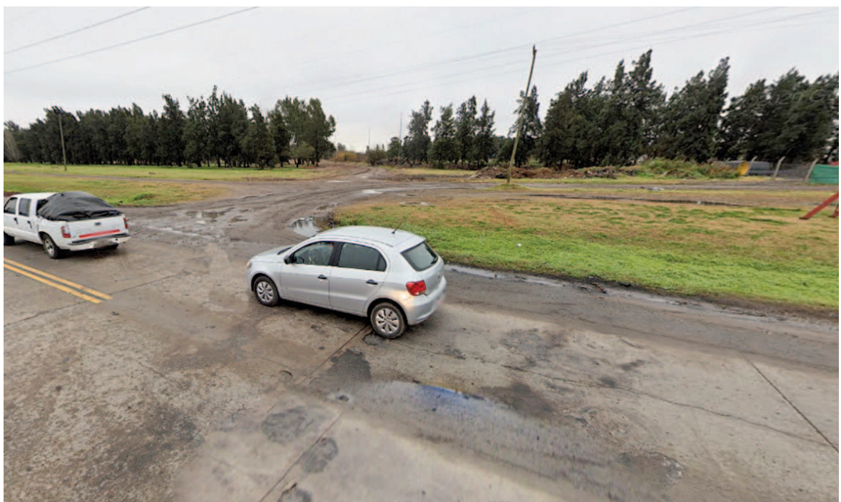
Zona en la que el joven fue baleado.

Se trata del homicidio 65 que se produce en el departamento Rosario en este 2025.