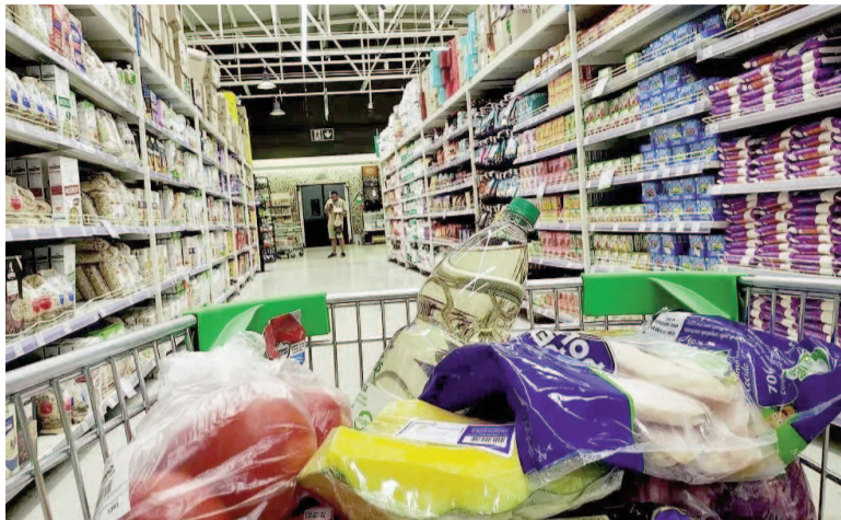
Inflación a la baja.

consultoras privadas apuntan a una fuerte caída en el ritmo de la suba de los precios y la ubican en torno a 2%. El Gobierno aspira a que en re-