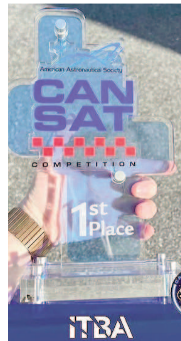
Argentinos se consagraron en la NASA.

El CanSat, un satélite de dimensiones similares a una lata de gaseosa, debía cumplir una misión simulada que replicara procesos reales de la industria aeroespacial. Equipado con cá-