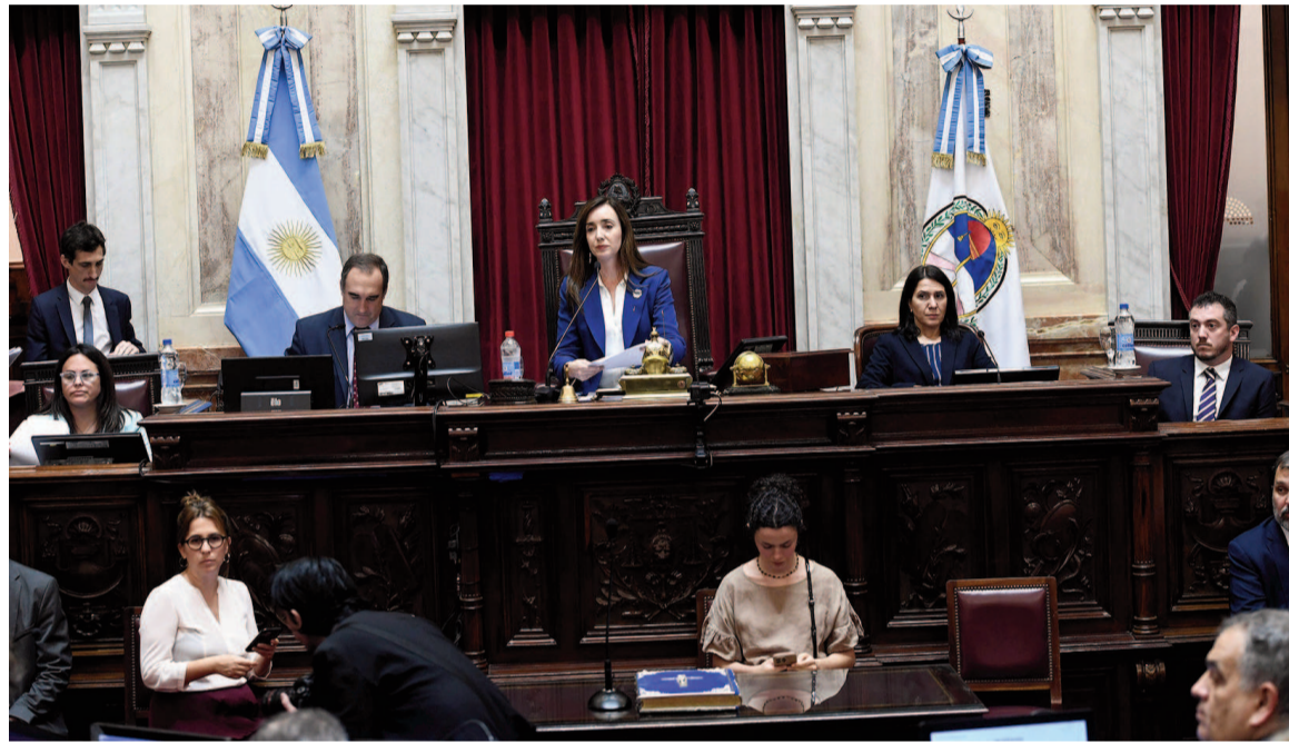
El Senado aprobaría y Milei vetaría.

El panorama no se presenta alentador para la prórroga por dos años de la moratoria previsional, también aprobada en la última sesión de Diputados. En este caso, el kirchnerismo quedaría en soledad con una iniciativa que bloques como la UCR y Pro