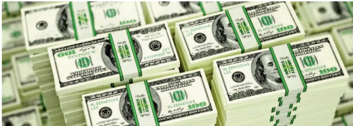
El Gobierno nacional tomó nuevos créditos para aumentar las reservas.

El Banco Central (BCRA) consiguió un crédito REPO con entidades privadas internacionales por US$ 2000 millones para fortalecer las reservas.