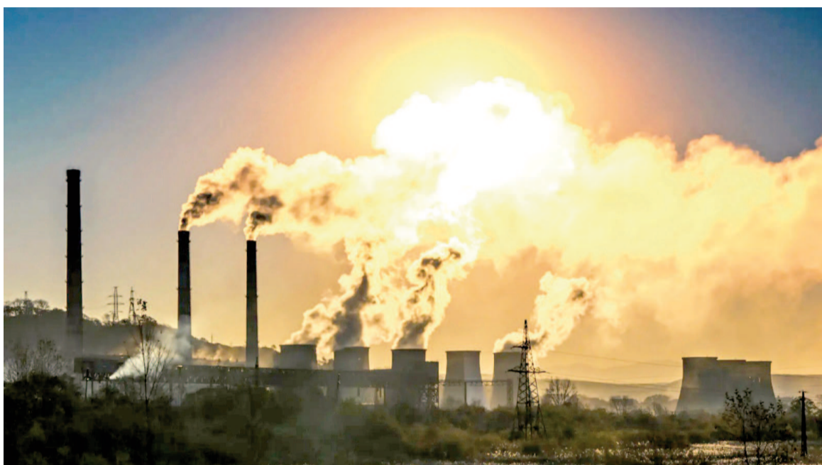
Las últimas mediciones del Observatorio Mauna Loa muestran un aumento sostenido del principal gas de efecto invernadero.

Los científicos advierten que, sin cambios drásticos, el CO 2 podría llegar a 500 ppm en los próximos 30 años. El Observatorio Mauna Loa en Hawái, reconocido mundialmente como punto de re-