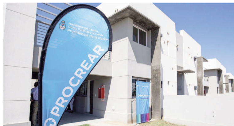
Se termina el plan Procrear.

En el caso de bienes inmuebles que no estén afectados a contratos de locación de obra vigentes, deberán ser transferidos a la Agencia de Administración de Bienes del Estado